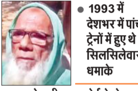
● 1993 में देशभर में पांच ट्रेनों में हुए थे सिलसिलेवार धमाके