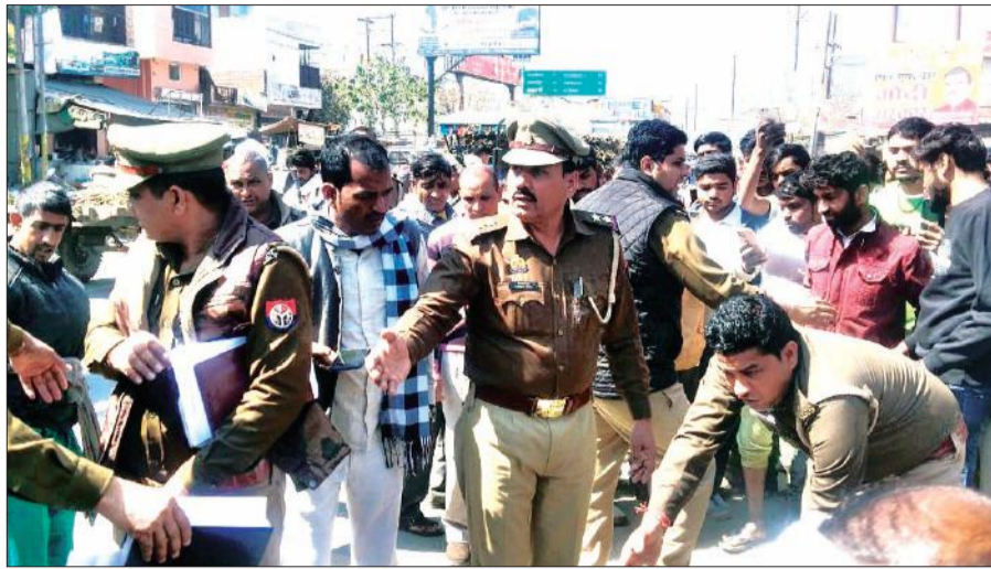
दुर्घटना के बाद मौके पर जमा भीड़ व पुलिस।