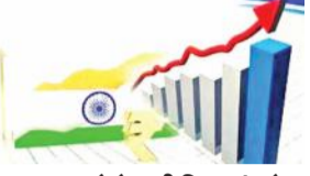
● एनएसओ ने जारी किए आंकड़े, समूचे वित्त वर्ष में 7.6 प्रतिशत रहने का अनुमान

देश की आर्थिक वृद्धि दर चालू वित्त वर्ष (2023-24) की तीसरी अक्टूबर-दिसंबर तिमाही में तेजी से बढ़कर 8.4 प्रतिशत हो गई, जिसमें विनिर्माण, खनन और निर्माण क्षेत्रों के बेहतर प्रदर्शन की अहम भूमिका रही है। आर्थिक वृद्धि का यह अनुमान जताए गए विभिन्न अनुमानों से कहीं अधिक है। आरबीआई ने तीसरी तिमाही में वृद्धि दर 6.5 प्रतिशत और पूरे वित्त वर्ष के लिए सात प्रतिशत रहने की संभावना जताई थी।