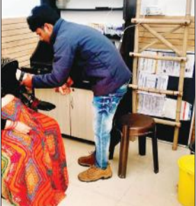
लैब पर जांच करता कर्मचारी।

क्षेत्र में कई अवैध पैथोलॉजी लैब संचालित हैं। स्वास्थ्य विभाग कभी कभार ही झोलाछापों और अकबरपुर निवासी एक व्यक्ति नगर में पैथोलॉजी पर जांच कराने के लिए आया था। लेकिन लैब पर चिकित्सक उपलब्ध न होने पर उसकी रिपोर्ट बनाकर दे दी गई। दर्जनों पैथोलॉजी लैब में कोई टेक्नीशियन नहीं है। वहां काम कर