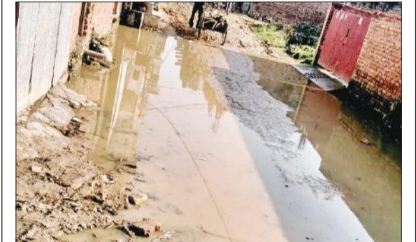
कांठ की आशियाना कॉलोनी में सड़क पर भरा पानी।