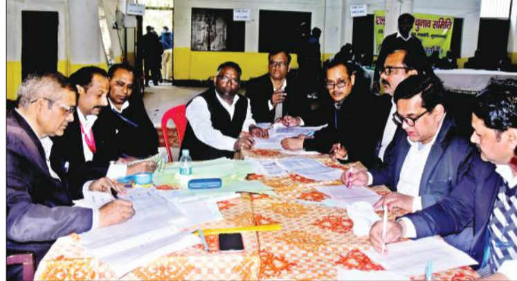
बार चुनाव में मत पत्रों की गिनती करते एल्डर कमेटी के पदाधिकारी।