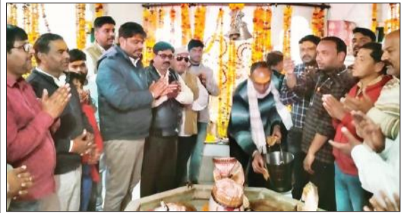
मंदिर के स्थापना दिवस पर पूजा अर्चना करते व्यापारी।