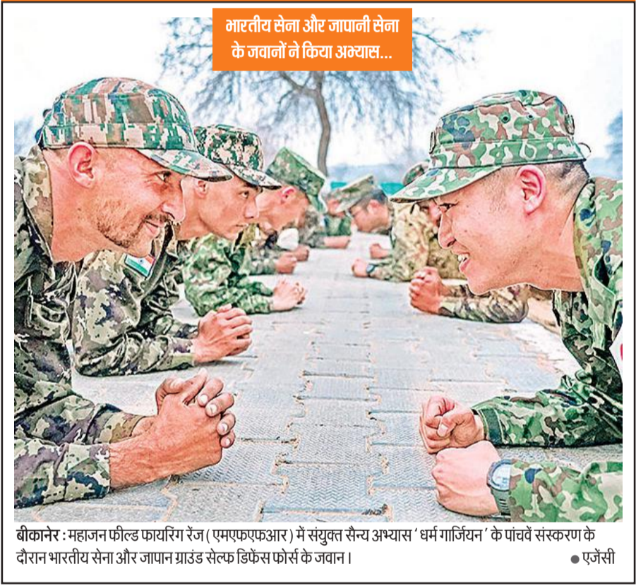
बीकानेर - महाजन फील्ड फायरिंग रेंज (एमएफएफआर) में संयुक्त सैन्य अभ्यास 'धर्म गार्जियन' के पांचवें संस्करण के दौरान भारतीय सेना और जापान ग्राउंड सेल्फ डिफेंस फोर्स के जवान।

तिरुवनंतपुरम। राष्ट्रपति द्रौपदी मुर्मू ने राज्य विधानसभा द्वारा पारित केरल लोकायुक्त विधेयक को मंजूरी दे दी है लेकिन उन्होंने तीन विश्वविद्यालय कानून विधेयकों पर अपनी स्वीकृति अभी नहीं दी है। राज्यपाल आरिफ मोहम्मद खान ने राष्ट्रपति को ये विधेयक उनकी स्वीकृति के लिए भेजे थे। राजभवन ने बृहस्पतिवार को एक बयान में कहा कि राष्ट्रपति ने केरल विश्वविद्यालय कानून (संशोधन संख्या 2) विधेयक 2022 पर अभी अपनी स्वीकृति नहीं दी है। बयान के अनुसार इसके अलावा विश्वविद्यालय कानून संशोधन विधेयक, 2022 और विश्वविद्यालय कानून संशोधन विधेयक, 2021 को भी राष्ट्रपति को मंजूरी नहीं मिली है। राष्ट्रपति को भेजे गए सात विधेयकों में से केवल एक विधेयक केरल लोकायुक्त संशोधन विधेयक, 2022 को सहमति दी गई है।