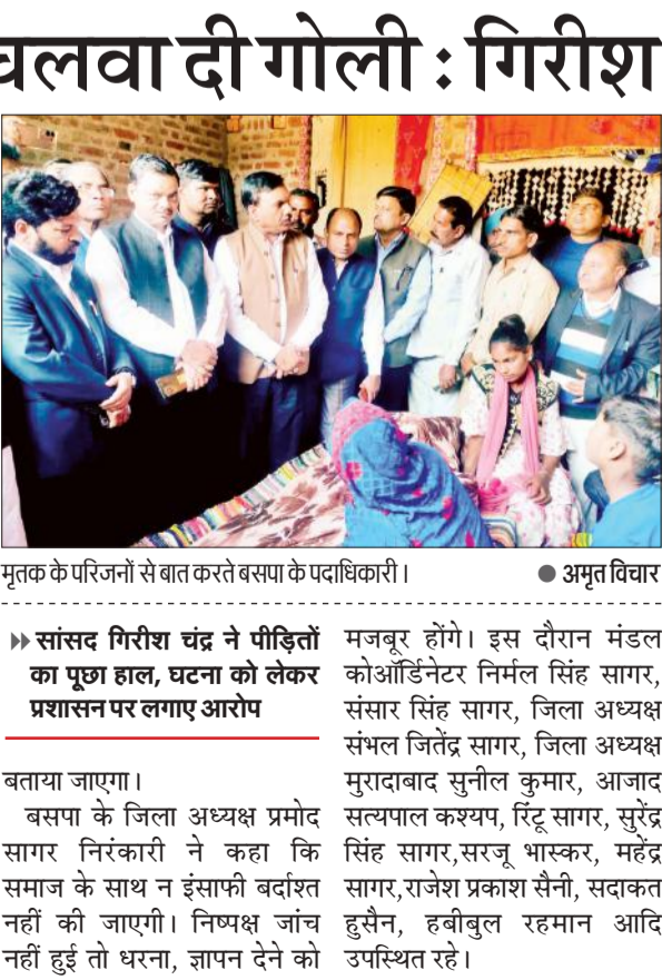
मृतक के परिजनों से बात करते बसपा के पदाधिकारी।