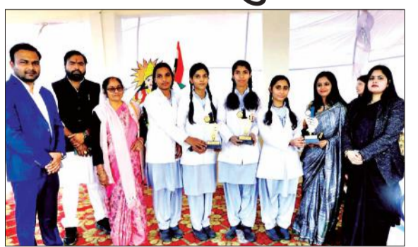
मैडल के साथ विजयी छात्राएं।