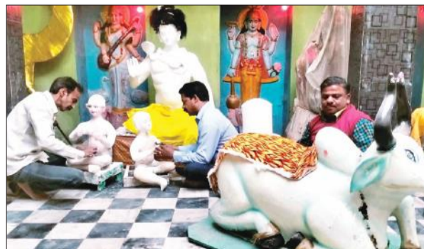
शोभायात्रा को लेकर झांकी तैयार करते समिति के सदस्य।