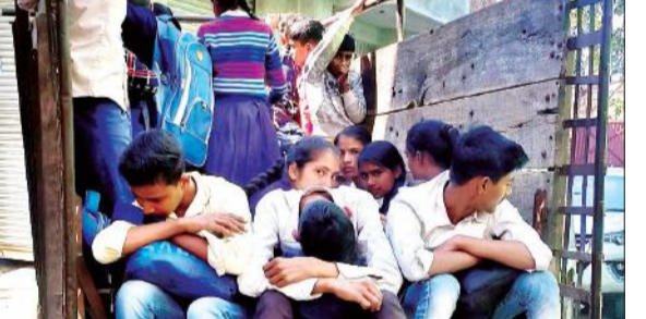
सैदनगली में जुगाड़ वाहन में बैठकर स्कूल जाते छात्र-छात्राएं।