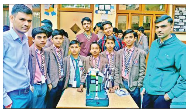
विज्ञान प्रदर्शनी में मॉडल के साथ छात्र।