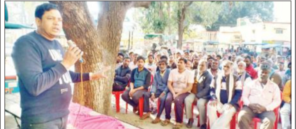
बैठक को संबोधित करते यूनियन के कोषाध्यक्ष।