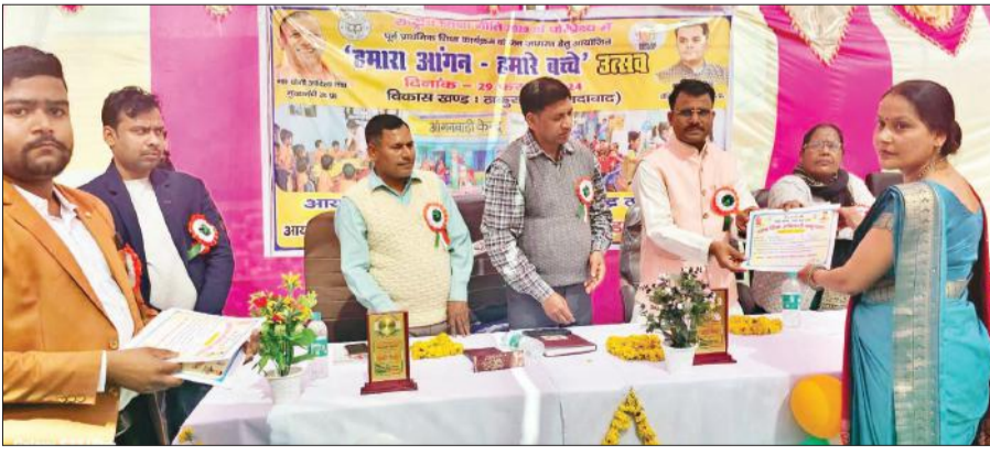
आंगनबाड़ी कार्यकर्ता को प्रशस्तित पत्र देकर सम्मानित करते ब्लॉक प्रमुख व खंड शिक्षाधिकारी।