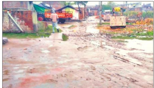
कुकरा के वार्ड तीन का जर्जर मार्ग।