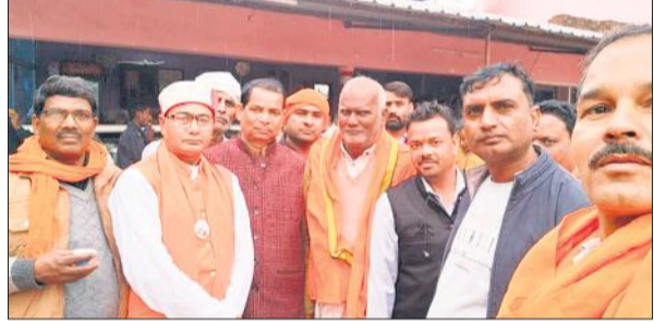
अयोध्या रवाना होते भाजपा कार्यकर्ता।