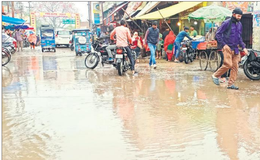
संकटा देवी रोड पर भरा बारिश का पानी।