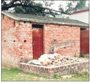
बिजुआ में अधूरा पड़ा माँडल शौचालय।

विकास खंड बिजुआ के उच्च प्राथमिक विद्यालय बिजुआ में माँडल शौचालय बनाने, साज-सज्जा के लिए ग्राम पंचायत द्वारा लाखों रुपये की धनराशि खर्च की गई। इसके बाद भी शौचालय निर्माण कार्य पांच साल बाद भी आज तक