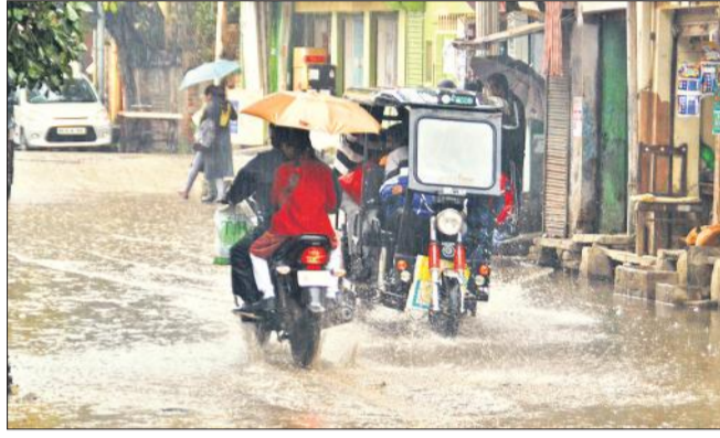
शहर की मधुवन कॉलोनी के बाहर सड़क पर भरा बारिश का पानी।

बेमौसम बारिश होने के साथ तेज हवा चलने से खेतों में खड़ी फसलों को नुकसान हो सकता है। बीसलपुर, बिलसंडा, पूरनपुर और अमरिया क्षेत्र में कई स्थानों पर गेहूं के साथ सरसों की फसल खेतों बिछ गई। जिससे फसलों को नुकसान हो सका है। किसानों का कहना है कि बीते