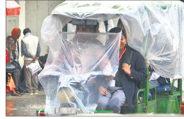
शनिवार को बारिश के दौरान ई-रिक्शा में पॉलिथीन ओढ़कर स्कूल जाते बच्चे।