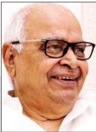
हृदय नारायण दीक्षित पूर्व विधानसभा अध्यक्ष उ.प्र.

आयुर्वेद आयु का विज्ञान है। यह चिकित्सा विज्ञान होने के साथ स्वस्थ रहने की जीवनशैली भी है। चरक संहिता आयुर्वेद का प्रतिष्ठित ग्रंथ है। संहिता की शुरुआत जीवन सूत्रों से होती है। बताते हैं कि “यहां बताए गए स्वस्थ व्रत का पालन करने वाले 100 वर्ष की स्वस्थ आयु पाते हैं।”