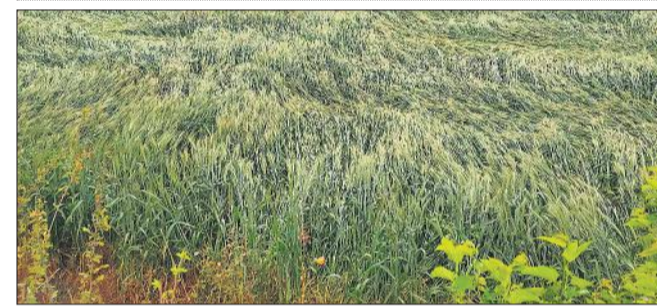
बारिश के साथ तेज हवा चलने से खेत में गिरी गेहूं की फसल।