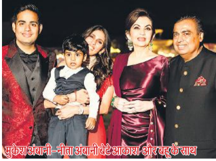
मुकुंदा अंबानी-नीता अंबानी, वैटिआकारा और बहू के साथ