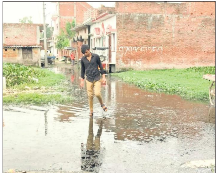
मोहल्ला गुट्ट्याबाग में भरा बरसात का पानी।