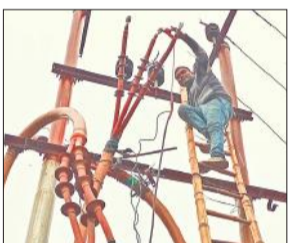
राजापुर मंडी के पास में लाइन में फाल्ट ठीक करता विद्युत कर्मी।

कार्यालय संवाददाता, लखीमपुर खीरी अमृत विचार : शनिवार सुबह 33 केवीए की मेन विद्युत लाइन में अचानक फाल्ट आ गया। इससे कलेक्ट्रेट पावर हाउस से जुड़े एक दर्जन से अधिक मोहल्लों की बिजली गुल हो गई। बारिश के बीच लाइन में फाल्ट तलाश करने में कर्मचारियों का पसीना छूट गया। दोपहर बाद मिली गड़बड़ी को दुरुस्त करने के बाद शाम करीब पांच बजे बिजली आपूर्ति बहाल हुई तब जाकर विद्यु कर्मचारियों से लेकर उपभोक्ताओं ने राहत की सांस ली। शनिवार को लोगों की सुबह बिना बिजली के हुई। मेन लाइन में फाल्ट आने से शहर के शहपुरा