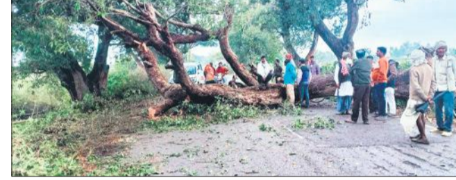
माधोटांडा-पूरनपुर रोड पर बारिश में गिरा पेड़ काटकर हटाते ग्रामीण।

पेड़ गिरने से जाम लग गया। ग्रामीणों ने पेड़ काटकर रास्ता साफ किया।