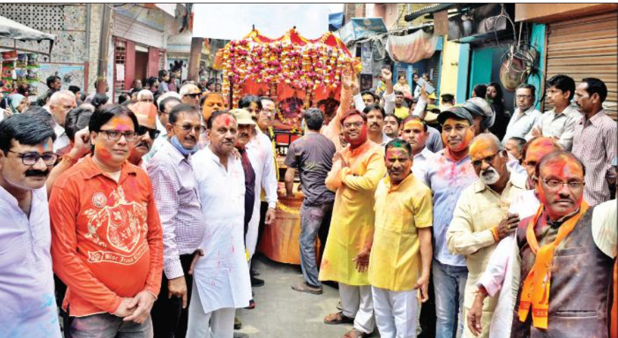
रामडोल शोभायात्रा में उपस्थित कमेटी के पदाधिकारी।

रविवार को डिप्टी जगन्नाथ सिंह मंदिर कटघर से 1030 साल पुरानी श्रीरामडोल शोभायात्रा निकाली गई। शोभायात्रा में श्रीराम दरबार शोभा का केंद्र बना रहा। साथ ही श्रीराधा-कृष्ण की झांकी, शिव परिवार झांकी, राम दरबार झांकी ने सुंदरता ने मन मोह लिया। शोभायात्रा कटघर महबुल्लागंज से होती हुई होली मैदान, गाड़ीखाने, विरसा हाजरी होते हुए श्रीराम