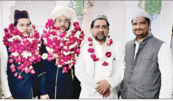
घेर जिया उन नबी खां में हाफिजों की गुलपोशी की गई।