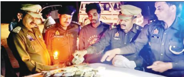
बरामद रकम की गिनती करती पुलिस।