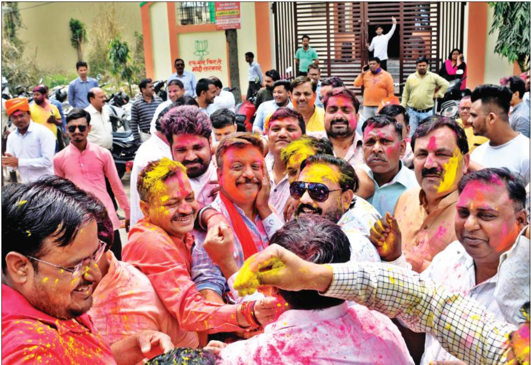
भाजपा के जिला कार्यालय पर होली उत्सव मनाते पदाधिकारी व कार्यकर्ता।