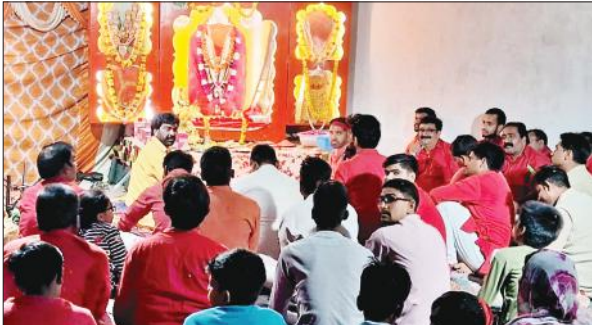
मिलक में श्रीबालाजी दरबार में कीर्तन करते भक्त।