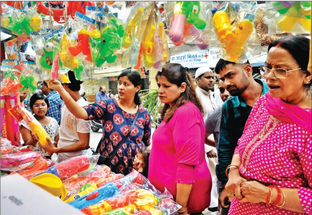
ताड़ीखाना स्थित दुकान से होली को लेकर खरीदारी करती महिलाएं।