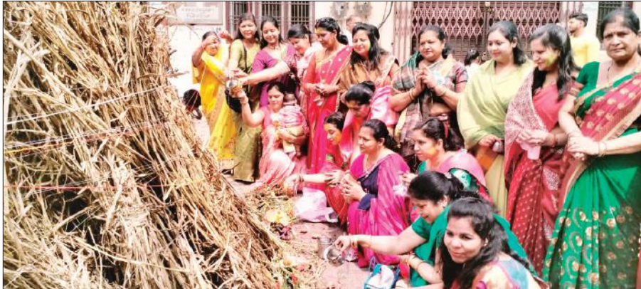
चन्दौसी में पुरानी पैट बड़ी होलिका पर पूजन करती महिलाएं।