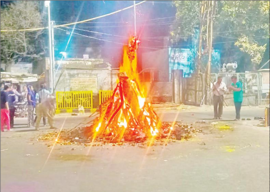
सिविल लाइंस चौराहे पर होलिका दहन करते लोग।

अमृत विचार : रविवार रात रंगोत्सव का आरंभ होलिका दहन के साथ हुआ। फाल्गुन शुक्ल पक्ष की पूर्णिमा की रात शुभ मुहूर्त में होलिका दहन हुआ। होलिका दहन से पहले लोगों ने विधि विधान से पूजा की। इसके बाद रंग-गुलाल लगाया और त्योहार की शुभकामनाएं दीं। युवाओं की टोली देर रात तक होली के गीतों पर थिरकती रही। मंडल में कुल 7020 स्थानों पर ढोल नगाड़ों के साथ होलिका दहन किया गया। सोमवार को रंगों की होली खेली जाएगी। रविवार को सुबह से ही होली का उल्लास लोगों के सिर चढ़कर बोलने लगा। सुबह लोगों ने होली खेली तो शाम को होलिका दहन किया। होलिका दहन का शुभ मुहूर्त 24 मार्च की रात 11 बजकर 13 मिनट से रात 12 बजकर 21 मिनट तक रहा। महानगर में बुद्धि विहार, आशियाना, दीनदयाल नगर, खुशहालपुर, कटघर समेत विभिन्न स्थानों पर होलिका दहन हुआ। जबकि जनपद में 1529 स्थानों पर होलिका दहन कर बुराई पर सच्चाई की जोत का जश्न मनाया। इससे पहले दिनभर रंगों का उल्लास रहा। दोपहर बाद से शाम तक होलिका