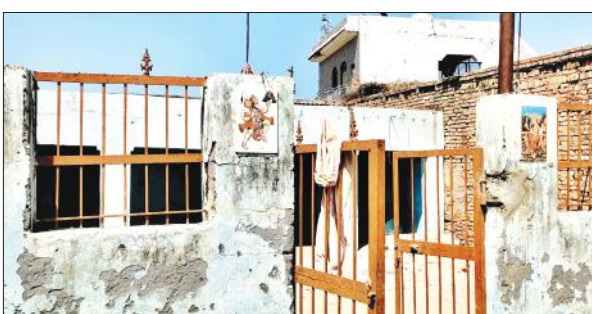
सौंधन गांव में स्थित बाबरे बाबा का मंदिर।

ग्राम पंचायत सौंधन मोहम्मदपुर में मुहल्ला घोसीपुरा में स्थित दिवाले वाले बाबरे बाबा का मंदिर पर होली दहन के बाद से दो दिवसीय मेला शुरू होता है। यहां उत्तर प्रदेश के अलावा दिल्ली, राजस्थान, मुंबई,