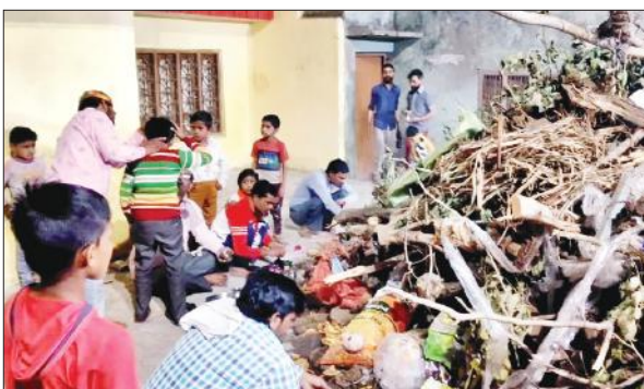
रविवार की शाम होलिका पूजन करते लोग।

होली के मौके पर रविवार को देर शाम मुहल्ला कोट पूर्वी स्थित गौरी सहाय मंदिर से गुलाल चौपाई का जुलूस शुरू हुआ। जुलूस डाकखाना रोड, टंडन निवाहा, कोतखाली, मुहल्ला ठेर, बाजार गंज, नखासा तिराहा से धोबियों की गली, छंगाफल की कोठी, मुधलिका के बराबर से सुनारों वाली गली, शिव मंदिर पर पहुंचकर समाप्त हुआ। जुलूस में युवाओं और लोगों ने एक-दूसरे