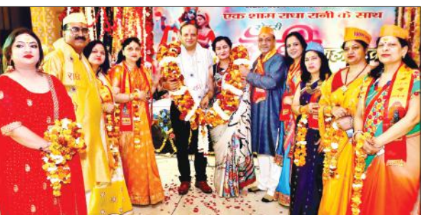
रोटरी क्लब सिटी स्टार के कार्यक्रम में अतिथियों का स्वागत करते पदाधिकारी।