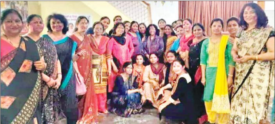
एनकेबीएमजी कॉलेज में होली पर काव्य गोष्ठी में शामिल प्राचार्या व स्टाफ।

आजाद रोड समेत अन्य स्थानों पर होलिका दहन किया गया। परिवार जनो ने होलिका में गन्ने भून कर परंपरा का निर्वाह किया और होलिका से अग्नि घर ले जाकर घर के आंगन में होलिका दहन किया। एक दूसरे को अबीर गुलाल लगा कर गले मिल कर होली की शुभकामनाएं दीं।