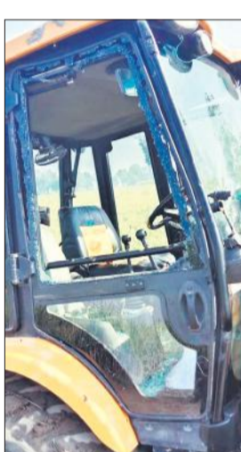
जेसीबी का टूटा शीशा।

अमृत विचार: अमीरनगर चौकी क्षेत्र के ग्राम रजवापुर में लोक निर्माण विभाग द्वारा बनावई जा रही सड़क निर्माण के लिए खेत में हो रही खोदाई को खेत मालिक ने रुकवा दिया। इसको लेकर विवाद हो गया और मारपीट व तोड़फोड़ होने लगी। इससे जेसीबी का शीशा टूट गया। ड्राइवर और हेल्पर घायल हो गये। रजवापुर से बम्बू मार्ग के लिए ठेकेदार खेतों से मिट्टी निकाल कर साइड पट्टाई का कार्य करा रहा था। इसकी जानकारी जब खेत मालिक को हुई तो वे मौके पर पहुंचे और खेत से मिट्टी निकालने को मना किया। विवाद के बाद जेसीबी मालिक और खेत स्वामी के बीच मारपीट होने लगी। जेसीबी में भी तोड़फोड़ की गई।