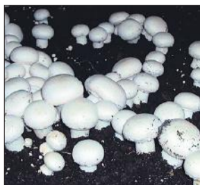
उगाई जा रही मशरूम की फसल (फाइल फोटो)

प्रशिक्षण पूरा होने के बाद गांव में ही सिलाई का सेंटर खोलकर खुद को आत्मनिर्भर बनाने