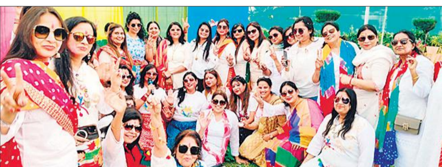
होलिकोत्सव में रंग-खेलकर मस्ती करती युनिटी संस्था की महिलाएं।