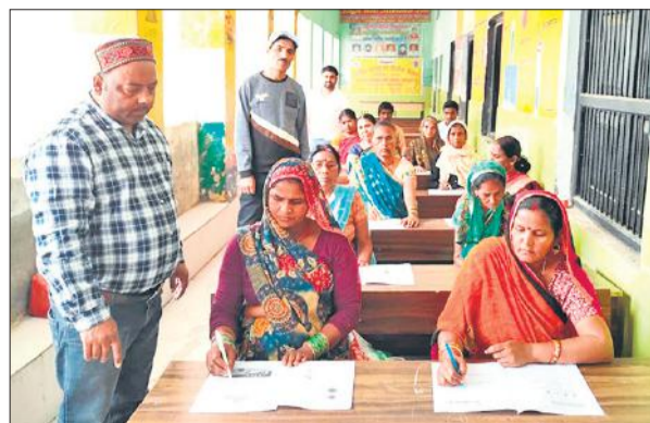
शहर के रोटी गोदाम स्कूल में परीक्षा देने नव साक्षर।