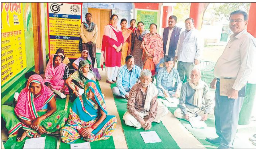
ग्रामीण क्षेत्र के एक स्कूल में परीक्षा देने नव साक्षर।