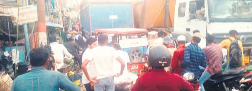
चौराहे पर डंपर के चलते लगे जाम में फंसे वाहन।

टाइम होने से रोजेदारों को भी जाम का सामना करना पड़ा। पुलिस पिकेट होने के बाद भी कोई पुलिसकर्मी मौके पर जाम