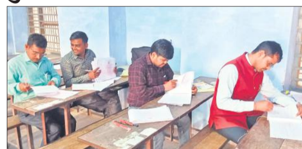
एक केंद्र पर यूपी बोर्ड की उत्तर पुस्तिकाओं का मूल्यांकन करते परीक्षक। ● अमृत विचार

जानकारी के अनुसार आधा प्रतिशत त्रुटि पर 25 प्रतिशत मूल्यांकन पारिश्रमिक में कटौती की जाएगी, जबकि एक प्रतिशत त्रुटि मिलने पर 50 प्रतिशत और दो प्रतिशत त्रुटि मिलने पर 85 फीसदी पारिश्रमिक कटौती की जाएगी। साथ ही दो प्रतिशत कटौती पर 85