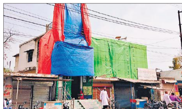
अटा रोड पर तिरपाल से ढकी गई मस्जिद।