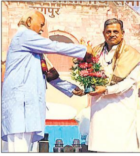
सरकार्यवाह चुने जाने पर होसबोले को बधाई देते सरसंघ चालक मोहन भागवत।

● तीन दिन चला मंथन, छह सह सरकार्यवाह भी हुए नियुक्त