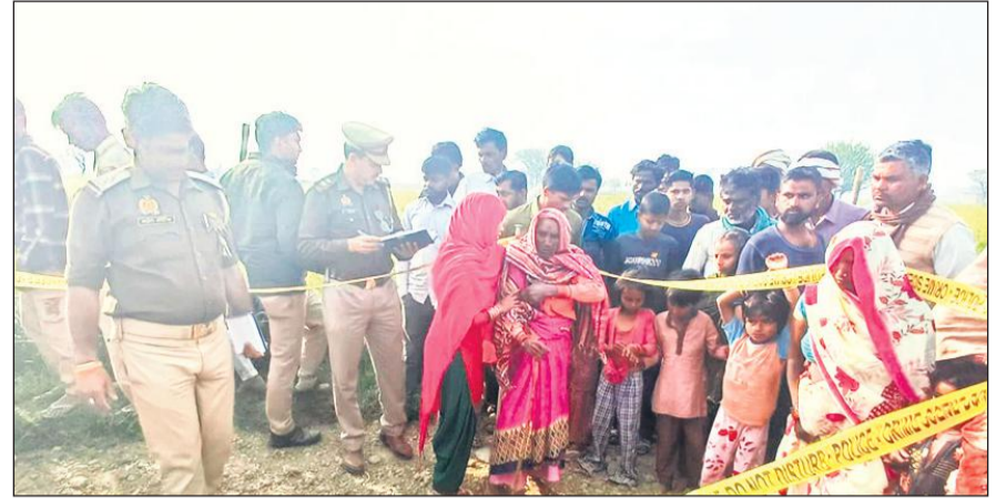
युवक की हत्या के बाद मौके पर पहुंची पुलिस और परिजन।