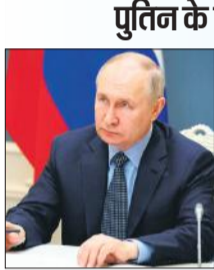
जौत चाहते हैं ताकि कह सके कि यूक्रेन पर पूरा रूस उनके साथ है। विश्लेषकों का कहना है कि पुतिन चाहते हैं कि 70 फीसदी वोटिंग हो और 80 फीसदी वोटों के साथ उनकी रिकॉर्ड जीत हो। पहले चरण में किसी प्रत्याशी को 50 फीसदी वोट न मिले, तो दूसरे चरण की वोटिंग का नियम है।

लंदन। ओवरसीज फ्रेंड्स ऑफ ब्लैकमैन ने कहा-भारतीय चुनाव दुनिया में लोकतंत्र की सबसे बड़ी कवायद है। भारत में जब से भाजपा ने सत्ता संभाली है, तब में भारत और ब्रिटेन के बीच दोस्ती और मजबूत हुई है। भाजपा सरकार के कारण भारत एक बढ़ती अर्थव्यवस्था के रूप में सामने है। हम यूके और भारत के बीच एक मुक्त व्यापार समझौते (एफटीए) पर बातचीत करने की कोशिश कर रहे हैं।