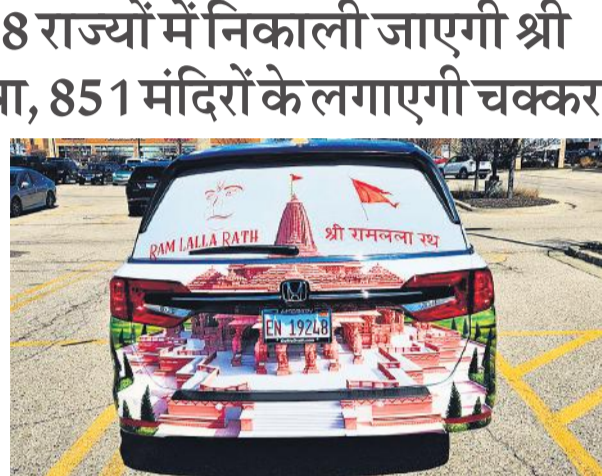
श्री रामलला रथ यात्रा के लिए तैयार की गई कार पर बनाया अयोध्या राममंदिर का दृश्य।