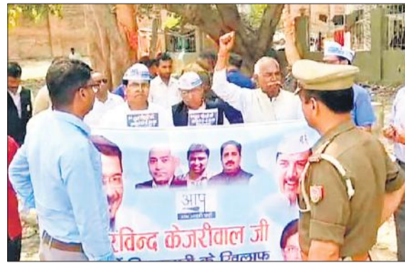
खिरनीबाग रामलीला मैदान में हल्ला बोल विरोध प्रदर्शन करते आप कार्यकर्ता।