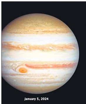
बृहस्पति के बदलते मौसम की तस्वीरें।

अमृत विचार : बृहस्पति में पृथ्वी से भी बड़े तूफान उठते हैं। अंतरिक्ष दूरबीन हबल ने बृहस्पति के तूफानों की नई तस्वीरों का खुलासा किया है। जिनमें चक्रवात और एंटीसाइक्लोन शामिल हैं। बृहस्पति के तूफानी मौसम पैटर्न के बारे में नई जानकारी मिली है। वैज्ञानिकों के अनुसार एंटीसाइक्लोन लगभग हर दो साल में ग्रेट रेड स्पॉट के आगे से गुजरता है। बृहस्पति हमारे सौरमण्डल का सबसे बड़ा ग्रह है। यह गैस का ग्रह है। पृथ्वी जैसी इसकी कोई सतह नहीं है। हबल स्पेस टेलीस्कोप से मिली तस्वीरें बताती हैं कि बृहस्पति गैस के साथ तेजी से घूम रहा है और बृहस्पति के तूफानी मौसम पैटर्न के बारे में सटीक पता चलता