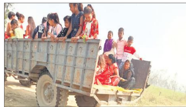
ट्रॉली में बैठे बड़ी संख्या में लोग।