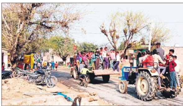
पूरार में ट्रैक्टर-ट्रॉली पर सवार बच्चे।

सामने से अचानक वाहन आने से ब्रेक लगते हैं तो हादसा होना का डर बना रहता है। इस समय कार्यक्रमों और समारोह में ट्रैक्टर-ट्रॉली का उपयोग लोगों को ले जाने में किया जा रहा है। ऐसे दृश्य किसी भी समय खुटार बंडा, पुवायां, गोला, मैलानी, पूरनपुर रोड पर देखा जा सकता