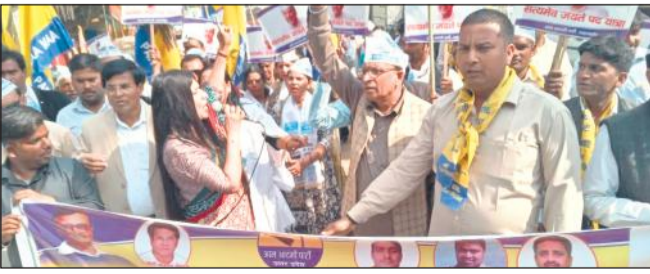
पदयात्रा के दौरान प्रदर्शन करते आप कार्यकर्ता।

अमृत विचार: आम आदमी पार्टी के प्रदेश प्रभारी एवं राज्यसभा सांसद संजय सिंह की गिरफ्तारी के विरोध में पार्टी कार्यकर्ताओं ने रविवार को सत्यमेव जयते पदयात्रा निकाली। पदयात्रा खिरनीबाग शहीद स्तंभ से प्रारंभ हुई और समापन नगर निगम शहीदों की प्रतिमाओं पर माल्यापण कर किया गया।