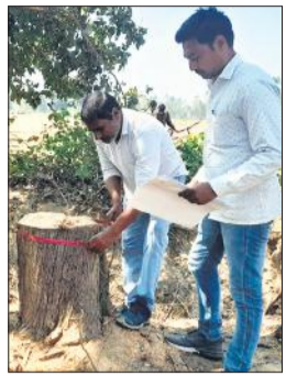
काटे गए पेड़ों की जांच करती वन विभाग की टीम।