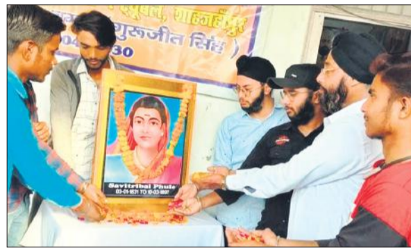
सावित्री बाई फुले के चित्र पर पुष्प अर्पित करते पंजाबी समाज के लोग।