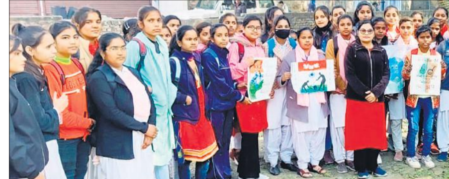
साक्षरता जागरूकता रैली निकालती आर्य महिला कॉलेज की स्वयंसेविकाएं।