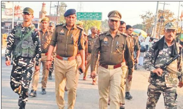
अलहागंज में रूट मार्च करता फोर्स।

है। हर वर्ष की तरह इस वर्ष भी अंटा चौराहा, बाबा विश्वनाथ मंदिर, निशात तिराहे, चारखंबा, सरदोई बंगला आदि स्थानों पर सुरक्षा के लिहाज से बेरीकेडिंग की जाएगी। किसी तरह के विवाद से निपटने की स्थिति के लिए