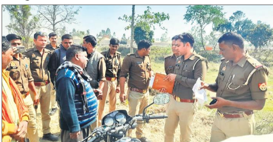
मौके पर जांच-पड़ताल करती पुलिस।