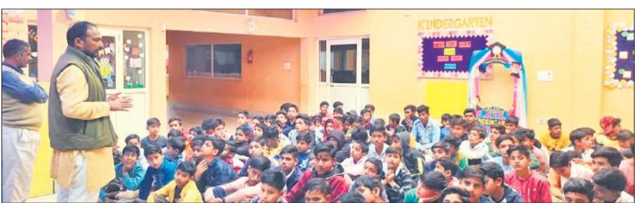
बच्चों को संबोधित करते वकता।