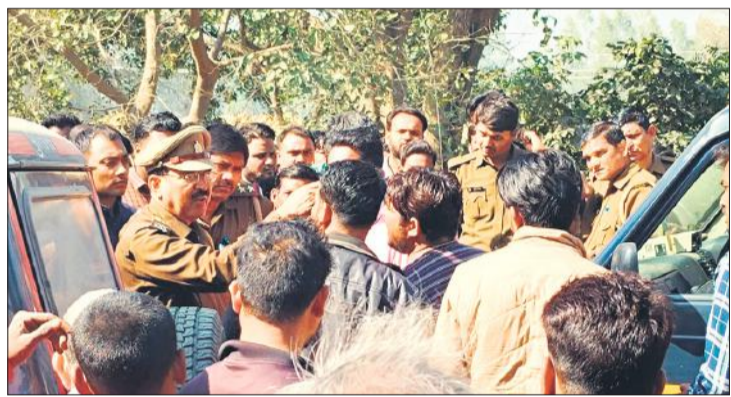
परिजनों को समझाने का प्रयास करते पुलिस अधिकारी।