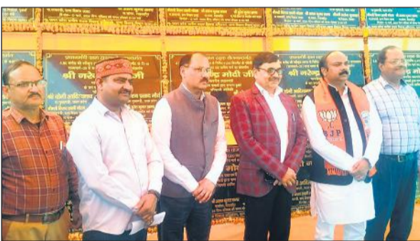
लोकार्पण के बाद इंजीनियर के साथ मौजूद सांसद अरुण सागर व अन्य।