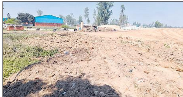
एनएचआई द्वारा तोड़ी गई बुनियाद।