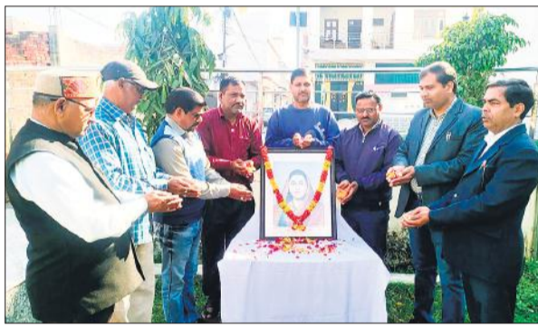
सावित्री बाई फुले के चित्र पर पुष्प अर्पित करते लोग।