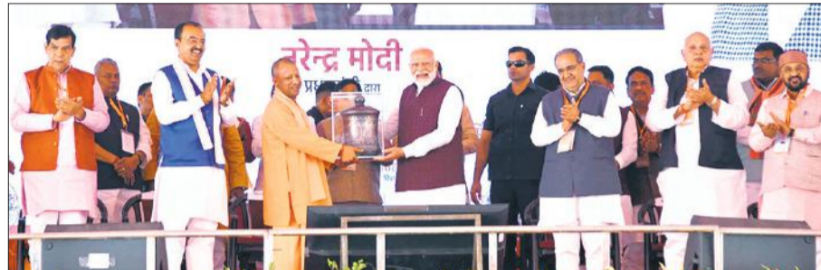
आजमगढ़ के मंडुरी में रविवार को जनसभा के दौरान प्रधानमंत्री नरेंद्र मोदी को प्रतीक विन्द देकर स्वागत करते मुख्यमंत्री योगी।

अमृत विचार : प्रधानमंत्री नरेंद्र मोदी ने प्रदेश में अपने दौर के दूसरे दिन रविवार को आजमगढ़ से प्रदेश में पांच नए एयरपोर्ट और लखनऊ के चौधरी चरण सिंह इंटरनेशनल एयरपोर्ट के नवीन टर्मिनल का लोकार्पण करते हुए इंडी गठबंधन को जातिवाद, परिवारवाद, भ्रष्टाचार, माफियाराज, तुष्टिकरण और कट्टरपंथ का पोषक ठहराया। कहा कि अब उप्र. से माफियाराज और कट्टरपंथ खत्म हो गया है। मुख्यमंत्री योगी की तारीफ करते कहा कि उत्तर प्रदेश पहले देश की राजनीति तय करता था, अब विकास की दिशा भी तय कर रहा है। मोदी ने प्रदेश के पांच जिलों में नए एयरपोर्ट और लखनऊ एयरपोर्ट के नवीन टर्मिनल के लोकार्पण के साथ ही 34700 करोड़ की 782 विकास परियोजनाओं का लोकार्पण व शिलान्यास किया। उन्होंने जनसभा को संबोधित करते हुए कहा कि लोगों का प्यार और विकास से जातिवाद, परिवारवाद और वोटबैंक के भरोसे बैठे इंडी गठबंधन की नींद उड़ गई है। पीएम ने कहा कि