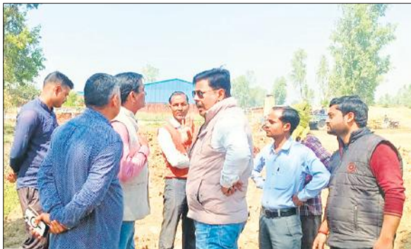
एनएचआई के अधिकारियों से नोकझोंक करते किसान।

इस समय जिला मुख्यालय शाहजहांपुर से खुटार तक नेशनल हाईवे फोरलेन का कार्य चल रहा है। साथ ही पुवायों से पूरनपुर से होते हुए मैलानी मार्ग पर स्थित लंगोटी बाबा स्थान तक बाईपास का निर्माण कार्य चल रहा है। नेशनल हाईवे बनाने के लिए किसानों की जमीनों को अधिग्रहण किया गया है। बावजूद इसके कुछ किसानों को उनकी