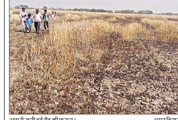
आग में जली हुई गेहूँ की फसल।