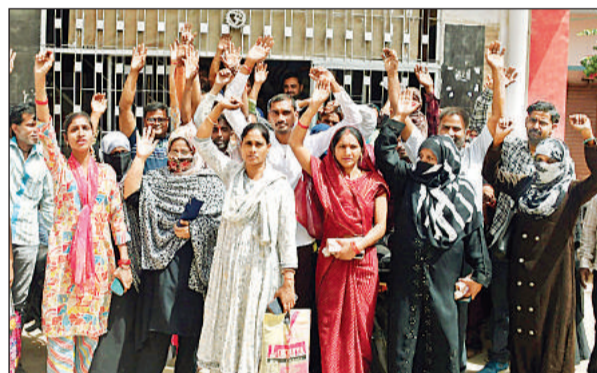
विद्यालय के सामने प्रदर्शन करते अभिभावक।

अभिभावकों ने आरोप लगाया कि सरकार की राइट टू एजुकेशन योजना के तहत गरीब तबके के विद्यार्थियों को अपने स्कूल में पढ़ाना न पड़े, इसलिए स्कूल प्रबंधन ने नए शिक्षा सत्र के पहले दिन बैठक कर दाखिला देने से इंकार कर दिया। अभिभावकों का यह भी आरोप रहा कि योजना के तहत प्रवेश होने के बावजूद मरम्मत और वार्षिक परीक्षा