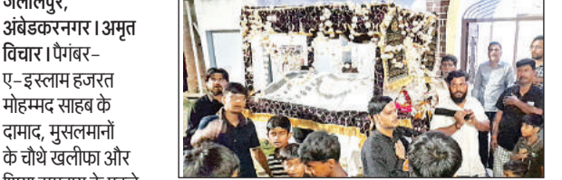
कटघर मुसा में हजरत अली का ताबूत बरामद करते हुसैन कमेटी के सदस्य।