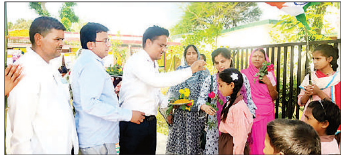
उच्च प्राथमिक विद्यालय में बच्चों को तिलक लगाते शिक्षक।