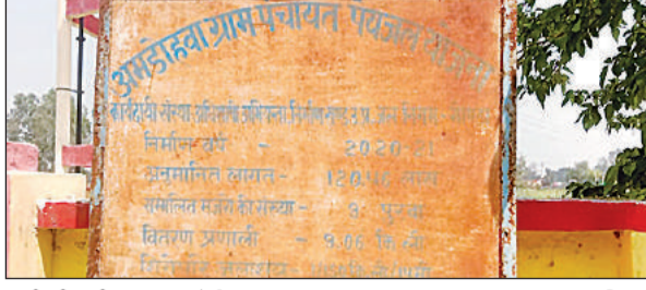
पानी की टंकी का साइन बोर्ड।

लिए में कार्यदायी संस्था अधिशाषी अभियंता, निर्माण खंड उत्तर प्रदेश जल निगम गोंडा द्वारा 120.46 लाख रुपये से शूद्र पेयजल पानी टंकी का निर्माण कराया गया। जिससे ग्राम पंचायत सहित नौ मजरा खुटपिपारा, परसरामपुर, लोहार