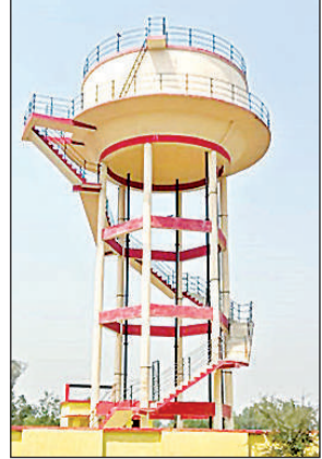
अमडोहवा गांव में बनी पानी की टंकी।