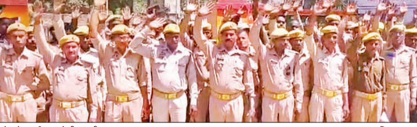
कलेक्ट्रेट में प्रदर्शन करते पीआरडी जवान। अमृत विचार