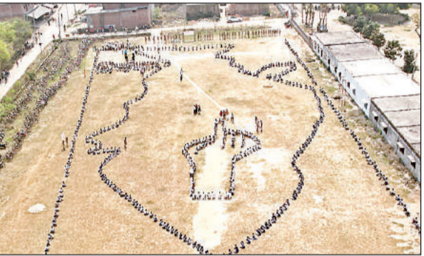
भारत माता का नक्शा बनाते बच्चे।