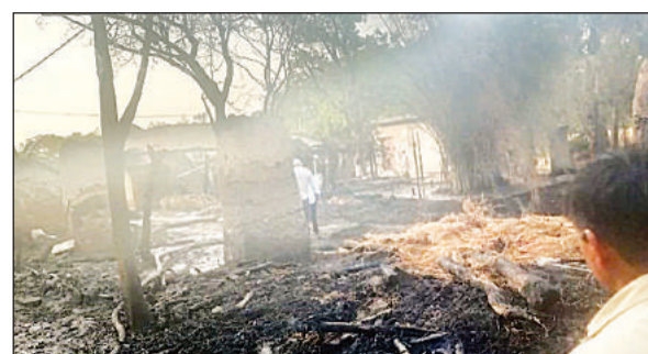
आग लगने के बाद सब जलकर राख हो गया।