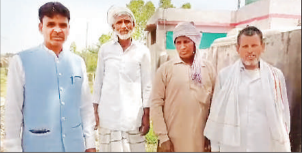
जिला मुख्यालय स्थित पोस्टमार्टम हाउस के पास मौजूद परिवार के लोग।