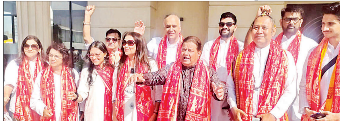
विदेशी पर्यटकों के साथ अयोध्या पहुंचे अनूप जलोटा।

भी देगा। रामलला के भव्य मंदिर में विराजमान होने के बाद प्रथम दिन चढ़ावे को लेकर हिमाचल प्रदेश के राज्यपाल ने कहा कि रामलला के भव्य मंदिर में विराज होने के बाद जो चढ़ावा चढ़ा उसका प्रभाव प्रदेश के जीडीपी पर नजर आएगा। वार्ता के बाद वो गोरखपुर के लिए रवाना हो गए।