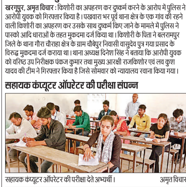
सहायक कंप्यूटर ऑपरेटर की परीक्षा देते अभ्यर्थी।