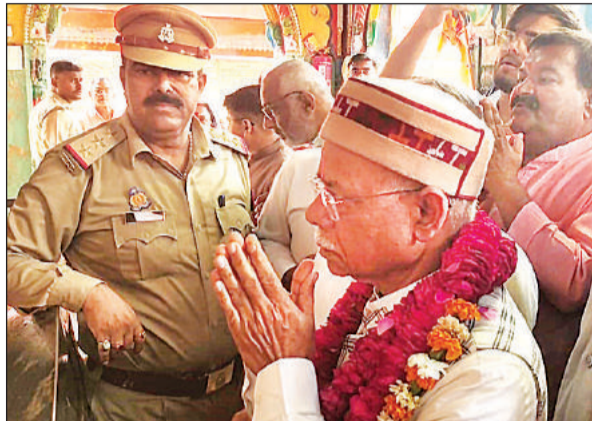
हनुमानगढ़ी में दर्शन पूजन करते हिमाचल के राज्यपाल।

ये बातें सोमवार को हिमाचल प्रदेश के राज्यपाल शिव प्रताप शुक्ला ने कहीं। वो रामलला के दर्शन के बाद पत्रकारों से वार्ता कर रहे थे। अपने जन्मदिन के मौके पर अयोध्या पहुंचे राज्यपाल ने सबसे पहले हनुमानगढ़ी पर हनुमान जी का आशीर्वाद लिया इसके बाद रामलला का दर्शन-पूजन किया। हिमाचल प्रदेश के राज्यपाल शिव प्रताप शुक्ला ने कहा कि यह जरूर कहा जा सकता है कि जो सबको देता है वह उत्तर प्रदेश को