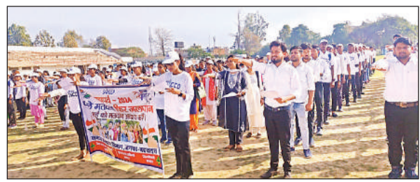
मतदाता जागरूकता के लिए शपथ लेते लोग।

नवीन मतदाता मैराथन कलेक्ट्रेट से रवाना होकर पानी टंकी, जेल रोड, पुलिस लाइन से श्री गुरुनानक चौक होते हुए इन्दिरा गांधी स्टेडियम, में सम्पन्न हुई। रैली में शामिल छात्र-छात्राएं मतदाता जागरूकता संबंधी सब काम छोड़ दो, सबसे