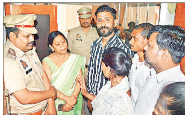
विद्यालय की प्रधानाचार्या से वार्ता करते अभिभावक।