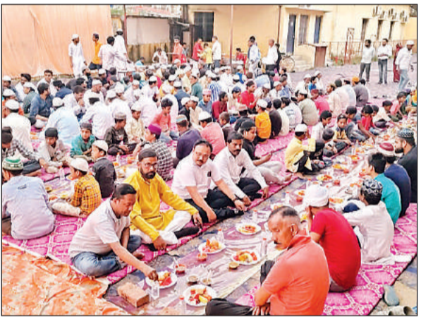
रोजा इफ्तार करते रोजेदार।