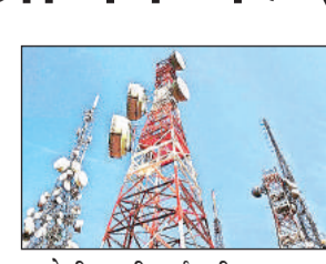
स्वदेशी 4 जी हाई स्पीड का मजा मिल जाएगा।

अमृत विचार : सार्वजनिक क्षेत्र की दूरसंचार सेवा प्रदाता कंपनी भारत संचार निगम लिमिटेड ने जिले के बीटीएस टॉवरों को स्वदेशी तकनीक पर आधारित 4 जी उपकरणों से अपडेट कर लिया है। उपभोक्ताओं के मोबाइल पर 4 जी का सिग्नल भी दिखने लगा है। सेवा के सुचारु रूप से शुरू होने के लिए बीएसएनएल को अपने चंडीगढ़ स्थित मुख्य सर्वर से कमीशन का इंतजार है। जिस पर काम चल रहा है। जिले के उपभोक्ताओं के साथ रामनवमी मेले में आने वाले श्रद्धालुओं को