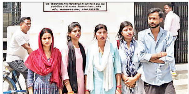
अस्पताल के बाहर मौजूद परिजन।