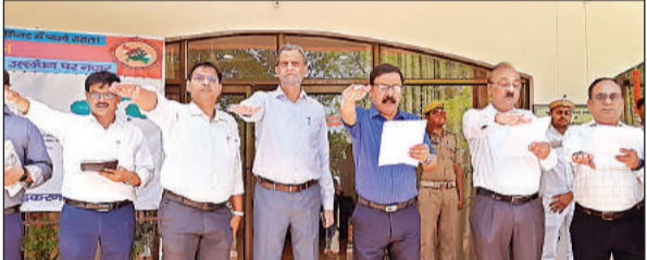
डीएम ने संचारी दस्तक अभियान के तहत अधिकारियों, कर्मचारियों को दिलाई शपथ।

जिलाधिकारी ने की दस्तक अभियान की शुरुआत, वितरित की जाएंगी निशुल्क दवाएं