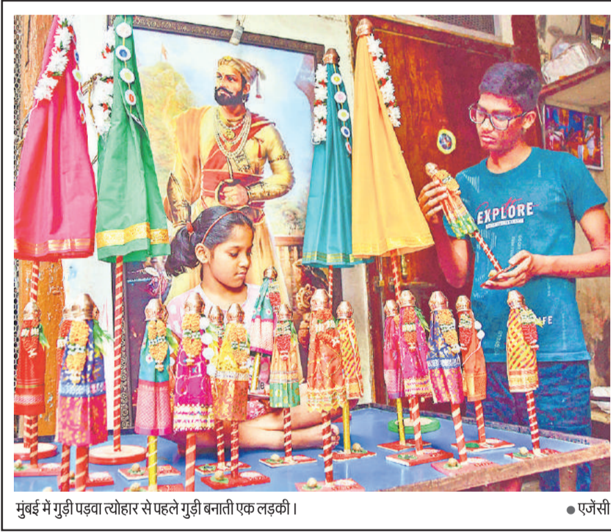
मुंबई में गुड़ी पड़वा त्योहार से पहले गुड़ी बनाती एक लड़की।

नियम-आधारित अनुशासन और राजकोषीय रूप से विवेकपूर्ण नीतियों को लागू करने में आरबीआई की उपलब्धि की सराहना की और बैंकों को सरकार के समर्थन का आश्वासन दिया। मोदी ने मुद्रास्फीति को नियंत्रित करने के कदम उठाने के लिए आरबीआई की मौद्रिक नीति समिति (एमपीसी) की सराहना भी की। उन्होंने कहा कि भारतीय अर्थव्यवस्था ऐसे समय में नए रिकॉर्ड बना रही है, जब दुनिया के कई देश अब भी महामारी के आर्थिक झटके से उबरने की कोशिश कर रहे हैं।