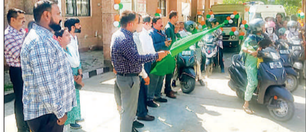
जागरूकता वैन को हरी झंडी दिखाकर रवाना करते सीडीओ।