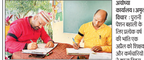
विरोध में काली पट्टी बांध कर काला दिवस मनाते शिक्षक।