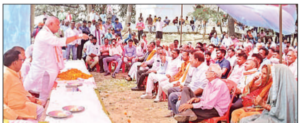
मिल्कीपुर में चौपाल के दौरान बैठक को सम्बोधित करते सांसद लल्लू सिंह।

अयोध्या। सांसद लल्लू सिंह ने कहा कि सरकार की कार्रवाई से भ्रष्टाचारियों के मन में भय है। पहले योजनाओं का ज्यादा हिस्सा बीच के दलाल खा जाते थे। अब योजनाओं का पैसा सीधे लाभार्थी के खाते में आता है। इन्हीं कारणों से पीएम मोदी तमाम राजनैतिक पार्टियों के लिए एक बेचैनी बन गए हैं। वो सोमवार को मिल्कीपुर विधान सभा क्षेत्र के कई गांव में चौपाल को संबोधित कर रहे थे। हैरिंगटनगंज के पारतानजपुर, रामपुर सोहना, हरदोइया, मिल्कीपुर के महलारा, हिसामुद्दीनपुर, कुचेरा