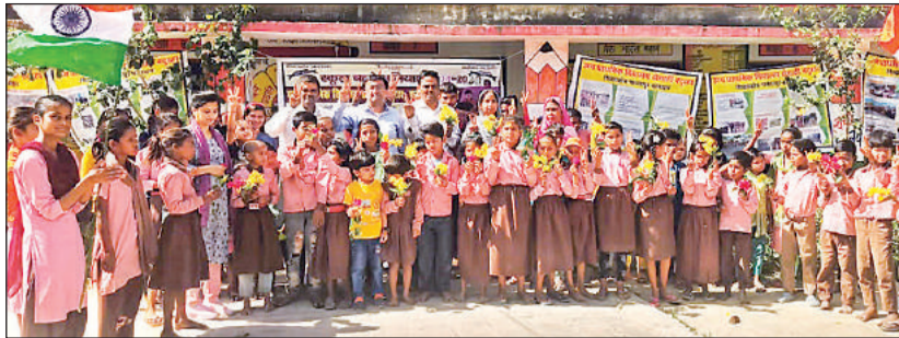
विद्यालय में मौजूद छात्र-छात्राएं।