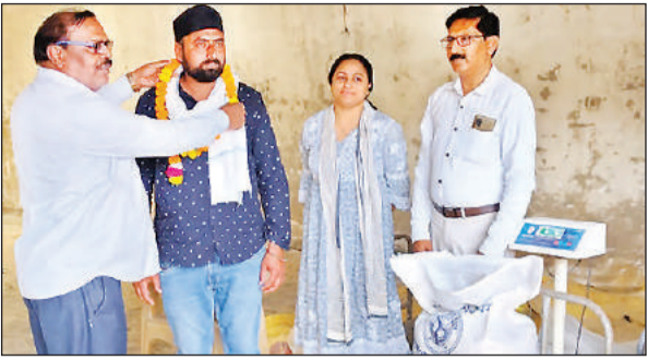
गेहूं बेचने आए किसान का स्वागत करते सभागीय खाद्य नियंत्रक व अन्य।

इस बार गेहूं खरीद सत्र का शुभारंभ एक मार्च से हो गया था। लेकिन एक माह बीतने के बाद ही सरकारी केंद्रों पर गेहूं पहुंचा है। जनपद में इस बार छ एंजंशी को गेहूं खरीदने की जिम्मेदारी सौंपी गई है। जिसमें खाद्य विभाग, पीसीएफ पीसीयू यूपीएसएस भारतीय खाद्य निगम तथा कृषि उत्पादन मंडी समिति हैं। जनपद को जो इस बार लक्ष्य दिया गया है वह विगत कई वर्षों का रिकॉर्ड तोड़ रहा है