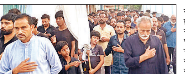
इमामबाड़ा मीरानपुर से निकले जुलूस में मातम करते हुए अंजुमन अकबरिया के लोग।

अमृत विचार। दामादे पैगम्बर मौला अली के शहादत दिवस 21 रमजान पर सोमवार को अली अली हाये अली के गगनभेदी नारों के साथ जनपद भर में मातमी जुलूस निकाल कर मौलाए कायनात हजरत अली के प्रति श्रद्धांजलि अर्पित की गई। इस बीच जिला प्रशासन की ओर से सुरक्षा के व्यापक प्रबंध रहे। संबंधित नगर पालिका परिषदों की तरफ से जुलूस मार्गों पर साफ-सफाई व चूना छिड़काव किया गया था। जिला मुख्यालय अकबरपुर