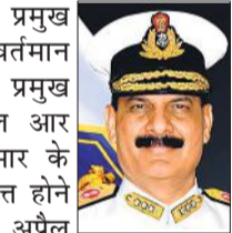
वाइस एडमिरल दिनेश कुमार त्रिपाठी

नई दिल्ली। वाइस एडमिरल दिनेश कुमार त्रिपाठी देश के नए नौसेना प्रमुख होंगे। वर्तमान नौसेना प्रमुख एडमिरल आर हरि कुमार के सेवानिवृत्त होने पर 30 अप्रैल को वह नया पदभार संभालेंगे। सैनिक स्कूल रीवा के पूर्व छात्र वाइस एडमिरल त्रिपाठी वर्तमान में नौसेना के उप प्रमुख के रूप में कार्यरत हैं और एडमिरल कुमार के पद छोड़ने पर वह नौसेना में सबसे वरिष्ठ अधिकारी होंगे।