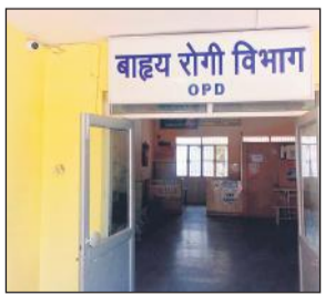
ओपीडी के बाहर लगाया गया कैमरा।