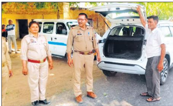
वाहनों की तलाशी लेते पुलिस के अधिकारी।