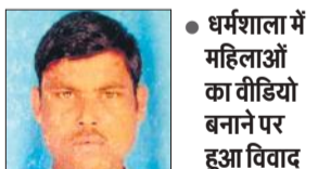
● धर्मशाला में महिलाओं का वीडियो बनाने पर हुआ विवाद

अमृत विचार: शादी समारोह में डीजे पर डांस कर रही महिलाओं का वीडियो बनाने को लेकर वर-वधू पक्ष में विवाद हो गया। बात इतनी बढ़ी कि मारपीट होने लगी। इसी दौरान किसी ने दुल्हन के चचेरे जीजा के सिर पर किसी वजनी चीज से प्रहार कर दिया जिससे उसकी मौत हो गई।