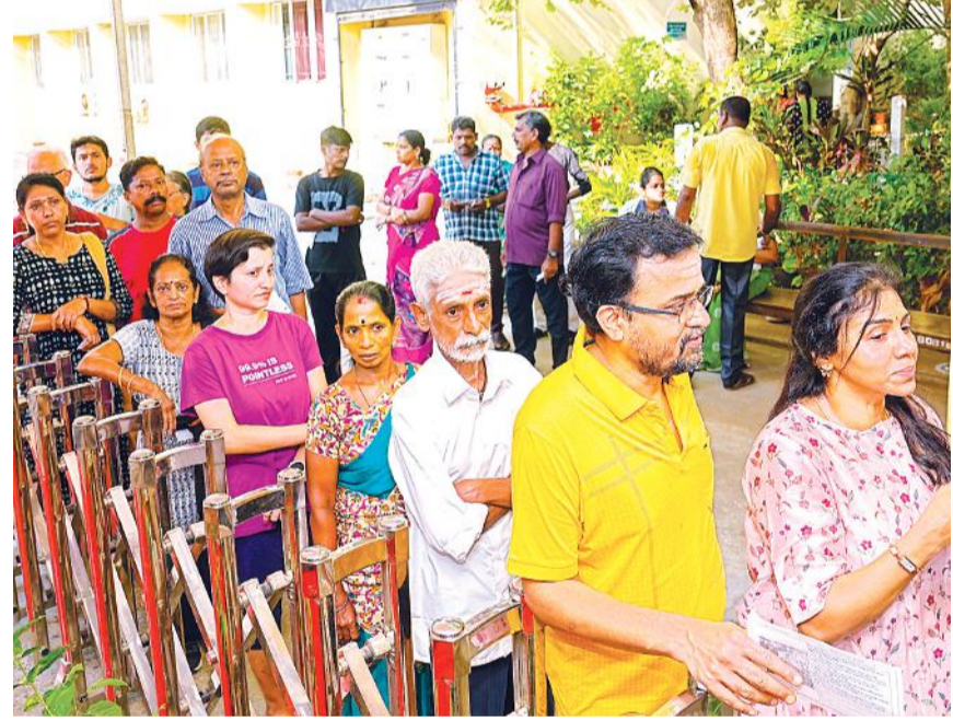
तमिलनाडु की राजधानी चेन्नई में वोट डालने के लिए अपनी बारी का इंतजार करते मतदाता। यहां मतदाताओं में वोट डालने को लेकर खासा उत्साह नजर आया। देर शाम तक मतदाता बूथों पर डूटे रहे।