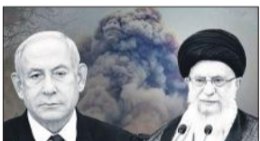
● पिछले शनिवार ईरान ने 300 से अधिक ड्रोन से किया था हमला

इजराइल पर ईरान के ड्रोन हमले का जवाब देने को लेकर सप्ताह भर से अंतर्राष्ट्रीय स्तर पर चल रहे विचार विमर्श के बीच इजराइल अपनी पूरी रणनीति पर उतरा आया। इजराइल की हमेशा से ही नीति रही है 'पहले किसी को छोड़ेंगे नहीं, बाद में किसी छोड़ेंगे नहीं'। इजराइल ने सात दिन बाद शुक्रवार को उस हमले का जवाब अपनी मिसाइलें दाग कर दिया। जो इस्फ़हान प्रांत में गिरीं। इनसे ईरान को हुए नुकसान के बारे में अब तक कोई पुष्ट खबर नहीं है। इस बीच, सीरिया ने भी दावा किया है कि इजराइली हमले में देश के दक्षिणी भाग में रक्षा ठिकानों को