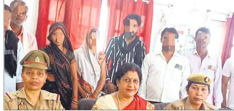
महिला थाना में साथ खड़े पति-पत्नी एवं मौजूद केंद्र के सदस्य।