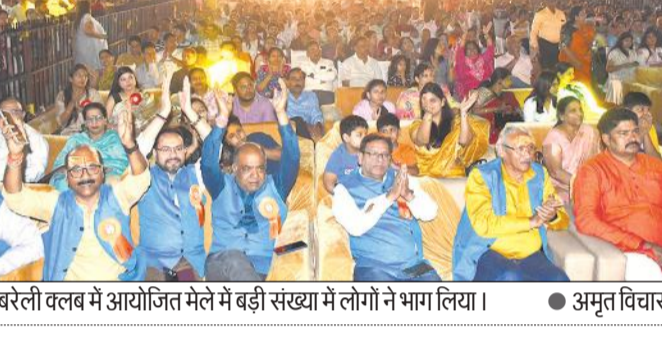
बरेली क्लब में आयोजित मेले में बड़ी संख्या में लोगों ने भाग लिया।