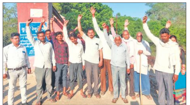
डैम से आवागमन बंद होने पर प्रदर्शन करते ग्रामीण।

संवाददाता, दुनका अमृत विचार : दुनका में कुल्ली नदी पर बने डैम में दरार आने के बाद वाहनों का आवागमन बंद कर दिया गया। इसकी वजह से लोगों ने नदी से निकलना शुरू किया। रविवार को कई वाहन नदी में फंस गए तो जेसीबी से निकालना पड़ा। कई बाइक सवार भी गिरकर चोटिल हो गए तो ग्रामीणों का गुस्सा फूट पड़ा। गांव वालों ने प्रदर्शन किया और कहा कि पुल की मरम्मत नहीं होगी तो वोट नहीं देंगे। कई साल पुराने डैम में दरार आने पर श्रुकार को नहर खंड के अधिकारियों ने वाहनों का आवागमन रोक दिया गया। दूसरा रास्ता लंबा होने की वजह से गांव के लोगों ने नदी के अंदर से निकलना शुरू कर दिया। रास्ता बंद होने से करीब 50 गांवों के लोग प्रभावित हुए हैं। यदि नदी से लोग निकलें तो 15 किलोमीटर लंबा