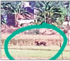
जंगल की ओर जाता बाघ।