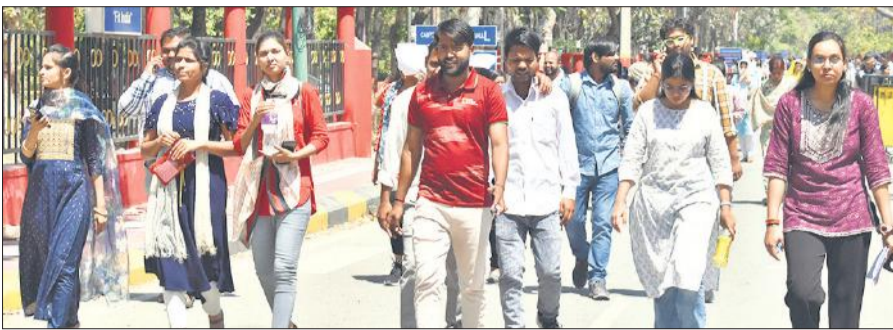
रुहेलखंड विश्वविद्यालय में पीएचडी प्रवेश परीक्षा देकर बाहर आते अभ्यर्थी।