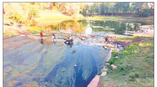
कुल्ली नदी से निकलते समय फिसली बाइक को संभालता युवक।