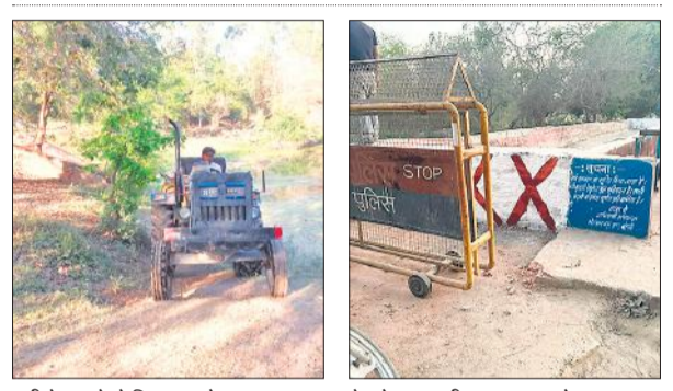
नदी के रास्ते से निकलता ट्रैक्टर चालक।

चक्कर लगाना पड़ता है। रविवार की गई तो क्षेत्रवासी चुनाव का गांव वालों ने विरोध कर चेतावनी दी कि यदि डैम की मरम्मत नहीं की गई तो क्षेत्रवासी चुनाव का बहिष्कार करने को बाध्य होंगे।