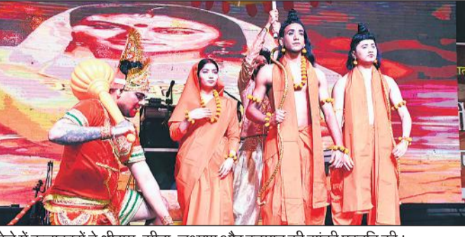
मेले में कलाकारों ने श्रीराम, सीता, लक्ष्मण और हनुमान की झांकी प्रस्तुति की।