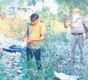
बोरे से शव को बाहर निकालता युवक और मौजूद पुलिस।

● तीन अप्रैल को सनी शहामतगंज से बोरा खरीदकर लाया