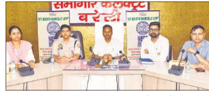
कलेक्ट्रेट में माय बूथ एप के बारे में जानकारी देते डीएम।