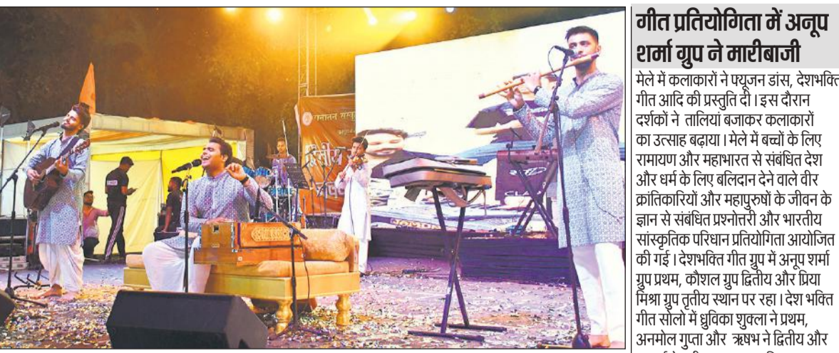
बरेली क्लब में आयोजित सनातन नववर्ष मेले में बैंड की प्रस्तुति देते कलाकार।