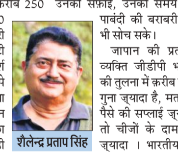
श्री. पुलिष महानिरीक्षक से. नि.