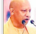
दर्शाते है कि देश की आस्था को पहले दबाया गया था।

समस्या बताते हुए कहा कि उसके शासनकाल में गरीबों के हक पर डाका डालने के साथ ही आतंकियों को बिरयानी खिलाई जाती थी और दंगे कराना व कर्फ्यू लगाना कांग्रेस में