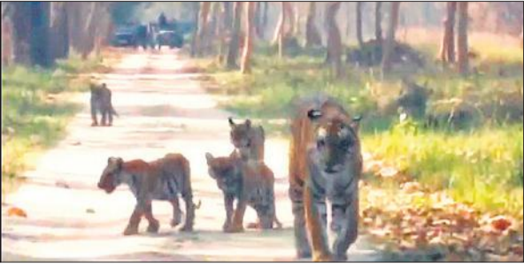
दुधवा टाइगर रिजर्व में चार शावकों के साथ बाघिन।