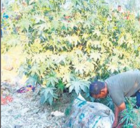
बोरे से शव को बाहर निकालता युवक और मौजूद पुलिस।

● तीन अप्रैल को सनी शहामतगंज से बोरा खरीदकर लाया