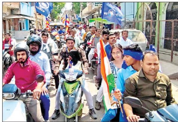
बाइक रैली निकालते ऑल अधिकारी संगठन के लोग।