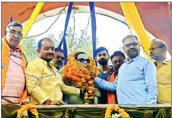
बाबा साहेब की प्रतिमा पर माल्यार्पण करते भाजपाई।