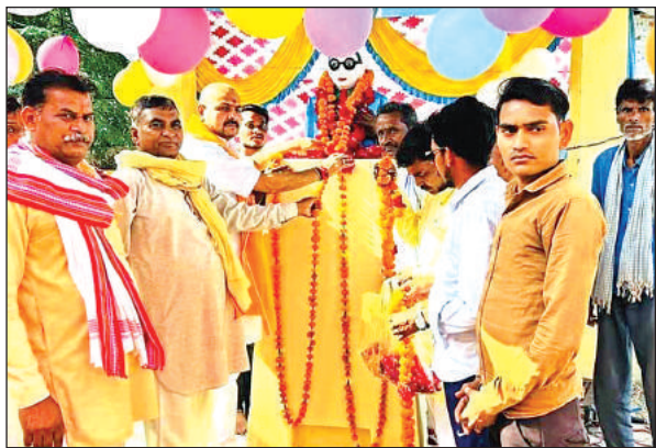
बाबा साहेब की प्रतिमा पर माला पहनाते सदर विधायक।