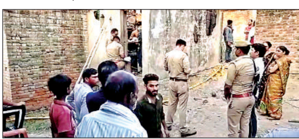
घटनास्थल पर मौजूद पुलिस और ग्रामीण।

अमृत विचार। सरधुआ थाना क्षेत्र अंतर्गत ग्राम पंचायत भदेहदू में छोटे भाई ने मंझले को कुल्हाड़ी और लाठी के ताबड़तोड़ प्रहार से मौत के घाट उतार दिया। सीओ की अगुवाई में पुलिस फोर्स पहुंची। घर को चारों ओर से घेर लिया गया और कई घंटे की मशक्कत के बाद हत्यारोपी को गिरफ्तार कर लिया गया। पुलिस के अनुसार, आरोपी मानसिक रूप से बीमार है।