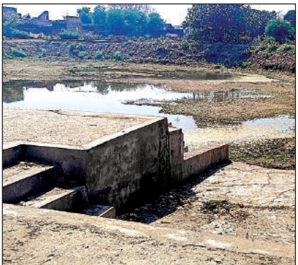
नरैनी में स्थित सूखा पड़ा तालाब।

चैत्र नवरात्र में मां की आराधना के लिए कस्बे सहित आसपास के गांवों के घरों में ज्वारे बोए जाते हैं। इनका विसर्जन कस्बे के देविन नगर मोहल्ले में स्थिति ब्यालीस खेर की महाराजी कही जाने वाली कारू माता मंदिर पर स्थित तालाब पर होता है। लेकिन पानी न होने के कारण कस्बा सहित आसपास गांवों