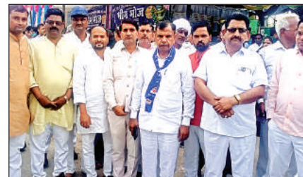
आंबेडकर जयंती मनाते बसपा पदाधिकारी।