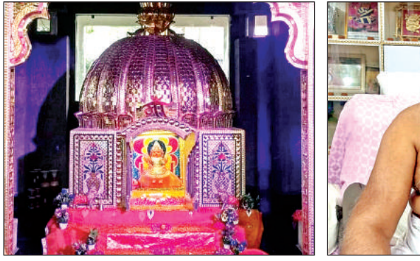
वनखंडी माता। अमृत विचार

अमृत विचार। कालपी नगर के दक्षिण दिशा में स्थित वनखंडी देवी शक्ति पीठ में नवरात्र के अवसर पर हजारों श्रद्धालु पूजा-अर्चना कर पुण्य प्राप्त करते हैं। मान्यता है कि जो भी भक्त सच्चे मन से यहाँ कुछ मांगता है उसकी मंजूर अवश्य पूरी होती है। मनोकामना पूर्ण होने पर परिवार व रिश्तेदारों के साथ देवी मंदिर पहुंचकर डाली चढ़ाने की परंपरा है। डाली में पूड़ी, सब्जी, आटे का मीठा हलुआ, मां वनखंडी में चढ़ाने की परंपरा है। नवरात्र में भक्तों की भीड़ को देखते हुए सुरक्षा के लिए सुबह 6 बजे से देर रात्रि तक पुलिस का पहरा रहता है। इसके अलावा सुंदलखंड में वनखंडी देवी की अलग ही महत्ता है। हमीरपुर, महोबा, झांसी, मध्यप्रदेश के पिंड, कानपुर देहात समेत कई अन्य जगहों और जालौन जनपद के कोने-कोने से मां वनखंडी के भक्त अपनी मनोकामना लेकर देवी दरबार में हाजिरी भराते हैं।