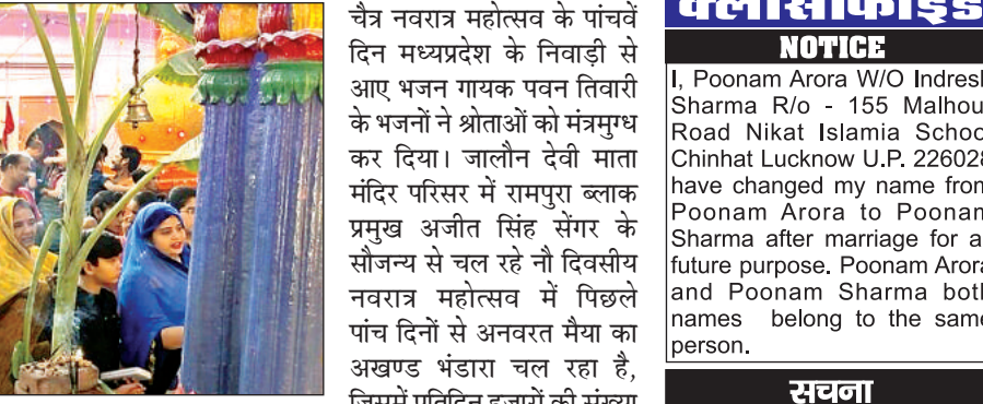
माता के दर्शन करते श्रद्धालु। अमृत विचार