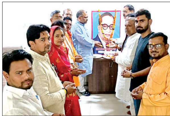
बाबा साहेब की जयंती मनाते भाजपा कार्यकर्ता।