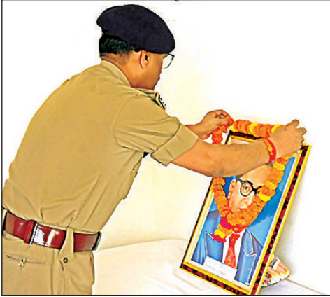
बाबा साहेब के चित्र पर माल्यार्पण करते पुलिस अधीक्षक।