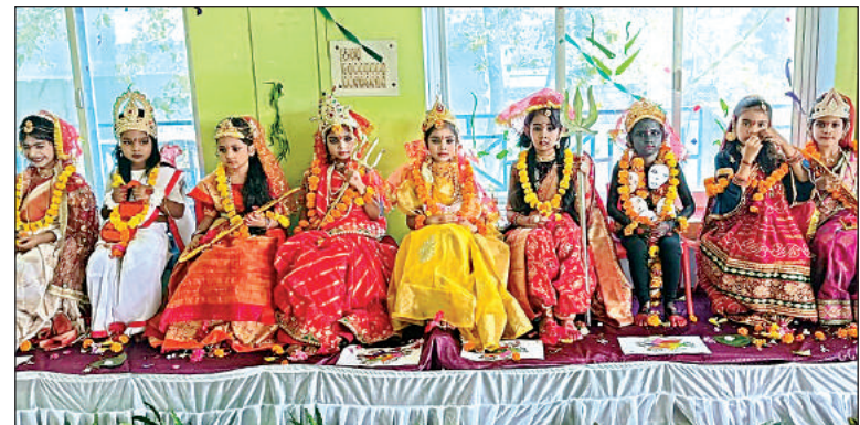
स्कूल में सजी नौ देवियों की झांकी।