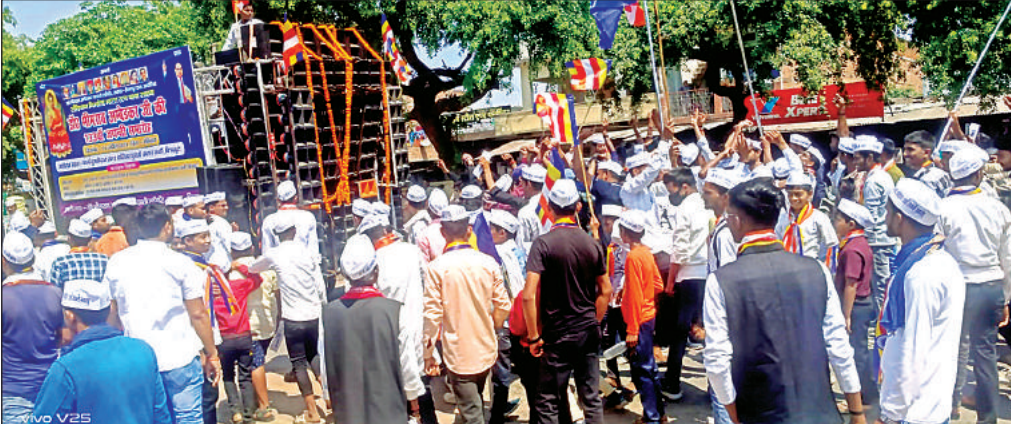
शोभायात्रा में शामिल लोग।