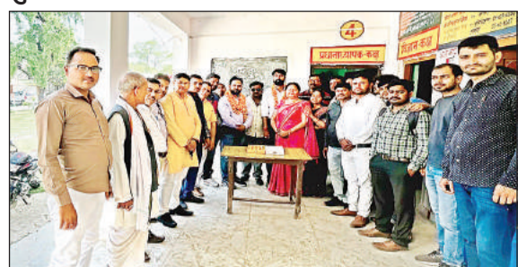
ब्लॉक अध्यक्ष के स्वागत के दौरान मौजूद शिक्षक।