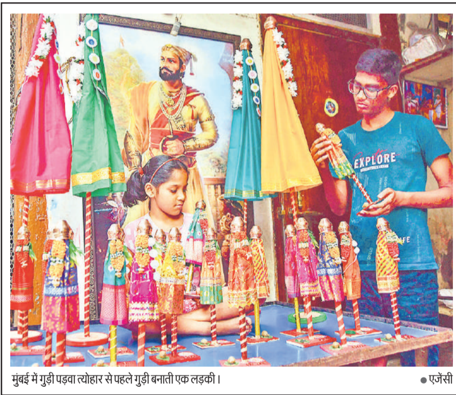
मुंबई में गुड़ी पड़वा त्योहार से पहले गुड़ी बनाती एक लड़की।

नियम-आधारित अनुशासन और राजकोषीय रूप से विवेकपूर्ण नीतियों को लागू करने में आरबीआई की उपलब्धि की सराहना की और बैंकों को सरकार के समर्थन का आश्वासन दिया। मोदी ने मुद्रास्फीति को नियंत्रित करने के कदम उठाने के लिए आरबीआई की मौद्रिक नीति समिति (एमपीसी) की सराहना भी की। उन्होंने कहा कि भारतीय अर्थव्यवस्था ऐसे समय में नए रिकॉर्ड बना रही है, जब दुनिया के कई देश अब भी महामारी के आर्थिक झटके से उबरने की कोशिश कर रहे हैं।