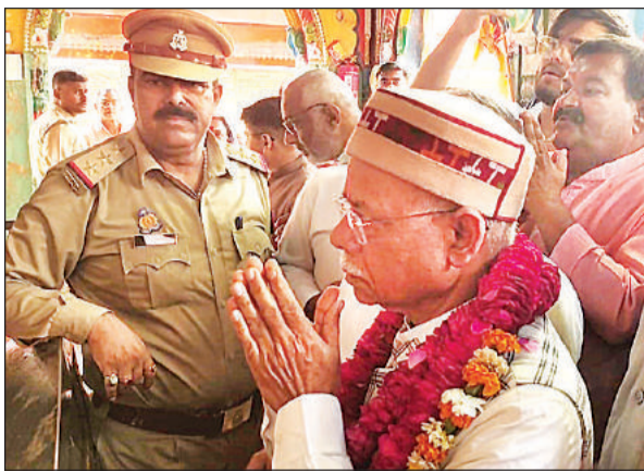
हनुमानगढ़ी में दर्शन पूजन करते हिमाचल के राज्यपाल।