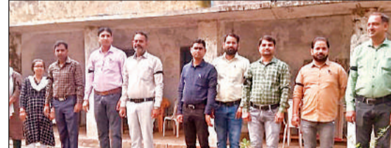
काली पट्टी बांधकर प्रदर्शन करते हुए। अमृत विचार