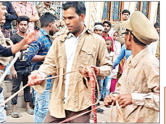
आठों के जुलूस में शामिल लोग।

अमृत विचार : गंगा-जमुनी की तहजीब की मिसाल पेश करने वाले कस्बा जैदपुर में हर्षोउल्लास के साथ आठों का जुलूस सोमवार को संपन्न हुआ। कस्बा जैदपुर में होली पर्व के 8 दिन बाद निकलने वाला जुलूस आठों बड़े ही धूमधाम से निर्धारित मार्गों से निकला गया। जुलूस में श्रद्धालु कस्बा जैदपुर के विभिन्न वार्ड उसरी लोधपुरवा, बगहा आदि मोहल्लों से अपनी अपनी झांकियों के साथ शीतला मंदिर लोधपुरवा में एकत्रित हुए। पूजा-अर्चना के बाद कमेटी के सदस्यों ने झांकियों को रवाना किया। गाजे-बाजे के साथ सुंदर झांकियों की प्रस्तुति की गई। जुलूस महामुद्रपुर गढ़ी, कदीम बाध चौराहा, छोटा इमामबाड़ा होते