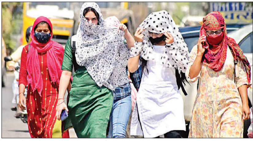
लू व धूप से बचाव के लिए दुपट्टे से मुंह ढककर जाती युवतियां।

लू चलने से बड़ी बेचैनी, तापमान बढ़ने के आसार