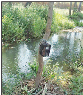
जार में बाधिन की निगरानी के लिए लगा कैमरा।