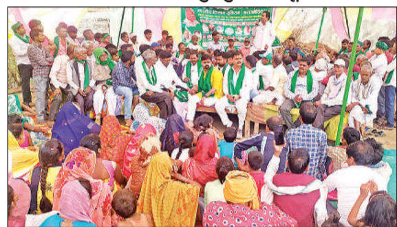
होली मिलन समारोह में भाकियू के पदाधिकारी व ग्रामीण।

होली मिलन समारोह में एकजुट हुए भाकियू कार्यकर्ता