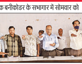
कर्मचारियों को शायद दिलाते बीडीओ।