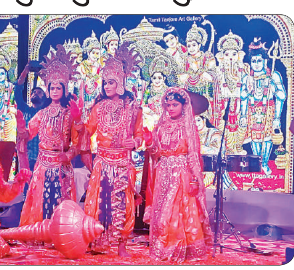
प्रभु श्रीराम, सीता, लक्ष्मण व हनुमान के वेश में मंचन करते कलाकार।