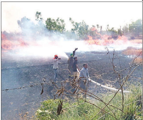
आग पर काबू करने का प्रयास करते दमकलकर्मी।