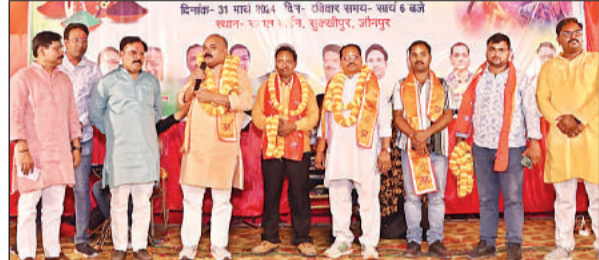
कार्यक्रम को संबोधित करते उद्योग व्यापार मंडल के पदाधिकारी।