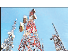
स्वदेशी 4 जी हाई स्पीड का मजा मिल जाएगा।

अयोध्या कार्यालय अमृत विचार : सार्वजनिक क्षेत्र की दूरसंचार सेवा प्रदाता कंपनी भारत संचार निगम लिमिटेड ने जिले के बीटीएस टॉवर्स को स्वदेशी तकनीक पर आधारित 4 जी उपकरणों से अपडेट कर लिया है। उपभोक्ताओं के मोबाइल पर 4 जी का सिग्नल भी दिखने लगा है। सेवा के सुचारु रूप से शुरू होने के लिए बीएसएनएल को अपने चंडीगढ़ स्थित मुख्य सर्वर से कमीशन का इंतजार है। जिस पर काम चल रहा है। जिले के उपभोक्ताओं के साथ रामनवमी मेले में आने वाले श्रद्धालुओं को