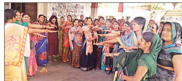
शपथ लेती आशा बहुएं व संगिनी।