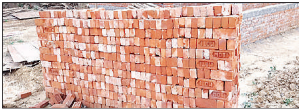
निर्माण स्थल पर रखी पीली ईंटें।