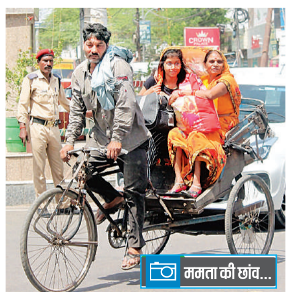
तापमान 38 डिग्री... ऐसे में तेज धूप में चलना मुश्किल है। धूप से बचने के लिए एक बेटी ने अपनी मां का अंचल ओढ़ लिया। यह दृश्य शहर के पटेल तिराहे का है।

इस बार मार्च के तीसरे सप्ताह से ही गर्मी का एहसास शुरू हो गया था। लोगों ने पंखे तो चलाना शुरू किए लेकिन मौसम बदलने के कारण कूलर, एसी से बचते रहे अप्रैल शुरू होते ही गर्मी का असर और बढ़ गया। कड़ी धूप के कारण दिनभर सड़कों पर रहने वाली भीड़ अब कम होने लगी है। लोगों ने कूलर और एसी की मरम्मत कराना शुरू कर दी है। दोपहर होते ही सूर्य की किरणें लोगों को चुभने लगी हैं। दो दिन से चल रही लू से लोगों की परेशानी और बढ़ गई है। 2022 का मार्च अधिकतम तापमान के मामले में 121 वर्षों में दूसरा सबसे गर्म महीना था। इस बार तापमान में बढ़ोतरी होने की संभावना है। गर्मी को देखते हुए शीतल पेय की दुकानों पर भीड़ जुटने लगी है। इस मौसम में खासकर गन्ने का जूस लोगों को लुभा रहा है।