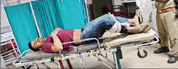
पुलिस मुठभेड़ में घायल बदमाश।