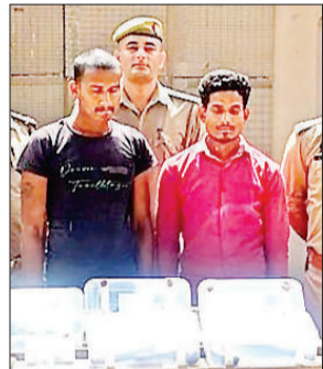
शस्त्र फैक्ट्री के साथ पकड़े गये दो आरोपी व गिरफ्तार करने वाली पुलिस टीम।

पुलिस ने दावा किया है कि, एक अदद 12 बोर बंदूक चालू हालत में व एक अदद तमंचा 12 बोर चालू हालत में (अध्दी), 2 अदद तमंचा 12 बोर चालू हालत में, एक अदद अवैध तमंचा 315 बोर चालू हालत में, 4 अदद बाड़ी तमंचा अधबनी, 4 अदद नाल लोह 12 बोर, 1 खोखा कारतूस 315 बोर, एक मिस कारतूस 12 बोर, एक अदद खोखा