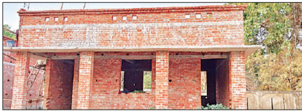
राजकीय बालिका इंटर कॉलेज सतरिख में चल रहा निर्माण कार्य।