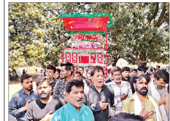
मातमी जुलूस निकालते शिया समुदाय के लोग।

ताबूत और मातमी जुलूस में गुंजी 'या अली' की सदाएं