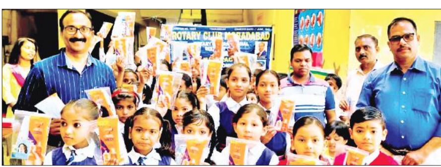
हैंडवॉश किट वितरण के बाद बच्चों के साथ रोटरी क्लब मुरादाबाद के पदाधिकारी व सदस्य।

कहा कि हमें कुछ भी खाने से पहले हाथों को अच्छी तरह से धोना चाहिए। यह आपको कई खतरनाक बीमारियों से भी बचाता है। हाथों को कम से कम 20 सेकेंड तक साबुन से या हैंडवॉश से अवश्य धुलना चाहिए। इससे हम निमोनिया, इन्फ्लूएंजा, प्लू, सर्दी-खांसी आदि जैसे बीमारियों के संक्रमण से बच सकते हैं। अभियान में बच्चों को हैंडवॉश और पर्सनल हाइजीन किट जिसमें सैनिटाइजर, टूथपेस्ट, टूथ ब्रश,