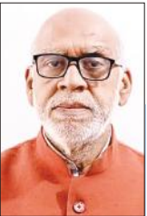
रालिल पांडेय भिर्जपुर

विधान बताए गए हैं। लोकमान्यता है कि चेचक की बीमारी से मुक्ति के लिए शीतला माता की पूजा की जाती है। माताएं चेचक आदि से बचाव के लिए सप्तमी तिथि को व्रत रहकर अष्टमी को माता शीतला की पूजा करती हैं। माता शीतला का वाहन गर्दभ (गधा) सरल भाव एवं मेहनती जानवर है। गधे के इन खास स्वभाव के चलते माता शीतला के सान्निध्य में उसे स्थान मिला। हर जीव में कुछ खासियत तथा कुछ कमियां होती हैं। खासियतों को अपनाने का भी सन्देश इस दृष्टांत से मिलता है।