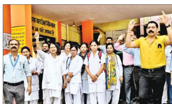
जिला अस्पताल में नारेबाजी करते अट्टेवा के पदाधिकारी।

उन पर भी की जा रही है। जो पिछले तीन वर्षों में जेल से छूटकर बाहर आए हैं और वह अपराध में सक्रिय हैं अथवा झगड़ा-फसाद करने में सक्रिय रहते हैं। ऐसे लोगों की संख्या करीब 7300 है। इनके विरुद्ध भी कार्रवाई के लिए पुलिस के चुनाव कार्यालय से उनका विवरण संबंधित थानों में भेज दिया गया है। इनमें कुछ ऐसे भी अपराधी हैं, जो जेल से रिहा होने के बाद भी अपराध में सक्रिय हैं। ऐसे लोगों के विरुद्ध पुलिस गुंडा अधिनियम में भी कार्रवाई की गई है। इनमें जेल से बाहर आए अपराधियों में वह लोग जो रंगदारी, डकैती, गृहभेदन आदि मामलों में लिप्त रहे हैं, उनके विरुद्ध कार्रवाई करने के लिए विवरण थानों पर भेजा है।