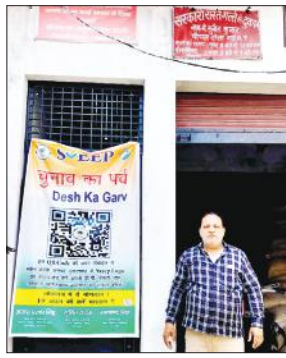
राशन की दुकान पर लगा पोस्टर।

लोकतंत्र में दें योगदान, 19 अप्रैल को करें मतदान, चुनाव का पर्व, देश का गर्व आदि संदेशों के माध्यम से स्वीप कार्यक्रम के अंतर्गत जिला निर्वाचन अधिकारी की ओर से मतदान प्रतिशत बढ़ाने की पहल लगाए गए हैं। वहां पर आने वाले ग्राहकों को भी पहले मतदान, फिर