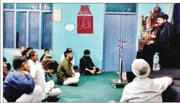
मजलिस को खिताब करते मौलाना।