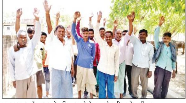
जगतपुर गांव में मतदान के बहिष्कार को लेकर नारेबाजी करते ग्रामीण।

अमृत विचार: पुल निर्माण की मांग कर रहे ग्रामीण भड़क गए। उन्होंने लोकसभा चुनाव में मतदान के बहिष्कार करने का निर्णय लिया है। क्षेत्र के जगतपुर गांव निवासी ग्रामीणों ने बुधवार को मतदान का बहिष्कार करते हुए प्रदर्शन किया। ग्रामीणों ने बताया कि उनकी ग्राम पंचायत में चार गांव शामिल हैं। जिनमें उनका जगतपुर का मझरा गांव पीलाखार नदी के पार है। उनकी कृषि भूमि नदी के उस पार है। प्रतिदिन कई बार नदी को पार कर कृषि कार्यों को अंजाम देते हैं। बरसात के मौसम में नदी के उपान पर होने के कारण उनको कृषि कार्यों को करने में बहुत परेशानी का सामना करना पड़ता है। उधर उनके पास में