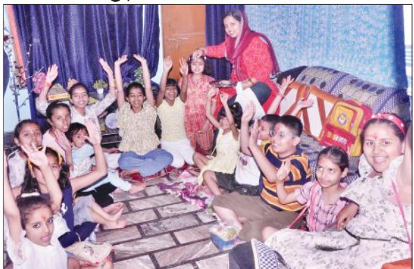
चन्दौसी के आवास विकास में कन्या-बरुआ को तिलक करती महिला श्रद्धालु।