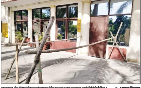
मतदान के लिए जिला पंचायत स्थित बूथ पर कराई गई बैरिकेडिंग। ● अमृत विचार

उधर, लोकसभा चुनाव कराने के लिए 3106 होमगार्ड भी बुलाए गए हैं। बस्ती से 494, सिद्धार्थ नगर से 450, संतकबीर नगर से