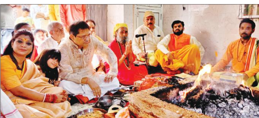
त्रिपुरेश्वरी शक्ति पीठ में यज्ञ में आहुति देते श्रद्धालु व अन्य।

चैत्र नवरात्र के नौवें दिन श्रद्धालुओं ने मां सिद्धिदात्री की पूजा-अर्चना की। घरों पर दुर्गा नवरात्र व्रत कथा, श्री दुर्गा चालीसा और आरती का पाठ कर अज्ञारी पूजन किया। मां की मूर्ति-चित्र के समक्ष ज्योति प्रज्वलित की और मां की अज्ञारी में घी, हवन सामग्री, लौंग, कपूर, धूप आदि अर्पित कर पूजन किया। कई श्रद्धालुओं ने नवमी पूजन के साथ हवन भी करवाया। दोपहर को घरों में महिलाओं ने माता के छंद गाए और कीर्तन किया। कन्या-बरुओं को भोजन खिलाकर तिलक किया और देवी स्वरूप कन्याओं का आशीर्वाद लिया। नगर के श्री त्रिपुरेश्वरी शक्तिपीठ, श्री मनोकामना मंदिर,