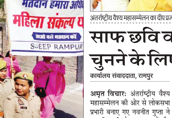
● अमृत विचार

के साथ लोगों को 19 अप्रैल को अपने बूथ पर पहुंचकर आवश्यक रूप से मतदान करने के लिए जागरूक किया। प्रभारी अधिकारी स्वीप मुख्य