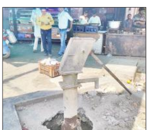
ऑबेडकर चौराहे पर खराब हैंडपंप।

2022 के विधानसभा चुनाव से पहले विधायक राजबाला ने नगर क्षेत्र व कई गांवों में शीतल प्याऊ लगवाए थे। नगर क्षेत्र में सरकारी अस्पताल, तहसील परिसर, रेलवे क्रॉसिंग पटवाई रोड तिराहा, हाईवे स्थित भैरों बाबा के