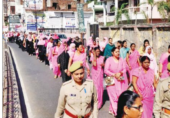
संकल्प यात्रा में शामिल महिलाएं व अन्य।

जिले में 19 अप्रैल को मतदान होगा। शहर स्थित स्टार चौराहे से शाहबाद गेट तक 500 महिलाओं ने महिला संकल्प यात्रा प्रकृति में मतदाताओं की अहम भागीदारी का हिस्सा है। सभी मतदाता अपनी जिम्मेदारी समझें और स्वयं अपने मताधिकार का प्रयोग करें तथा अपने आसपास के लोगों को भी मतदान के लिए प्रेरित करें।