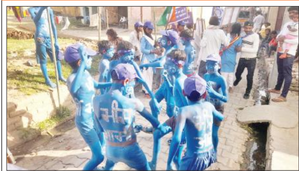
आंबेडकर शोभायात्रा में नृत्य करते बच्चे।