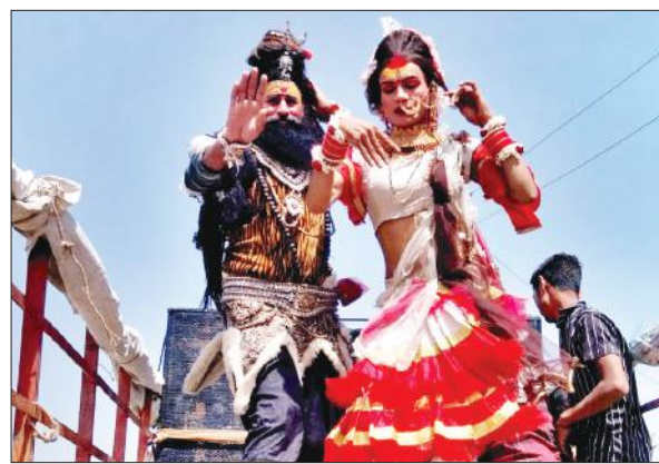
शोभायात्रा में शामिल शंकर और पार्वती की झांकियां।