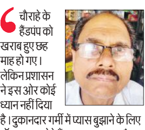
चौराहे के हैंडपंप को खराब हुए छह माह हो गए।

मंदिर, शाहजी नगर एवं हाईवे स्थित मंडी की दुकान में बने स्वयं के कैप कार्यालय में शीतल प्याऊ लगवाए गए थे। इन सभी प्याऊ ने दम तोड़ दिया। किसी भी प्याऊ से पानी की एक बूंद तक नहीं टपक रही है। सरकारी अस्पताल, तहसील परिसर में शीतल प्याऊ को देखकर टंडा पानी पीने को मन करता है लेकिन, उनके खराब होने के कारण लोग मायूस हो जाते हैं। तहसील के अधिकारी व कर्मचारी