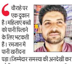
चौराहे पर एक दुकान है। महिलाएं बच्चों को पानी पिलाने के लिए भटकती हैं।

लेकिन प्रशासन ने इस और कोई ध्यान नहीं दिया है। दुकानदार गर्मी में प्यास बुझाने के लिए वॉटर कूलर लेते हैं।