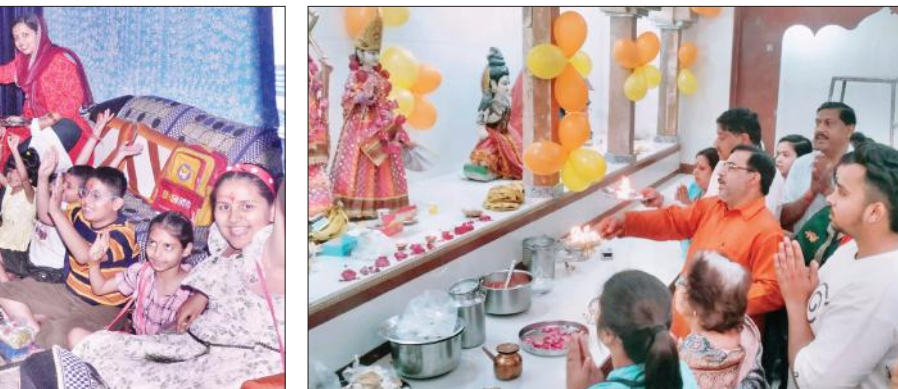
श्रीदेवी गंगा मंदिर में राम दरबार की आरती करते श्रद्धालु।

अठावरी चढ़ाने के लिए देवी भक्तों की भीड़ लगी रही। तत्पश्चात् घर पहुंच कर कन्या-बरुआ जिमाए। कन्याओं को तिलक