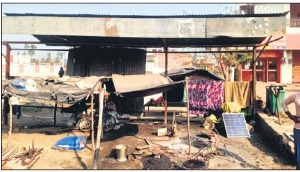
खुटार में बस अड्डे की जगह पर कुछ इस तिरपाल डालकर कब्जा कर लिया गया है।

काफी लंबे समय से बस अड्डा की मांग की जा रही है। इसके बावजूद इस लाभ से नगरवासी वंचित हैं। चुनाव के दौरान नेता इन्हीं मुद्दों को लेकर वोट ले लेते हैं, लेकिन जीतने के बाद ध्यान नहीं दिया जाता है। खुटार में रोडवेज बस अड्डा नहीं होने से इधर-उधर खड़े होकर इंतजार करते हैं।