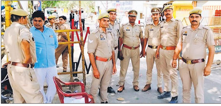
नामांकन प्रक्रिया के दौरान सुरक्षा में तैनात पुलिस कर्मी।