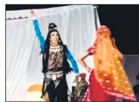
जागरण में सजी झांकी।

अमृत विचार: भुईंहार बाबा स्थान पर गुरुवार रात को दुर्गा जागरण हुआ। जहां कलाकारों ने सुंदर-सुंदर झांकियां प्रस्तुत कीं। साथ ही गायक कलाकारों के भजनों पर रातभर भक्त आनंद में डूबे रहे। शुकवार सुबह कन्या भोज हुआ और पूर्णागिरि धाम से लाई गई पवित्र ज्योति को विसर्जित कर दिया गया।