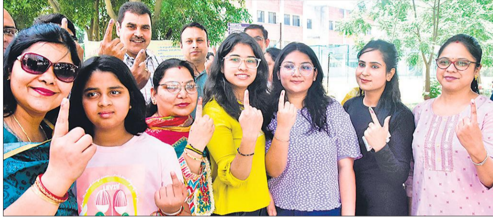
मुरादाबाद के आरएसडी एकेडमी पोलिंग बूथ पर मतदान के बाद उत्साही दिखे युवा।