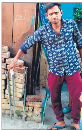
सरायकाइयां में टोंटी खोलकर दिखाता युवक।

अमृत विचार: सराय काइयां के लोगों को होली के बाद से ठीक से पानी की सप्लाई नहीं मिल पा रही है। होली पर कुछ देर के लिए पानी आया था और उसके बाद सप्लाई लड़खड़ा गई। खानापूर्ति करने के लिए जल निगम कभी पांच तो कभी दस मिनट पेयजल भेज रहा है। गर्मी बढ़ने के साथ-साथ यहां के लोगों की परेशानी भी बढ़ती जा रही है। स्थानीय लोग कई बार अधिकारी और जनप्रतिनिधियों से शिकायत कर चुके हैं, लेकिन पेयजल सप्लाई ठीक से नहीं मिल पा रही है। ऐसे में लोग परेशान हैं।