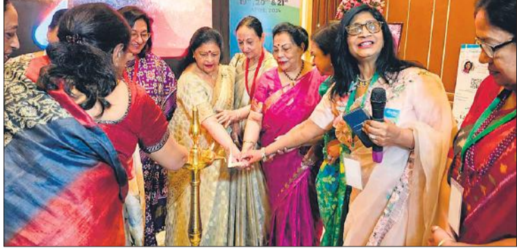
बरेली ऑब्स्टेट्रिक्स एंड गाइनोकॉलॉजिकल सोसायटी की 35वीं प्रादेशिक वार्षिक गाइनी कॉन्फ्रेंस और हैड्स ऑन कार्यशाला का दीप प्रज्वलित कर उद्घाटन करते अतिथि।