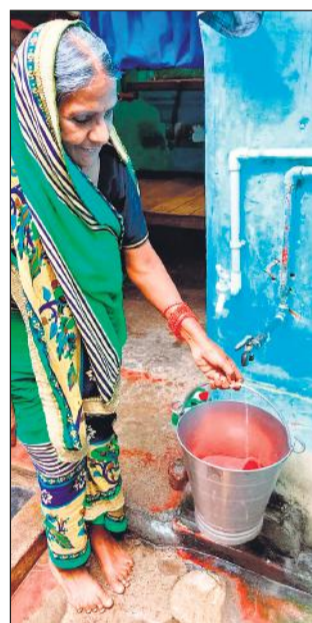
सरायकाइयां में शुकवार शाम कुछ मिनटों के लिए टंकी में पानी आया, लेकिन प्रेशर इतना कम था कि एक बाल्टी भरने में आधे घंटे से ज्यादा समय लग जाए।

पेयजल सप्लाई न मिलने के चलते मोहल्ले के लोग लगभग डेढ़ साल से परेशान हैं। इतना लंबा समय बीत गया है, लेकिन मोहल्ले में पानी नहीं आ रहा है, जिससे लोगों को परेशानी हो रही है।