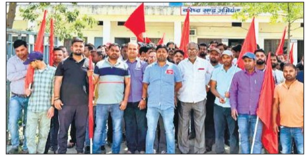
वशिष्ठ खंड अभियंता कार्यालय गेट पर प्रदर्शन करते नरमू से जुड़े रेलकर्मी।