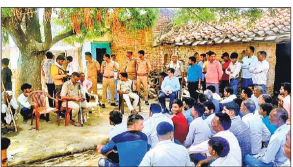
पुरैना में ग्रामीणों से बात करते प्रशासन व पुलिस के अफसर। ● अमृत विचार

अमृत विचार: मतदान को लेकर वैसे तो कई जगह से बहिष्कार के सुर उठे, लेकिन अफसरों के आशवासन देने पर लोग मान गए। मगर पुरैना गांव में मतदान का बहिष्कार करने वाले ग्रामीणों ने प्रशासन की भी नहीं सुनी। दिनभर ग्रामीणों को मनाने का सिलसिला चला। दोपहर में डीएम-एसपी खुद वहां पहुंचे और लोगों वार्ता की गई। मगर ग्रामीण पुल बनने तक मतदान का बहिष्कार करने का ठान चुके थे। मतदान केंद्र पर दिनभर टीमें मतदाताओं के आने का इंतजार करती रहीं, लेकिन कोई वोट डालने नहीं पहुंचा। खास बात यह रही कि