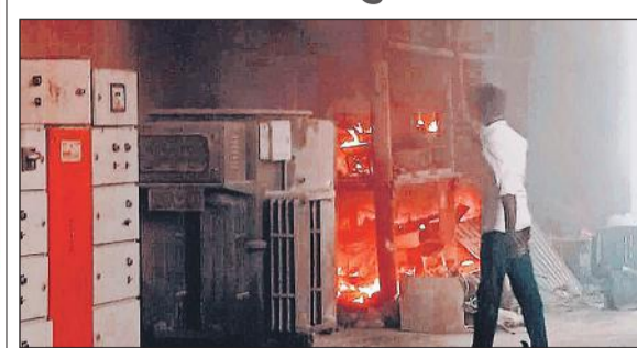
राइस मिल में लगी आग में जलता वारदाना।

राइस मिल में लगी आग, लाखों का वारदाना जला शॉर्ट सर्किट के चलते हुई घटना