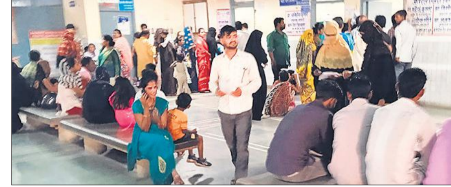
मेडिकल कॉलेज में ओपीडी में मरीजों की भीड़।

होली के बाद से तापमान दिन पर दिन बढ़ता जा रहा है। दोपहर होते ही लू चलने लगती है। लू के कारण लोगों का सड़क पर चलना मुश्किल हो गया है। मेडिकल कॉलेज में ओपीडी में गुरुवार को 1328 पर्चे बने थे और शुक्रवार को ओपीडी में 1410 पर्चे बने। सुबह नौ बजे डॉक्टरों के कक्ष के बाहर, पर्चा काउंटर तथा दवा काउंटर पर मरीजों की लंबी कतार लग जाती है। ओपीडी में बुखार, दस्त तथा लू लगने के