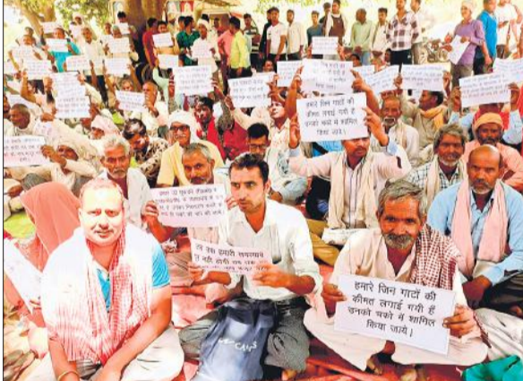
खुली बैठक में पोस्टर दिखाते ग्रामीण।