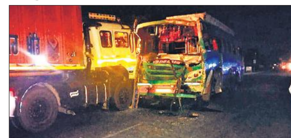
हादसे के बाद शतिग्रस्त वाहन।