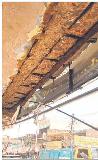
दुकान में घुसी बस से टूटा दुकान का छज्जा।

लोग बाइक सड़क पर खड़ी कर देते हैं। अतिक्रमण के चलते जाम लगने की नौबत हर वक्त रहती है। शुक्रवार सुबह करीब साढ़े