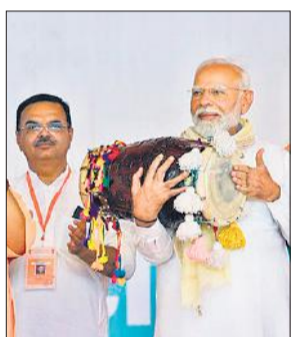
गजरोला (अमरोहा) की जनसभा में प्रधानमंत्री नरेंद्र मोदी।

प्रधानमंत्री ने विपक्ष पर भी जमकर कटाक्ष किए। कहा कि इंडी गठबंधन वाले सनातन से घृणा करते हैं। अभी मैं द्वारका गया और समुद्र में भगवान श्रीकृष्ण की पूजा की, लेकिन कांग्रेस के शहजादे कहते हैं कि समुद्र के नीचे पूजा करने योग्य कुछ है ही नहीं। हमारी हजारां वर्ष की आस्था और भक्ति को ये लोग सिर्फ वोट बैंक के लिए खारिज कर रहे हैं। कहा कि बिहार