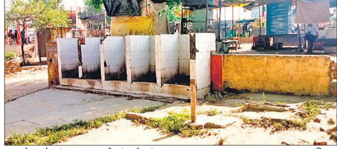
बस स्टेशन के अंदर लगा टूटा हैंडपंप और गंदा मूत्रालय।

संवाददाता, अल्हागंज अमृत विचार: परिवहन निगम की ओर से कस्बे में बनाया गया रोडवेज बस स्टेशन 40 वर्ष पूर्व अधूरा बनवाकर छोड़ दिया गया जो अभी भी ज्यों का त्यों अधूरा पड़ा हुआ है। वर्तमान में बस स्टेशन को चारदीवारी के अंदर एक बरामदा, कार्यालय और सुलभ शौचालय बना हुआ है। बस स्टेशन के अंदर यात्रियों के लिए बैठने की कोई व्यवस्था नहीं है। पेयजल के लिए लगा हैंडपंप टूटा पड़ा है। नाला ऊंचा होने की वजह से स्टेशन के अंदर कोई भी बस नहीं जाती, जिसके चलते यात्री धूप, वर्षा, गर्मी में नेशनल हाईवे के किनारे खड़े होकर बसों का इंतजार करते हैं। स्टेशन के अंदर अब खराब व कबाड़ प्राइवेट वाहन खड़े रहते हैं। निगम का कोई भी कर्मचारी या चौकीदारी नहीं रहता। आते जाते जनप्रतिनिधि देख कर भी खामोश रहते हैं। इसके विकास के प्रति उनकी लापरवाही आश्चर्य पैदा करती है। बैठने के लिए बेंच और सूचना के लिए पट न होने के चलते लोगों को भारी परेशानी होती है। 40 वर्ष पुराना है रोडवेज बस स्टेशन रोडवेज बस अड्डा लगभग 40 साल पुराना है। चारदीवारी बनाकर इसे छोड़ दिया गया था। 20 वर्ष पूर्व कस्बे के ही