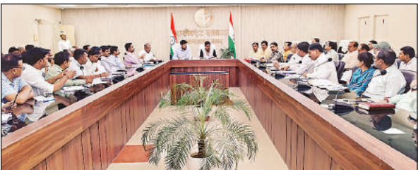
कलेक्ट्रेट सभागार में बैठक करते डीएम अविनाश सिंह व सीडीओ अनुराज जैन।

अमृत विचार। जिलाधिकारी अविनाश सिंह की अध्यक्षता में सीडीओ अनुराज जैन की उपस्थिति में कलेक्ट्रेट सभागार में भूसा दान, संरक्षित गोवंशों को भीषण गर्मी से बचाव और एमवीयू 1962 के संबंध में बैठक का आयोजन किया गया। बैठक के दौरान जिलाधिकारी ने संबंधित अधिकारियों को निर्देशित