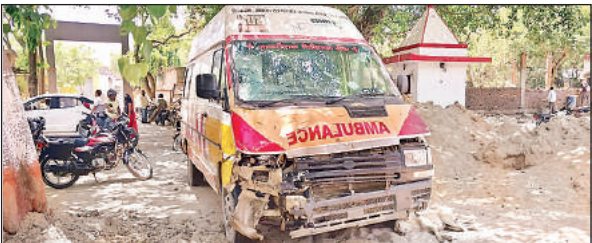
हादसे के बाद अकबरपुर कोतवाली लाई गई हादसा करने वाली एंबुलेंस।

अमृत विचार। अकबरपुर कोतवाली क्षेत्र के अकबरपुर ओवरब्रिज पर देर रात एंबुलेंस की चपेट में आने से एक ही बाइक पर सवार होकर बरात से घर वापस आ रहे तीन युवकों में दो की मौत हो गई। जबकि एक युवक गंभीर रूप से घायल हो गया। पुलिस ने घायल को जिला अस्पताल में भर्ती कराया। जहां उपचार के दौरान उसकी भी मौत हो गयी। मृतकों में सगे भाई शामिल हैं।