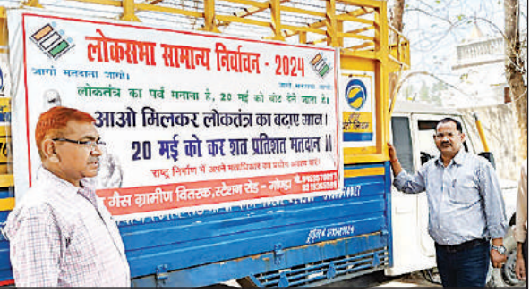
जागरूकता बैनर लगाकर सिलेंडर लदे वाहन को रवाना करते अधिकारी। अमृत विचार

अमृत विचार: 20 मई को जनपद में मतदान होगा। मतदान प्रतिशत बढ़ाने को लेकर जिला प्रशासन मतदाताओं को जागरूक करने के लिए लगातार कवायद कर रहा है। गैस एजेंसी के जो वाहन गैस सिलेंडर घरों में पहुंचाते हैं उन पर मतदाता जागरूकता का बैनर लगाकर लोगों को जागरूक किया जा रहा है। लोकतंत्र के महापर्व में सभी की भागीदारी हो इसको लेकर शासन प्रशासन लगातार कार्य कर रहा है। मतदान बढ़ाने को लेकर मतदाताओं को जागरूक किया जा रहा है। सभी लोग जागरूक हो इसके लिए जिला निर्वाचन हर संभव प्रयास कर रहा है। जिला पूर्ति विभाग