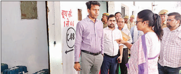
निर्वाचन कार्यालय में निरीक्षण के दौरान एसडीएम को दिशा निर्देश देती डीएम।

किया तथा इलेक्ट्रानिक वोटिंग मशीनों की कमिशनिंग के लिए की गई तैयारियों का जायजा लिया। भारत निर्वाचन आयोग के दिशा निर्देशों के अनुसार गल्ला मण्डी परिसर में संचालित कमिशनिंग कार्य को सुव्यवस्थित ढंग से सम्पन्न कराये जाने हेतु प्रत्येक विधानसभा क्षेत्रों में लगभग 25-25 कर्मचारियों को लगाया गया है। ईवीएम कमिशनिंग