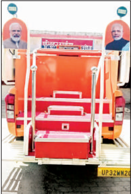
इसी रथ पर सवार होकर प्रधानमंत्री करेंगे रोड शो।

अमृत विचार : प्रधानमंत्री के नया घाट लता मंगेशकर चौक से बिड़ला धर्मशाला के बीच प्रस्तावित रोड-शो को लेकर केंद्रीय सुरक्षा और ख़फ़िया एजेंसियों ने कमान संभाल ली है। लखनऊ से रोड-शो के लिए रथ शुक्रवार को अयोध्या पहुंच गया। ड्यूटी में लगाए गए फ़ोर्स की आमद शुरू हो गई है। सुरक्षा में पुलिस विभाग के विभिन्न दस्तों के साथ सुरक्षा मुख्यालय की टीम लगाई जानी है। साथ ही चप्पे-चप्पे की निगरानी के लिए ड्रोन, सीसीटीवी समेत सर्विलांस आदि तकनीक का इस्तेमाल किया जा रहा है। जिले में डेरा डाले एसपीजी के अधिकारी पीएम व कार्यक्रम की सुरक्षा को लेकर निगरानी में जुटे हैं। बैठकों का दौर जारी है। साथ ही हिदायतें जारी की जा रही हैं। सुरक्षा और व्यवस्था को लेकर पीएम के