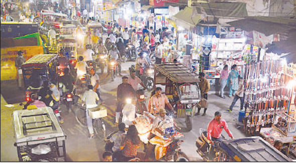
चौक में जाम लगने से फंसे राहगीर।