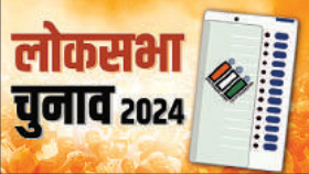
जिला संवाददाता, अंबेडकरनगर

अंबेडकरनगर, अमृत विचार । बीते दिवस दो घरों में शादी समारोह का जश्न था। इसके बाद बरात लड़क़ी के घर पहुंची। वर माला की रस्म पूरी की गई। इसके बाद पांव पूजने की रस्म शुरू हुई। दूल्हे के पैर की सभी उंगलियां न होने पर दुल्हन ने शादी मना कर दिया। इसके बाद दोनों पक्षों में हंगामा शुरू हो गया। मामला मंडप से उठ कर अकबरपुर कोतवाली पहुंच गया। जहां पर दोनों पक्ष और विवाह लगने वाले से पुलिस पूछताछ कर रही है। इब्राहिमपुर क्षेत्र के मुजाहिदपुर टडवां से बीती रात्रि अकबरपुर के सिझौली गांव में बरात आयी थी। पांव पूजने की रस्म के