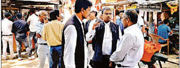
दीवानी न्यायालय परिसर में मौजूद वादकारी व अधिवक्तागण।