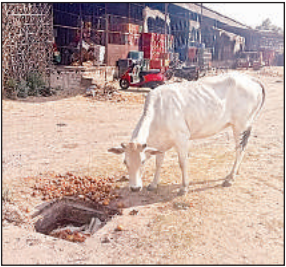
नानपारा मंडी में जमा गंदगी और सड़े आलू खाती गाय।