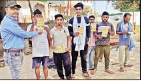
घर-घर आमंत्रण पत्र देते शिक्षक।

पयागपुर, बहराइच। जनपद में दो चरणों में लोकसभा का चुनाव होगा है। 13 मई को बहराइच लोकसभा को चुनाव होगा है, जबकि 20