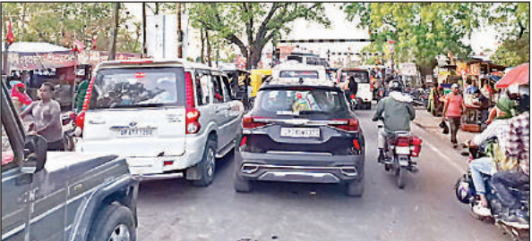
मनकापुर रेलवे क्राँसिंग पर लगा जाम।