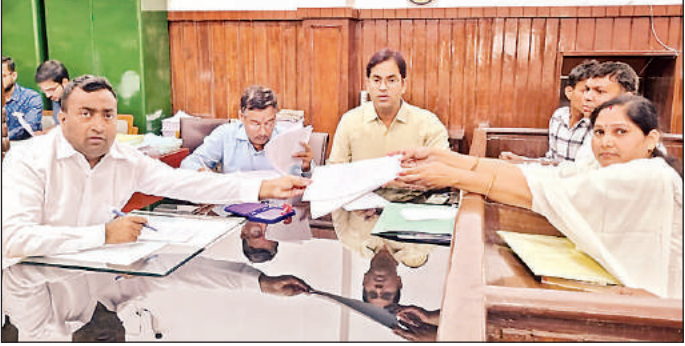
कलेक्ट्रेट में जिला निर्वाचन अधिकारी के समक्ष नामांकन पत्रों दाखिल करती महिला प्रत्याशी।