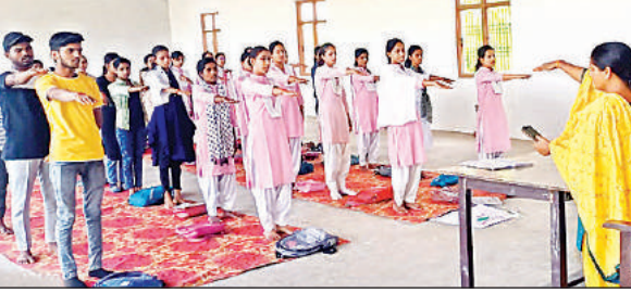
मतदान के लिए संकल्प लेते विद्यार्थी।

के अफसर गैस एजेंसी के माध्यम से लोगों को जागरूक कर रहे हैं। 72 गैस एजेंसी हैं जो पांच लाख से अधिक उपभोक्ताओं को प्रत्येक माह घरेलू गैस उपलब्ध करा रही हैं। प्रशासन की कोशिश है कि जो घरेलू गैस सिलेंडर उपभोक्ताओं के