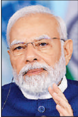
प्रधानमंत्री नरेंद्र मोदी।

वाले क्षेत्रों के साथ 20 मई को मतदान वाले क्षेत्र अयोध्या में रोड-शो का समय चुना। यह अपने आप में अहम है। इस पर सियासत से जुड़े लोगों की नजर है। तीन चरणों में मतदाताओं का रुझान, रामलला की प्राण प्रतिष्ठा के बाद उपजी श्रद्धा, श्रीराम मंदिर मुद्दे का सियासी ताप, दक्षिण के राज्यों में अयोध्या और काशी से उपजे सांस्कृतिक राष्ट्रवाद के प्रभाव को मापा जा रहा है। दौरे की पृष्ठभूमि में इसे देखा जा रहा है। एक मई को राष्ट्रपति द्रौपदी मुर्मू अयोध्या पहुंचीं। हालांकि यह उनकी धार्मिक यात्रा थी। रामलला का दर्शन-पूजन किया। भक्ति भाव में डूबी रहीं। अयोध्या की महत्ता का संदेश निकला। अयोध्या की