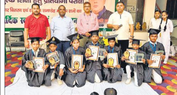
वार्षिकोत्सव में मेधावियों को सम्मानित करते अतिथि। ● अमृत विचार

मेधावियों को पुरस्कार देकर किया सम्मानित