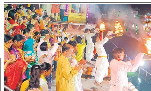
सोरो के हरि की पौड़ी घाट पर गंगा आरती में शामिल श्रद्धालु। ● अमृत विचार

शाम होते ही दूधिया रोशनी से जगमगा उठा हरि की पौड़ी घाट गंगा सप्तमी पर महा आरती का आयोजन