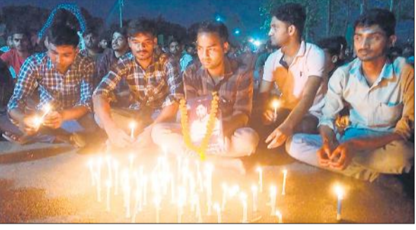
विश्वविद्यालय के गेट नंबर 2 पर बैठकर शांति प्रार्थना करते हुए छात्र।