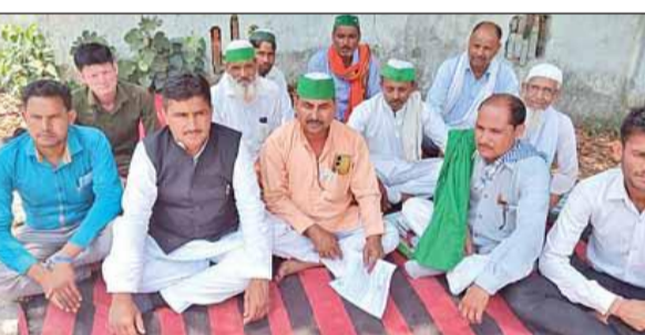
मालवीय आवास गृह पर धरना देते भाकियू चट्टनी कार्यकर्ता ।