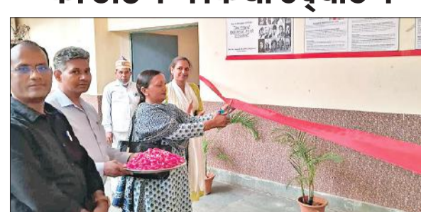
कलेक्ट्रेट में महिला कॉर्नर गैलरी का उद्घाटन करती डीएम सुधा वर्मा।

कलेक्ट्रेट में महिला कॉर्नर गैलरी का डीएम ने किया उद्घाटन