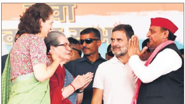
रायबरेली में एक मंच पर मौजूद सोनिया गांधी, राहुल गांधी, अखिलेश यादव व प्रियंका गांधी।

रायबरेली से प्रत्याशी राहुल गांधी ने प्रधानमंत्री नरेंद्र मोदी और भाजपा को आड़े हाथों लेते हुए जमकर सियासी प्रहार किया। उन्होंने कहा कि भारतीय जनता पार्टी और उनके नेता बेरोजगारी, महंगाई को लेकर कभी चर्चा नहीं करते हैं। संविधान को लेकर कहते हैं कि हमारी सरकार आने पर बदल देंगे, लेकिन कांग्रेस कभी बदलने नहीं देगी। उन्होंने कहा कि नरेंद्र मोदी से जो कहो वह बुलवा सकता हूँ, हम कहते हैं कि इंडिया गठबंधन की सरकार बनने पर महिलाओं, गरीबों के खाते में खटाखट पैसे आएंगे वहीं अब नरेंद्र मोदी भी कहते हैं कि हम बैंक अकाउंट में टकाटक-टकाटक-टकाटक-टकाटक पैसा डालेंगे। उन्होंने कहा कि नरेंद्र मोदी पहले ही हार मान मान चुके