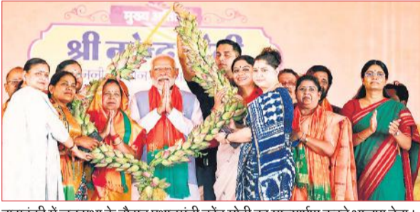
बाराबंकी में जनसभा के दौरान प्रधानमंत्री नरेंद्र मोदी का माल्यार्पण करते भाजपा नेता।

अमृत विचार : लोकसभा चुनाव के पांचवें चरण में 14 सीट के लिए सोमवार को होने जा रहे मतदान से पहले प्रधानमंत्री नरेंद्र मोदी ने प्रचार के लिए उत्तर प्रदेश पर भी ध्यान केन्द्रित किया। शुक्रवार को उन्होंने कांग्रेस और इंडिया गठबंधन पर बड़ा हमला बोलते हुए कहा है कि अगर कांग्रेस आई तो राममंदिर पर सुप्रीम कोर्ट का फैसला बदल देगी। मोदी ने कहा कि कांग्रेस राममंदिर पर बुलडोजर चलवा देगी। प्रधानमंत्री ने इंडिया गठबंधन को नसीहत भी दी कि उन्हें योगी जी से ट्यूशन लेना चाहिए कि कहां बुलडोजर चलाना है और कहां नहीं। बाराबंकी के जैदपुर मार्ग के समीप एक चुनावी जनसभा को संबोधित करते प्रधानमंत्री ने कहा कि कांग्रेस और सपा वालों ने पहले रामलला को टेंट में पहुंचाया, फिर वोटरों को खुश करने के लिए कहा