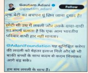
गौतम अदाणी का ट्विट।