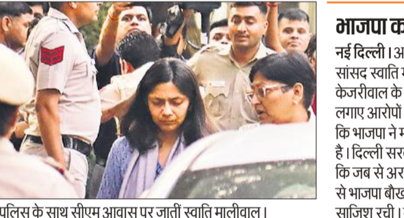
पुलिस के साथ सीएम आवास पर जाती स्वाति मालीवाल।