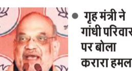
● गृह मंत्री ने गांधी परिवार पर बोला कराया हमला