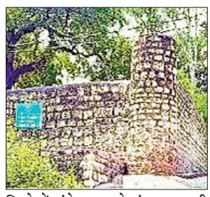
जिले में लंबे समय से संग्रहालय की जरूरत है, लेकिन सरकारी पहल के अभाव में यह जरूरत पूरी नहीं हुई।

अमृत विचार: जिले में ऐतिहासिक खजाने की भरमार है। सुरक्षा के अभाव में तमाम प्राचीन मूर्तियां चोरी हो चुकी हैं। तीर्थ नगरी सोरों में प्राचीन मूर्तियों के अलावा सैकड़ों वर्ष पुराने ताम्रपत्र, पांडुलिपियां अभी असुरक्षित हैं।