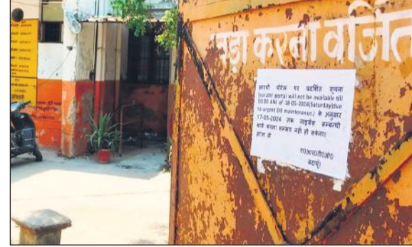
गेट पर चस्पा जानकारी।

गुरुवार सुबह अधिकारी और कर्मचारी कार्यालय पहुंचे। ड्राइविंग लाइसेंस की प्रक्रिया के