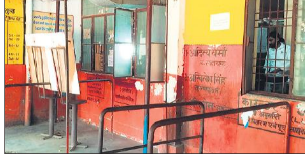
काम बंद होने की वजह से खिड़की के बाहर पसरा सन्नाटा।