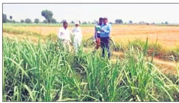
वनेई गांव में पेड़ी में कीटनाशक का छिड़काव करते किसान।