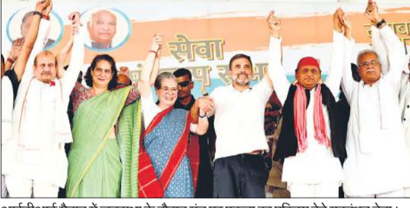
आईटीआई मैदान में जनसभा के दौरान मंच पर एकता का परिचय देते गठबंधन नेता।

अमृत विचार : रायबरेली से कांग्रेस प्रत्याशी राहुल गांधी के लिए उनकी मां और वरिष्ठ कांग्रेस नेता सोनिया गांधी ने शुक्रवार को जनसभा की। राहुल और प्रियंका गांधी अपनी मां सोनिया गांधी के बगल ही खड़े रहे। सोनिया गांधी ने काफी भावुक भाषण दिया और राहुल के लिए वोट मांगा। सोनिया गांधी ने शुक्रवार को आईटीआई मैदान से रायबरेली से रिश्तों की डोर को मजबूत करते हुए कहा कि आपके प्रेम में मुझे कभी अकेले नहीं पड़ने दिया। मेरा सब कुछ आपका दिया हुआ है। मैं आपको अपना बेटा सौंप रही हूं। जैसे आपने मुझे अपना माना, वैसे ही राहुल को