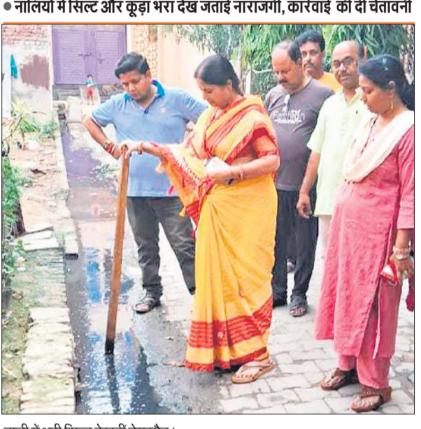
नाली में भरी सिल्ट देखतीं चेंयरमैन।

नालियों में सिल्ट और कूड़ा भरा देख जताई नाराजगी, कार्रवाई की दी चेतावनी