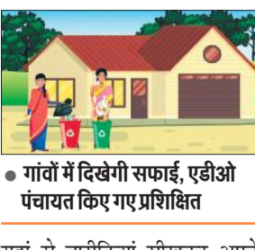
गांवों में दिखेगी सफाई, एडीओ पंचायत किए गए प्रशिक्षित

अमृत विचार : स्वच्छ भारत मिशन (ग्रामीण) के तहत प्रदेश के 43,256 गांव इस वर्ष के 31 दिसंबर तक मॉडल बनेंगे। गांवों को साफ-सफाई, कूड़ा, तरल व ठोस प्रबंधन जैसे प्रमुख कार्य से समस्या का निस्तारण कर चमकाया जाएगा। जहां साफ-सफाई अलग से दिखेगी। अभियान में पंचायती राज विभाग ने इस वित्तीय वर्ष में गांवों का चयन कर 29,347 गांव में कवायद शुरू कर दी है। सभी गांव मॉडल बनने के बाद अन्य को संदेश देंगे। बाहरी राज्यों के प्रधान व अधिकारियों का दल भी भ्रमण पर आएगा और