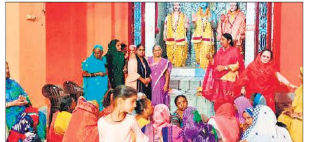
शहर के मानस मंदिर में सीता जयंती मनाती महिलाएं।