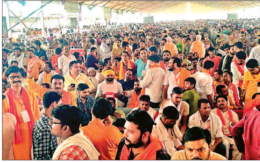
प्रधानमंत्री का भाषण सुनने के लिए पंडाल में बैठे लोग।

को नमन करता हूँ। बुंदेलखंड के लोग राष्ट्रहित के लिए सबसे आगे खड़े होने वाले लोग हैं। विरोधियों