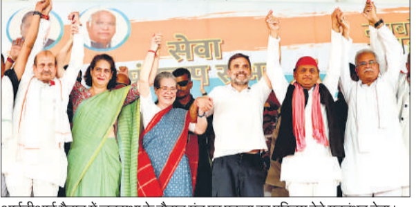
आईटीआई मैदान में जनसभा के दौरान मंच पर एकता का परिचय देते गठबंधन नेता।

अमृत विचार : रायबरेली से कांग्रेस प्रत्याशी राहुल गांधी के लिए उनकी मां और वरिष्ठ कांग्रेस नेता सोनिया गांधी ने शुक्रवार को जनसभा की। राहुल और प्रियंका गांधी अपनी मां सोनिया गांधी के बगल ही खड़े रहे। सोनिया गांधी ने काफी भावुक भाषण दिया और राहुल के लिए वोट मांगा। सोनिया गांधी ने शुक्रवार को आईटीआई मैदान से रायबरेली से रिश्तों को डोर को मजबूत करते हुए कहा कि आपके प्रेम में मुझे कभी अकेले नहीं पड़ने दिया। मेरा सब कुछ आपका दिया हुआ है। मैं आपको अपना बेटा सौंप रही हूं। जैसे आपने मुझे अपना माना, वैसे ही राहुल को अपना मानकर रखना है। राहुल आपको निराश नहीं करेगा। उन्होंने कहा कि मुझे खुशी है कि आज काफी समय के बाद आपके बीच की मेरा घर है। इंदिरा जी के दिल में रायबरेली के लिए एक अलग जगह थी। मैंने राहुल और प्रियंका को वही