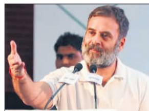
● राहुल गांधी ने कहा- सरकार बनी तो देगे अर्थव्यवस्था को गति

बुधवार को सपा प्रमुख अखिलेश यादव के साथ संयुक्त संवाददाता सम्मेलन को संबोधित करते हुए कांग्रेस अध्यक्ष मल्लिकार्जुन खरगे ने घोषणा की थी कि अगर विपक्षी गठबंधन इंडियन नेशनल डेवलपमेंटल इन्फ्रास्ट्रक्चर अलायंस (इंडिया) की सरकार सत्ता में आती है तो भाजपा सरकार की ओर से गरीबों को दिए जा रहे मुफ्त राशन की मात्रा दोगुनी कर दी जाएगी।