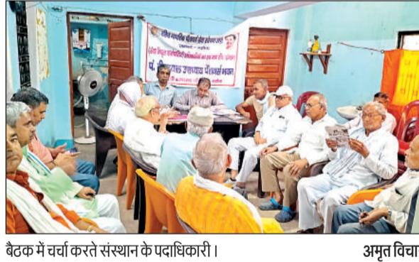
बैठक में चर्चा करते संस्थान के पदाधिकारी।

को वोट डालने के लिए निकलेंगे। उन्होंने हीटवेज बुजुर्गों के लिए काफी नुकसानदायक हो सकती है। उन्होंने लू व भीषण गर्मी से बचाव करने के लिए सुबह सबसे पहले मतदान केंद्रों पर लाइन लगाकर मतदान करने की अपील की।