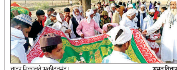
चादर निकालते अकीदतमंद।