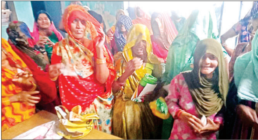
राशन न मिलने पर हंगामा करते राशनकार्ड धारक।

गौरतलब है कि 15 मई से खाद्यान्न सामग्री वितरण कार्य शुरू हो जाता है। कार्डधारक भी 15 मई से खाद्यान्न लेने के लिए सरकारी राशन की दुकानों पर पहुंच गए। दो दिन तक सर्वर की समस्या को देखते हुए कार्डधारक घंटों इंतजार करने के बाद भी सर्वर न आने पर