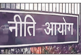
● दुनिया की शीर्ष 50 कंपनियों में भारत की सिर्फ एक बीमा कंपनी, शीर्ष 100 में केवल दो बैंक

सुब्रमण्यम ने यहां भारतीय उद्योग परिषद (सीआईआई) के वार्षिक व्यापार शिखर सम्मेलन में कहा कि सरकार को किसी भी क्षेत्र को प्रतिस्पर्धा से संरक्षण नहीं देना चाहिए।