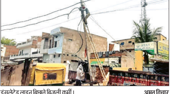
इंसुलेटेड लाइन बिछाते बिजली कर्मी।

अमृत विचार। पांच दशक पहले शहर में बिछाई गई बिजली लाइन के तार जर्जर होने से आर्एदिन टूटकर गिरने के खतरे को देखते हुए बिजली विभाग ने इंसुलेटेड बिजली के तार बिछाना शुरू कर दिया है। इससे एक तरफ जर्जर तार गिरने से होने वाली घटनाओं पर रोक लगेगी। साथ ही ग्रामीण अंचलों में बिजली के नंगे तारों से होने वाली बिजली चोरी पर भी अंकुश लगेगा, इससे सरकार को लाखों रुपये राजस्व का फायदा होगा। 1962 में महोबा शहर में बिजली की लाइन बिछाई गई थी। उस समय शहर में चंद मोहल्लों में ही बिजली कनेक्शन थे। स्ट्रीट लाइट जलाकर मांगों में रोशनी की जाती थी। वह भी चंद मार्गों पर बिजली की व्यवस्था थी। शहर से रेलवे स्टेशन तक उस