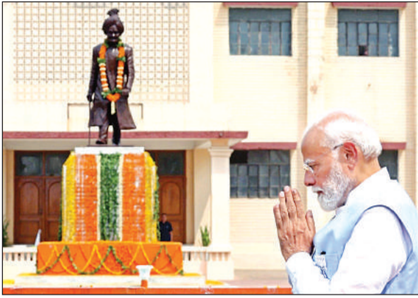
स्वामी ब्रह्मानंद महाराज की समाधि पर श्रद्धासुमन अर्पित करते मोदी।

दोपहर ठीक 2:05 बजे ब्रह्मानंद महाविद्यालय के मैदान में बने हेलीपैड पर प्रधानमंत्री नरेंद्र मोदी का हेलीकॉप्टर उतरा। हेलीकॉप्टर से उतरने के बाद नरेंद्र मोदी सीधे स्वामी ब्रह्मानंद महाराज की समाधि पर पहुंचे। जहां उन्होंने समाधि पर दंडवत होकर श्रद्धासुमन अर्पित किए। यहां भी मोदी को देखने के लिए दूर तक हजारों लोगों की भीड़ खड़ी नजर आई। इसके बाद मोदी 2:25 बजे ब्रह्मानंद इंटर कॉलेज के मैदान में बने जनसभा पंडाल में पहुंचे। जहां पर मंच पर भाजपा नेताओं और भाजपा प्रत्याशियों ने उनका स्वागत किया। प्रधानमंत्री मोदी ने अपना संबोधन भारत माता की जय के साथ शुरू किया। इसके बाद उन्होंने कहा कि पूरे गांव गांव से इतनी जनता आई तो उन्हें हममार राम राम। मोदी के इस बात पर लाखों की तादाद में बैठी जनता मोदी-मोदी के नारे लगाने लगी। प्रधानमंत्री मोदी ने कहा मैं माता बड़ी चंद्रिका और