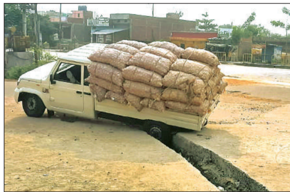
नाले में फंसी लोड पिकअप।

अमृत विचार। शुक्रवार सुबह चार बजे सागर की तरफ से प्याज लादकर आ रहा पिकअप वाहन के दो पहिए नाले में चले गए, जिससे वाहन पलटने से बाल बाल बच गया। वाहन न पलटने से चालक को भी सुरक्षित निकाल लिया गया। शुक्रवार को सुबह सागर से नई पिकअप वाहन प्याज लादकर महोबा आ रहा था, जैसे ही पूलड हाउस कालोनी चौराहे के पास वाहन तेज गति से आया तब तक वह चौराहे के बीचो बीच बन नाले को देखकर कुछ समझ पाता तब तक वाहन के दो पहिए नाले में चले गए, जिससे पिकअप वाहन पलटते नाले का कोई इंतजाम नहीं किया। निर्माण कार्य में पानी आने से बढ़ रही दिक्कत को देखते हुए सड़क के बीचो बीच नाला बना दिया।