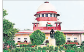
● कोर्ट ने ये टिप्पणी भूमि से संबंधित मामलों में की जो हरियाणा के गांव के निवासियों के साक्षा इस्तेमाल वाली थी

श्री अदालत ने पंजाब और हरियाणा हाईकोर्ट की पीठ के फैसले के खिलाफ अपीलों के एक समूह पर फैसला सुनाया था, जिसने हरियाणा ग्राम सामान्य भूमि (विनियमन) अधिनियम 1961 की धारा 2 (जी) की उप-धारा 6 की वैधता की जांच की थी। गुरुवार को दिए गए फैसले में न्यायमूर्ति बीआर गवई और न्यायमूर्ति उच्च महता की पीठ ने कहा कि जब उच्च न्यायालय का फैसला 1966 में शीर्ष अदालत की संविधान पीठ