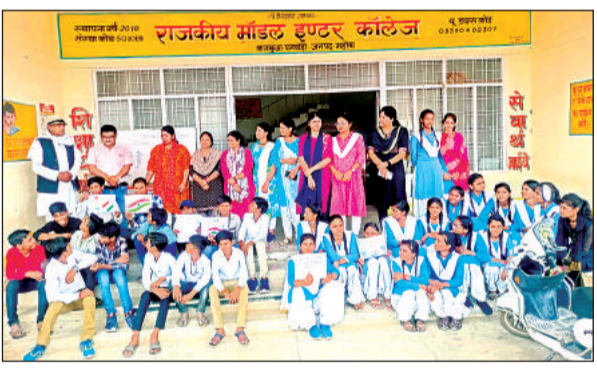
रैली के बाद विद्यालय में पंपलेट लिए बैठे छात्र-छात्राएं व शिक्षक।

अमृत विचार। पंडित दीनदयाल उपाध्याय राजकीय मॉडल इंटर कालेज कनकुआ के छात्र-छात्राओं ने स्वीप कार्यक्रम के तहत रैली निकाली। वही विकासखंड पनवाड़ी के आठ ग्रामों में बाइक रैली निकाली गई। वहीं पूर्व माध्यमिक विद्यालय तेइया में हस्ताक्षर अभियान चलाया गया। सभी कार्यक्रमों में 20 मई को होने वाले मतदान में सारे काम छोड़कर पहले मतदान करने के लिए ग्रामीण मतदाताओं को प्रेरित किया गया। इस मौके पर मुख्य वक्ता कालेज के प्रधानाचार्य ने मतदान की महत्ता पर प्रकाश डाला गया। विकासखंड पनवाड़ी क्षेत्र के