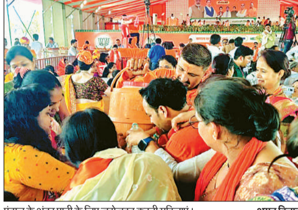
पंडाल के अंदर पानी के लिए जलजोहद करती महिलाएं।

पर निशाना साधते हुए कहा कि जिसको 4 जून का नतीजा जानना हो वह बुंदेलखंड में यह नजारा आकर देख लें। बुंदेलखंड कह रहा है एक बार मोदी सरकार मोदी सरकार।