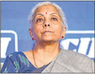
● उत्पाद निर्माण और नीति समर्थन में अधिक परिष्करण को किया रेखांकित

वित्त मंत्री निर्मला सीतारमण ने शुक्रवार को कहा कि देश को वैश्विक मूल्य श्रृंखला में अपनी हिस्सेदारी बढ़ाने और आत्मनिर्भर बनने के लिए अपने विनिर्माण क्षेत्र में तेजी लाने की जरूरत है। सीआईआई वार्षिक व्यापार शिखर सम्मेलन में भारतीय उद्योग के प्रमुखों को संबोधित करते हुए मंत्री ने उत्पादन निर्माण और नीति समर्थन में अधिक परिष्करण हासिल करने की आवश्यकता को भी रेखांकित किया। सीतारमण ने कहा कि मैं कुछ अर्थशास्त्रियों द्वारा दी गई इस सलाह के विपरीत कुछ रेखांकित करना चाहती हूँ कि भारत को अब विनिर्माण पर ध्यान नहीं देना चाहिए या विनिर्माण में तेजी नहीं लानी चाहिए। मैं इस तथ्य पर जोर देना चाहती हूँ कि विनिर्माण में वृद्धि होनी चाहिए। भारत को नीतियों की मदद से वैश्विक मूल्य