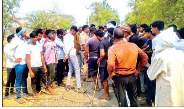
मनकी मार्ग में जाम लगाए ग्रामीण।