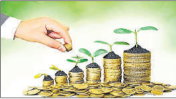
● भारत कई पश्चिमी कंपनियों के लिए एक वैकल्पिक निवेश का स्रोत या गंतव्य बन