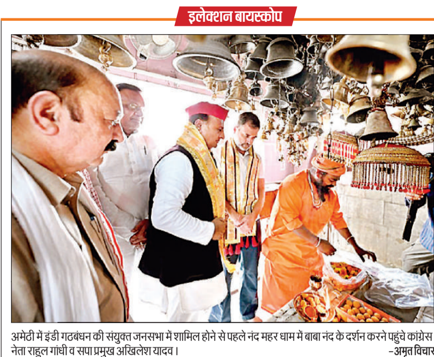
अमेटी में इंडी गठबंधन की संयुक्त जनसभा में शामिल होने से पहले नंद महर धाम में बाबा नंद के दर्शन करने पहुंचे कांग्रेस नेता राहुल गांधी व सपा प्रमुख अखिलेश यादव।