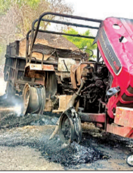
ग्रामीणों द्वारा लगाई आग से जला ट्रैक्टर।

पुलिस ने स्थानीय सीएचसी में भर्ती कराया। जहां हालत गंभीर होने पर चिकित्सकों ने जिला अस्पताल रेफर कर दिया। वहीं गुस्साए ग्रामीणों ने कुरारा मनकी मार्ग पर शव रखकर जाम लगा दिया। सूचना पहुंची पुलिस व ग्रामीणों की घंटों नोकझोंक होती रही। ग्रामीणों ने शव ले जाने से मना कर दिया और ट्रैक्टर में आग लगा दी। जिससे ट्रैक्टर धू धू कर