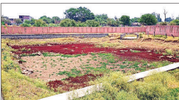
सूखा पड़ा पाथामाई का तालाब।

कस्बे में तीन दशक पूर्व तक एक दर्जन तालाब थे। चक्रवर्ती न होने के कारण कुछ भूमाफियाओं ने निजी अंतिम बलाकर तालाब में अवैध ढंग से प्लांटिंग करके उनका अस्तित्व ही समाप्त कर दिया