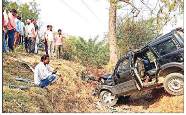
खाई में पलटी स्कॉर्पियो गाड़ी।