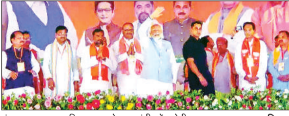
मंच पर जनता का अभिवादन करते प्रधानमंत्री नरेंद्र मोदी।