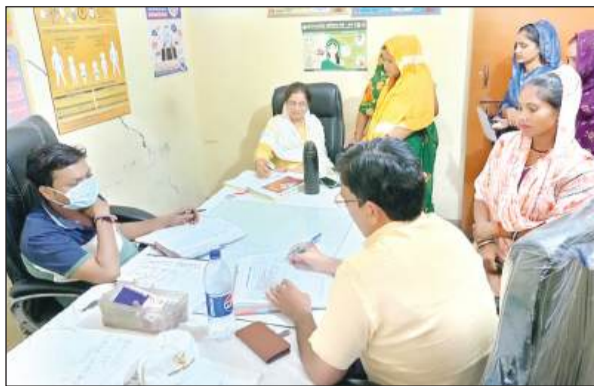
मरीजों को देखते चिकित्सक।