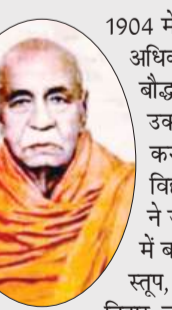
बौद्ध स्थल के साथ, स्कूल व जनसुविधाओं के लिए निर्माण कराए आयुर्वेद चिकित्सा व ज्योतिष के जानकार लोगों को निशुल्क सेवा करते रहे।

गौतम बुद्ध की महापरिनिर्वाण वाली मुद्रा की प्रिताम ब्रह्मणियों के चंगुल से न निकलते बुद्ध भिक्षू चन्द्रमणि अकेले ही इंग्लैंड के अधिकारियों से मिलने