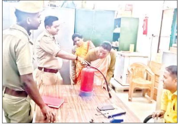
कर्मचारियों को अग्निशमन यंत्र का प्रशिक्षण देता दमकल विभाग।

भीषण गर्मी को देखते हुए उच्चाधिकारियों के आदेश पर जिला अग्निशमन विभाग की टीम एक के बाद एक कार्यालयों, अस्पतालों में निरीक्षण कर अग्निशमन यंत्रों का जायजा लेने में जुटी हुई है, जिससे