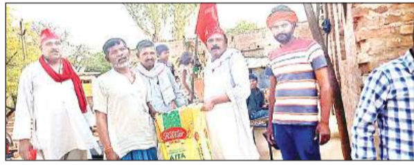
अनाज मांगों अभियान चलाते भाकपा माले के नेता।