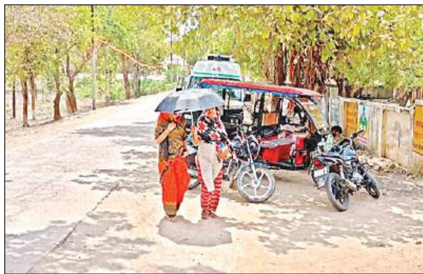
धूप से बचाव के लिए छाता लगाकर गुजरती महिलाएं।