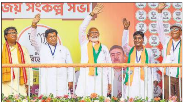
प्रधानमंत्री नरेन्द्र मोदी पश्चिम बंगाल के मथुरापुर में लोकसभा चुनाव के लिए रैली के दौरान जनता का अभिवादन करते हुए।

मोदी ने यह भी दावा किया कि राज्य की तृणमूल कांग्रेस सरकार फर्जी जाति प्रमाण पत्र जारी कर मूल ओबीसी (अन्य पिछड़ा वर्ग) के अधिकार मुसलमानों को दे रही है। उन्होंने कहा-बंगाल के सीमावर्ती क्षेत्रों में जनसांख्यिकी को