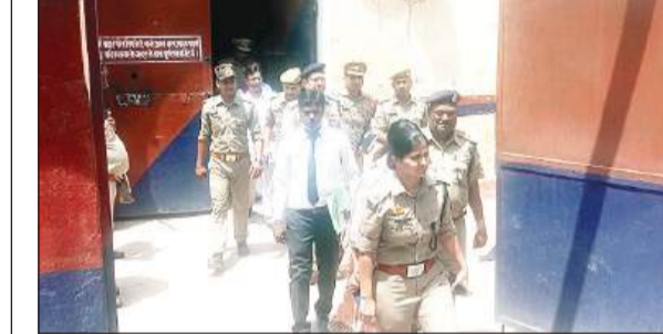
जिला कारागार का निरीक्षण कर निकलते अधिकारी।