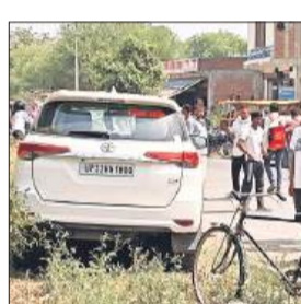
हादसे के बाद खड़ी फांच्यूनर कार।