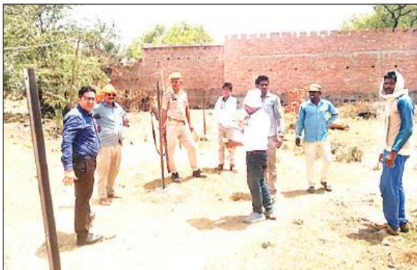
मौके पर राजस्व विभाग और पुलिस के साथ मौजूद एसडीएम।

अमृत विचार। कस्बा चरखारी के मोहल्ला गुमानपुरा की एक बस्ती की भूमि को दबंगों ने अपनी जागीर बताते हुए चारों तरफ तार लगाकर बस्ती को घेर दिया, जिससे बस्ती वालों के बीच हड़कंप मच गया। चार पीढ़ियों से इस बस्ती में रहते आए लोगों ने उपजिलाधिकारी और पुलिस अधिकारियों को शिकायती पत्र सौंपा। शिकायती पत्र मिलने पर मौके पर पुलिस के साथ पहुंचे अधिकारियों ने तार हटवाया। साथ ही हैडपंप पर दबंग द्वारा किए गए कब्जे को भी हटाया। अधिकारियों के पहुंचने के बाद बस्तीवासियों ने राहत की सांस ली। नगर पालिका परिषद के वार्ड जयंतनगर का मोहल्ला गुमानपुरा सुखियों में आ गया है। जहां पर बिजली, पानी, चिकित्सा और शिक्षा का अभाव है। यहां के बाशिंदों को