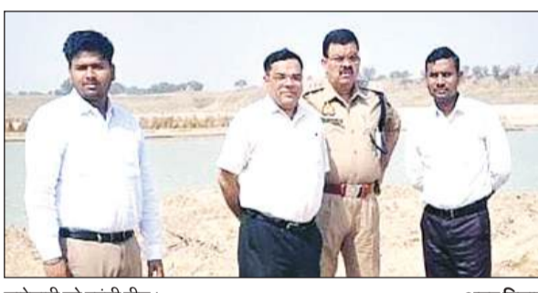
छापेमारी को पहुंची टीम।

मझिगवां मोरंग खदान में अवैध खनन, ओवरलोडिंग की जांच के लिए खनन अधिकारी, एसडीम खागा व क्षेत्राधिकारी खागा के साथ