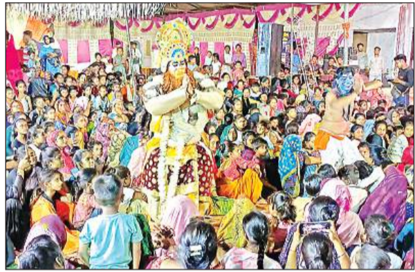
रासलीला में भगवान हनुमान का अभिनय करता कलाकार।

पंप कर्मों उसे निजी वाहन से कस्बे के प्राथमिक स्वास्थ्य केंद्र लेकर आए, जहां उपचार के बाद मैनेजर की हालत में सुधार है।