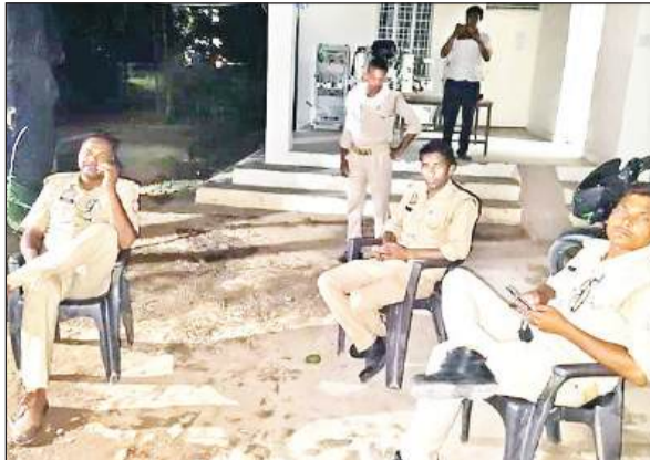
सुरक्षा की दृष्टि से सब स्टेशन में तैनात पुलिसबल।

देर रात बिजली कर्मचारियों ने मोहल्ले में पहुंचकर खामियों को दुरुस्त किया और कड़ी मशक्कत के बाद बुधवार की सुबह करीब 4 बजे विद्युत आपूर्ति बहाल हो सकी। गंगा नगर मोहल्ले की अव्यवस्था तो