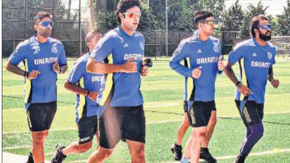
नासाऊ काउंटी मैदान पर ट्रेनिंग सत्र में दौड़ते भारतीय खिलाड़ी।

दूधिया रोशनी में दो महीने तक आईपीएल में प्रतिस्पर्धी क्रिकेट खेलने के बाद भारतीय क्रिकेट टीम ने विराट कोहली के बिना टी-20 विश्व कप के लिए सुबह ट्रेनिंग सत्र के साथ अपनी तैयारियां शुरू कर दी हैं। टी-20 विश्व कप में भारत के सभी शुरुआती मैच सुबह साढ़े 10 बजे शुरू होंगे इसलिए सुबह के ट्रेनिंग सत्र को तबज्जो दी गई।