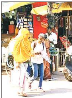
गर्मी से बचने को मुंह बांधकर जाती युवती।