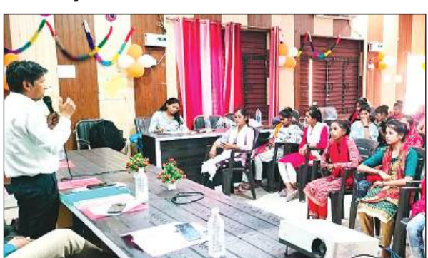
संवाद कार्यक्रम में हिस्सा लेती किशोरियां।

अमृत विचार। तरंग मेरे सपने मेरी उड़ान कार्यक्रम के तहत विकासखंड कार्यालय में जिला संवाद का आयोजन समर्थ फाउंडेशन की ओर से कराया गया। मुख्य अतिथि जिला प्रबंधक राष्ट्रीय किशोर स्वास्थ्य कार्यक्रम गौरीश पाल रहे। इसमें कुरारा क्षेत्र के एक दर्जन से अधिक गांवों की 35 से अधिक किशोरियों युवतियों ने भाग लिया। वहीं 10 गांवों में हुए सर्वे में पाया गया 105 किशोरियों ने कहा उन्हें सेनेटरी पैड उपलब्ध नहीं हो रहे हैं। गौरीश पाल ने कहा कि स्कूलों में शिकायत पेटिका इसी कार्यक्रम के तहत लगवाई जा रही हैं। हर