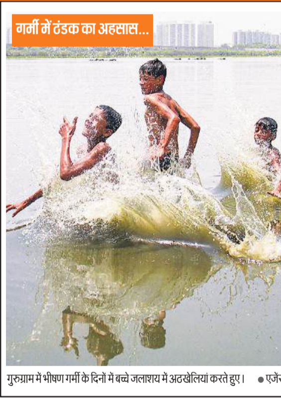
गुरुग्राम में भीषण गर्मी के दिनों में बच्चे जलाशय में अटखैलियां करते हुए।