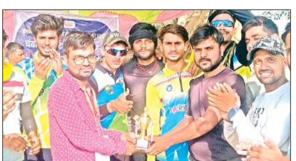
विजेता टीम के साथ अतिथि।

अमृत विचार। पंचनद: चंबल म्यूजियम द्वारा आयोजित चंबल क्रिकेट लीग सीजन-3 के 11वें दिन चौरैला ग्राउंड पर भिंड और बिठौली टीमों के बीच दूसरे राउंड का मुकाबला हुआ।