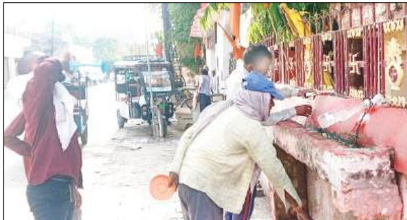
गर्मी में इस तरह घ्यास बुझाते देखे लोग।

हालत बिगड़ती देख परिजनों ने उन्हें आनन-फानन में जिला अस्पताल पहुंचाया, जहां डाक्टर ने उन्हें मृत घोषित कर दिया। दोआबा में बुधवार को 10.30 बजे ही हीटवेव कहकर बरपाने लगी। सड़कों पर चलना दुश्चर हो गया। वहीं नौ घंटे तक शहर का तापमान 40 डिग्री से ऊपर रहा। गांवों से शहर तक जनजीवन अस्त-व्यस्त नजर आया। भरी दुपहरी में घर, दुकान, मकान, गली-मोहल्ले, छतें भूभक उठे।