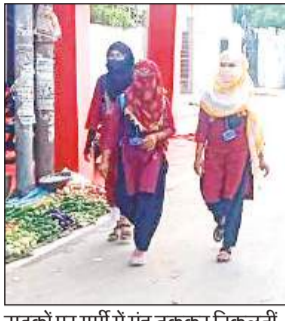
सड़कों पर गर्मी में मुह ढककर निकलती किशोरियां।