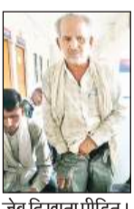
जोब दिखाता पीड़ित।