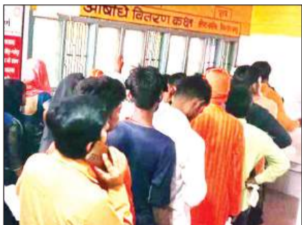
औषधि खिड़की में लगी मरीजों की भीड़।

जिला अस्पताल में बाल रोग विशेषज्ञ व जनरल फिजीशियन से लेकर इमरजेंसी में रोजाना उल्टी दस्त और बुखार पीड़ित बच्चे व बड़े पहुंच रहे हैं। इनमें गंभीर स्थिति वाली मरीजों को भर्ती कर लिया जा जाता है। जिला अस्पताल के मुताबिक प्रतिदिन 10 से 15 बच्चे और बड़े लोग डायरिया से पीड़ित