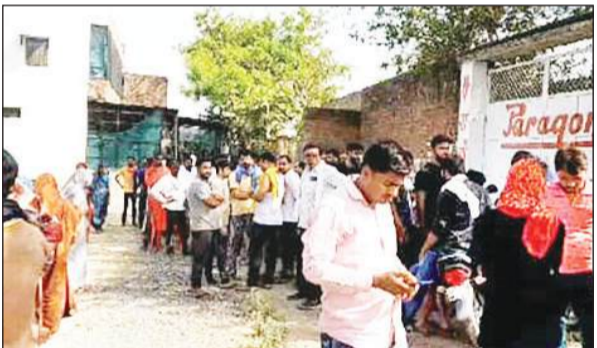
घटना स्थल के पास मौजूद लोग।

अमृत विचार। बचपन से एक ही जगह रहकर साथ पले बड़े, पड़े दो दोस्तों ने मंगलवार देर रात एक साथ विषाक्त का सेवन कर लिया। जानकारी होने पर मौके पर पहुंचे परिजनों ने उन्हें इलाज के लिए अस्पताल में भर्ती कराया, लेकिन उनकी मौत हो गई।