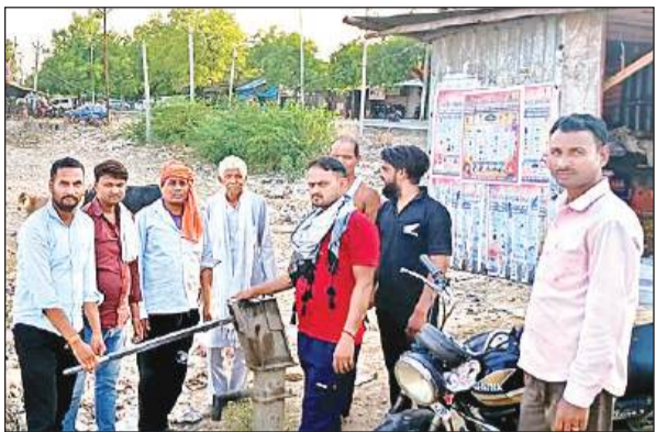
खराब हैडपंप दिखाते स्थानीय लोग।