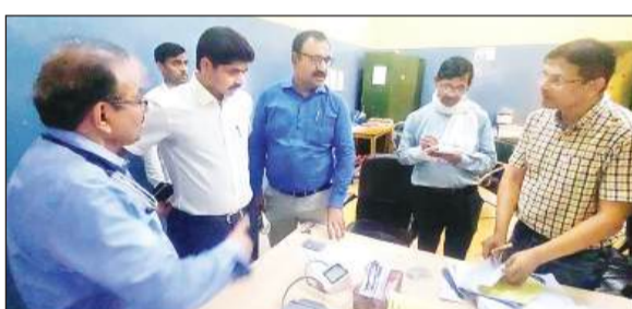
जिला अस्पताल का निरीक्षण करते एडीएम।

अमृत विचार। अपर जिलाधिकारियों ने जिला अस्पताल का औचक निरीक्षण करते हुए व्यवस्थाएं परखीं। गर्मी के महेनजर स्टोर में रखीं जीवन रक्षक दवाओं की जानकारी ली। अस्पताल व वार्डों में बने शौचालय में सफाई व्यवस्था का भौतिक सत्यापन किया। चिकित्सकों द्वारा मरीजों की दवाएं बाहर से लिखने पर अधिकारियों ने नाराजगी जताते हुए इस पर रोक लगाने के निर्देश दिए। जिलाधिकारी दुर्गा शक्ति नागपाल के निर्देश पर अपर जिलाधिकारी राजेश कुमार व एडीएम (न्यायिक) अभिताभ यादव ने बुधवार को संयुक्त रूप से जिला अस्पताल का औचक निरीक्षण किया। इस दौरान