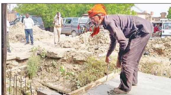
नाले की नाप करता राजमिस्त्री।