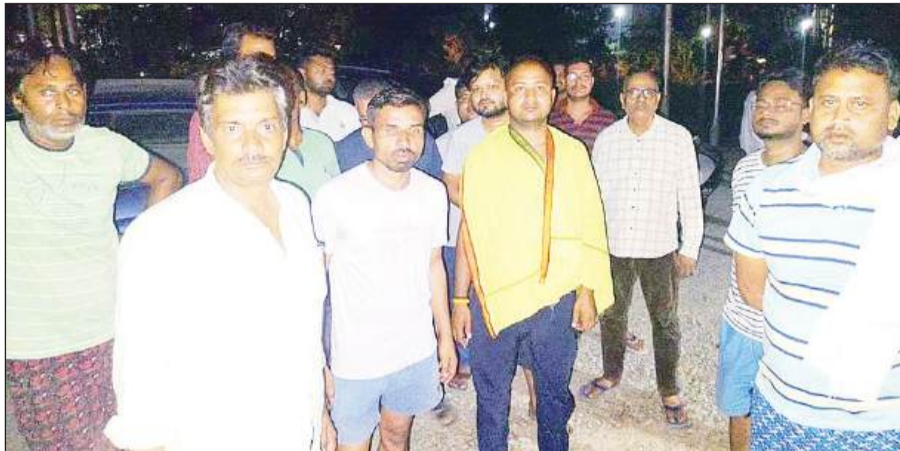
तुलसी नगर सब स्टेशन में हंगामा करते लोग।

शहर में जहां बीते चार दिनों से आसमान से आग बरस रही है, वहीं गर्मी के मौसम में ही बिजली आपूर्ति का रोना भी शुरू हो गया है। शहर के दर्जन भर मोहल्लों में बिजली की आवाजाही ने लोगों का जीना हराम कर रखा है। कभी बच्योटा की बिजली 24 घंटे के लिए टप हो जाती है तो कभी गंगानगर इलाके में लोग