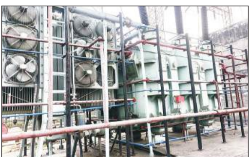
220 केवी विद्युत उपकेंद्र पर ट्रांसफार्मर में लगा मल्सीफायर सिस्टम।

अमृत विचार। वातावरण की गर्मी से विद्युत उपकेंद्रों में लगे ट्रांसफार्मर जहां ओवरहीट हो रहे हैं, वहीं 220 केवी विद्युत उपकेंद्र में ट्रांसफार्मरों को ठंडा करने के लिए आधुनिक मल्सीफायर सिस्टम लगाया गया है। यह ट्रांसफार्मर का तापमान बढ़ते ही स्वतः चालू हो जाता है और पानी की बौछार कर उसे ठंडा कर देता है। इस संयंत्र के माध्यम से ट्रांसफार्मर फुंकने से बच जाते हैं।