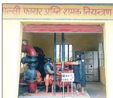
मल्सीफायर सिस्टम का नियंत्रण कक्ष। अमृत विचार

● मौसम की मार से 65 डिग्री सेंटीग्रेड तक पहुंच रहा ट्रांसफार्मरों का तापमान