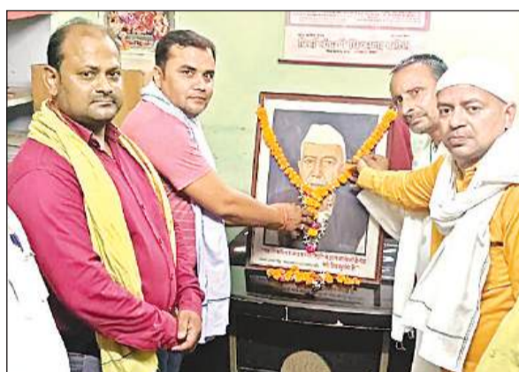
पूर्व प्रधानमंत्री को श्रद्धांजलि देते रालोद कार्यकर्ता।