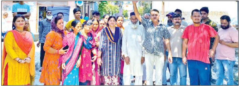
चौधरी कॉलोनी के पास पुराना ट्रांसफार्मर लगाने के बाद विरोध करते क्षेत्र के लोग।

पिछले दो दिन से क्षेत्र के लोग बिजली ठप होने से बेहाल हैं। भेषण गर्मी में एसी, पंखा, कूलर नहीं चलने से लोगों का घर के अंदर रहना मुश्किल हो गया है। स्थानीय लोगों ने विद्युत विभाग पर आरोप लगाते हुए कहा कि विभाग की लापरवाही से उन्हें परेशानी झेलनी पड़ रही है। कहा कि विभाग ने नए ट्रांसफार्मर के बजाय मरम्मत