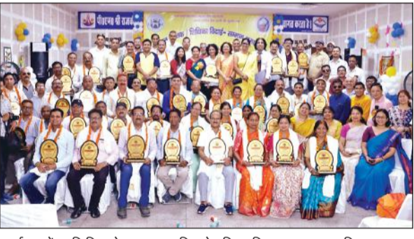
कार्यक्रम में स्मृति चिन्ह के साथ सम्मानित सेवानिवृत्त शिक्षक।