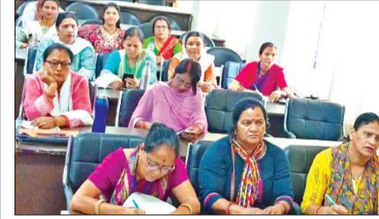
नगर निगम सभागार में बैठक के दौरान मौजूद बैणी सेना की महिलाएं।