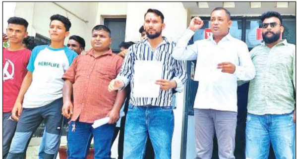
नगर निगम कार्यालय के बाहर प्रदर्शन करते दमुवाढूंगा के लोग।