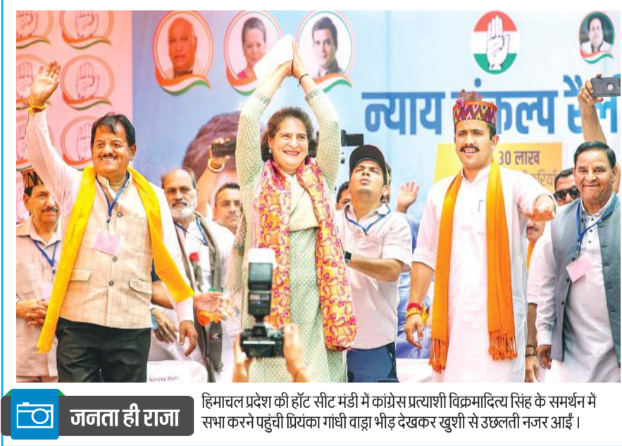
हिमाचल प्रदेश की हॉट सीट मंडी में कांग्रेस प्रत्याशी विक्रमादित्य सिंह के समर्थन में सभा करने पहुंची प्रियंका गांधी वाड़ा भीड़ देखकर खुशी से उछलती नजर आई।