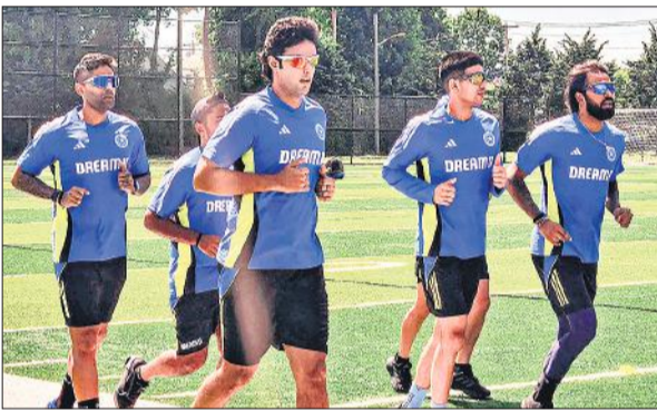
नासाऊ काउंटी मैदान पर ट्रेनिंग सत्र में दौड़ते भारतीय खिलाड़ी।

दूधिया रोशनी में दो महीने तक आईपीएल में प्रतिस्पर्धी क्रिकेट खेलने के बाद भारतीय क्रिकेट टीम ने विराट कोहली के बिना टी-20 विश्व कप के लिए सुबह ट्रेनिंग सत्र के साथ अपनी तैयारियां शुरू कर दी हैं। टी-20 विश्व कप में भारत के सभी शुरूआती मैच सुबह साढ़े 10 बजे शुरू होंगे इसलिए सुबह के ट्रेनिंग सत्र को तबज्जो दी गई।