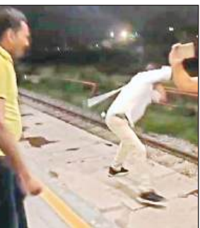
वायरल वीडियो से लिए गए स्क्रीन शॉट।

▶▶ अपने लिए खाना बनवाना चाहते थे दोनों सिपाही, वीडियो बनाने पर ओर भड़के,