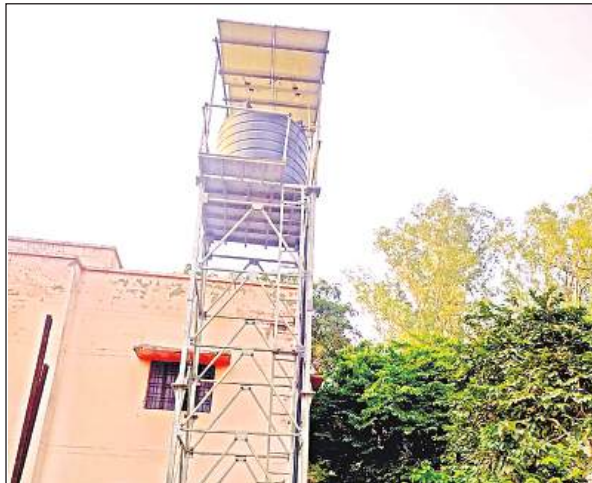
सीएचसी परिसर में लगा आरओ प्लांट।