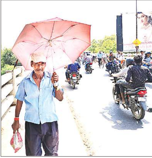
नवीन पुल पर छाता लगाकर धूप से बचाव करता व्यक्ति।

बाहर से आने वाले लोग पानी के लिये भटक रहे हैं। वहीं अन्ना मवेशियों के लिये भी अभी नाद नहीं रखवाई हैं। जिससे वह भी पानी के लिये परेशान हो रहे हैं।