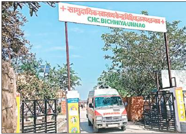
सीएचसी बिछिया में गेट से निकलती एंबुलेंस।