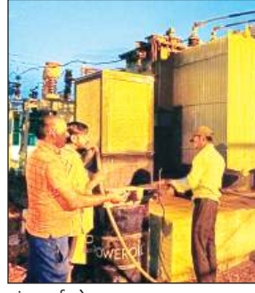
ट्रांसफार्मर के पास लगवाया गया कूलर।

पड़ रही भीषण गर्मी में जहां एक ओर आम जनमानस बेहाल हो गया है, अधिक गर्मी पड़ने के कारण स्पलाई देने वाले बड़े ट्रांसफार्मर भी अधिक हीट हो रहे हैं। गर्मी के