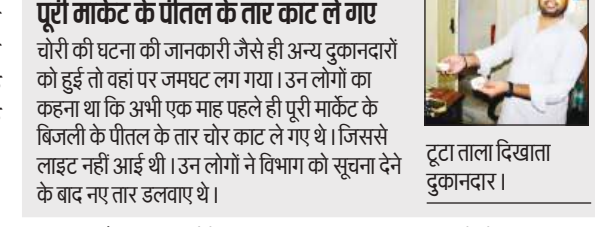
टूटा ताला दिखाता दुकानदार।

डीसीपी सेंट्रल ने मामले की गंभीरता को देखते हुए दुकान मालिक से लेकर वहां सुरक्षा के लिए तैनात सिवयोरिटी गार्ड से भी पूछताछ की। पुलिस को एक सीसीटीवी फुटेज मिला है, जिसमें एक नकाबपोश कैद हुआ है। आसपास के सीसीटीवी फुटेज खंगाले जाएंगे। दुकान के पीछे के भी सीसीटीवी फुटेज व आने जाने वाले रास्तों के फुटेज खंगाले जा रहे हैं।