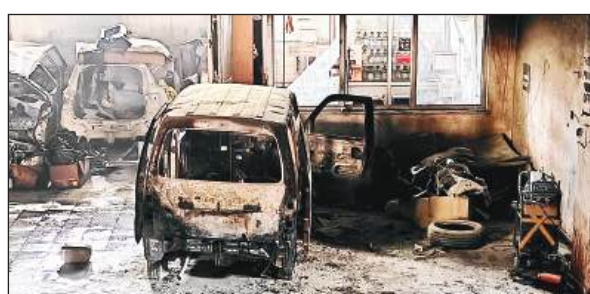
आग से जल गई कारें।