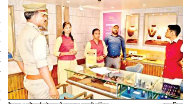
बैजनाथ ज्वैलर्स शोरूम में पूछताछ करती पुलिस।