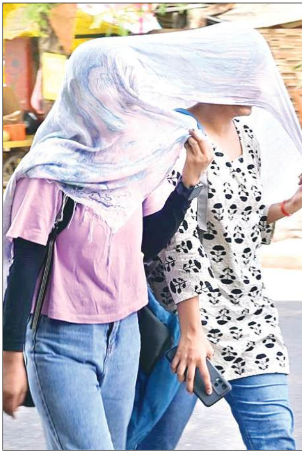
धूप से बचने को सिर ढककर चले लोग।

○ दिन का तापमान 46.8 डिग्री सेल्सियस पर पहुंचा ○ इससे पहले 1987 में काफी गर्म रही थी 29 मई