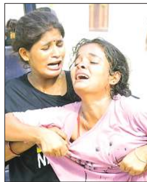
रोते बिलखते परिजन।