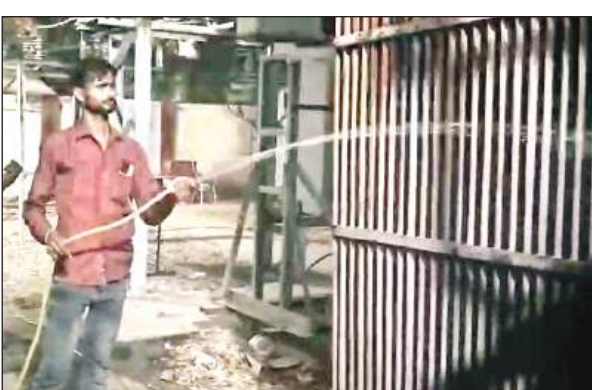
किदवाई नगर सबस्टेशन के वितरण ट्रांसफार्मर पर पानी डालती कर्मी। अमृत विचार