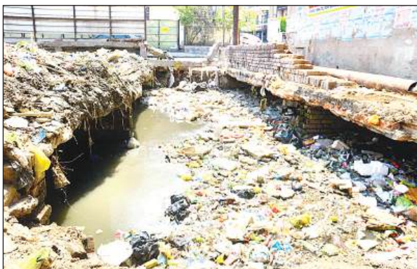
सीसामऊ नाले में पसरी गंदगी।

कानपुर में 26 से 28 जून के बीच मानसून दस्तक दे सकता है। ऐसे में समय से अगर नाला सफाई का कार्य पूरा नहीं हुआ तो शहर में जलभराव होना तय है। सीसामऊ नाला सफाई को लेकर पूरी ताकत लगा रखी है।