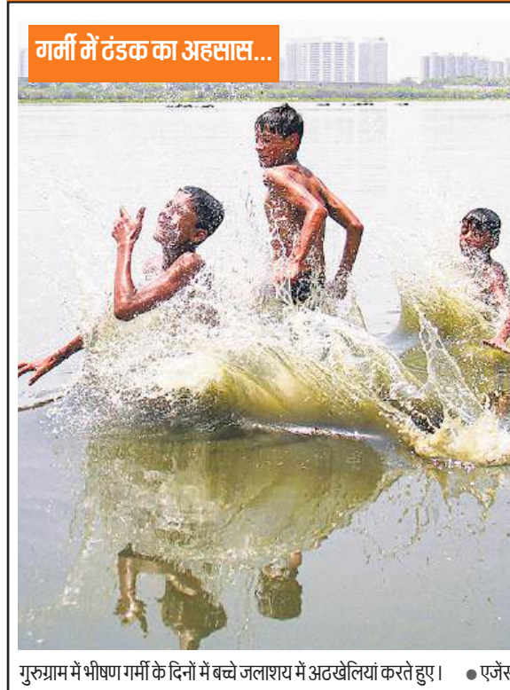
गुरुग्राम में भीषण गर्मी के दिनों में बच्चे जलाशय में अटखैलियां करते हुए।