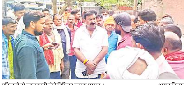
परिजनों से जानकारी लेते बिछिया ब्लाक प्रमुख।