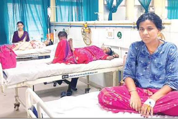
उर्सला अस्पताल के हीटस्ट्रोक वार्ड में भर्ती बीमार लोग।

अधिकांश मरीज बुखार, सिर, पेट में दर्द, उल्टी, कमजोरी, घबराहट, अधिक थकान व