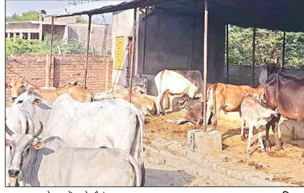
स्थानाभाव से धूप में खड़े गौवंश।