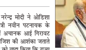
● कहा- 10 जून को ओडिशा में भाजपा की सरकार बनी तो विशेष समिति का गठन कर जाएंगे जांच

ये है कि नवीन बाबू की तबियत खराब होने के पीछे कोई घड्यंत्र है क्या? ये ओडिशा के लोगों को जानने का अधिकार है। कहीं इसमें उस लॉबी का तो हाथ नहीं है न जो नवीन बाबू के नाम पर पदों के पीछे ओडिशा की सत्ता भोग रहे हैं। प्रधानमंत्री ने कहा