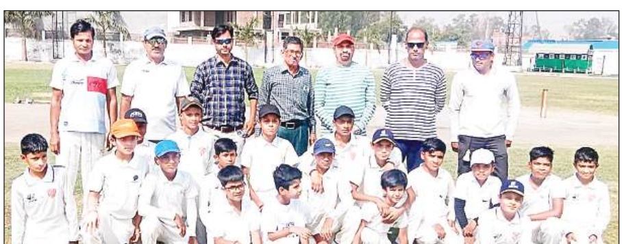
आयोजकों के साथ खिलाड़ी।