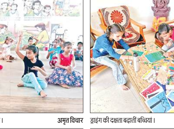
झ्रॉंग की दक्षता बढ़ाती बच्चियां।