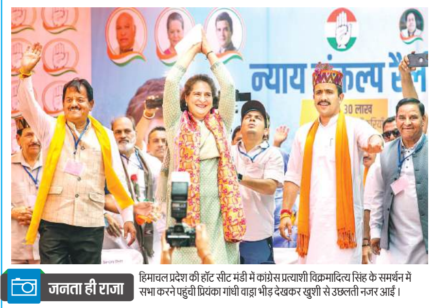
हिमाचल प्रदेश की हॉट सीट मंडी में कांग्रेस प्रत्याशी विक्रमादित्य सिंह के समर्थन में सभा करने पहुंची प्रियंका गांधी वाड़ा भीड़ देखकर खुशी से उछलती नजर आई।