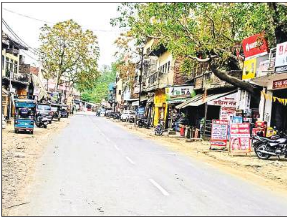
बुधवार की दोपहर चौबेपुर कस्बे की सड़क पर सन्नाटा पसरा रहा। अमृत विचार

अमृत विचार। नौतपा की तपन ने लोगों को बेहाल कर दिया है। सुबह से ही निकल रही चटकर धूप से जनजीवन प्रभावित है। बुधवार को भी तन झुलसाने वाली सूरज की किरणों ने लोगों को घरों में कैद रहने के लिए विवश कर दिया। दोपहर आसमान में छाई हल्की बदली ने राहत के बजाय उमस और भी बढ़ा दी। बड़े तापमान से दोपहर जीटी रोड समेत प्रमुख मार्गों पर सन्नाटा पसरा नजर आया।