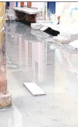
रतूपुरवा में भरा सीवर का पानी।