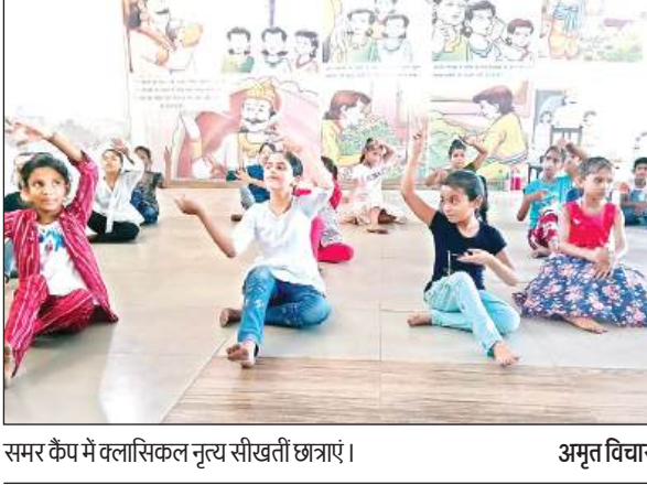
समर कैंप में क्लासिकल नृत्य सीखती छात्राएं। अमृत विचार

अमृत विचार। बीघापुर तहसील व ब्लाक क्षेत्र के गौरी गांव स्थित एमएम पब्लिक स्कूल में चल रहे समर कैंप में बड़ी संख्या में छात्र-छात्राएं शामिल हैं, जहां वह जमकर मस्ती करते हुए बाहर से बुलाए गए प्रशिक्षकों से गीत-संगीत, शास्त्रीय नृत्य, ड्रामा व कराटे सहित विभिन्न खेलों की वारीकियां भी सीख रहे हैं। कैंप समापन 31 मई को छात्र-छात्राएं सीखे गए हुनर का प्रदर्शन करेंगे।