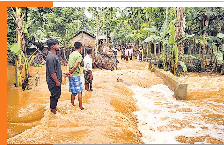
तबाही के निशान

नजर रख रही है। हासन लोकसभा सीट से राष्ट्रीय जनतांत्रिक गठबंधन (राजग) के प्रत्याशी के तौर पर फिर से चुनाव लड़ रहे रेवन्ना यह खबर सामने आने के तुरंत बाद विदेश भाग गए थे कि कर्नाटक राज्य महिला आयोग ने मुख्यमंत्री सिद्धरमैया से उन आपत्तिजनक वीडियो की जांच करने का आदेश दिया है जिसमें रेवन्ना कई महिलाओं का कथित तौर पर यौन शोषण करते हुए दिखायी दे रहे हैं।