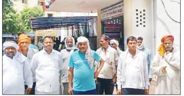
जिलाधिकारी को शिकायती पत्र देने पहुंचे पतारा के लोग। अमृत विचार

अमृत विचार: घाटमपुर तहसील क्षेत्र के पतारा कस्बे के तालाब में अवैध कब्जा करने का मामला जिलाधिकारी तक पहुंच गया है। ग्रामीणों ने बुधवार को कानपुर में जिलाधिकारी को शिकायती पत्र देकर कस्बे के सात सौ वर्ष पुराने तालाब पर अवैध कब्जा रोके जाने की आवाज उठाई है। पतारा कस्बे के ग्रामीणों ने शिकायती पत्र में बताया कि सात सौ वर्ष पुराना तालाब तिलसड़ा रोड के किनारे पाष्ठा माई मंदिर के पास स्थित है, जिस पर कुछ भूमाफिया की बुरी नजर लगी है। तालाब पर अवैध कब्जा करने की नीयत से तालाब को लगातार मिट्टी डालकर पाटा जा रहा है। ग्रामीणों ने बताया कि इन तालाब में पतारा के चार सौ घरों के