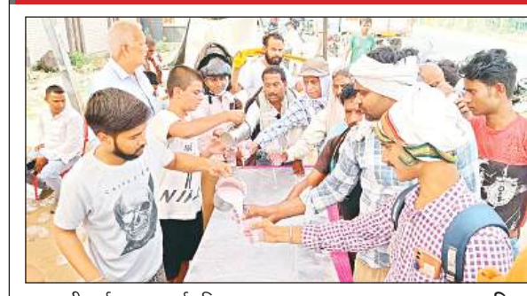
राजधानी मार्ग पर हुआ शर्बत वितरण।