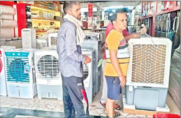
कूलर खरीदने के लिये दुकानदार से बात करता युवक।

गर्मी ने इस बार अप्रैल माह से ही अपना रंग दिखाना शुरू कर दिया था, जिसके बाद मई माह के पहले और दूसरे सप्ताह में पारा दिनों दिन चढ़ता गया। जिस कारण सूर्य की तपिश से हर कोई बेहाल हो गया। इधर मई माह के अंतिम सप्ताह में नौतपा नक्षत्र लगने से पारा 46 डिग्री तक पहुंच गये। ऐसे में घरों में