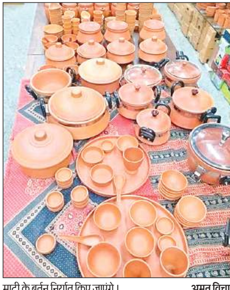
माटी के बर्तन निर्यात किए जाएंगे।

अमृत विचार। शहर की माटी के बने बर्तन फ्रांस और जर्मनी को निर्यात किए जाएंगे। शहर के निर्यातक को दोनों देशों से ऑर्डर मिला है। यह ऑर्डर 7 जून से रवाना होना शुरू हो जाएगा। ऑर्डर के पूरे माल को शहर के कुम्हारों ने तैयार किया है। कारोबारी ने बताया कि शहर को विदेश से माटी के बर्तन का आर्डर पहली बार मिला है। इस ऑर्डर में सौ दर्जन कप और प्लेट शामिल है। भोजन परोसने की प्लेट, माटी की केतली, सब्जीदान और रोटीदान भी शामिल हैं। बर्तनों को पकाने समय हल्की आंच का इस्तेमाल किया गया है।