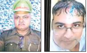
पीडित वन दरोगा। आरोपी लिपिक।