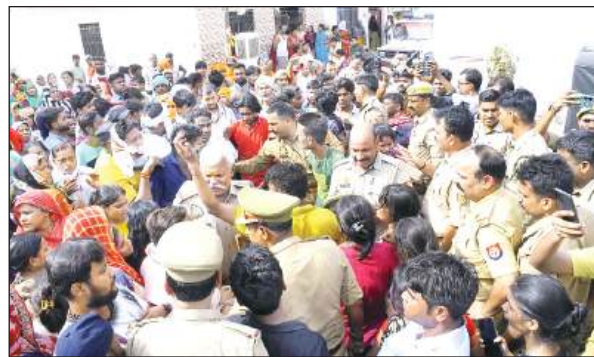
हंगामा कर रहे परिजनों को समझाती पुलिस।

कानपुर। सीओडी नाला की सफाई कार्य के निरीक्षण में पाया गया कि मछरिया पुलिया के पास जलकुंभी का कुछ भाग हटाया जाना शेष है। नाला में पड़ने वाली अधिकतर पुलिया के नीचे सफाई कार्य नहीं हुआ पाया गया। बाई पास ओवर ब्रिज के निकट स्थित पुलिया में सिल्ट निकाली जानी अभी बाकी है। मुख्य अभियंता ने समयसीमा के अंदर जलकुंभी हटाने एवं समस्त पुलियों की सफाई करने के निर्देश दिया।