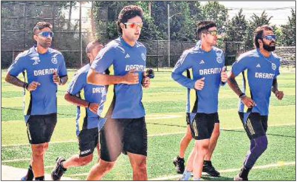
नासाऊ काउंटी मैदान पर ट्रेनिंग सत्र में दौड़ते भारतीय खिलाड़ी।

दुबिया रोशनी में दो महीने तक आईपीएल में प्रतिस्पर्धी क्रिकेट खेलने के बाद भारतीय क्रिकेट टीम ने विराट कोहली के बिना टी-20 विश्व कप के लिए सुबह ट्रेनिंग सत्र के साथ अपनी तैयारियां शुरू कर दी हैं। टी-20 विश्व कप में भारत के सभी शुरूआती मैच सुबह साढ़े 10 बजे शुरू होंगे इसलिए सुबह के ट्रेनिंग सत्र को तबजुदो दी गई।