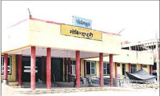
गोविंदपुरी स्टेशन पर विकास कार्य जारी है।

अमृत विचार। गोविंदपुरी रेलवे स्टेशन के लिए यात्रियों को जल्द ही नई सुविधा मिलने वाली है। यह सुविधा एक बेहतर रोड के रूप में होगी। रेलवे प्रशासन की ओर से रोड का प्रस्ताव पर काम शुरू हो गया है। यह रोड पाँपुलर धर्मकांटा चौराहा से लेकर स्टेशन तक जाएगी। स्टेशन तक जाने वाली दोनों रोड पर यात्रियों को समस्याओं का सामना करना पड़ता है। अमृत भारत योजना के तहत गोविंदपुरी रेलवे स्टेशन का पुनर्विकास का काम चल रहा है।