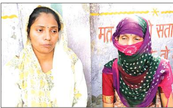
घटना की जानकारी देते परिजन।

● महिला मित्र पर लूटपाट और हत्या का आरोप लगाया