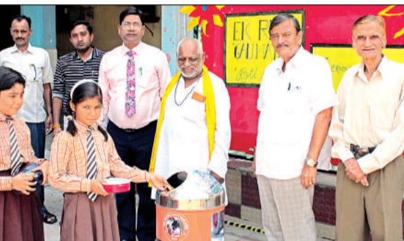
पहली रोटी गाय को अभियान की शुरुआत करते नारायण कॉलेज के छात्र।