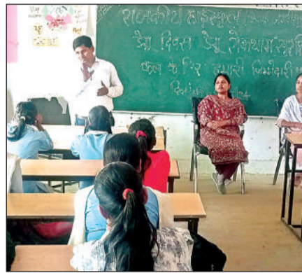
छात्र-छात्राओं को जानकारी देते शिक्षक व विशेषज्ञ।

डेंगू से बचने के लिए पानी का भराव न होने दें