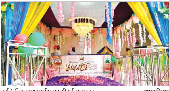
उर्स के लिए दरगाह शरीफ पर की गई सजावट।