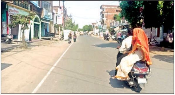
दोपहर में तेज धूप में सड़क पर पसरा सन्नाटा।

गरीबों की मुश्किलें बढ़ीं : गर्मी के चलते खुले आसमान के नीचे गुजर-बसर कर रहे लोगों की