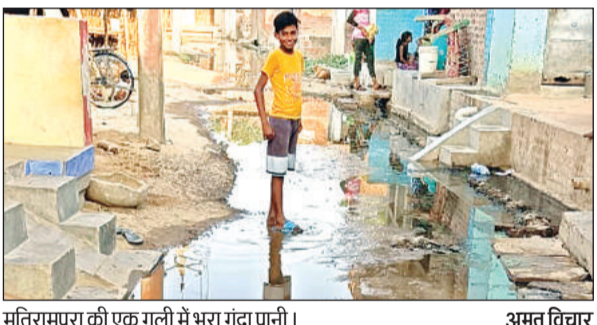
मतिरामपुरा की एक गली में भरा गंदा पानी।