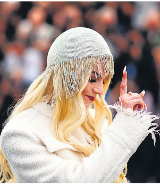
दक्षिण फ्रांस में आयोजित 77वें अंतरराष्ट्रीय कान्स फिल्म महोत्सव में फोटोग्राफरों के लिए पोज देती अभिनेत्री अन्ना टेलर-जाँय।