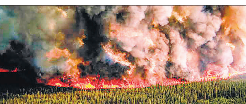
कैनेडा के जंगलों में लगी भीषण आग का दृश्य।

अमृत विचार : जंगलों में आग के कहर से न केवल भारत के कई हिस्से झुलस रहे हैं, बल्कि कैनेडियन जंगलों में लगी भीषण आग ने अमेरिका के कई देशों को धुआं धुंआ कर दिया है। जिस कारण संयुक्त राज्य अमेरिका के महानगरों की आबो हवा बेहद खराब हो चली है। प्राकृतिक संसाधन कनाडा ने रिपोर्ट जारी कर कैनेडियन जंगलों में लगी आग से आगे बताया है कि कैनेडियन जॉम्बी की आग फिर तेजी भड़कने लगी है, जो आने वाले दिनों में रौद्र रूप धारण ले सकती है। सैटेलाइट के जरिए जंगलों में आग का मानचित्र तैयार किया गया है और समय रहते काबू