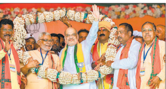
बिहार के मधुबनी में लोकसभा चुनाव के लिए एक सार्वजनिक रैली के दौरान केंद्रीय गृह मंत्री अमित शाह का अभिनंदन किया गया।

केंद्रीय गृह मंत्री अमित शाह ने गुरुवार को विपक्षी इंडिया गठबंधन पर प्रहार करते हुए कहा कि देश को एक मजबूत प्रधानमंत्री चाहिए, न कि बारी-बारी, एक-एक साल के लिए प्रधानमंत्री। बिहार के सीतामढी और मधुबनी में राजग उम्मीदवारों के पक्ष में अलग-अलग रैलियों को संबोधित करते हुए शाह ने कहा कि इंडिया गठबंधन वालों का कुछ होना नहीं है। पर मान लीजिए, वे स्वप्न में भी जीत जाते हैं तो उनका प्रधानमंत्री पद के लिए उम्मीदवार कौन होगा। ममता बनर्जी बन सकती हैं क्या, लालू बन सकते हैं क्या, स्टालिन बन सकते हैं क्या, शरद पवार बन सकते हैं क्या, जब गठबंधन वालों से पूछा गया कि