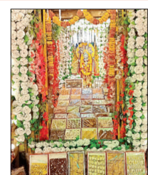
मां पीतांबर के दरबार में भक्तों के द्वारा सजाए गए छप्पन भोग।