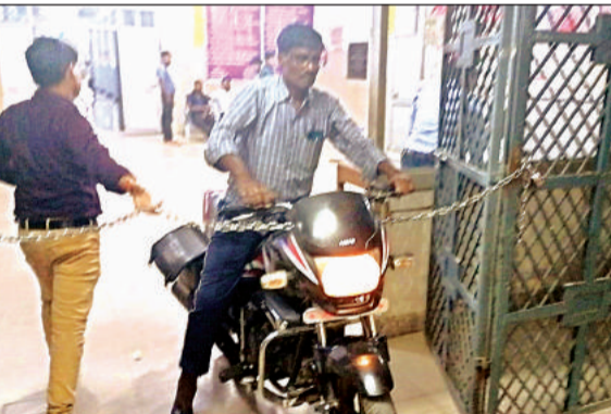
लोहे की चैन का लगा बैरियर।

थाना कादरीगेट क्षेत्र लोहिया जिला अस्पताल की इमरजेंसी गेट से स्टाफ के स्टोर व मरीजों से मिलने आने वाले तीमारदार भी