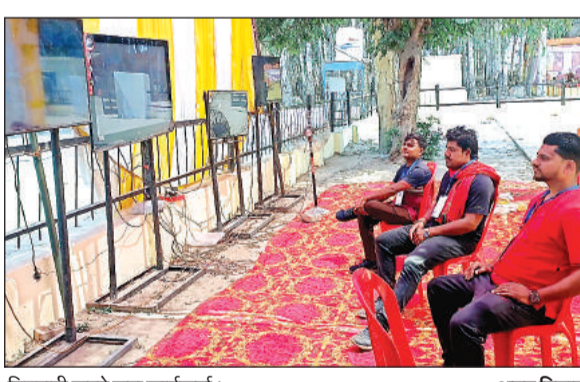
निगरानी करते सपा कार्यकर्ता।