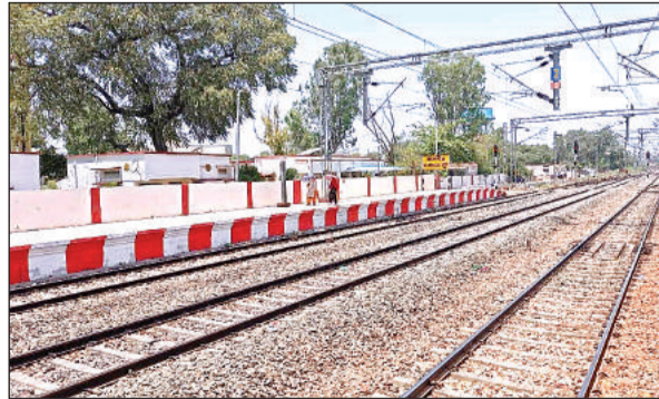
कन्नौज रेलवे स्टेशन पर दोपहर के समय पसरा सन्नाटा। अमृत विचार

अमृत विचार। कानपुर से फर्रुखाबाद व कन्नौज आने-जाने वाले दैनिक यात्रियों को अब पैसैंजर ट्रेनों में धक्के नहीं खाने पड़ेंगे। जल्द ही इस रूट पर मेमू (मेनलाइन इलेक्ट्रिक मल्टीपल यूनिट) ट्रेन की सुविधा हो जाएगी। दैनिक यात्रियों और व्यापारियों की मांग पर रेलवे बोर्ड ने आर्थिक सर्वेक्षण के बाद इस सहायक शिक्षिका ने आरोपों की झड़ी लगा दी। आरोप लगाया कि प्रधान शिक्षक सप्ताह में दो-तीन दिन ही आती हैं, जबकि हस्तक्षेप पूरे माह के दर्शाकर वेतन उठाती हैं। यही नहीं महीनों बच्चों के बीच मिठ्ठे मील के तहत पता हुए भोजन भी नहीं परोसा जाता है।