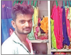
बिखरा पड़ा सामान और चोरी की जानकारी देता युवक।