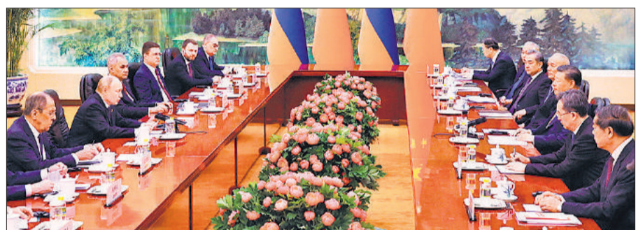
बीजिंग में दलबल के साथ बैठक करते चीन व रूस के राष्ट्रपति।

चीन के राष्ट्रपति शी जिनिपिंग और रूसी राष्ट्रपति व्लादिमीर पुतिन के बीच गुरुवार को बीजिंग में एक महत्वपूर्ण बैठक हुई जिसमें दोनों नेताओं ने हिंद-प्रशांत क्षेत्र में नाटो के रुख को विनाशकारी करार दिया। साथ ही पूर्वोत्तर एशिया में शक्ति संतुलन को बदल कर अमेरिकी आधिपत्य स्थापित करने के प्रयासों की निंदा की। अपने 5वें कार्यकाल के लिए शपथ ग्रहण करने के बाद पुतिन पहली विदेश यात्रा पर दो दिन की चीन की राजकीय यात्रा पर बीजिंग आये हैं। चीनी राष्ट्रपति ने यहां अपने पुराने मित्र रूसी राष्ट्रपति का पारंपरिक ढंग से भव्य स्वागत किया। दोनों नेताओं ने द्विपक्षीय, क्षेत्रीय एवं महत्वपूर्ण वैश्विक मुद्दों पर गहन विचार विमर्श किया। पुतिन ने अपने बयान में चीनी राष्ट्रपति के साथ उनकी बातचीत को असाधारण, गहन और सार्थक करार दिया। उन्होंने कहा चीनी राष्ट्रपति शी जिनिपिंग के साथ हमारी आज की असाधारण गहन और सार्थक वार्ता को जारी रखते हुए द्विपक्षीय सहयोग के मौजूदा मुद्दों पर चर्चा करके बहुत खुश हूँ। उन्होंने कहा कि चीनी राष्ट्रपति के साथ बातचीत के बाद संयुक्त वक्तव्य