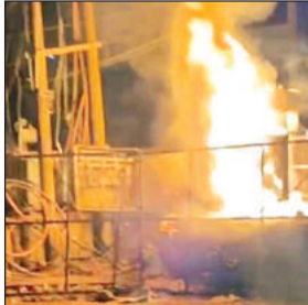
धू-धुंकर जलता ट्रांसफार्मर।

अमृत विचार। नगर के तिराहा स्थित पार्क के निकट लगे ट्रांसफार्मर में बुधवार की देर रात लगभग 12 बजे आग लग गई। ट्रांसफार्मर से ऊंची-ऊंची लपटें निकलते देख लोगों में दहशत फैल गई। जानकारी पर पहुंची कोतवाली पुलिस ने दमकल को सूचना दी। सभी के सहयोग से लगभग डेढ़ घंटे बाद आग पर काबू पाया गया। ट्रांसफार्मर जलने से लगभग 20 घंटे से अधिक समय बीत चुका है लेकिन बिजली चालू नहीं हुई। विद्युत विभाग के द्वारा नगर के तिराहा पार्क के निकट 400 व 600 केवीए के दो ट्रांसफार्मर रखे गए हैं। शॉर्ट सर्किट से 400 केवीए ट्रांसफार्मर में अचानक आग लग गई और धू-धुंकर जलने लगा। आग की लपटें देख स्थानीय लोगों की मौके पर भीड़ एकत्र हो गई।