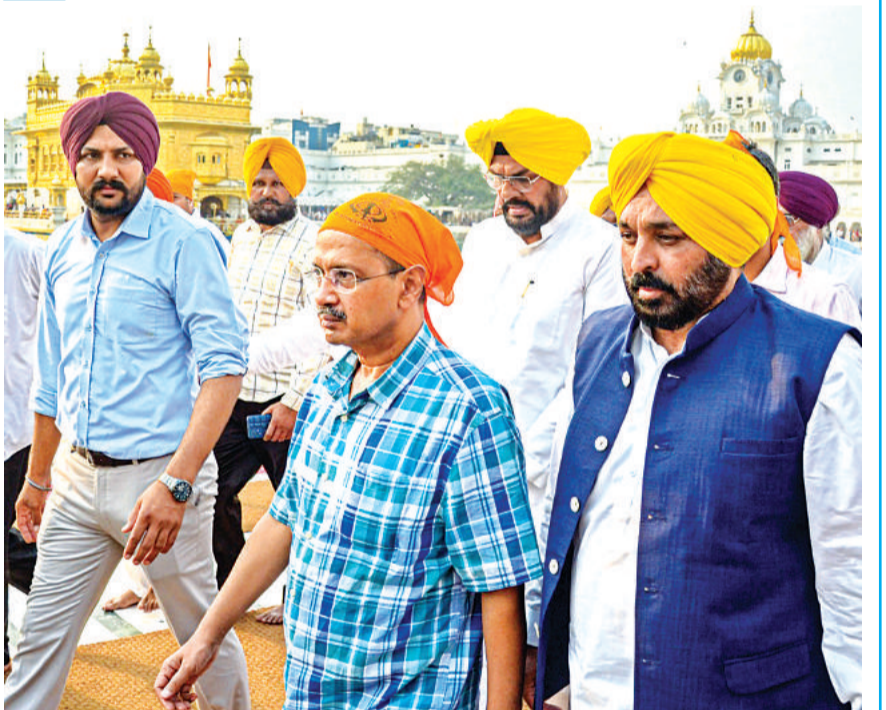
पंजाब में प्रचार के लिए पहुंचे दिल्ली के मुख्यमंत्री अम आदमी पार्टी मुखिया अरविंद केजरीवाल ने पंजाब के मुख्यमंत्री भगवंत मान के साथ अमृतसर में स्वर्ण मंदिर पहुंचकर माथा टेका और चुनावी सफलता की कामना की।