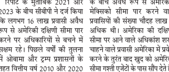
देश की दक्षिणी सीमा के माध्यम से अधिकारियों से बचकर किया प्रवेश

अमेरिका में बाइडेन प्रशासन में देश की दक्षिणी सीमा के माध्यम से अवैध रूप से लगभग सोलह लाख प्रवासियों ने प्रवेश किया है। फॉक्स न्यूज ने अमेरिकी सीमा शुल्क और सीमा सुरक्षा (सीबीपी) से प्राप्त आंकड़ों का हवाला देते हुए यह जानकारी दी है। रिपोर्ट के मुताबिक 2021 और 2023 के बीच सीबीपी ने दर्ज किया कि लगभग 16 लाख प्रवासी अवैध रूप से अमेरिकी दक्षिणी सीमा पार करने पर अधिकारियों से बचने में सक्षम रहे। पिछले वर्षों की तुलना में ओबामा और ट्रम्प प्रशासनों के तहत वित्तीय वर्ष 2010 और 2020