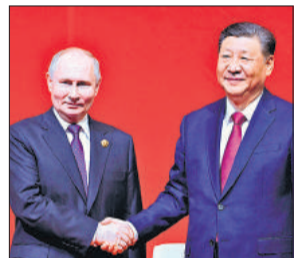
पुतिन का स्वागत करते जिनिपिंग।