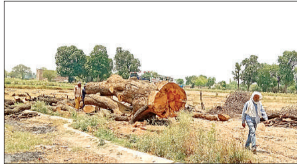
पेड़ को काटते मजदूर।

ताजा मामला फफूंद थाना क्षेत्र के बड़ी माता मंदिर निकट 500 मीटर दूर बाबरपुर रोड पर का बताया जा रहा है। जहां हरी लकड़ी नीम जैसे पेड़ों की कटान हो रही है। सरकार लगातार पर्यावरण को सुधारने के लिए हर संभव प्रयास करती है। पौधारोपण कार्यक्रम, पर्यावरण