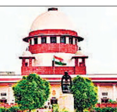
● सुप्रीम कोर्ट ने धन शोधन निवारण अधिनियम के प्रावधानों के संबंध में जारी किए निर्देश