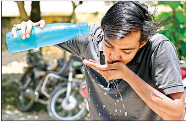
कन्नौज रेलवे स्टेशन पर दोपहर में प्यास बुझाता युवक। अमृत विचार

मौसम का मिजाज और तल्लू होता जा रहा है। गुरुवार को पारा फिर 42.5 डिग्री पर पहुंच गया, जिससे दिन में तेज धूप से लोग बिलबिला उठे। वहीं, दिन में चली लू के थपड़े लोगों को परेशान करते रहे। मौसम विभाग के अनुसार विक्षोभ और रेडिएशन के कारण तापमान बढ़ रहा है। दिन में अधिकतम तापमान 42.5 और न्यूनतम 24.6 डिग्री रिकॉर्ड किया