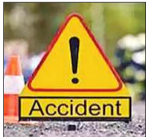
कार्यालय संवाददाता फर्रुखाबाद