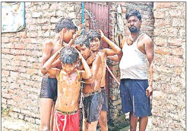
गर्मी से बचाव के लिए दोपहर में नहाते बच्चे।