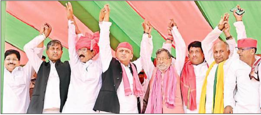
जनसभा के दौरान इंडी गटबंधन के प्रत्याशी के साथ सपा के राष्ट्रीय अध्यक्ष अखिलेश यादव।