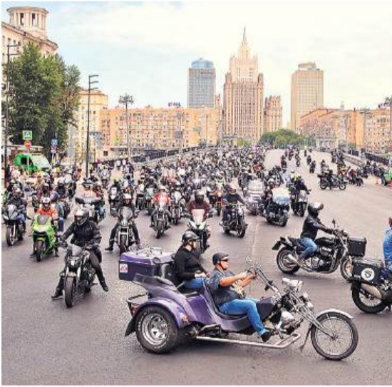
रूस के मास्को स्थित विदेश मंत्रालय की प्रसिद्ध इमारत के पास पारंपरिक स्प्रिंग मोटरसाइकिल उत्सव पर मोटरसाइकिल रैली में भाग लेते युवा।