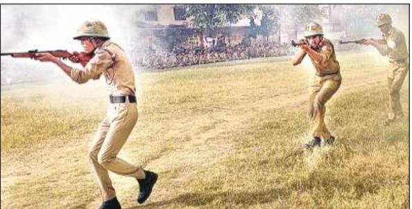
युद्ध कला का प्रदर्शन करते एनसीसी कैडेट्स।