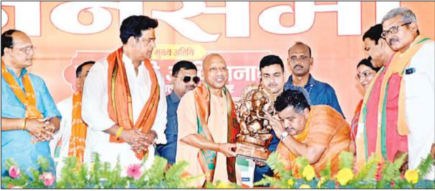
गोरखपुर में आयोजित जनसभा में मुख्यमंत्री योगी को स्मृति चिन्ह भेंट करता भाजपा पदाधिकारी।

सपा प्रमुख अखिलेश ने भाजपा सरकार पर बोला तीखा हमला