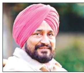
चरणजीत सिंह चन्नी।