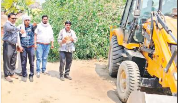
सरकारी जमीन से अवैध कब्जा हटवाते राजस्व कर्मचारी। अमृत विचार

अमृत विचार। टांडेहार गांव में जाने वाले प्रमुख मार्ग पर 35 वर्ष से पक्की दीवार और शौचालय बनाकर कब्जा करने वालों पर प्रशासन ने कार्रवाई करते हुए पूरे मार्ग से कब्जा हटाकर कब्जा मुक्त करा दिया। एसडीएम का कहना है कि कार्रवाई के दौरान 46 बीघा जमीन को कब्जा मुक्त कराया गया।