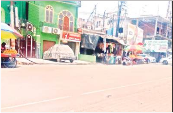
शहर की सड़कों पर पसरा सन्नाटा। अमृत विचार

अमृत विचार। नौतपा के दूसरे दिन ही गर्मी ने अपने तेवर बहद तीखे कर दिए। तापमान बढ़कर 46 डिग्री तक पहुंच गया। इस मौसम में रविवार का दिन सबसे अधिक गर्म रहा। रविवार के कारण कार्यालयों में अवकाश था और दोपहर को सड़कों पर सन्नाटा पसरा रहा। अभी तापमान में और बढ़ोत्तरी होने की संभावना है। दोपहर में तो काफी देर तक तापमान 45 डिग्री पर टिका रहा जो परेशान करने वाला था।