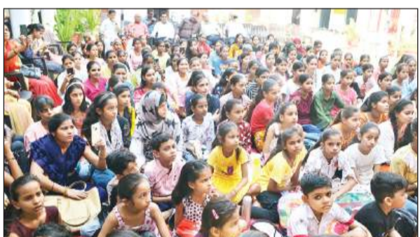
कार्यशाला में मौजूद बच्चे।