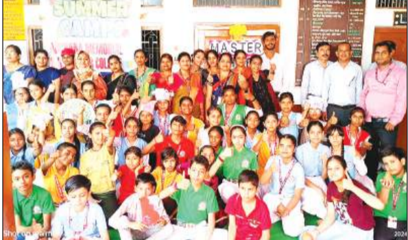
समर कैंप के दौरान छात्र-छात्राएं और विद्यालय का स्टाफ।

अमृत विचार। अर्चना मेमोरियल सरस्वती ज्ञान मंदिर इंटर कॉलेज में पांच दिवसीय समर कैंप का रविवार को समापन हो गया। समर कैंप में प्रतिभाग करने वाले बच्चों ने मोबाइल इलेक्ट्रॉनिक गेजेट को छोड़कर प्रतिदिन योगाभ्यास किया। अंतिम दिन बच्चों को मिट्टी के बर्तन बनाना सिखाया गया।