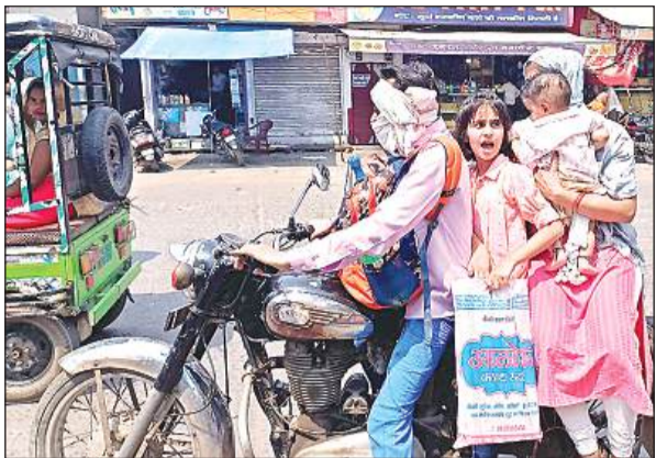
गर्मी में मुंह बांध कर निकल रहे लोग।