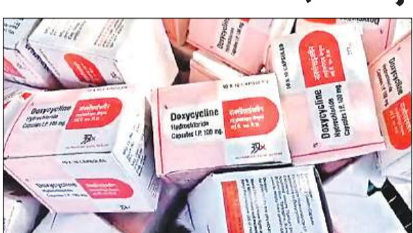
सड़क के किनारे पड़ी सरकारी दवाएं।

अमृत विचार। नवावगंज क्षेत्र से एक सनकनीखेज मामला सामने आया है। जो दवाएं सरकारी अस्पताल में मरीजों को मिलनी चाहिए थी। उन एंटीबायोटिक दवाओं की बड़ी खेप जाकिर हुसैन ट्रस्ट के पास सड़क किनारे मिलीं। वहीं ज्यादातर दवाओं के बॉक्स पर एक्सपायरी डेट 2025 की पड़ी है। इस मामले में जिम्मेदारों की घोर लापरवाही सामने आई है।