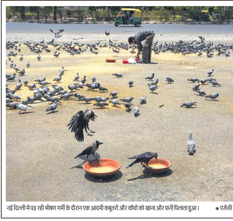
नई दिल्ली में पड़ रही भीषण गर्मी के दौरान एक आदमी कबूतरों और कौवों को खाना और पानी पिलाता हुआ।

अधिकारी ने कहा-उन्म में से किसी की भी हालत गंभीर नहीं है। स्वास्थ्य अधिकारियों को संदेह है कि संबंधित लोग कुड़िमंथी नामक व्यंजन के साथ दी जाने वाली मेयोनीज खाकर बीमार पड़े। कैम्पंगलम थाने के एक अधिकारियों ने पूरे होटल को सील कर दिया है।