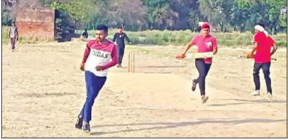
रन लेने के लिए दौड़ते बल्लेबाज।