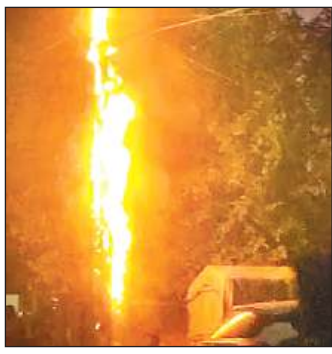
जल रहा बिजली का पोल।

अमृत विचार। भीषण गर्मी में लो वोल्टेज और ट्रिपिंग की समस्या से घरेलू उपभोक्ताओं के साथ ही साथ कामर्शियल उपभोक्ता भी परेशान हैं। दुकानदारों को पेय पदार्थ ठंडा करने के लिए बर्फ का सहारा लेना पड़ रहा है। सिनेमाघरों व होटलों में 6 से 8 घंटे तक जनरेटर चलाया जा रहा है। लो वोल्टेज की समस्या से घरों में फ्रिज व एसी आदि उपकरण भी नहीं चल पा रहे।