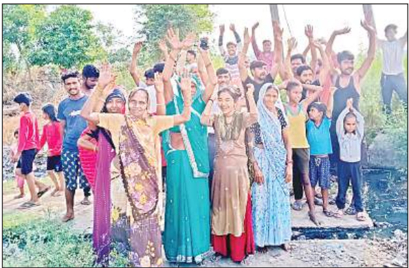
नहर पुल पर नारेबाजी करते बिजली उपभोक्ता।

अमृत विचार। कस्बा लखना के समीपवर्ती ग्राम अड्डा ज्ञान सिंह में 15 दिन से विद्युत ट्रांसफार्मर फुंका पड़ा है। विद्युत विभाग ने इतने दिनों बाद भी ट्रांसफार्मर नहीं बदला है, जिससे ग्रामीणों को भीषण गर्मी में भारी दिक्कतों का सामना करना पड़ रहा है। परेशान ग्रामीणों ने नहर पुल पर एकत्रित होकर बिजली विभाग के अधिकारियों के खिलाफ जमकर नारेबाजी करते हुए प्रदर्शन किया।