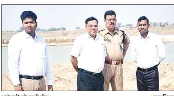
छापेमारी को पहुंची टीम।

मझिगवां मोरंग खदान में अवैध खनन, ओवरलोडिंग की जांच के लिए खनन अधिकारी, एसडीम खागा व क्षेत्राधिकारी खागा के साथ