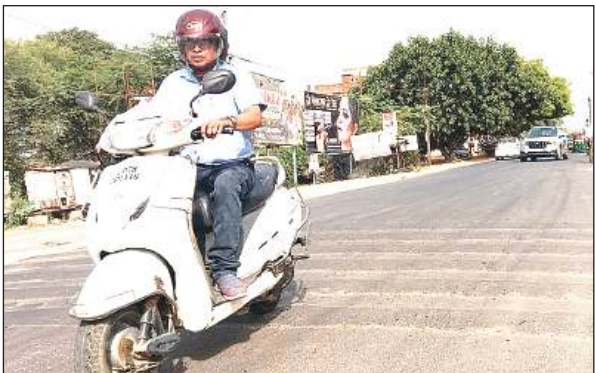
गैस एंजेंसी क्रॉसिंग के पास बने ब्रेकर से गुजरता स्कूटी सवार।

अमृत विचार। हादसों की रोकथाम के लिए बनाए गए स्पीड ब्रेकर लोगों की जिंदगी पर ही 'ब्रेक' लगाते नजर आ रहे हैं। लोक निर्माण विभाग ने जल्दबाजी में शहरों व कस्बों में बेतरतीब स्पीड ब्रेकर बना दिए, जिनसे आए दिन हादसे हो रहे हैं। खास बात यह है कि ब्रेकरों पर न तो रेडियम पट्टी लगाई गई और न ही चेतावनी बोर्ड लगाया गया है। अब स्थिति यह है कि आए दिन इन ब्रेकरों पर बाइक सवार लोग गिरकर