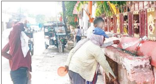
गर्मी में इस तरह व्यास बुझाते दिखे लोग।

हालत बिगड़ती देख परिजनों ने उन्हें आनन-फानन में जिला अस्पताल पहुंचाया, जहां डाक्टर ने उन्हें मृत घोषित कर दिया। दोआबा में बुधवार को 10.30 बजे ही हीटवेव कहर बरपाने लगी। सड़कों पर चलना दुश्चर हो गया। वहीं नौ घंटे तक शहर का तापमान 40 डिग्री से ऊपर रहा। गांवों से शहर तक जनजीवन अस्त-व्यस्त नजर आया। भरी दुपहरी में घर, दुकान, मकान, गली-मोहल्ले, छतें भूभक उठे।