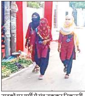
सड़कों पर गर्मी में मुह ढककर निकलती किशोरियां।