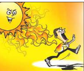
सौधी पृथ्वी पर पड़ रही हैं। गर्मी की यह स्थिति लोगों को खासा परेशान कर रही है।

गर्मी के कारण दोपहर में सड़कों पर सन्नाटा छाया रहता है हालांकि पिछले दिनों से स्कूलों में छुट्टियां हो जाने के कारण बच्चे इस भीषण गर्मी से बचे हुए हैं लेकिन कार्यालय खुले हैं और कर्मचारियों को इसी भीषण गर्मी के बीच कामकाज करना पड़ रहा है। अब तो सुबह 8 बजे से ही