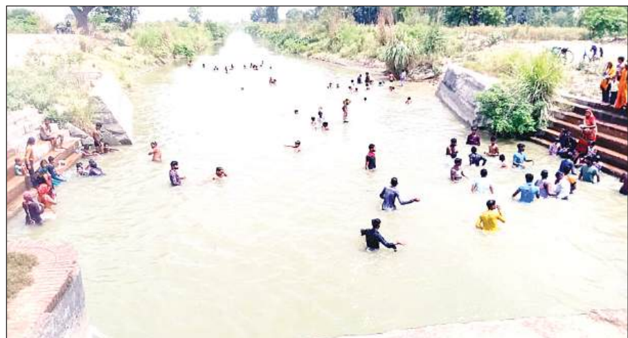
गर्मी से राहत पाने के लिए नहर में नहाते लोग।

बुधवार को सबसे ज्यादा गर्म रहा कानपुर देहात | पेड़ से बेहोश होकर गिरे पक्षी, धूप ने झुलसाया