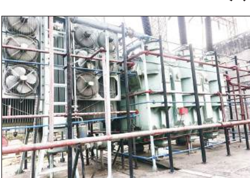
220 केवी विद्युत उपकेंद्र पर ट्रांसफार्मर में लगा मल्सीफायर सिस्टम।

अमृत विचार। वातावरण की गर्मी से विद्युत उपकेंद्रों में लगे ट्रांसफार्मर जहां ओवरहीट हो रहे हैं, वहीं 220 केवी विद्युत उपकेंद्र में ट्रांसफार्मरों को टंडा करने के लिए आधुनिक मल्सीफायर सिस्टम लगाया गया है। यह ट्रांसफार्मर का तापमान बढ़ते ही स्वतः चालू हो जाता है और पानी की बौछार कर उसे ठंडा कर देता है। इस संयंत्र के माध्यम से ट्रांसफार्मर फुंकने से बच जाते हैं। शहर के 132 केवी मकरंदनगर में करोड़ों रुपये कीमत के ट्रांसफार्मर लगे हैं, लेकिन इनको टंडा करने के लिए मल्सीफायर सिस्टम नहीं लगाया गया है। ऐसे में जब वातावरण का तापमान जब 45 डिग्री तक पहुंच जाता है तो ट्रांसफार्मर आग उगलने लगते हैं और उनका तापमान 65 डिग्री