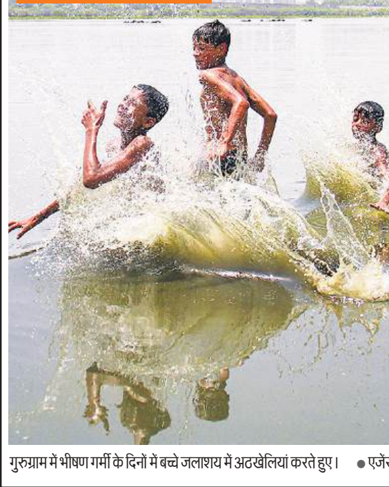
गुरुग्राम में भीषण गर्मी के दिनों में बच्चे जलाशय में अटखैलियां करते हुए।