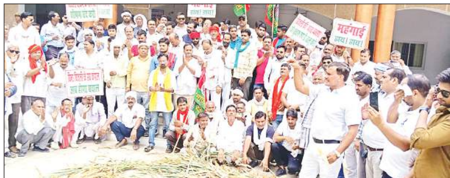
बिजली कटौती को लेकर सूखी फसल दिखा कर प्रदर्शन करते सपाईं। अमृत विचार

बिजली कटौती को लेकर सपाइयों ने जिलाधिकारी को संबोधित ज्ञापन अतिरिक्त मजिस्ट्रेट को सौंपा