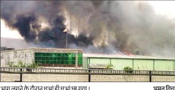
आग लगने के दौरान धुआं ही धुआं छा गया।

विसायकपुर में हाईवे से कुछ दूर पर एक्यूमैन लेमिनेटर प्राइवेट लिमिटेड फैक्ट्री है। फैक्ट्री में रैपर की छपाई होती है। दोनों शिफ्टों में करीब चार सौ मजदूर काम करते हैं। बुधवार की दोपहर लगभग दो बजे प्रिंटिंग मशीन के साथ कई और मशीनों भी चल रही थी। उस दौरान प्लांट में सैकड़ों मजदूर