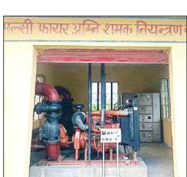
मल्सीफायर सिस्टम का नियंत्रण कक्ष। अमृत विचार