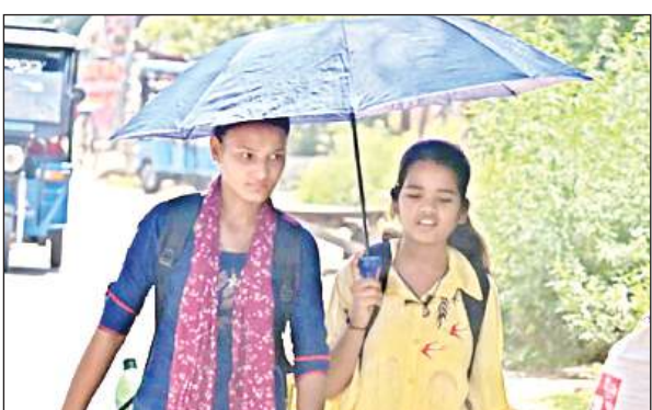
तेज धूप में छाते की छाया में बच्चों को ले जाती महिला।

● जिला आपदा प्रबंधन प्राधिकरण ने जारी किया अलर्ट, घर पर रहने की सलाह