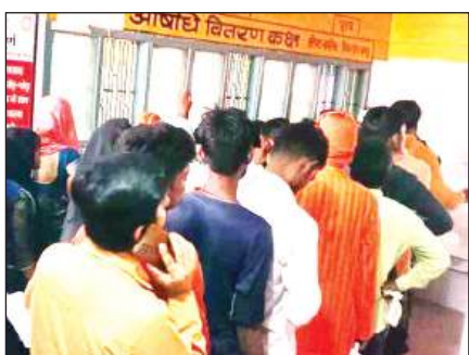
औषधि खिड़की में लगी मरीजों की भीड़।

जिला अस्पताल में बाल रोग विशेषज्ञ व जनरल फिजीशियन से लेकर इमरजेंसी में रोजाना उल्टी दस्त और बुखार पीड़ित बच्चे व बड़े पहुंच रहे हैं। इनमें गंभीर स्थिति वाली मरीजों को भर्ती कर लिया जा जाता है। जिला अस्पताल के मुताबिक प्रतिदिन 10 से 15 बच्चे और बड़े लोग डायरिया से पीड़ित