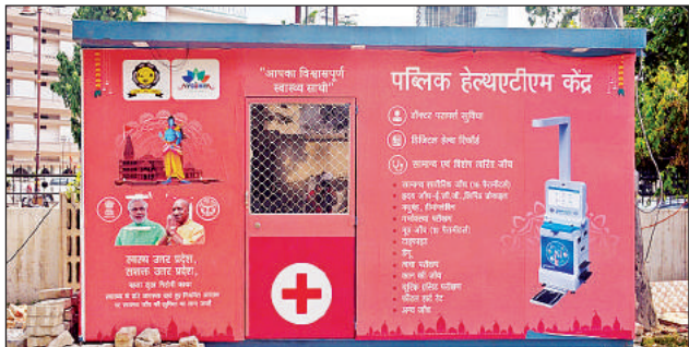
नगर निगम परिसर में लगा हेल्थ एटीएम।