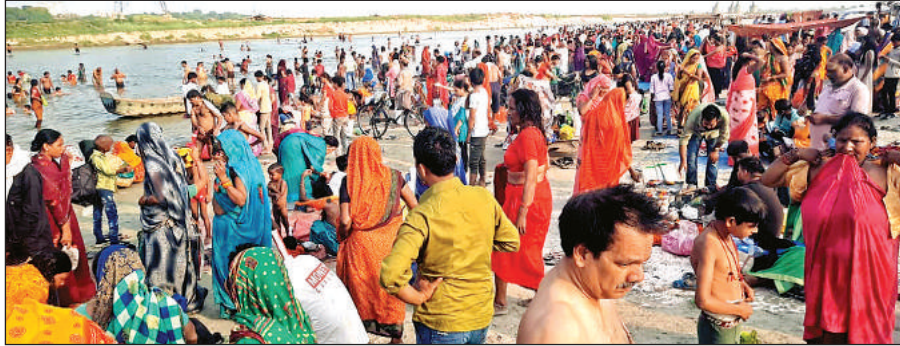
गंगा स्नान के लिए उमड़ी श्रद्धालुओं की भीड़।

अमृत विचार। बुद्ध पूर्णिमा के अवसर पर गुरुवार को हजारों की संख्या में श्रद्धालुओं ने सुबह से ही गंगा में आस्था की डुबकी लगा कर पुण्य कमाया। गंगा तट पर लगी दुकानों पर जमकर खरीददारी भी की। बुद्ध पूर्णिमा के अवसर पर नगर के अलावा उन्नाव व आस पास के तमाम स्थानों से सुबह से ही श्रद्धालुओं के आने का सिलसिला शुरू हो गया था। नगर के अलावा सानिक, अचलगंज, रायबरेली, बालामऊ, लखनऊ, जैतीपुर, उन्नाव, कानपुर समेत अन्य स्थानों से आए लोगों ने डुबकी लगाई।