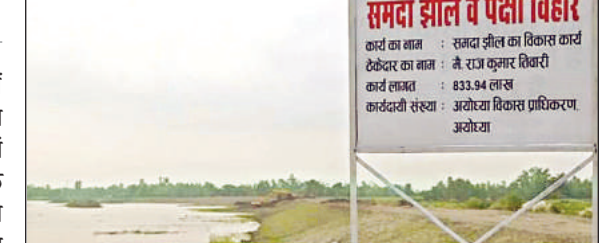
सोहावल स्थित समदा झील। अमृत विचार

राममंदिर की रिंग रोड और पर्यटन के नजरिए से पक्षी विहार सौंदर्यकरण शासन को इस महत्वाकांक्षी परियोजना पर अब तक नौ करोड़ रुपये से ज्यादा की धनराशि खर्च हो चुकी है। लगभग 65 हेक्टेयर भूमि में फैली दर्जन भर प्राण पंचायत से घिरी इस झील पर चारों तरफ से बनाए गए जलाशय के रूप में बांध पक्षियों के लिए टिले और लगाए गए