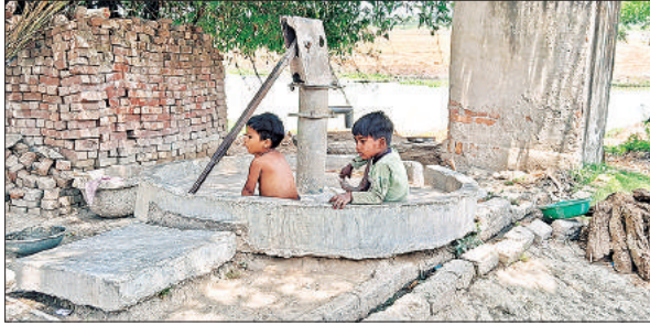
पानी न आने से हैंडपंप की रेकी में खेलते बच्चे।

इमलिया सुल्तानपुर, सीतापुर, अमृत विचार : एक तरफ लोग बढ़ रही भीषण गर्मी से परेशान हैं तो दूसरी तरफ नलों के खराब होने से हो रही पानी की समस्या उनकी परेशानी को बढ़ा रही है। हाल ये है कि कहीं पर हैंडपंप बिल्कुल खराब हैं तो कहीं पर देर तक चलाने पर गंदा पानी निकाल रहे हैं। कागजों पर हैंडपंपों की मरम्मत के नाम पर लाखों रुपए खर्च दिखाया जाता है जबकि हकीकत में हैंडपंप मरम्मत व रीबोर की राह देख रहे हैं।