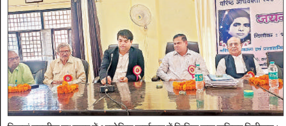
बिस्वां तहसील सभागार में आयोजित कार्यक्रम में सिविल जज जूनियर डिवीजन।