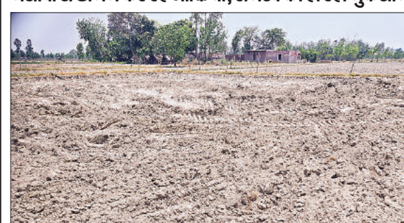
खेत से निकाली गई मिट्टी।