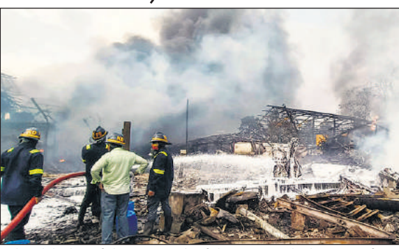
ठाणे जिले के डॉंबिवली में एक रसायन फैक्ट्री में बॉयलर विस्फोट के कारण लगी आग को बुझाने की कोशिश करते अग्निशमन कर्मी।