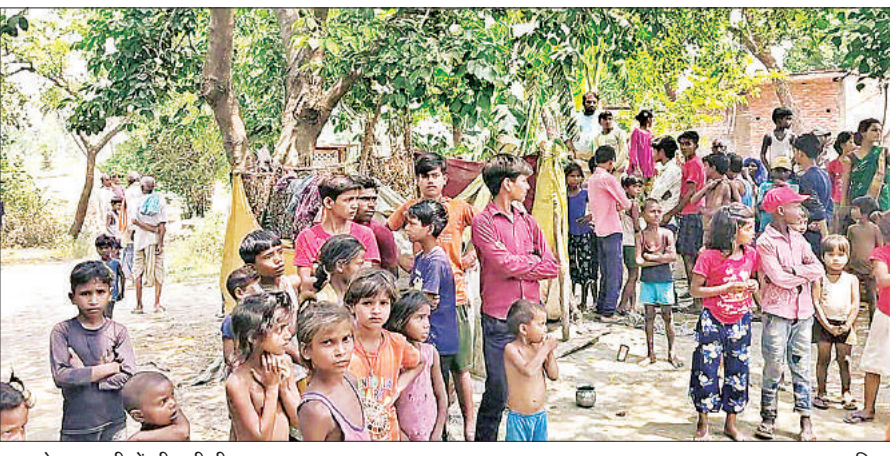
घटना के बाद ग्रामीणों की लगी भीड़।

पत्नी की हत्या के आरोप में आरोपी पति पुलिस की हिरासत में है। मौके पर आला कल भी बरामद कर लिया गया है। मृतका के परिजनों की तहरीर पर मुकदमा दर्ज कर आरोपी को जेल भेजने की कार्यवाही की जा रही है। पोस्टमार्टम रिपोर्ट और परिजनों के बयानों के आधार पर अग्रिम विधिक कार्रवाई की जाएगी। -दिनेश शुक्ला, सीओ