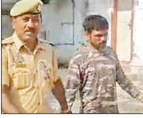
पुलिस की गिरफ्त में आरोपी।

अमृत विचार। मूंगफली की फसल की रखवाली करने गए युवक की खेत में हत्या का खुलासा हो गया है। पुलिस ने हत्यारोपी को गिरफ्तार कर लिया है। पुलिस के अनुसार उधार के रुपये मांगने पर आरोपी ने युवक की हत्या को अंजाम दिया था। पत्थर से पहले सिर पर वार किया इसके बाद खुरपी से गला रेत दिया।