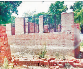
अधूरा पड़ा पशु चिकित्सालय।

अमृत विचार: राजकीय पशु चिकित्सालय निर्माण अनियमितता की भेंट चढ़ गया। राजकीय पशु चिकित्सालय रूपईडीह के निर्माण में अनियमितता की चर्चा जोरों पर है। क्लक मुख्यालय पर मानक विहीन राजकीय पशु चिकित्सालय का निर्माण हो रहा है, लेकिन जिम्मेदार अधिकारी ध्यान नहीं दे रहे हैं, जिससे मानक विहीन निर्माण कार्य में संलिप्त होने का आशंका जतायी जा रही है। कार्य दाई संस्था के द्वारा राजकीय पशु चिकित्सालय का निर्माण 69.11