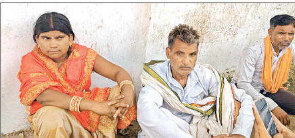
थाने के बाहर बैठे मृतका महिला के परिजन।

वारदात से कुछ दिन पूर्व कई महीनों तक अपने जीजा के घर रूककर वापस अपनी ससुराल आई थी। हालांकि पुलिस मामले में आपसी विवाद को हत्या की वजह मान रही है। पुलिस का कहना है कि तपतीश के बाद ही स्थिति साफ हो सकेगी।