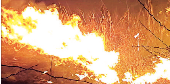
कुआनो जंगल की झाड़ियों में लगी आग।

अमृत विचार: धानेपुर थाना क्षेत्र के त्रिलोकपुर गांव के समीप स्थित कुआनो जंगल में बुधवार की देर शाम अचानक आग लग गयी। कुछ ही देर में आग ने विकराल रूप धारण कर लिया और आग की लपटें आसमान छूने लगीं।आग की लपटों को देख जंगल के किनारे बसे गांवों में दहशत फैल गयी। ग्रामीणों की सूचना पर पहुंचे फायर कर्मियों ने आग पर काबू पाने का प्रयास किया लेकिन वह असफल रहे। पूरी रात जंगल से आग की लपटें निकलती रही और धुंए के गुबार से जंगल सुलगता रहा। दमकल की दो गाड़ियां पूरी रात आग बुझाने में जुटी