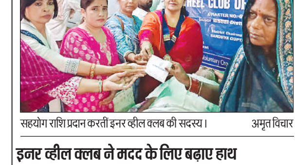
सहयोग राशि प्रदान करती इमर व्हील क्लब की सदस्य।