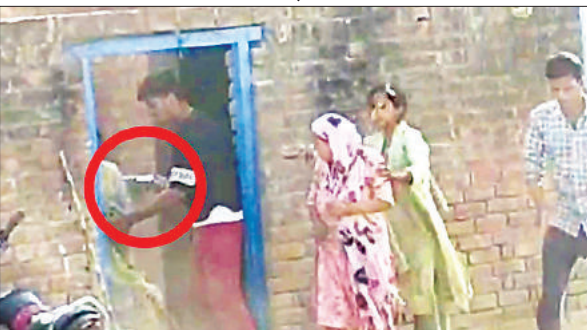
असलह से फायरिंग करता युवक (लाल घेरे में)।

महोली, सीतापुर, अमृत विचार। अवैध खनन को लेकर चर्चा में रहने वाली कार्टरगंज पुलिस चौकी की लंचर कार्यशैली के चलते छोटे से विवाद ने बड़ा रूप ले लिया। पुलिस चौकी से करीब एक किलोमीटर दूरी पर कई राउंड फायरिंग हुई और पत्थरबाजी के साथ जमकर लाठी-डंडे भी चले।