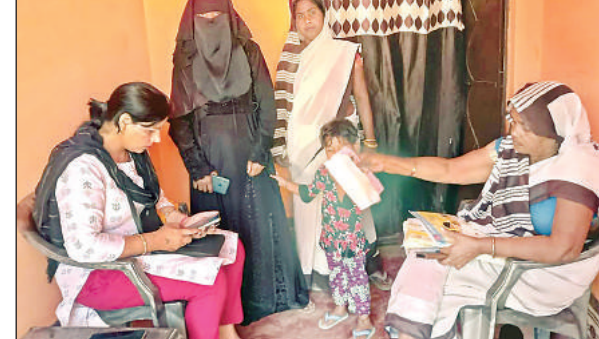
मरीज का डिजिटल हेल्थ आईडी बनाती स्वास्थ्य कर्मी।

अमृत विचार। सरकारी व निजी अस्पतालों में स्वास्थ्य सेवाएं डिजिटल हो रहीं हैं। अब किसी भी मरीज की पुरानी बीमारी जांच रिपोर्ट और दवाओं की सारी जानकारी सिर्फ एक क्लिक पर सामने आ जाएगी। मरीजों की आभा आईडी बनाई जा रही है। इस आईडी पर अब मरीजों की ज़िंदगी भर के इलाज की कुंडली बनाई जा रही है।