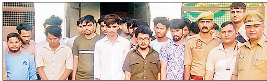
पुलिस हिरासत में ऑनलाइन सट्टा गिराह के सदस्य। अमृत विचार

साइबर क्राइम थाना पुलिस को शिकायत मिली थी कि व्हाट्सअप के माध्यम से संदेश भेज ऑनलाइन सट्टा में रकम लगाने पर मोटा मुनाफा का झांसा दिया जा रहा है। बट डेली व योलो 247 एप इंस्टाल करवा रकम हड़प ली गई। शिकायत पर पुलिस ने धोखाधड़ी और आईटी एक्ट के तहत रिपोर्ट