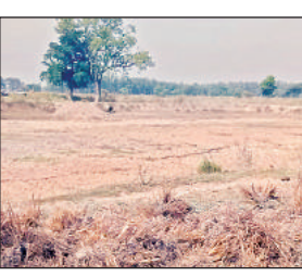
सूखा अमृत सरोवर।

अमृत विचार: पानी के संकट से जूझ रहे किसानों, बेजुबान जानवरों तथा पक्षियों के लिए सरकार ने महत्वाकांक्षी योजना अमृत सरोवर योजना की शुरुआत की थी।