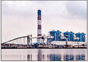
ऊंचाहार व ओबरा इकाइयों के रात तक चालू होने की संभावना बिजली की अधिकतम मांग 28,315 मेगावाट पर पहुंची

अमृत विचार: भोषण गर्मी में ज्यादा लोड के कारण उत्पादन बिजलीघरों की बंद हुई इकाइयों के चालू न होने के कारण प्रदेश में बिजली संकट की स्थिति बनी हुई है। ऊंचाहार व ओबरा बिजलीघरों की बंद इकाइयों के गुरुवार की देर रात तक और ललितपुर परियोजना की 660 मेगावाट क्षमता की इकाई के 25 मई को चालू होने की संभावना है। इस बीच, गुरुवार को प्रदेश में बिजली की अधिकतम मांग 28,315 मेगावाट दर्ज हुई। उत्तर प्रदेश पावर कॉर्पोरेशन के सूत्रों के अनुसार मांग व उपलब्धता के बीच अंतर बने होने के कारण प्रदेश के ग्रामीण क्षेत्रों में अधोषित बिजली कटौती जारी है। गुरुवार