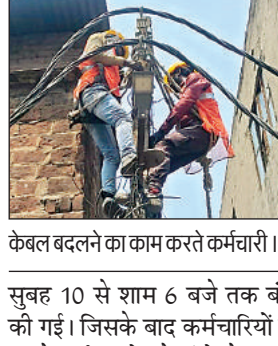
केबल बदलने का काम करते कर्मचारी।

नगर में इन दिनों यूनियंसल कंपनी के कर्मों नई एबीसी व एलटी लाइन डाल रहे हैं। जिसके चलते गुरुवार को कार्यवाही संस्था नगर के गांधी नगर व ऋषि नगर पहुंची। जहां फीडर-1 के तहत गांधीनगर में 630 केवीए व 100 केवीए ट्रांसफार्मर और ऋषि नगर में 630 केवीए व 400 केवीए ट्रांसफार्मर की सफाई