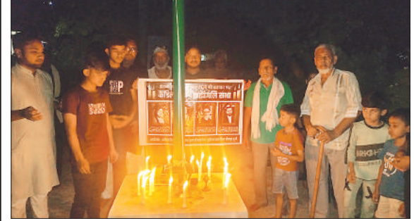
कैंडल जलाकर शोक जताते लोग।