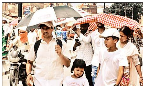
भीषण तपिश में छाता, गमछा और टोपी से सिर ढककर जाते लोग।

अमृत विचार : पारा 42 और 43 डिग्री तक पहुंच गया है। गर्मी का असर साफ दिखने लगा है। दोपहर में नेशनल हाइवे पर सन्नाटा पसरने लगा है तो स्वास्थ्य केंद्र पर ओपीडी में मरीजों की संख्या भी कम हो गई है। सामान्य बीमारी के मरीजों की जगह केवल हीट वेव से पीड़ित मरीज ही सीएचसी आ रहे हैं। जायद की फसलों के सूखने का खतरा मंडरा रहा है। गर्मी का प्रकोप अब आम जनमानस को प्रभावित कर रहा है। लोगों की आम दिनचर्या बदल