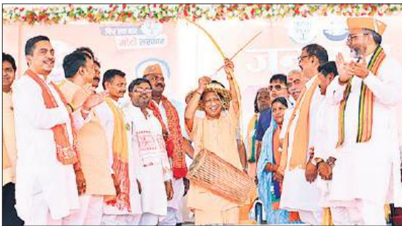
मुख्यमंत्री योगी आदित्यनाथ सोनभद्र में चुनावी रैली को संबोधित करने से पहले यहां के स्थानीय उत्पाद बांस की बनी टोपी, तीर-धनुष और वाद्य यंत्र के साथ उत्साहित दिखे।

लगेगी और नौजवानों को नौकरी भी मिलेगी। कहा कि सपा के लोगों ने गरीबों के बेटों को मारने का संकल्प