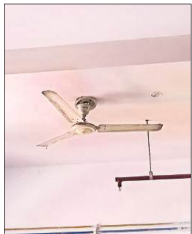
वार्ड में खराब पड़े पंखे। अमृत विचार

तकनीकी खराबी से हो सकता है वाटर कूलर खराब हो गया हो। जो भी कमियां संज्ञान में आई हैं उन्हें दुरुस्त कराया जाएगा। कूलर में पानी की व्यवस्था की जाती है। खत्म होने के बाद दोबारा क्यों नहीं भरा इसको लेकर जिम्मेदार पर कार्रवाई की जाएगी और सख्ती से पालन कराया जायेगा। इमरजेंसी में वार्ड ब्याय की जिम्मेदारी बनती है कि वह मरीज को स्ट्रेचर पर लेकर जाएं। इसके स्पष्ट निर्देश दिए गये हैं। वार्ड ब्याय के संबंध में जांच कराई जाएगी। चिकित्सकों को बोला गया है कि मरीजों को जेनेरिक साल्ट का नाम पर्चे पर लिख कर दें। ऐसा नहीं हो रहा है तो संबंधित के खिलाफ कार्रवाई की जाएगी और सख्ती से पालन कराया जायेगा। - डा. बृजेश कुमार सिंह, सीएमएस, जिला अस्पताल