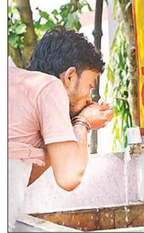
गर्म पानी पीते मरीज के परिजन।