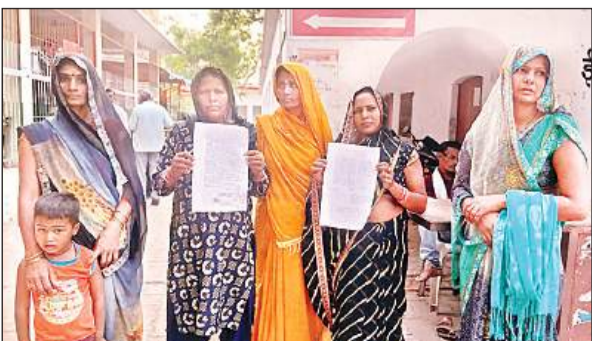
पुलिस को तहरीर देने जाती ठगी का शिकार महिलाएं।