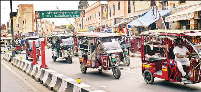
हनुमानगढ़ी के निकट बेतरतीब तरीके से दौड़ते ई-रिक्शों की बाढ़।

अमृत विचार : जुड़वाँ शहर अयोध्या और फैजाबाद के लिए ई-रिक्शा लाइलाज बीमारी बन गया है। शहरी क्षेत्र में ई रिक्शा की बाढ़ से अक्सर जाम के हालत पैदा हो रहे हैं और यातायात और आवागमन में बड़ी बाधा खड़ी हो रही है। अयोध्या आने वाले पर्यटक व श्रद्धालुओं से मनमाना किराया वसूली की शिकायतें आम हो गई हैं। पुलिस-प्रशासन की ओर से किए गए इंतजाम नाकाफी और अप्रभावी साबित हो रहे हैं। जिसके चलते बाहर से आने वाले श्रद्धालु ही नहीं स्थानीय लोग भी परेशान-हैरान हैं। ई-रिक्शा की बाढ़ के चलते मुख्य मार्गों पर तो थोड़ी गनीमत है लेकिन विभिन्न गलियों में आवागमन दुरूह हो गया है। आरटीओ विभाग जिले में लगभग 7 हजार ई-रिक्शा पंजीकृत होने के बात कहता है, वहीं यातायात पुलिस हजारों से ज्यादा अन्य जिलों में पंजीकृत रिक्शों के संचालन होने का दावा करता है। राम नगरी में बेतहाशा बढ़े ई-रिक्शा और चालकों के मनमानेपन से अयोध्या धाम और रामपथ की सूरत बिगड़ रही है। बाहर से आने वाले श्रद्धालुओं से अधिक किराया वसूला जा रहा है और उनसे झूठे दावे किए जा रहे हैं। सुबह होते ही राम पथ पर बड़ी संख्या में ई-रिक्शा दौड़ने लगता