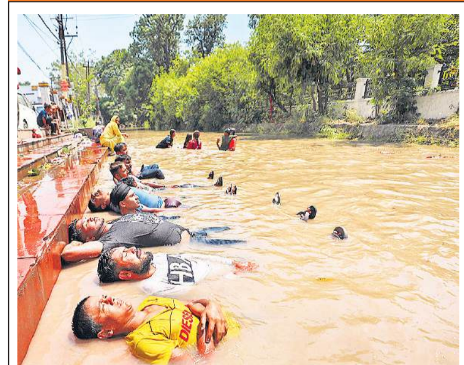
जम्मू में सोमवार को पड़ रही भीषण गर्मी के दिन नहर में नहाते लोग। बता दें कि घाटी में तपती गर्मी से बचने के लिए लोगों ने नदियों, झरनों और नहरों की ओर रुख कर लिया है।