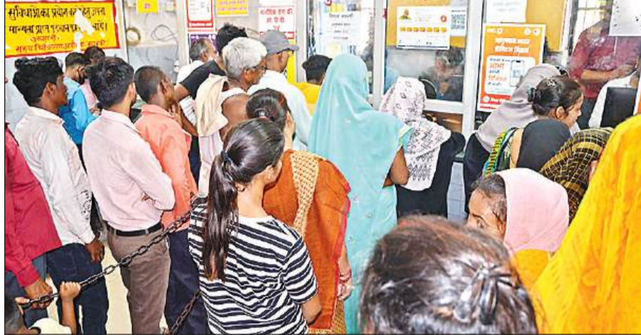
पर्चा बनवाने के लिये लगी मरीजों की लाइन।

अमृत विचार : जिला पुरुष अस्पताल में मरीजों को पर्चा बनवाने से लेकर डाक्टरों को दिखाने के लिए हर कदम पर दुश्वारियां ही दुश्वारियां उठानी पड़ रही हैं। नौपता की वजह से प्रचंड गर्मी में मरीज बड़ी आस लेकर अस्पताल आते हैं कि उन्हें बेहतर स्वास्थ्य सुविधाएं मुहैया कराई जाएंगी। लेकिन यहां तो कदम कदम मरीजों को दिक्कतें उठानी पड़ रही हैं। आलम यह है कि जिला पुरुष अस्पताल में मरीजों को शीतल जल की व्यवस्था तक उपलब्ध नहीं है। वाटर कूलर तो लगे हैं पर पानी गर्म दे रहे हैं। मरीजों और उनके तीमारदारों को बाहर से पानी की बोतल खरीदना पड़ रहा है। ओपीडी में कहीं डाक्टर मौजूद हैं तो कहीं अप्रेंटिस कर रहे चिकित्सकों के सहारे मरीज का इलाज चल रहा है। इसके अलावा तमाम डाक्टरों के साथ प्राइवेट लड़के मरीजों को बाहर की दवा भी लिखते मिलते। अमृत विचार के संवाददाता ने जब जिला पुरुष अस्पताल का मौका मुआयना किया तो पर्चा बनवाने से लेकर चिकित्सकों को दिखाने और दवा लेने तक मरीज कदम कदम पर दिक्कतों का सामना करते दिखाई पड़े। हमारे संवाददाता ने जो देखा उस असलियत को जिला प्रशासन और पाठकों तक पहुंचाने की कोशिश की है। जिससे प्रशासन का ध्यान मरीज की मूलभूत सुविधाओं की तरफ जा सके।