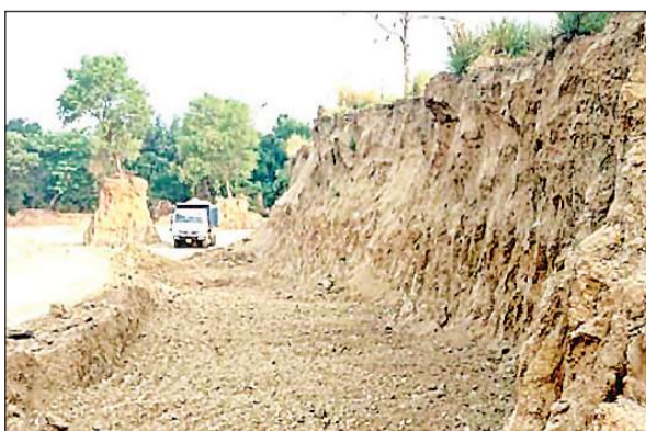
गंगा एक्सप्रेसवे के लिए मिट्टी ले जाने से हुआ गड्ढा।

लखनऊ प्रयागराज राजमार्ग में इस समय बाईपास का निर्माण चल रहा है। इस निर्माण कार्य में हरियाणा की कंपनी कालू वाला कंस्ट्रक्शन प्राइवेट लिमिटेड मिट्टी भराई का काम कर रही है। दूसरी