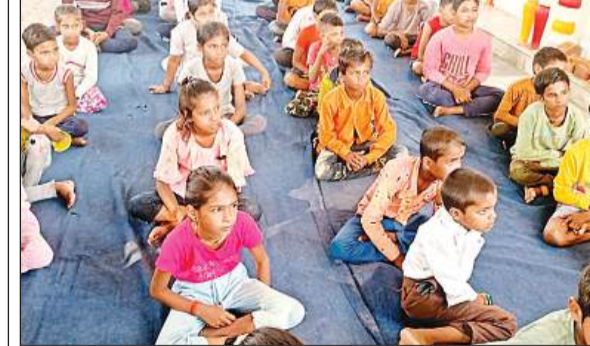
श्री बालेश्वर धाम परिसर में आयोजित संस्कारशाला में मौजूद बच्चे।