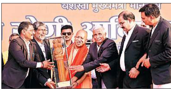
संवाद कार्यक्रम के दौरान मुख्यमंत्री योगी को स्मृतिचिन्ह भेंट करते अधिवक्ता।