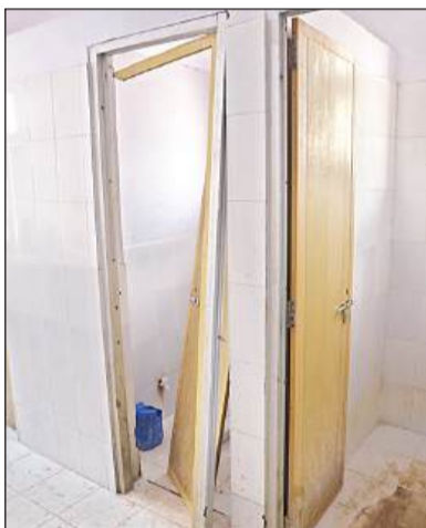
वाशरूम का टूटा दरवाजा। अमृत विचार