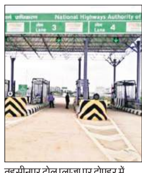
तहसीलपूर टोल प्लाजा पर दोपहर में पसर दिखाने सन्नाटा।

चुकी है। सुबह 11 से शाम 4 बजे तक घरों से बाहर निकलना खतरा की घंटी माना जा रहा है। लोगों के घरों में दुबकने के साथ हाईवे पर चलने वाले वाहन चालक भी अब दोपहर में कहीं ना कहीं छाया