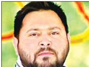
राजद नेता तेजस्वी यादव।