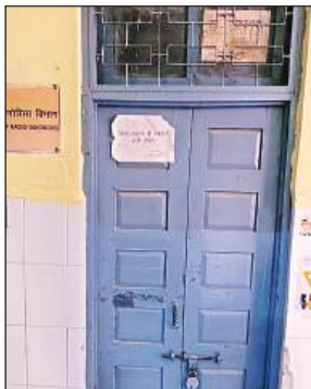
सीएससी में बंद एक्स-रे कक्ष।