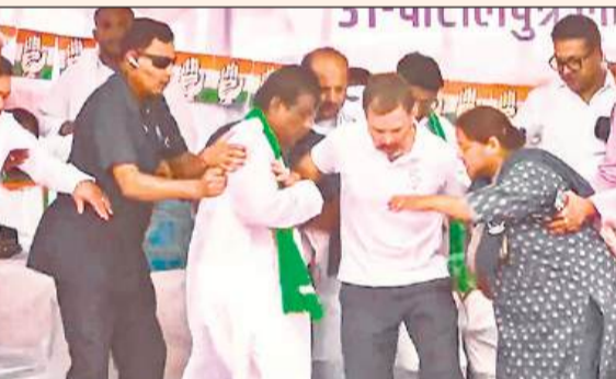
पालीगंज में रैली के दौरान मंच का एक हिस्सा टूट जाने के बाद राहुल गांधी और राजद नेता मीसा भारती अपना संतुलन बनाए रखने की कोशिश करती हुईं।

जनसभा मंच आंशिक रूप से टूटा, बाल-बाल बचे राहुल राहुल गांधी और तेजस्वी प्रसाद यादव सोमवार को उस समय बाल-बाल बच गए जब पटना जिले के पालीगंज में उनकी सभा के लिए बनाया मंच आंशिक रूप से टूट गया। गांधी सोमवार दोपहर को पाटलिपुत्र लोकसभा क्षेत्र से चुनाव लड़ रही राजद प्रमुख लालू प्रसाद यादव की बेटी मीसा भारती के पक्ष में एक रैली को संबोधित करने वाले थे। जैसे ही गांधी तेजस्वी और मीसा भारती के साथ मंच पर पहुंचे लेकिन बीच में मंच आंशिक रूप से गिर गया।