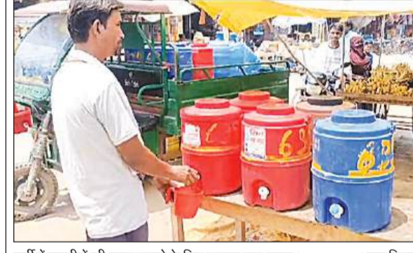
गर्मी में राहगीरों की प्यास बुझाने के लिए लगाया गया प्याऊ।