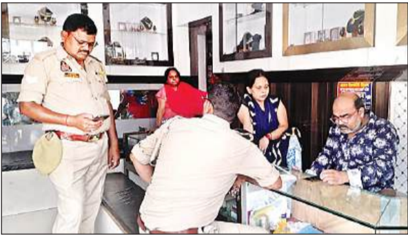
दुकानदार से पूछताछ करती पुलिस।

वारदात : सीसीटीवी फुटेज के जरिए बदमाशों की तलाश कर रही पुलिस