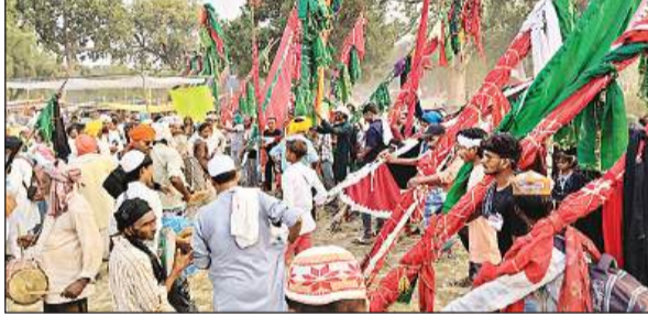
गाजी मियां के मेले में पहुंचे जायरीन।