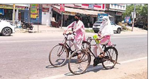
चिलचलाती धूप में सूनसान सड़क पर जाती छात्राएं।

सोमवार को क्षेत्र का अधिकतम तापमान 45 डिग्री रहा, जबकि न्यूनतम 37 डिग्री तापमान रहा। गौरतलब है कि गत शनिवार को अधिकतर तापमान 43 डिग्री था, जो रविवार को बढ़कर 44 पर चला गया। सोमवार को बढ़कर सीधा 45 डिग्री पर पहुंच गया है। लोग गर्मी से बचने के लिए तरह-तरह के उपाय कर रहे हैं। दूसरी तरफ ग्राहक न होने के कारण बाजारों में दुकानदार खाली बैठे हुए हैं। गर्मी