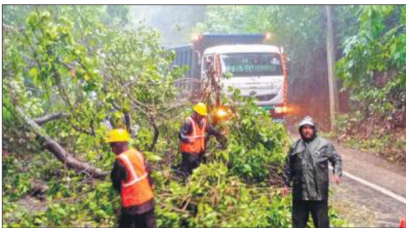
चक्रवात तूफान के कारण सड़क पर गिरे पेड़ को हटाने कर्मचारी।

135 किमी प्रति घंटे की रफ्तार से चली हवा, कोलकाता हवाई अड्डा 21 घंटे रहा बंद