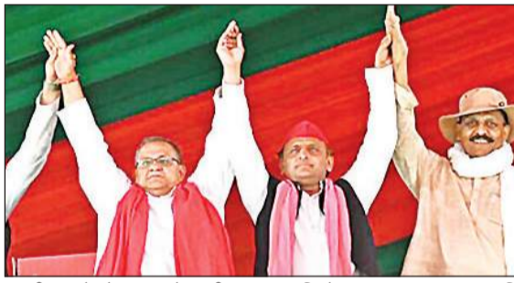
चुनावी सभा के दौरान सपा के राष्ट्रीय अध्यक्ष अखिलेश यादव।