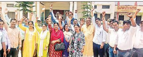
साकेत महाविद्यालय में प्रदर्शन करते शिक्षक व शिक्षिकाएं।

अमृत विचार : कामता प्रसाद सुंदर लाल साकेत स्नातकोत्तर महाविद्यालय के शिक्षकों ने विश्वविद्यालयी परीक्षाओं के बहिष्कार की घोषणा की है। कहा कि भीषण गर्मी में परीक्षा का आयोजन घोर अवमानवीय और संवेदनहीन निर्णय है। डॉ. राम मनोहर लोहिया अवध विश्वविद्यालय की परीक्षाएं 31 मई से प्रस्तावित हैं। शिक्षकों ने महाविद्यालय में प्रदर्शन भी किया।