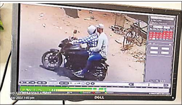
सीसीटीवी फुटेज में कैद बदमाशों की तस्वीर।