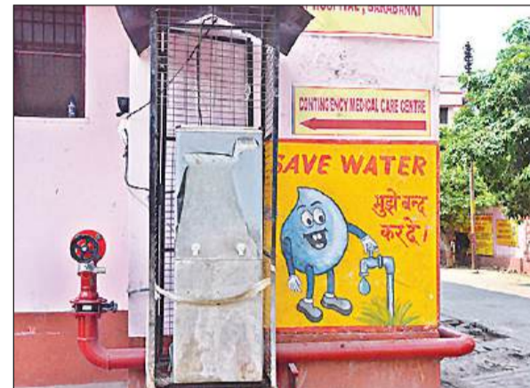
ट्रामा सेंटर के बगल खराब पड़ा वाटर कूलर। अमृत विचार