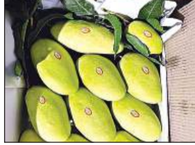
ब्रिकी के लिए पैक किए गए कच्चे आम।

भाव (रुपये प्रति दस किलो) बीते वर्ष इस वर्ष 300 से 400 500 से 600 फ्रूट बॉगिंग आम 700