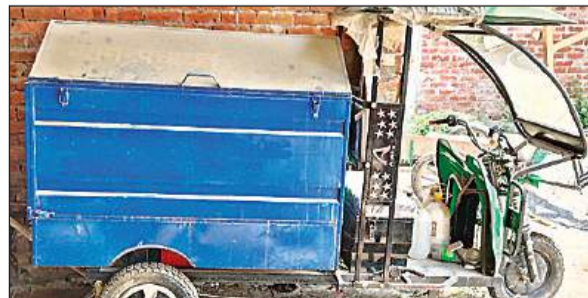
धूल फांकेते कचरा उठाने के लिए खरीदे गए ई-रिक्शा।

अमृत विचार : 'गाड़ी वाला आया घर से कचड़ा निकाल' गीत को ग्राम पंचायतों में लागू करने के उद्देश्य से घरों से कचरा उठाने के लिए खरीदे गए ई-रिक्शा खुद कचड़ा बनते जा रहे हैं। लाखों की कीमत से खरीदे गए यह ई-रिक्शा प्रधानों के दरवाजे पर खड़े होकर धूल फांक रहे हैं। ग्राम पंचायत में प्रत्येक घरों से कूड़ा लेकर उसे कूड़ा घर तक पहुंचाने के उद्देश्य से कचरे चार माह पहले विकास खंड देवा की 25 ग्राम पंचायतों में ग्राम निधि मद