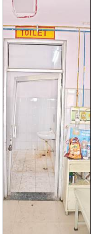
गंदा पड़ा वाशरूम

इमरजेंसी से निकलते ही तेज प्यास की वजह से व्याकुल अमृत विचार के संवाददाता ने टंडे पानी के लिए इमरजेंसी वार्ड के सामने लगे वाटर कूलर को खोला तो उसमें से गर्म पानी निकल रहा था। उससे आगे अस्पताल के रोड परिसर पर जब दूसरे दो लगे वाटर कूलर पर निगाह पड़ी तो वहां पहुंचे। कुछ तीमारदार पानी बोतल में यह कहते हुए भर रहे थे कि इतना पैसा कहाँ है कि बार-बार बीस रूपए की बोतल खरीद पाऊं। रिपोर्टर ने जब पूछा पानी टंडा है तो तीमारदार बोले इस गर्मी में भी यहां टंडा पानी नसीब नहीं।