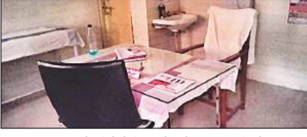
जिला अस्पताल की ओपीडी में खाली पड़ी चिकित्सकों की कुर्सीयों।

बाहर प्राइवेट प्रैक्टिस तक करते हैं। जिला अस्पताल की चरमराई स्वास्थ्य व्यवस्था को लेकर जिम्मेदार बेखबर बने हुए हैं। वहीं इसका खामियाजा दूरदराज से आने वाले रोगियों को भुगताना पड़ रहा है। कभी-कभी तो उनके जान पर तक बन आती है। विवश होकर निजी अस्पतालों की ओर रुख कर जाते हैं।