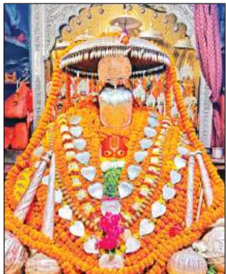
गर्भगृह में विराजमान हनुमानजी की मूर्ति।

अमृत विचार : ज्येष्ठ माह के पहले मंगलवार को सिद्ध पीठ अयोध्या हनुमानगढ़ी में सुबह चार बजे से भव्य श्रृंगार में हनुमानजी का दर्शन प्राप्त होगा। इसको लेकर हनुमान गढ़ी पर खास तैयारियां की गई हैं। वहीं श्रद्धालुओं को सकुशल दर्शन कराने के भी खास इंतजाम किए गए हैं।