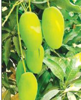
दिल्ली रवाना कर दी गई है। चार से पांच वाहन में आम को भेजा गया है। मिले भाव से बागवान उत्साहित हैं। कह सकते हैं कि पिछली बार की तुलना में लगभग