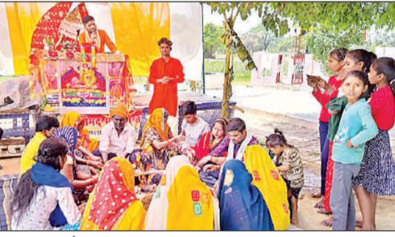
हवन पूजन करते भक्त।

अमृत विचार : क्षेत्र के जयचन्दपुर मजरे वैंती स्थित बड़े बाबा के मन्दिर प्रांगण में चल रही सात दिवसीय श्रीमद्भागवत कथा एवं ज्ञान यज्ञ के समापन पर शुक्रवार को प्रातः काल हवन पूजन एवं पूर्वाह्न 3 बजे से देर रात तक भण्डारे का आयोजन किया गया। जिसमें पुण्य की लालसा से पहुंचे हजारों श्रद्धालुओं ने मन्दिर में माथा टेककर प्रसाद ग्रहण कर मनोकामनाएं मांगीं। हवन पूजन एवं भंडारे के दौरान बड़े बाबा के जयकारों से समूचा मन्दिर प्रांगण गूँजता रहा। बड़े बाबा के मन्दिर प्रांगण में