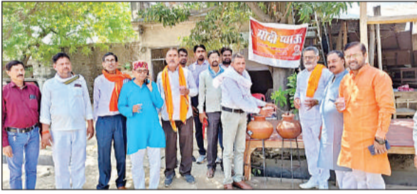
मोदी प्याऊ के उद्घाटन पर मौजूद भाजपा कार्यकर्ता।