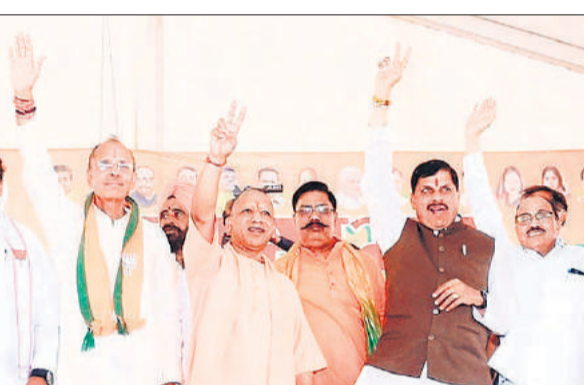
संभल के कैलादेवी धाम की जनसभा में लोगों का अभिवादन स्वीकार करते मुख्यमंत्री योगी और मंत्र के मुख्यमंत्री मोहन यादव व अन्य नेता।