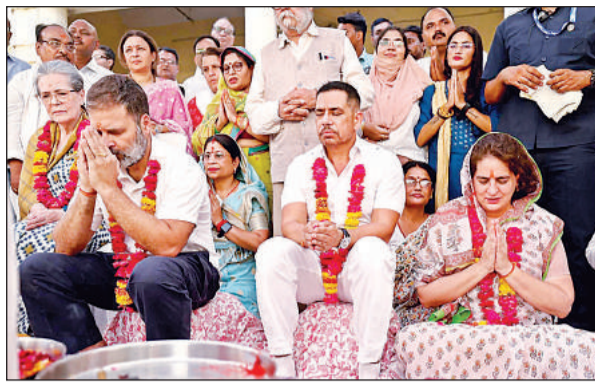
मा सोनिया गांधी, बहन प्रियंका वाड्रा के साथ पूजन करते कांग्रेस प्रत्याशी राहुल गांधी।