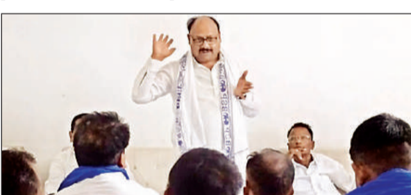
बैठक को संबोधित करते बसपा कार्यकर्ता।