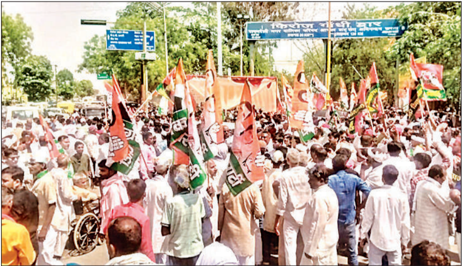
डिग्री कॉलेज चौराहे पर उमड़ा जनसंघर्ष।