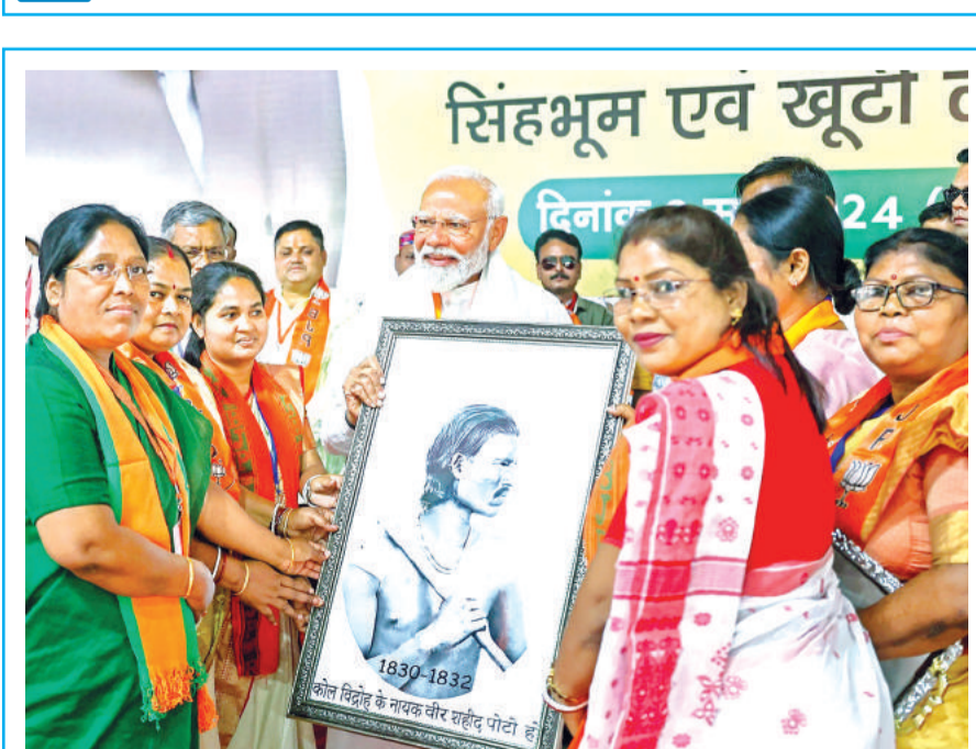
शिंहभूम में भाजपा प्रत्याशियों के लिए चुनावी जनसभा करने पहुंचे प्रधानमंत्री नरेंद्र मोदी को पार्टी की महिला कार्यकर्ताओं ने कोल विद्रोह के नायक शहीद का चित्र भेंट किया।