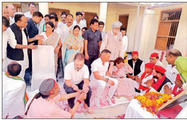
कांग्रेस केंद्रीय कार्यालय में नामांकन के बाद पूजन करते राहुल गांधी।