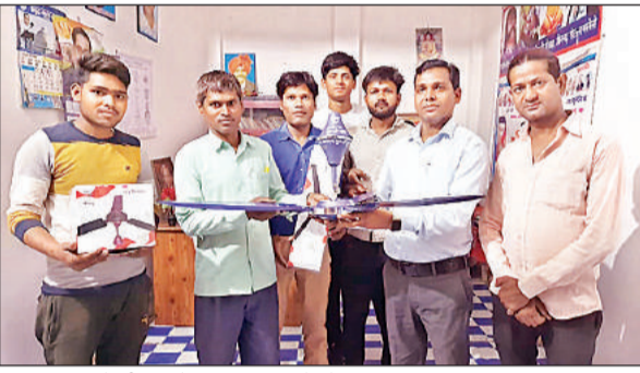
पुस्तकालय को सीलिंग फैन वितरित करते लोग।

गौरतलब हो कि गरीब छात्राओं के उत्थान के लिए पिछले कई वर्षों से बौद्ध उपासक महासभा कार्यालय में सामाजिक सहयोग से निःशुल्क पुस्तकालय चलाया जा रहा है। पुस्तकालय में पंचा न होने के कारण गर्मी के दिनों में अध्ययन करने वाले छात्र-छात्राओं को पढ़ाई