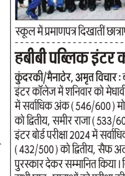
स्कूल में प्रमाणपत्र दिखाती छात्राएं और साथ में बेटे शिक्षक।