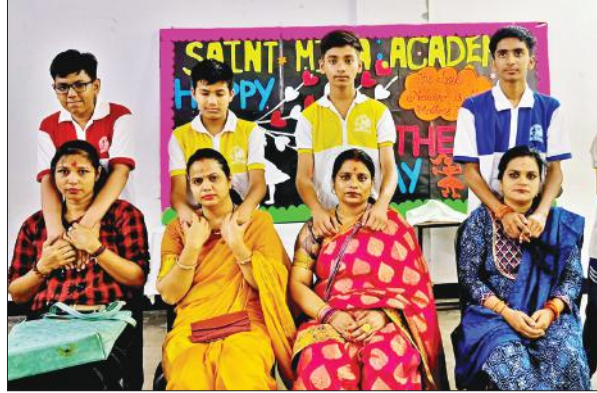
सेंट मीरा एकेडमी कांशीराम नगर में अपनी माता के साथ मौजूद छात्र।