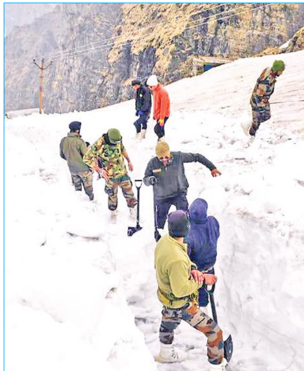
चमोली : हेमकुंड साहिब के मुद्रगुरा परिसर में जमी बर्फ को हटाने का काम जारी है। भारतीय सेना के जवान परिसर से बर्फ हटाते हुए।