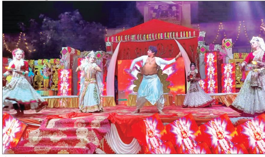
श्रीरामनवमी पर कार्यक्रम प्रस्तुत करते कलाकार।

अमृत विचार : श्रीरयाम मित्र मंडल की ओर से आयोजित दो दिवसीय श्रीरामनवमी महोत्सव में शुकवार रात कलाकारों ने झांकी से श्रद्धालुओं को श्रीराम लला के दर्शन कराए। श्रद्धालु भजनों पर झूम उठे।