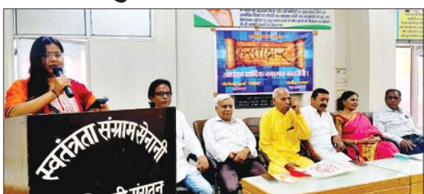
सेनानी भवन में आयोजित कार्यक्रम में बोलतीं ववता।

अमृत विचार : साहित्यिक संस्था हस्ताक्षर की ओर से शनिवार को मातृ दिवस की पूर्व संध्या पर काव्य गोष्ठी का आयोजन स्वतंत्रता सेनानी भवन में किया गया। इसमें सभी ने मां पर आधारित रचनाओं से मां की ममता रेखांकित की।