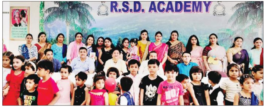
आरएसडी एकेडमी में मातृ दिवस के उपलक्ष्य में आयोजित कार्यक्रम में उपस्थित बच्चे व स्टाफ।