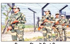
● ड्यूटी पर नहीं चलेंगी लंबी बालियां, चूड़ियां और खुले बाल

यह सब अनुशासन वाली फोर्स के लिए ठीक नहीं है। संकुल में यह भी कहा गया है कि अगर किसी महिला जवान ने ड्रेस कोड