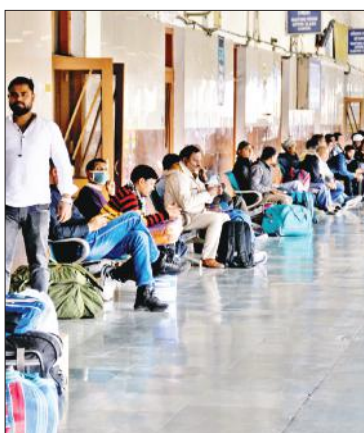
रेलवे स्टेशन पर ट्रेन का इंतजार करते यात्री।

अमृत विचार: गर्मी के मौसम में यात्रियों को ट्रेनों की लेटलतीफी दुश्चरियों भरा सफर करने पर मजबूर कर रही है। ट्रेनों के इंतजार में यात्री बेहाल हैं। पिछले एक महीने से अंबाला में किसान आंदोलन के चलते ट्रेनों का संचालन नहीं सुधर रहा है। शनिवार को भी मुरादाबाद से होकर गुजरने वाली 10 से ज्यादा ट्रेनें अपने निर्धारित समय पर नहीं पहुंच सकीं।