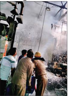
आग बुझाने का प्रयास करते कर्मी।

घटना की सूचना पर कंपनी के अधिकारी व सुरक्षा अधिकारी मौके पर पहुंचे। अग्निशमन गाड़ियां भी मौके पर पहुंच गईं। आग को काबू पाने के लिए कई अग्निशमन गाड़ियों को करीब दो घंटे तक पानी की बौझार करनी पड़ी। कंपनी के एचआर हेड वीसी