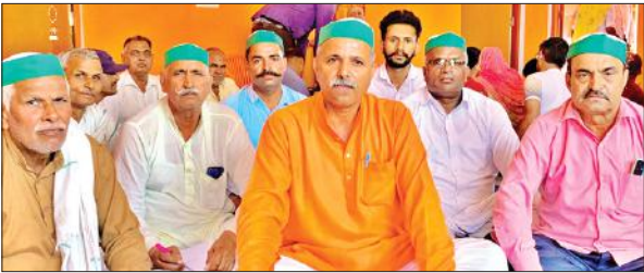
पंचायत में मौजूद भाकियू शंकर के पदाधिकारी।

हसनपुर, अमृत विचार : छेड़खानी की तहरीर देने वाली युवती ने कोतवाली पहुंचकर हंगामा किया। वह प्रेमी युवक का हाथ पकड़ कर बोली, इसी के साथ जीना है और इसी के साथ मरना है। युवती प्रेमी युवक के साथ चली गई है। कोतवाली क्षेत्र के गांव निवासी एक युवती ने गांव के युवक पर छेड़खानी करने का आरोप लगाया था। तहरीर के बाद पुलिस ने दोनों पक्षों को कोतवाली बुलाया था। जैसे ही युवती कोतवाली पहुंची तो उसने युवक का हाथ पकड़ लिया। वह कहा कि वह इससे प्यार करती है और इसी के साथ रहेगी। उसने बताया कि युवक के खिलाफ दबाव में तहरीर दी थी। परिजनों ने युवती को समझाने का काफी प्रयास किया। लेकिन उसने किसी की नहीं सुनी।