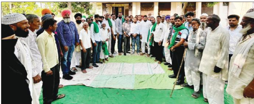
तथ्योपुर बिजली घर में मौजूद किसान।

विद्युत विभाग से संबंधित अपनी विभिन्न मांगों को लेकर भारतीय किसान यूनियन ने पूर्व में दिए गए जापन में लो वोल्टेज, जर्जर खंभे व तार, ग्राम मिट्टोपुर में 25 केवीए के ट्रांसफार्मर के स्थान पर 100 केवीए का ट्रांसफार्मर रखवाने की मांगें पूरी न होने पर बिजली घर का घेराव किया। किसानों ने एसडीओ व जेई को बंधक बनाकर रखा। बाद में एसडीओ ने कुछ मांगों का मौके पर निस्तारण करवाया। गांव मिट्टोपुर में एक माह में ट्रांसफार्मर रखवाने का आश्वासन दिया। ग्राम रसूलपुर डेला में नदी के कटान से नष्ट हुई विद्युत