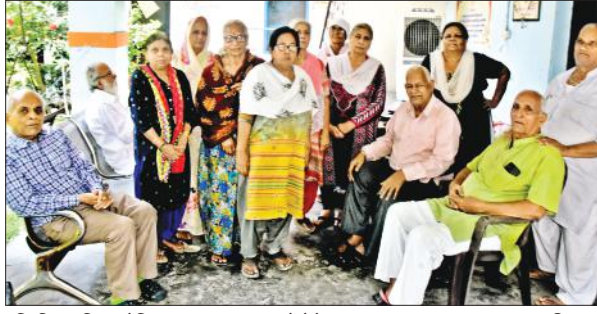
बुद्धि विहार स्थित वैदिक वानप्रस्थ आश्रम में बेटे वृद्ध।

बातें उन्हीं की जुबानी सुनी तो कुछ माताओं की कहानी पर आंखों से आंसू बहने लगे। बेटों से दूर रहने वाली कुछ मजबूर माताओं ने फिर भी अपने बेटों की तारीफ के कसिदे पढ़ने में कोई कसर नहीं छोड़ी। किसी ने बताया कि जैसे तो बेटा आता नहीं, शायद मातृ दिवस पर उसे मेरी याद आ जाए। तो किसी ने बताया कि मैं अपनी मर्जी से यहां रहती हूँ तो कोई कहने लगी मेरा बेटा मेरे लिए