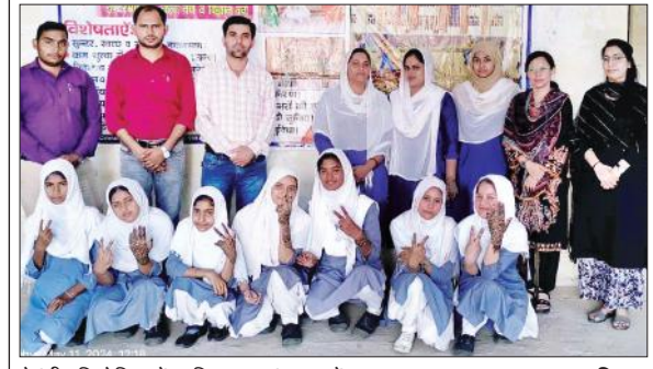
मेहंदी प्रतियोगिता में शामिल छात्राएं, साथ में अन्य।