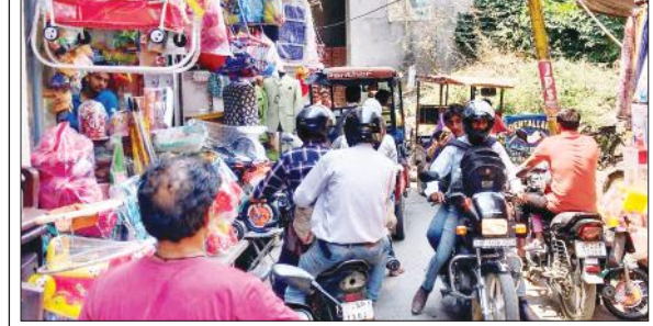
जाम में फंसे वाहन सवार।