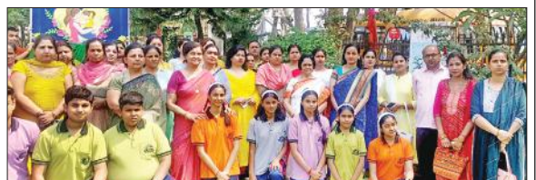
वालिया ग्लोबल अकादमी में हुए कार्यक्रम में शामिल छात्र-छात्राएं व अन्य।