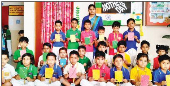
बुरावली में आयोजित कार्यक्रम में मौजूद बच्चे।

बुरावली, अमृत विचार : न्याय पंचायत बुरावली क्षेत्र केएसएलजे पब्लिक स्कूल, नालेज पार्क हाकमपुर में शनिवार को मातृ दिवस धूमधाम से मनाया। कलात्मक प्रतियोगिता में कक्षा नर्सरी से कक्षा दो तक के विद्यार्थियों के लिए शिक्षकों ने काइर्स बनाकर उन्हें अपनी माता के लिए भेंट करने की सलाह दी। कक्षा तीन से आठ तक के छात्र छात्राओं ने स्वयं अपनी माता के लिए काइर्स बनाए। कहा कि बच्चे माता से वादा करें, हमेशा उनका सम्मान करेंगे।