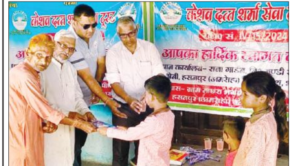
बच्चों को शिक्षण सामग्री बांटते ट्रस्ट के पदाधिकारी।