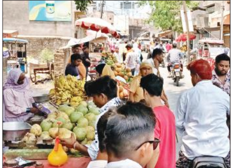
जिला अस्पताल के निकट ठेलों की वजह से संकरी हुई सड़क।

शंकर इंटर कॉलेज चौराहा से ही जिला अस्पताल की तरफ रास्ता जाता है। इसी रास्ते पर कचहरी का भी गेट है। कचहरी और जिला अस्पताल में रोजाना बड़ी संख्या में लोग पहुंचते हैं। फिर भी जिला अस्पताल के मार्ग