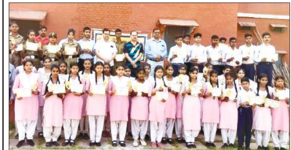
जेएस इंटर कॉलेज में कार्यक्रम में प्रमाण पत्र दिखाते विद्यार्थी।