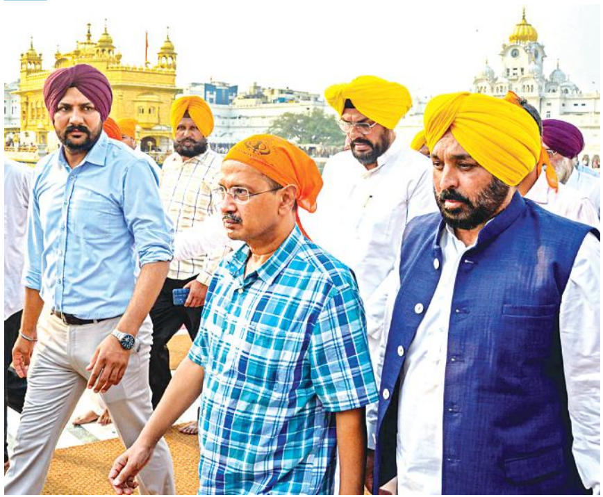
पंजाब में प्रचार के लिए पहुंचे दिल्ली के मुख्यमंत्री अरविंद केजरीवाल ने पंजाब के मुख्यमंत्री भगवंत मान के साथ अमृतसर में स्वर्ण मंदिर पहुंचकर माथा टेका और चुनावी सफलता की कामना की।