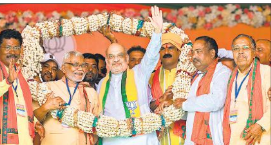
बिहार के मधुबनी में लोकसभा चुनाव के लिए एक सार्वजनिक रैली के दौरान केंद्रीय गृह मंत्री अमित शाह का अभिनंदन किया गया।

केंद्रीय गृह मंत्री अमित शाह ने गुरुवार को विपक्षी इंडिया गठबंधन पर प्रहार करते हुए कहा कि देश को एक मजबूत प्रधानमंत्री चाहिए, न कि बारी-बारी, एक-एक साल के लिए प्रधानमंत्री। बिहार के सीतामढी और मधुबनी में राजग उम्मीदवारों के पक्ष में अलग-अलग रैलियों को संबोधित करते हुए शाह ने कहा कि इंडिया गठबंधन वालों का कुछ होना नहीं है। पर मान लीजिए, वे स्वप्न में भी जीत जाते हैं तो उनका प्रधानमंत्री पद के लिए उम्मीदवार कौन होगा। ममता बनर्जी बन सकती हैं क्या, लालू बन सकते हैं क्या, स्टालिन बन सकते हैं क्या, शारद पवार बन सकते हैं क्या, जब गठबंधन वालों से पूछा गया कि