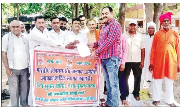
हसनपुर में तहसीलदार को ज्ञापन देते किसान।