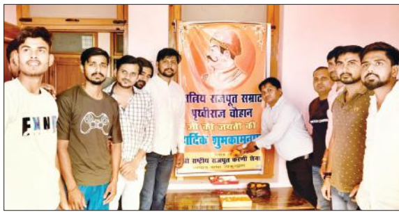
सम्राट पृथ्वीराज चौहान की जयंती मनाते राष्ट्रीय राजपूत करणी सेना के कार्यकर्ता।