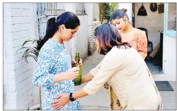
दयावती मोदी अकादमी के गेट पर परीक्षार्थी की तलाशी लेती शिक्षिका