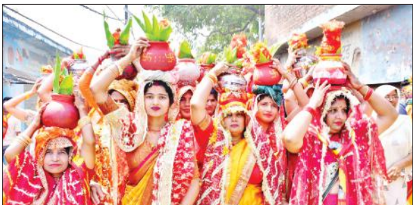
सैदनगर क्षेत्र में कलश यात्रा निकालती महिलाएं।