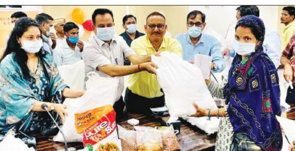
कलेक्ट्रेट सभागार में टीबी मरीजों को किट का वितरण करते अधिकारी।