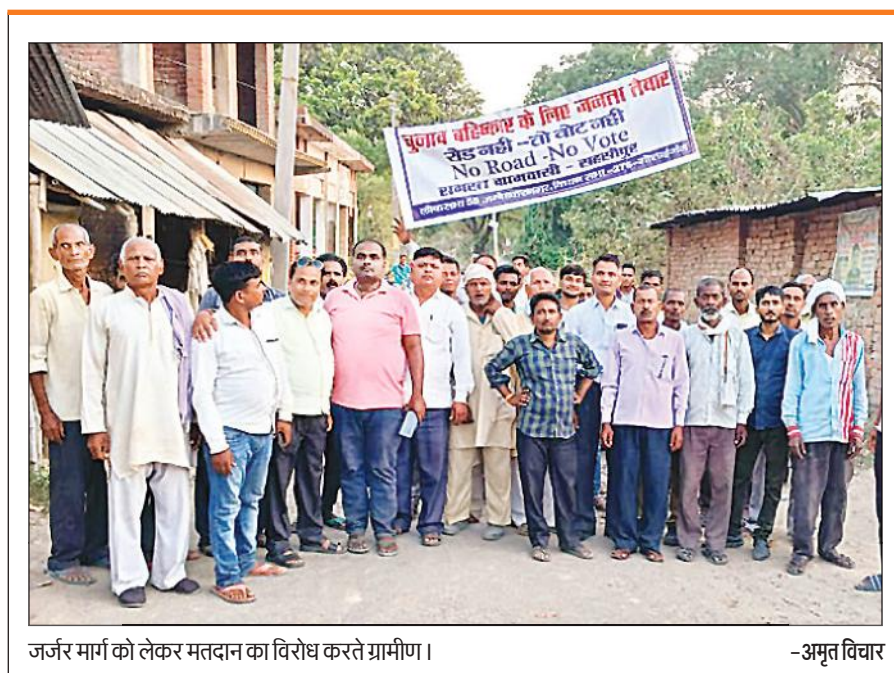
जर्जर मार्ग को लेकर मतदान का विरोध करते ग्रामीण।