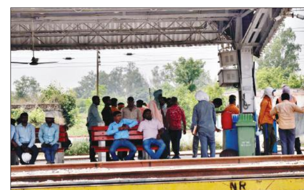
रेलवे स्टेशन पर बैठे कर्मचारी।

सात बजे रेलवे के अधिकारी पहुंचे। इसके बाद मशीन से उस पुल को हटाया गया। इस दौरान सुबह सात से दोपहर 1:40 बजे तक डाउन लाइन को बंद रखा गया। दो बजे से रेलवे ट्रैक को चालू किया गया। इसके बाद ट्रेनें चल सकीं।