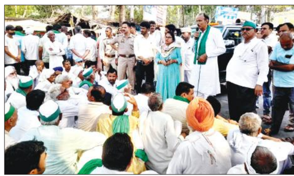
मंडी धनौरा में सड़क पर बैठे किसानों को संबोधित करते भाकियू के जिलाध्यक्ष।

भाकियू के पदाधिकारियों ने बताया कि फिना मार्ग स्थित गांव वालीपुर में संचालित ईट भट्टा मालिक द्वारा रात में ट्रैक्टर और डंपरों से मिट्टी डलवाई जा रही है। चीनी मिल प्रबंधन से किसानों का गन्ना भुगतान कराया जाए। क्षेत्र में बिजली कटौती की जा रही है। तहसील क्षेत्र में बांध की व्यवस्था कराई जाए। इन मुद्दों को लेकर 10 मई को इन भाकियू के कार्यकर्ताओं ने खनन अधिकारी, पीडब्ल्यूडी विभाग, चीनी मिल, बिजली विभाग, जिला चकबंदी अधिकारी को बैठक में बुलाने की मांग को लेकर जाम सौंपा