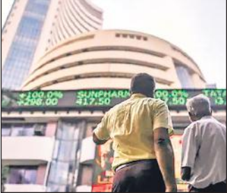
● अमेरिका में मुद्रास्फीति अनुमान से कम रहने के मिल रहे संकेत

स्थानीय शेयर बाजारों में गुरुवार को तेजी लौटी और बीएसई सेंसेक्स 676 अंक से अधिक के लाभ में रहा। वहीं एनएसई का निफ्टी भी 22,400 अंक के पार निकल गया। वहीं बुधवार को आई गिरावट के बाद बाजार गुरुवार फिर से संभल गया है और करीब एक प्रतिशत के लाभ में रहा। एचडीएफसी बैंक और इन्फोसिस जैसी बड़ी कंपनियों के शेयरों में लिवाली तथा अमेरिका तथा एशिया के अन्य बाजारों में तेजी से बाजार को समर्थन मिला। तीस शेयरों पर आधारित सेंसेक्स उतार-चढ़ाव भरे कारोबार में 676.69 अंक यानी 0.93 प्रतिशत की बढ़त के साथ 73,663.72 अंक पर बंद हुआ। कारोबार के दौरान यह ऊंचे में 73,749.47 अंक तक गया और