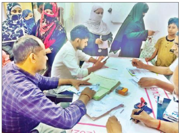
जिला अस्पताल की ओपीडी में मरीजों को दवा लिखते चिकित्सक।

अमृत विचार : गर्मी के मौसम में वायरल बुखार के साथ ही टायफाइड के मरीजों की संख्या बढ़ने लगी है। सरकारी व निजी अस्पतालों में टायफाइड के मामले सामने आ रहे हैं। इसे लेकर स्वास्थ्य विभाग सतर्क हो गया है। चिकित्सकों का कहना है कि इस मौसम में लोगों को खानपान में सावधानी बरतनी चाहिए। इसमें लापरवाही ही लोगों को बीमार बना सकती है। इस मौसम में लोगों को सावधानी बरतने की जरूरत है। अस्पतालों में वायरल बुखार के मरीज पहले से ही आ रहे हैं। अब टायफाइड के भी मामले सामने आने लगे हैं। चिकित्सक इसकी मुख्य वजह दूषित खानपान और सफाई न होना बता रहे हैं। चिकित्सकों का कहना है कि