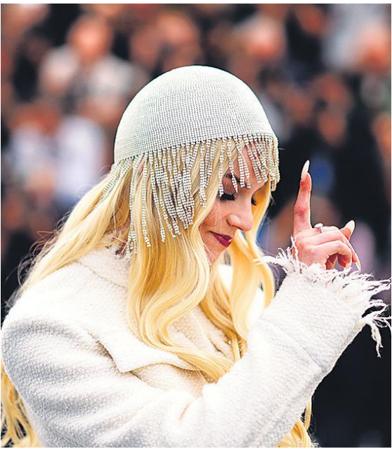
दक्षिण फ्रांस में आयोजित 77वें अंतरराष्ट्रीय कान्स फिल्म महोत्सव में फोटोग्राफरों के लिए पोज देती अभिनेत्री अन्ना टेलर-जॉय।