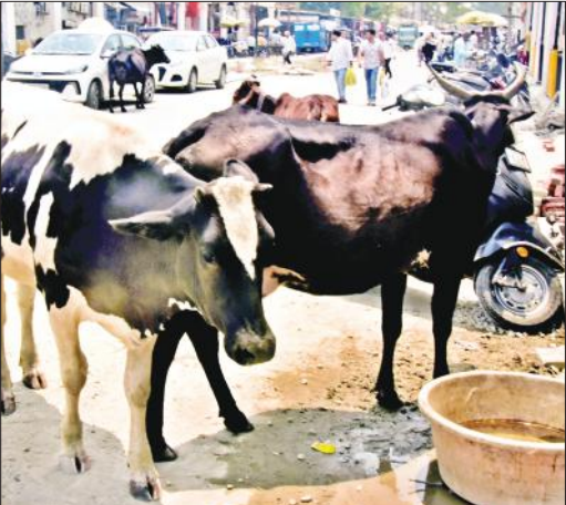
बुध बाजार में घूमते छुट्टा पशु।