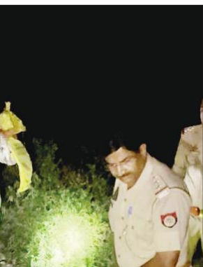
रेलवे ट्रैक पर युवक के शरीर के टुकड़े एकत्र करते पुलिसकर्मी। ● अमृत विचार

अमृत विचार : धमोरा रेलवे ट्रैक पर युवक का क्षत-विक्षत शव मिलने के बाद सनसनी फैल गई। सूचना के बाद पुलिस मौके पर पहुंच गई। इसके बाद युवक के शरीर के टुकड़े एकत्र कर पोस्टमार्टम के लिए भेजे गए। मृतक की शिनाख्त नहीं हो सकी है।