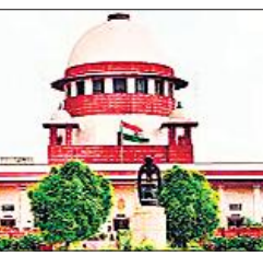
● सुप्रीम कोर्ट ने धन शोधन निवारण अधिनियम के प्रावधानों के संबंध में जारी किए निर्देश