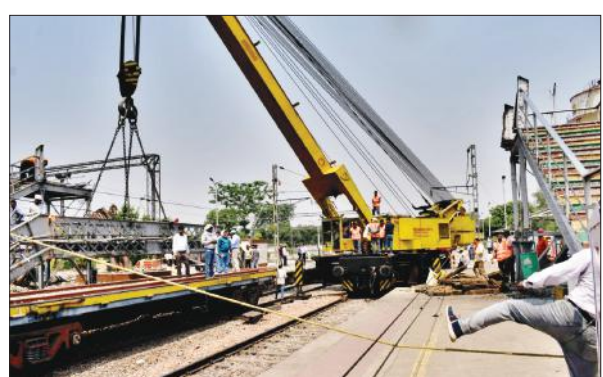
फुट ओवरब्रिज को हटती मशीन।

अमृत विचार : मुरादाबाद और बरेली से आई रेलवे की टोमों ने नवाबों के समय में बने फुट ओवर ब्रिज को गुरुवार को तोड़ दिया। इस दौरान डाउन लाइन को सुबह सात से दोपहर 1:40 बजे तक बंद रखा गया। नवाबी दौर के रेलवे स्टेशन पर फुट ओवर ब्रिज बना था। इसके सहारे यात्री प्लेटफार्म नंबर एक से दो और तीन पर जाते थे। लेकिन यह पुल धीरे-धीरे चटक रहा था। इसके ऊपर पड़ा लिंटर भी चटक गया था। इसके बारे में रेलवे के उच्च अधिकारियों को अवगत कराया गया था। इसके चलते करीब एक वर्ष से इसे पूरी तरह बंद कर दिया गया था। दो दिन पहले पुराने फुट ओवर ब्रिज को हटाने के आदेश जारी किए गए थे। इसके बाद गुरुवार को सुबह