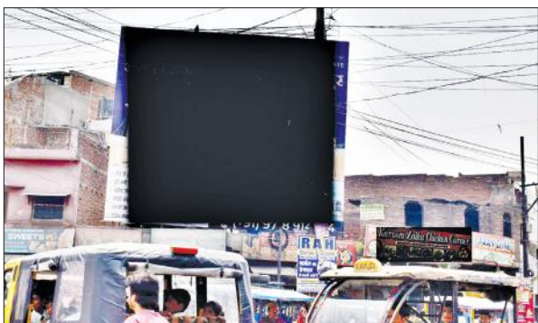
शाहबाद गेट चौराहे पर लगा होर्डिंग।

नगर पालिका की ओर से शहर में होर्डिंग और फ्लैक्स लगाने के लिए हर साल ठेका होता है। इसके बाद ही सार्वजनिक संपत्ति पर होर्डिंग और फ्लैक्स लगाए जाते हैं। पिछले साल 3.26 लाख रुपये का ठेका हुआ था। पालिका के अधिकारियों के मुताबिक ठेके की अवधि खत्म हो गई है। अवधि खत्म होने पर लोग सक्रिय हो गए हैं। लोगों ने होर्डिंग्स व फ्लैक्स से शहर को पाट दिया