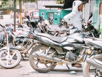
सुभाष रोड पर नर्सिंग होम के बाहर लगा बाइकों का जमावड़ा।

पर अवैध रूप से ठेले लगाकर फलों को बेचने का काम हो रहा है। आलम यह है कि सड़क के दोनों तरफ एक दो नहीं बल्कि दर्जनभर ठेले कतारबद्ध खड़े रहते हैं। जब लोग वाहन लेकर निकलते हैं तो अतिक्रमण के