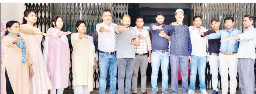
डेंगू से बचाव के प्रति जागरूक करने के लिए शपथ लेते स्वास्थ्य कर्मी।