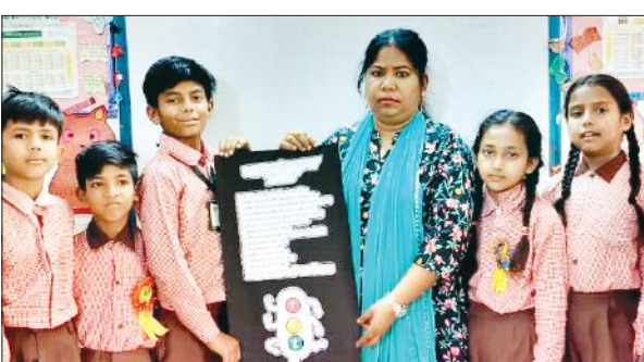
छात्र-छात्राओं को जागरूक करती प्रधानाचार्या।