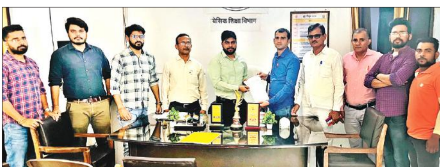
खण्ड शिक्षा अधिकारी को ज्ञापन सौंपते शिक्षक।