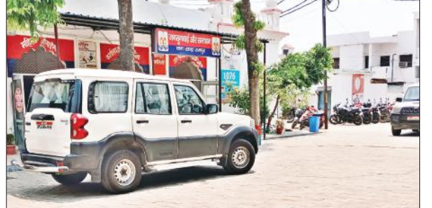
कोताली टांडा में खड़ी लखनऊ से आए अधिकारियों की स्कॉपियों। ● अमृत विचार

एक अप्रैल को लखनऊ एयरपोर्ट पर कस्टम अधिकारियों ने नगर के 36 लोगों को खाड़ी देश से सोना तस्करी व सिगरेट लाने के आरोप में पकड़ा था। इनमें से 29 आरोपी अधिकारियों को चकमा देकर फरार हो गए थे। उच्च अधिकारियों के आदेश पर फरार 29 लोगों के खिलाफ लखनऊ स्थित सरोजनी नगर थाने में रिपोर्ट दर्ज कराई गई थी। इसके बाद कस्टम विभाग और