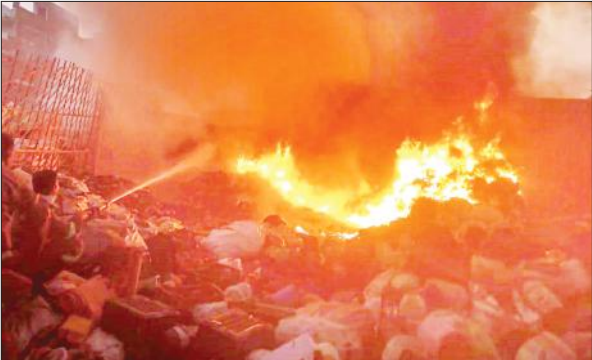
चौधरी सराय में कबाड़ गोदाम में आग बुझाने का प्रयास करते दमकल कर्मी।

युवती का कहना है कि युवक ने चुपचाप अपने फोन से दुष्कर्म का वीडियो बना लिया। युवती कहना है कि इस घटना के बाद युवक ने