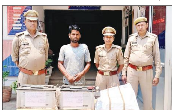
चोरी के सामान के साथ पुलिस की गिरफ्त में आरोपी।