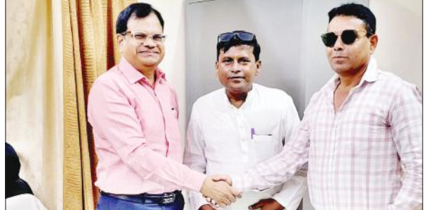
एसई से मुलाकात करते भाजपा अल्पसंख्यक मोर्चा के पदाधिकारी।