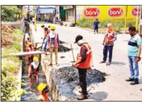
नालों की सफाई करते कर्मचारी।

हसनपुर, अमृत विचार : बरसात से पहले नगर पालिका प्रशासन ने नगर स्थित सभी नालों की सफाई कर्मचारियों से करनी शुरू कर दी है। ईओ ने नाला सफाई कार्य का निरीक्षण कर सफाई कर्मचारियों को कार्य में तेजी लाने के निर्देश दिए हैं। ईओ प्रदीप नारायण दीक्षित ने नाले सफाई कार्य का निरीक्षण किया। इस कार्य में 20 सफाई कर्मचारी लगाए गए हैं। ईओ ने बताया कि बारिश में किसी भी मोहल्ले में जलभराव की स्थिति न पैदा हो, इसके लिए पहले ही सफाई शुरू करा दी गई है। नगर में 28 नाले हैं, उनका सफाई का कार्य तेजी के साथ कराया जा रहा है।