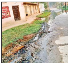
गांव नवाबपुरा में रास्ते पर पसरी गंदगी।