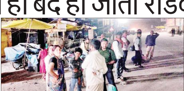
रोडवेज बस का इंतजार करते यात्री।

अमृत विचार : यूपी रोडवेज के चालक-परिचालक मनमानी से बाज नहीं आ रहे हैं। शाम ढलते ही नगर में रोडवेज बसों का संचालन बंद हो जाता है। इसके कारण रात में दूसरे शहरों से आने-जाने वाले यात्रियों को कठिनाई का सामना करना पड़ता है। रात में रोडवेज बसों के इंतजार में लोग आंबेडकर पार्क चौराहे पर खड़े रहते हैं। जब उन्हें एहसास हो जाता है कि रोडवेज बस नहीं आएगी तो वह बाइपास की तरफ रुख करते हैं। यात्री रात में बाइपास पर खड़े होकर रोडवेज बसों को रुकवाने का प्रयास करते हैं। लेकिन तेज रफ्तार बसें यात्रियों को बिना बैठाए ही निकल जाती हैं। रामपुर व बरेली के रोडवेज बस अड्डों पर अक्सर शाम ढलते ही रोडवेज बसों के चलकर व परिचालकों का मूड बदल जाता है। यात्री मिलक