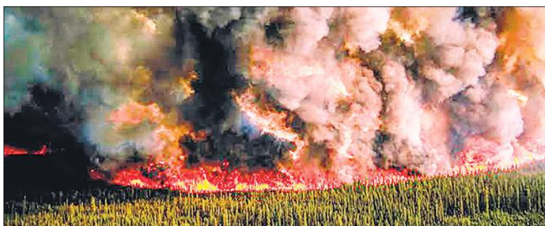
कैनेडा के जंगलों में लगी भीषण आग का दृश्य।

अमृत विचार : जंगलों में आग के कहर से न केवल भारत के कई हिस्से झुलस रहे हैं, बल्कि कैनेडियन जंगलों में लगी भीषण आग ने अमेरिका के कई देशों को धुंदा धुंआ कर दिया है। जिस कारण संयुक्त राज्य अमेरिका के महानगरों की आबो हवा बेहद खराब हो चली है। प्राकृतिक संसाधन कनाडा ने रिपोर्ट जारी कर कैनेडियन जंगलों में लगी आग से अनाहक किया है। रिपोर्ट में कहा गया है कि कैनेडियन जॉम्बी की आग फिर तेजी भड़कने लगी है, जो आने वाले दिनों में रौद्र रूप धारण ले सकती है। सैटेलाइट के जरिए जंगलों में आग का मानचित्र तैयार किया गया है और समय रहते काबू