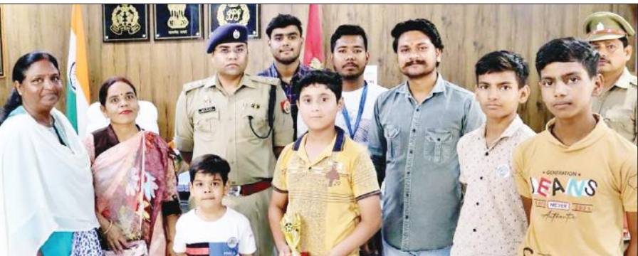
पुलिस अधीक्षक के साथ शूटिंग चैंपियनशिप के विजेता खिलाड़ी।