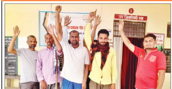
एसडीएम कार्यालय के बाहर प्रदर्शन करते लोग।