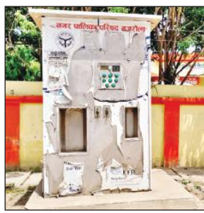
गजरोला में खराब पानी की मशीन।

इस समय तापमान रोजाना बढ़ रहा है। ऐसे में पानी की हर किसी को जरूरत बढ़ गई है। लेकिन शहर में अत्यवस्था ऐसी है कि सीएचसी के बाहर ठंडे पानी के लिए मरीज भटकते नजर आते हैं। चौपला पर लगी