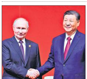
पुतिन का स्वागत करते जिनपिंग।

● पूर्वोत्तर एशिया में अमेरिकी आधिपत्य स्थापित करने के प्रयासों की निंदा की