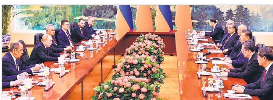
बीजिंग में दलबल के साथ बैठक करते चीन व रूस के राष्ट्रपति।

चीन के राष्ट्रपति शी जिनपिंग और रूसी राष्ट्रपति व्लादिमीर पुतिन के बीच गुरुवार को बीजिंग में एक महत्वपूर्ण बैठक हुई जिसमें दोनों नेताओं ने हिंद-प्रशांत क्षेत्र में नाटो के रुख को विनाशकारी करार दिया। साथ ही पूर्वोत्तर एशिया में शक्ति संतुलन को बदल कर अमेरिकी आधिपत्य स्थापित करने के प्रयासों की निंदा की। अपने 5वें कार्यकाल के लिए शपथ ग्रहण करने के बाद पुतिन पहली विदेश यात्रा पर दो दिन की चीन की राजकीय यात्रा पर बीजिंग आये हैं। चीनी राष्ट्रपति ने यहां अपने पुराने मित्र रूसी राष्ट्रपति का पारंपरिक ढंग से भव्य स्वागत किया। दोनों नेताओं ने द्विपक्षीय, क्षेत्रीय एवं महत्वपूर्ण वैश्विक मुद्दों पर गहन विचार विमर्श किया। पुतिन ने अपने बयान में चीनी राष्ट्रपति के साथ उनकी बातचीत को असाधारण, गहन और सार्थक करार दिया। उन्होंने कहा चीनी राष्ट्रपति शी जिनपिंग के साथ हमारी आज की असाधारण गहन और सार्थक वार्ता को जारी रखते हुए द्विपक्षीय सहयोग के मौजूदा मुद्दों पर चर्चा करके बहुत खुश हूँ। उन्होंने कहा कि चीनी राष्ट्रपति के साथ बातचीत के बाद संयुक्त वक्तव्य