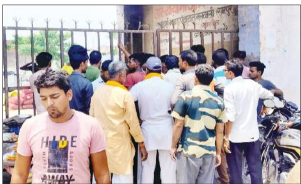
साप्ताहिक बाजार स्थल के मुख्य गेट पर ताला लगा होने के कारण एकत्र भीड़।

अमृत विचार : शुक्रवार की साप्ताहिक बाजार का स्थान बदल दिया गया है। अब बाजार नगर पंचायत कार्यालय के पीछे खाली पड़ी भूमि पर लगाया गया।