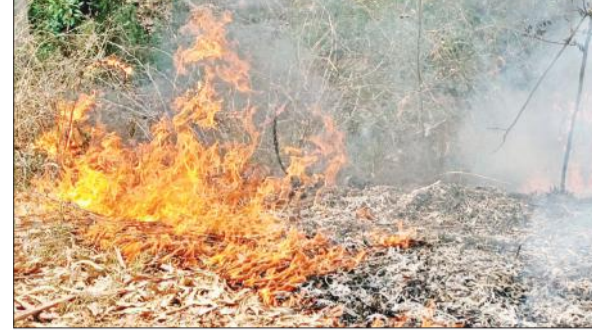
हसनपुर में सड़क किनारे झाड़ियों में लगी आग।