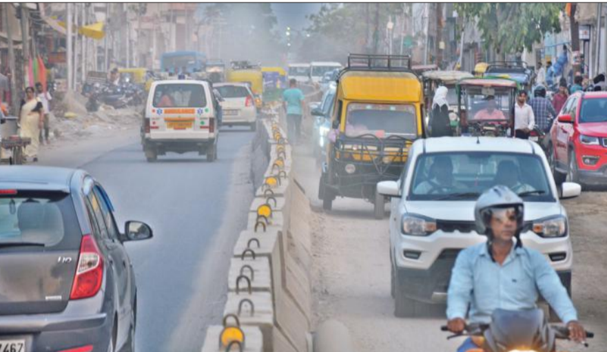
कांट रोड स्थित हरथला में सड़क पर उड़ती धूल।