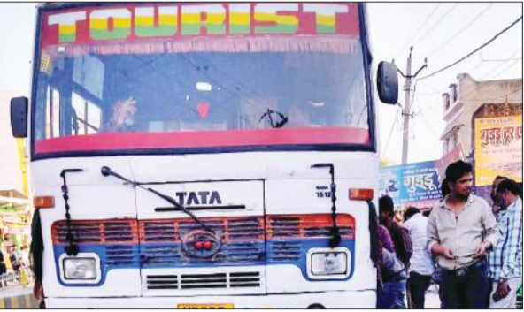
निजी बस में चढ़ती सवारियां।

अमृत विचार : जिम्मेदार अधिकारियों से शिकायत के बाद भी शाहबाद क्षेत्र में दौड़ रही डग्गामार बसों से सवारियां ढोने और दिल्ली सहित बाहरी राज्यों से सामान लाने का सिलसिला नहीं थम रहा है।