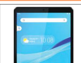
टैबलेट का प्रतीकात्मक फोटो।

टैबलेट मिलने के बाद शिक्षकों ने सिम का मुद्दा उठाया था। शिक्षकों की परेशानियों का समाधान करते हुए अब शासन ने सिम और उसके रिचार्ज कराने के लिए भी बजट पास कर दिया है। कहा कि सिम खरीदने के बाद उसमें 200 रुपये प्रतिमाह का रिचार्ज कराकर शिक्षकों को दी जाए। इसे लेकर विभाग ने तैयारियां शुरू कर दी हैं। जल्द ही शिक्षकों को सिम रिचार्ज भी कराकर दिया जाएगा।