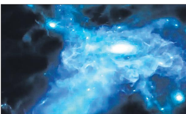
वैज्ञानिकों द्वारा खोजी हुई आकाशगंगा।

अमृत विचार : ब्रह्माण्ड की सबसे प्राचीन तीन आकाशगंगाओं को देख पाने की कामयाबी वैज्ञानिकों को मिली है। जेम्स वेब स्पेस टेलीस्कोप के जरिए यह सफलता मिली है। इन आकाशगंगाओं का जन्म 13 अरब साल पहले हुआ था। कोपेनहेगन विश्वविद्यालय के वैज्ञानिकों के अनुसार 13 अरब साल से भी पहले ब्रह्माण्ड में तीन सबसे प्रारंभिक आकाशगंगाओं को देखा है। यह सनसनीखेज खोज है, जो ब्रह्माण्ड के बारे में महत्वपूर्ण जानकारी प्रदान करने वाली है। खगोल विज्ञान के इतिहास में पहली बार यह खोज हुई है। इनका जन्म लगभग 13.3 से 13.4