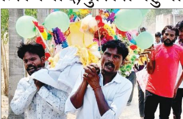
धनारी के गांव में शव यात्रा निकालते वाल्मीकि समाज के लोग।