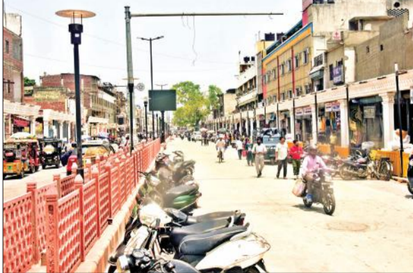
स्मार्ट सिटी प्रोजेक्ट के कारण बदला बुध बाजार का नजारा।

अमृत विचार: महानगर का हृदयस्थल इस महीने के अंत तक स्मार्ट हो जाएगा। नई तकनीक के लाइटों से जगमगाएगा। इस क्षेत्र में स्मार्ट रोड नेटवर्क और रेट्रोफिटिंग आफ ओल्ड मार्केट एरिया जैसे बड़ी परियोजनाओं का कार्य स्मार्ट सिटी के अन्तर्गत चल रहा है। कार्यदायी संस्थाओं पर सख्ती और स्मार्ट सिटी के महानिदेशक तकनीकी पर कार्रवाई के बाद अब काम में तेजी आई है। इस महीने के अंत तक सभी कार्य पूरा होने का भरोसा स्मार्ट सिटी के अधिकारी जता रहे हैं। जिसके बाद यह आने वाले लोगों को बेहतर अनुभव होगा।