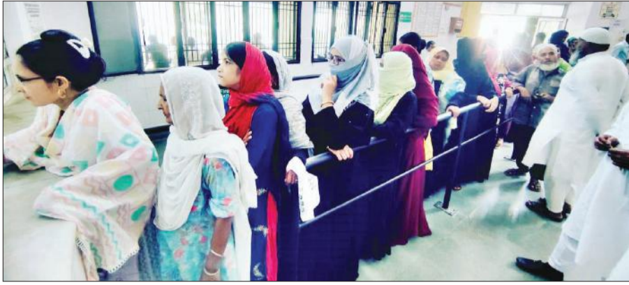
जिला अस्पताल में पर्चा बनवाने के लिए कतार में खड़े मरीज।

भीषण गर्मी से क्षेत्र के लोग बेहाल हैं। लोगों की जान तक गर्मी से जा रही है। गर्मी के प्रकोप के चलते जिले में बुखार, डायरिया, उल्टी दस्त के मरीजों की संख्या बढ़ती जा रही है। इन बीमारियों में सबसे ज्यादा बच्चे और बुजुर्ग चपेट में आ रहे हैं। यहां तक कि अब डायरिया जानलेवा हो रहा है। बुखार व डायरिया से शुक्रवार को धनौरा क्षेत्र के मजदूर की मौत हो गई। दरअसल थाना मंडी धनौरा