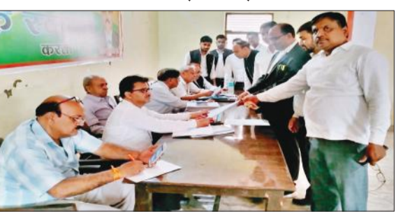
चन्दौसी बार एसोसिएशन के चुनाव को नामांकन पत्र जमा करते प्रत्याशी।