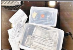
आरोपियों के कब्जे से बरामद सामान।