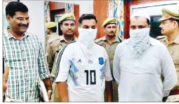
पुलिस अधीक्षक कार्यालय में मौजूद आरोपी।

अमृत विचार : सोना लूटने के मामले में फरार चल रहे दिल्ली के सराफा कारोबारी और एक आरोपी सहित दो को मिलक और एसओजी टीम ने छापेमारी करके रठौंडा के पास से गिरफ्तार किया है। गिरफ्तार किए गए लोगों से 100 ग्राम (बिस्कटनुमा) पीली धातु, 35 हजार रुपये, कार, तमंचा और कारतूस बरामद किए गए हैं। पुलिस ने पकड़े गए लोगों को कोर्ट में पेश किया। जहां दोनों को जेल भेज दिया गया।