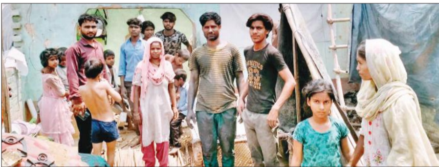
गांव मई में छत गिरने के बाद मजदूर का परिवार।

अमृत विचार: कोतवाली क्षेत्र के गांव मई में शुक्रवार को बारिश से बचाव के लिए छत पर मिट्टी डालते समय अचानक छत भारभरा कर ढह गई। मलबे में महिला व बच्चों समेत पांच लोग दब गए। मौके पर पहुंचे ग्रामीण राहत कार्य में जुट गए और मलबे में दबे लोगों को बाहर निकाला। गनीमत रही सभी के मामूली चोटें आयीं। मलबे में दब कर घरेलू सामान खराब हो गया।