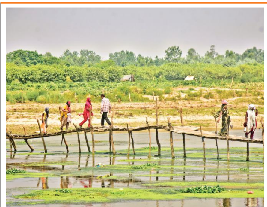
जिगर कॉलोनी में रामगंगा नदी के तट पर अस्थायी पुल से गुजरते लोग। इन दिनों नदी में पानी कम होने के कारण कई जगह लगी है। वहीं लोग इस पुल से गुजरकर अपने खेतों पर चारा लेने व फसलों की देखभाल को जाते हैं।

वहां रहने वाले लोग और दुकानदार दमा, अस्थमा जैसी बीमारियों की चपेट में आ रहे हैं। इसके अलावा रोज वहां से गुजरने वाले लोगों को भी परेशानी का सामना करना पड़ रहा है। सड़क के चौड़ीकरण के कार्य को अंजाम देने वाले मनमर्जी से कार्य कर रहे हैं। जिससे अब तक कार्य पूरा नहीं हो सका है। सड़क पर उड़ रही धूल से हो रहे प्रदूषण से क्षेत्रीय अधिकारी प्रदूषण नियंत्रण बोर्ड आशुतोष चौहान कांट रोड पर हो रहे प्रदूषण से अनजान बने हैं।