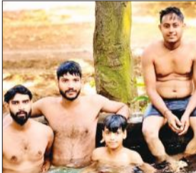
गर्मी से बचने को ट्यूबवेल में नहाते युवा।

शुक्रवार को अधिकतम तापमान 40 डिग्री सेल्सियस रहा। तापमान में वृद्धि ने लोगों को झुलसा दिया है। गर्मी में लोग घरो से निकलने में परहेज करने लगे हैं। लू ने लोगों की परेशानी को बढ़ा दिया है। चल रही गर्म हवाओं के कारण लोगों का शरीर झुलस रहा है। लोग पूरे शरीर को कपड़ों से ढककर घरो से निकलने को मजबूर हैं। गर्मी का प्रकोप बढ़ने के साथ ही दिन के समय शहर व गावों की सड़क व गलियां सुनसान हो जाती हैं। गर्मी में दुकानदार ग्राहकों का इंतजार करने