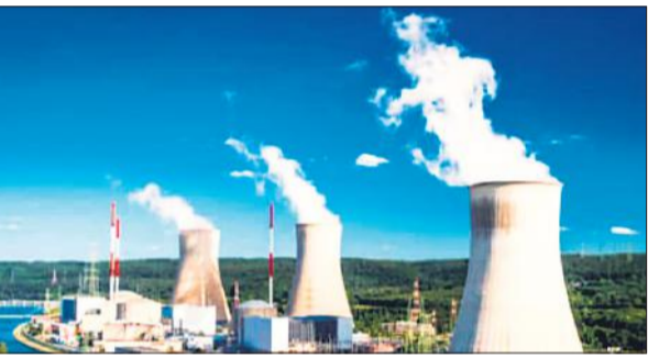
परमाणु संयंत्र की प्रतीकात्मक फोटो।