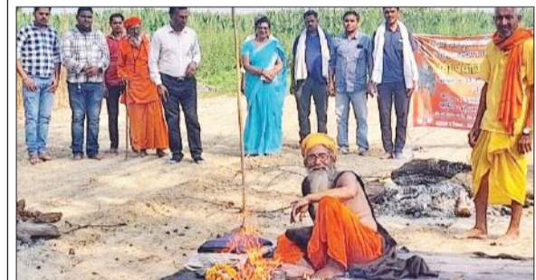
संभल में आग जलाकर तप करते संत।