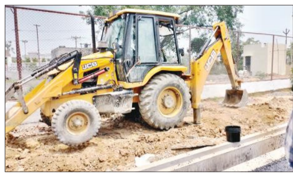
नवाब जुल्फिकार अली खां एस्ट्रोर्टफ स्टेडियम में साइडों को समतल करती जेसीबी।

अमृत विचार : पनवड़िया स्थित नवाब जुल्फिकार अली खां एस्ट्रोर्टफ स्टेडियम के जीर्णोद्धार में देरी करने पर कार्यदायी संस्था पर एक हजार रुपये प्रतिदिन का जुर्माना शासन से लगाया गया है। एस्ट्रोर्टफ बिछाने और स्टेडियम का कायाकल्प कराने के लिए आठ करोड़ रुपये का प्रस्ताव तैयार हुआ था। यह काम फरवरी तक कार्य मुकम्मल करना था। लेकिन, तय समय सीमा में कार्य नहीं निपट सका। स्टेडियम पर तेजी से काम निपटया जा रहा है।