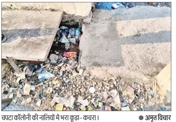
चपटा कॉलोनी की नालियों में भरा कूड़ा-कवरा।

अमृत विचार : नगर पालिका परिषद के वार्ड नंबर पांच की चपटा कॉलोनी में बनी नालियों में पानी की निकासी नहीं हो रही है।