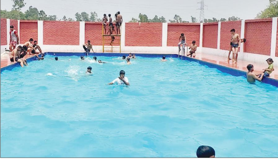
डिलारी दौराहा पर अवैध रूप से संचालित स्विमिंग पूल में नहाते बच्चे।

भीषण गर्मी से निजात पाने के लिए लोग स्विमिंग पूल में तैरने पर धनराशि खर्च करते हैं। लेकिन नगर में में पैसा खर्च करने के बावजूद लोगों को पर्याप्त सुविधाएं नहीं मिल पा रही हैं। हालात यह हैं कि पानी की सफाई, लाइफ गार्ड और दुर्घटना होने पर उपचार की व्यवस्था भी यहां नहीं है।