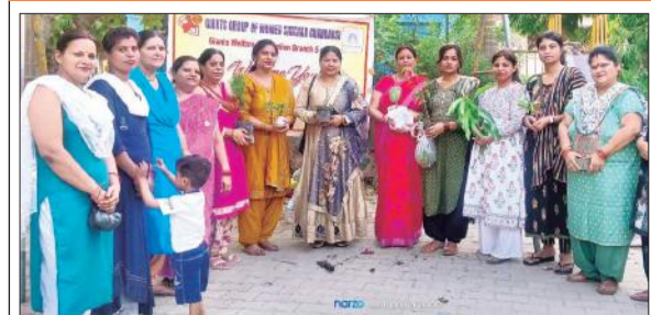
चन्दौसी में पौधारोपण करती जायंटस ग्रुप वूमन शिखर की सदस्य।