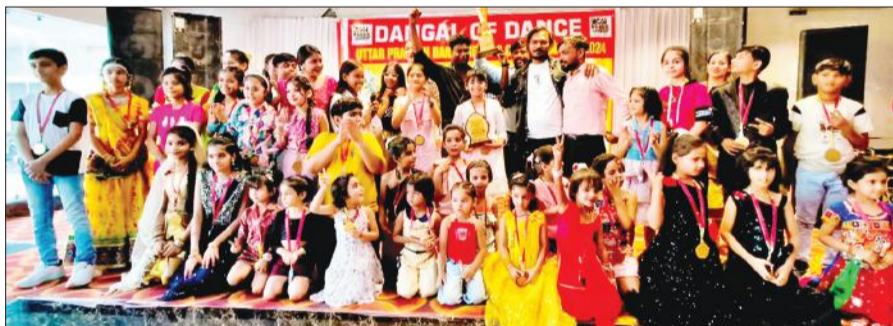
राज्य स्तरीय डांस प्रतियोगिता में विजय प्रतिभागियों को किया सम्मानित।