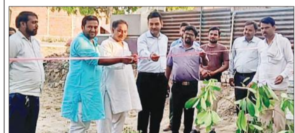
बबराला में पार्क का उद्घाटन करते चेयरमैन व ईओ।