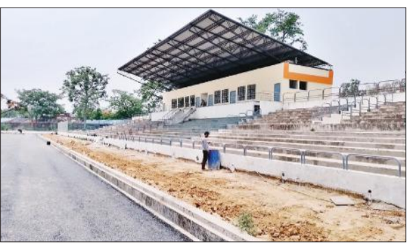
एस्ट्रोर्टफ लगने से बिछी डामर और सजा-संवरा पवेलियन।