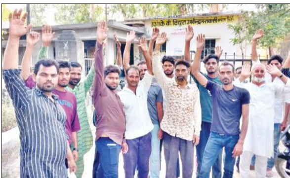
विद्युत उपकेंद्र पर प्रदर्शन करते गद्दीनगली के ग्रामीण।

गद्दीनगली के मझरा हुसैनगंज के ग्रामीण शुक्रवार को मसवासी बिजली उपकेंद्र पहुंचे। उन्होंने कर्मचारियों के खिलाफ जोरदार नारेबाजी की। आरोप लगाया कि दो दिन पूर्व गांव में 10 केवीए का ट्रांसफार्मर फुंका गया था। निगम के कर्मचारी फुंका ट्रांसफार्मर उतारकर ले गए थे। इसके बाद दूसरा फुंका ट्रांसफार्मर रखकर चले गए। ट्रांसफार्मर से लोगों के घरों में बिजली नहीं पहुंची तो ग्रामीणों को शक हुआ। उन्होंने निगम के अधिकारियों से संपर्क किया। इसके बाद कर्मचारियों ने ट्रांसफार्मर को चेक किया तो पता चला कि वह फुंका हुआ है। बिजली कर्मियों के इस