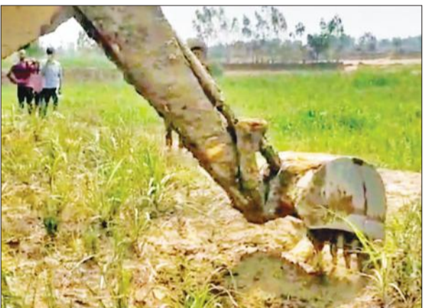
खेत में गोवंश के अवशेष दबाने को गड्डा खोदती जेसीबी।

शुक्रवार की सुबह जब ग्रामीण अपने खेतों पर जा रहे थे। थाना क्षेत्र पाकबड़ा एवं डिडोली अमरोहा के गांव की सीमा के गांव वारीपुर के जंगल में गोवंश के सिर व कटे हुए पैर मिले। इससे ग्रामीणों में हड़कंप मच गया। सूचना मिलते ही अन्य गांवों के लोग भी मौके पर पहुंच गए। बाद में पुलिस को सूचना दी गई। मौके पर पहुंची पुलिस ने परीक्षण के लिए डॉक्टर को बुलाया। डॉक्टर ने परीक्षण के लिए सैंपल लिए। इसी बीच बजरंग