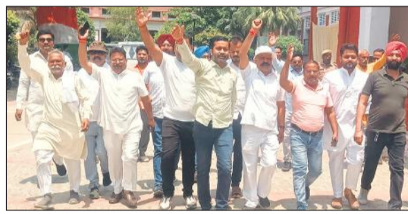
नारेबाजी करते हुए कलेक्ट्रेट में ज्ञापन देने जाते सर्व समाज के लोग।

विभिन्न संगठनों ने की सपाइयों पर कार्रवाई की मांग, कलेक्ट्रेट में लगाए सपा विरोधी नारे