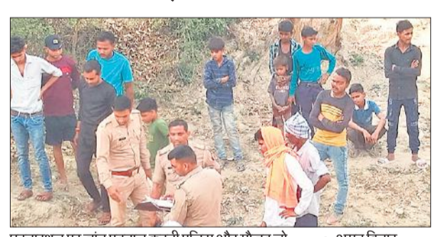
घटनास्थल पर जांच पड़ताल करती पुलिस और मौजूद लोग