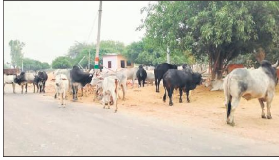
निगोही बीसलपुर हाईवे पर गांव पतराजपुर के पास पशुओं का जमावड़ा।

निगोही कस्बे से लेकर ग्रामीण क्षेत्रों में छुट्टा पशु हर जगह मिल जाते हैं लेकिन इनका हाईवे पर बसेरा लोगों के लिए जानलेवा बन रहा है। निगोही बीसलपुर हाईवे पर गांव पतराजपुर, पिपरिया खुशाली के पास पशुओं का झुंडा बड़ी संख्या में मौजूद रहता है। रात के समय में यह सड़क को पूरी तरह से घेर लेते हैं, जो जानलेवा तो साबित होते ही हैं, इनसे कई बार जाम की स्थिति बन जाती है। कस्बे में थाने के पास भी जमावड़ा रहता है। भारतीय किसान यूनियन ने इन छुट्टा पशुओं से निजात दिलाने के लिए कई बार अधिकारियों को ज्ञापन सौंपे लेकिन हर बार आश्रय देकर टरका दिया गया। इनकी वजह से कई लोगों की जान जा चुकी है और कई बार पशु भी बड़े वाहनों की चपेट में आकर मौत का शिकार हो चुके हैं।