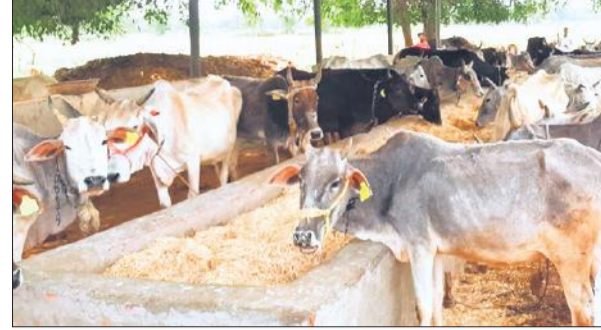
गोशाला में सूखा भूसा खा रहे गोवशीय।