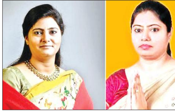
केंद्रीय मंत्री अनुप्रिया पटेल।