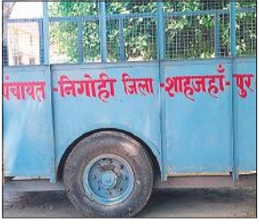
धूल फांक रही पशुओं को गो आश्रय स्थल ले जाने वाली ट्रॉली।

पशुओं को पकड़ने के लिए ली गई ट्रॉली फांक रही धूल