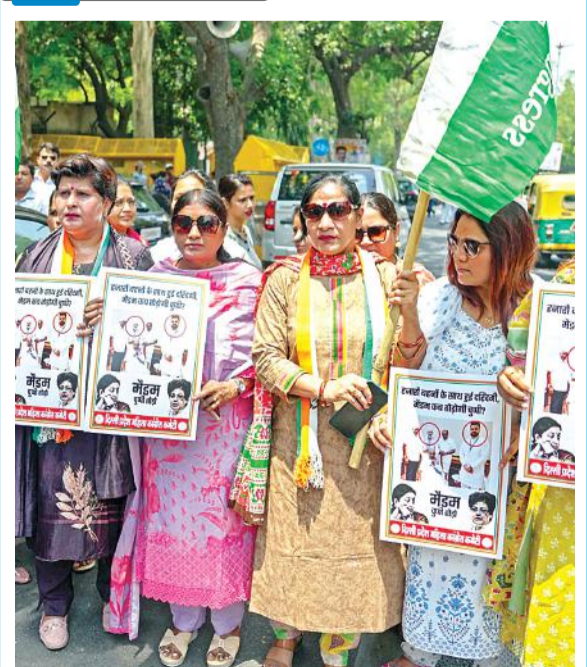
कर्नाटक में जेडीएस नेता प्रज्वल रवन्ना के अश्लील वीडियो सामने आने से नाराज दिल्ली महिला कांग्रेस की नेताओं ने प्रदर्शन किया और रवन्ना की गिरफ्तारी की मांग की। केंद्र सरकार पर रवन्ना का बचाने का आरोप लगाया।