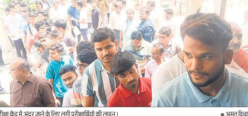
परीक्षा केंद्र में अंदर जाने के लिए लगी परीक्षार्थियों की लाइन।

अमृत विचार: नेशनल एलिजिविलिटी कम एंट्रेस टेस्ट (नीट) - यूजी परीक्षा रविवार को सात केंद्रों पर संपन्न हो गई। परीक्षा में जिले में 3097 परीक्षार्थी आवंटित किए गए थे, जिसमें 3014 परीक्षार्थी परीक्षा में शामिल हुए और मात्र 83 अभ्यर्थी अनुपस्थित हुए। अपराह्न दो से शाम 5.20 बजे तक चलने वाली परीक्षा के लिए परीक्षार्थियों को तीन घंटे पहले बुलाया गया था। चिलचिलाती धूप में तीन घंटे पहले केंद्र पर लाइन में खड़े परीक्षार्थी खासे परेशान होते रहे। कई बार परीक्षार्थियों के साथ पहुंचे अभिभावक भी गर्मी के कारण बिफरते रहे। नीट परीक्षा को नकलविहीन और निर्विघ्न संपन्न कराने के लिए सघन तलाशी की व्यवस्था प्रत्येक केंद्र पर की गई थी। महिला परीक्षार्थियों की तलाशी के लिए सभी केंद्रों पर ब्लैक केबिन बनाए