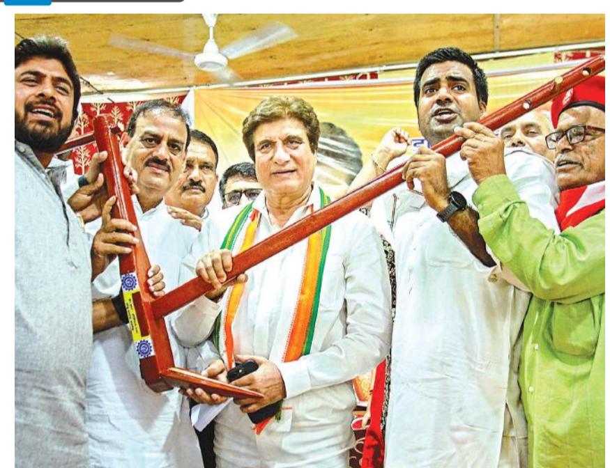
हरियाणा के गुरुग्राम से कांग्रेस के उम्मीदवार पूर्व फ्लिम अभिनेता राजबब्बर ने समर्थकों के साथ जनसंपर्क किया। इस दौरान पार्टी नेताओं ने उन्हें हल भेंट किया और किसानों की समस्याओं से अवगत कराया।