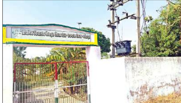
स्कूल में खराब पड़ा ट्रांसफार्मर।

सहायक द्वारा अपने मोबाइल फोन पर पंचायत गेट-वे मोबाइल एप और पंचायत गेट-वे पोर्टल इंस्टाल करें। आदेश के मुताबिक पंचायत सहायक, एकाउंटेंट-कम-डाटा इन्प्ट्री आर्परटर द्वारा ही अपने रजिस्टर्ड मोबाइल फोन से पंचायत गेट-वे एप पर व्यूआर कोड प्रमाणित कर लागिन किया जा सकेगा। कम्प्यूटर सिस्टम से ही सभी भुगतान किये जा सकेंगे। पंचायतीराज विभाग के अफसरों का कहना है कि अब पंचायत सचिवालय में ही कम्प्यूटर संचालित होंगे।