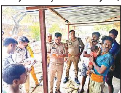
घटना के बाद जानकारी लेती पुलिस।