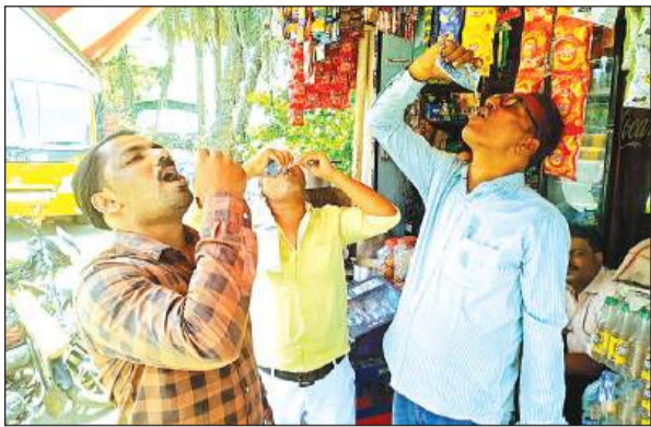
पाउच के पानी से प्यास बुझाते लोग।