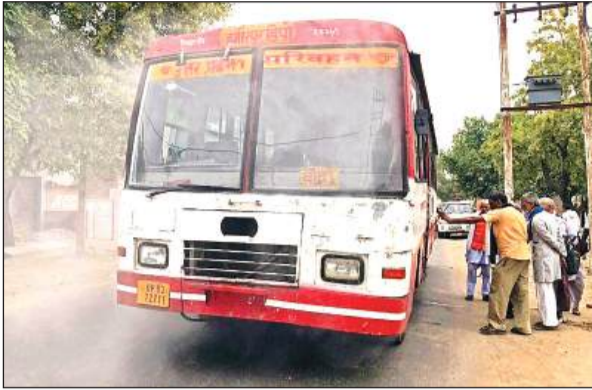
बस में वायरिंग में लगी आग के चलते निकलता धुआं व बाहर खड़ी सवारियां।

चालक ने पानी डालकर आग पर काबू पाया। सवारियों को दूसरी