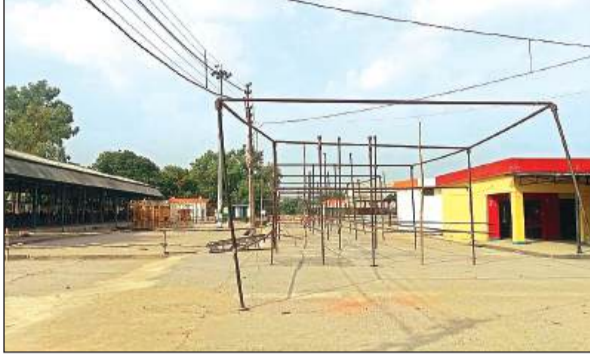
मंडी परिसर में लगाया जा रहा टेंट। अमृत विचार

● उपद्रवियों पर नजर रखने को होगा क्यूआरटी का गठन