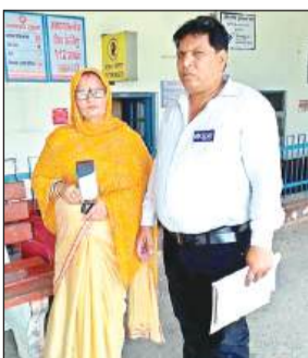
रेलवे स्टेशन पर टीटीई को ऑनलाइन टिकट दिखाती महिला।

अमृत विचार। अनारक्षित ऑनलाइन टिकट को लेकर पूर्वोत्तर रेलवे द्वारा चलाए गए जागरूकता अभियान का असर यह हुआ कि अब लोग मोबाइल फोन से एक क्लिक में टिकट खरीदने लगे हैं। रेलवे की मानें तो एक जागरूकता अभियान में ऑनलाइन टिकट बिक्री में दस प्रतिशत की वृद्धि हुई है। इससे टिकट विंडो पर भीड़ कम हुई है तो यात्री जल्दी टिकट के लिए एटीवीएम (ऑटोमेटिक टिकट वेंडिंग मशीन) का भी प्रयोग कर रहे हैं।