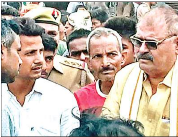
जाम लगाए ग्रामीणों को समझाते विधायक।