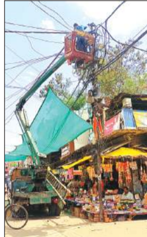
बिजली लाइन दुरुस्त करता बिजली कर्मी।

बिजली विभाग द्वारा किसी तरह नम्बर दो की लाइन को दुरुस्त किया गया तो शुक्रवार की देर शाम चौसियापुरा के पास लगे खंभे में अधिक लोड के चलते बिजली तार टूट गए, जिससे करीब एक सैकड़ मकान में अंधेरे छा गया। मोहल्लेवासियों ने काफी देर इंतजार किया कि बिजली आ जाए, लेकिन बिजली न आने पर सभी लोग