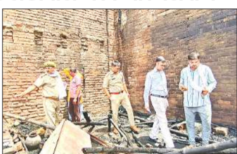
मौके पर जांच पड़ताल करते अधिकारी।