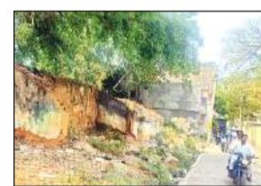
खंडहर पड़े सरकारी आवास।

● शहर के बीच खंडहर पड़े आवासों की जगह कार्पोरेट्स किराया जा सकता तैयार