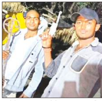
तमंचे के साथ वायरल फोटो।