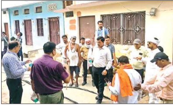
शहर के मध्यिया नाका में कामों की जांच करते बिजली अफसर।