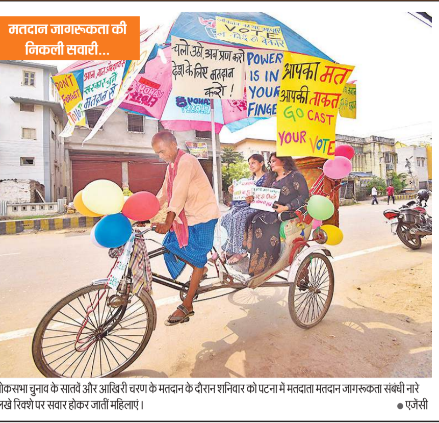
लोकसभा चुनाव के सातवें और अखिरी चरण के मतदान के दौरान शनिवार को पटना में मतदाता मतदान जागरूकता संबंधी नारे लिखे रिक्वेयर सवार होकर जाती महिलाएं।