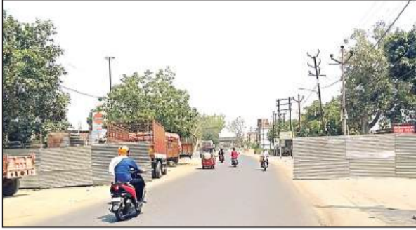
मंडी में मतगणना को लेकर जीटी रोड पर लगाए गए टिन के तख्ते। अमृत विचार

● स्टेट बैंक सरायमीरा से ही शुरू हो जाएंगे बैरियर