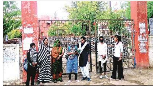
महाविद्यालय के गेट के बाहर खड़े परीक्षार्थी।

गौरतलब है कि बुंदेलखंड विश्वविद्यालय झांसी द्वारा सेमेस्टर परीक्षाएं चल रही थीं, लेकिन भीषण गर्मी और बढ़ते तापमान के चलते परीक्षा दौरान परीक्षार्थियों के बेहोश होने की सूचना मिलते पर कुलपति द्वारा दोपहर दो से चार बजे तक की परीक्षाओं का समय परिवर्तित कर चार बजे से शाम छह बजे का कर दिया गया है। ताकि परीक्षार्थियों को परीक्षा के समय तेज धूप और लू से