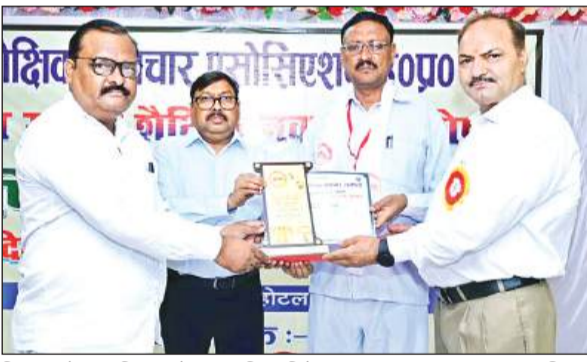
शिक्षक को सम्मानित करते संयुक्त शिक्षा निदेशक।

शैक्षिक नवाचार संगठन के तत्वावधान में पिछले दिनों प्रदेश की राजधानी लखनऊ में आयोजित राज्य स्तरीय शैक्षिक नवाचार संगोष्ठी और वार्षिक अधिवेशन में जनपद के साथ सात शिक्षकों ने