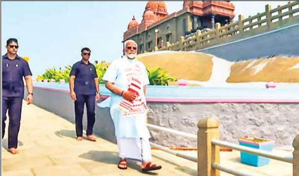
प्रधानमंत्री नरेन्द्र मोदी शनिवार को कन्याकुमारी में तिरुवल्लुवर प्रतिमा पर श्रद्धांजलि देने पहुंचे।

ध्यान सत्र के समापन पर, सफेद वस्त्र पहने मोदी ने स्मारक के बगल में स्थित उस परिसर का दौरा किया, जहां तिरुवल्लुवर की 133 फुट ऊंची प्रतिमा स्थित है और वहां एक विशाल माला चढ़ाई। वह नौका द्वारा प्रतिमा परिसर गए और बाद में वह तट पर पहुंचे। प्रधानमंत्री हेलीकॉप्टर से तिरुवनंतपुरम पहुंचे और वहां से दिल्ली के लिए रवाना हुए। मोदी ने 30 मई को यहां पहुंचने पर भगवती अम्मन मंदिर में पूजा-