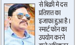
यात्री यूपीएस ऑन मोबाइल से टिकट खरीदने लगे हैं। जुलाई तक यह आंकड़ा 50 प्रतिशत तक पहुंचने की उम्मीद है।

मई में जनजागरूकता अभियान के कारण ऑनलाइन टिकटिंग प्रणाली से बिक्री में दस प्रतिशत का इजाफा हुआ है। स्मार्ट फोन का उपयोग करने वाले अधिकतर