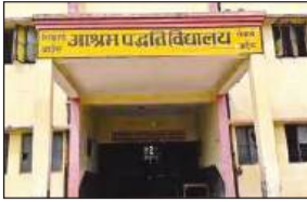
▶▶ विद्यालयों में लगभग 32 हजार छात्र-छात्राएं हैं अध्वनरत

अमृत विचार: समाज कल्याण निदेशालय के अधीन संचालित आश्रम पद्धति विद्यालय में गुरुजनों का अभाव है, इसलिए छात्रों को आशीर्वाद नहीं मिल पा रहा है। आश्रम पद्धति विद्यालय में प्रवक्ता और सहायक अध्यापकों के 653 पद खाली हैं। साथ ही कई जगह प्राचार्य भी नहीं हैं और कार्यवाहक के भरोसे विद्यालय चल रहा है। आचार संहिता समाप्त होने के बाद नियुक्ति प्रक्रिया शुरू हो सकती है। जिसके बाद गुरु जी छात्रों के