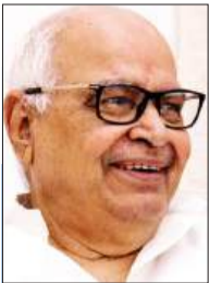
हृदय नारायण दीक्षित पूर्व विधानसभा अध्यक्ष उ.प्र.