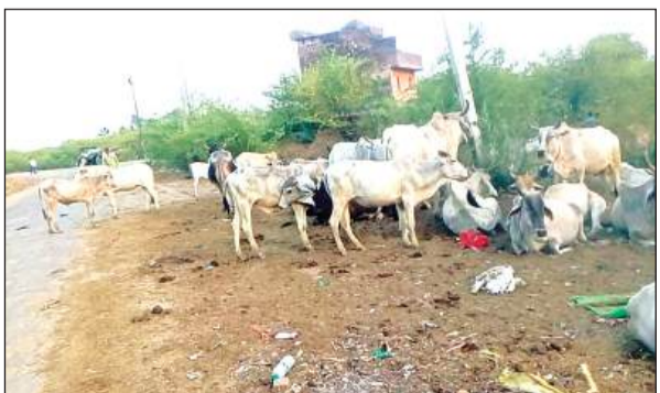
सड़क किनारे खड़े अन्ना मवेशी।

जिला प्रशासन द्वारा नहरों छोड़कर पोखर-तालाब भरने के निर्देश जारी किए गए थे, लेकिन आज तक सिंचाई विभाग के अधिकारियों द्वारा इस पर कोई अमल नहीं किया गया है। यही वजह