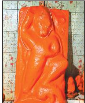
मंदिर में स्थापित हनुमान जी की मूर्ति।