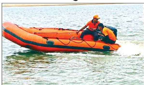
किशोरी की तलाश करती एसडीआरफ की टीम।