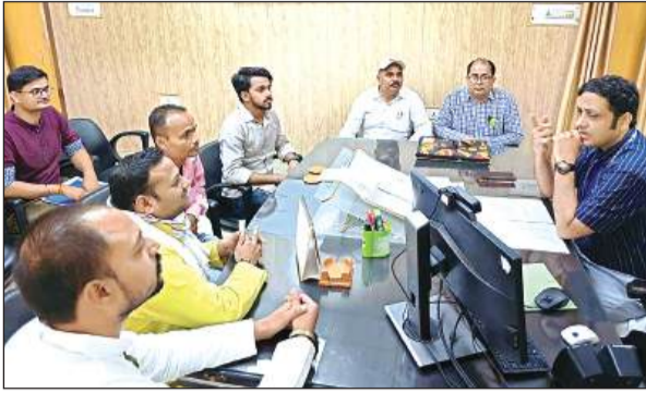
बिजली समस्याओं पर चर्चा करते एमडी व विधायक प्रतिनिधि।

हालांकि सदर विधायक के प्रयासों के चलते दक्षिणांचल विद्युत वितरण निगम के प्रबंध निदेशक को खुद मोर्चा संभालना पड़ा और उन्होंने शुक्रवार को यहां पहुंचकर अफसरों को विद्युत आपूर्ति दुरुस्त करने के लिए चेतावनी दी है। एमडी विद्युत ने शनिवार को भी अफसरों और आम जनता के प्रबुद्ध लोगों के साथ बैठक करके समस्या को समझा और उसके निदान को लेकर अधिकारियों को दिशा निर्देश दिए।