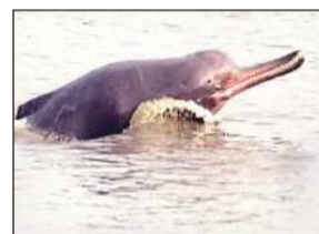
▶▶ केंद्रीय प्रदूषण नियंत्रण बोर्ड की गंगा नदी में प्रदूषण पर केंद्रित एक रिपोर्ट में दावा

दरअसल, नमामि गंगे योजना 2014 में शुरू हुई थी। इसके तहत गंगा समेत इसकी सहायक नदियों में प्रदूषण कम करने और सीवरेज क्षमता बढ़ाने पर खासा ध्यान दिया गया। इसी को