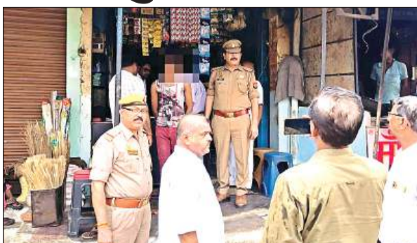
दुकानों में छापे मारकर बाल श्रमिकों की जानकारी लेती टीम।

को मजदूरी में न रखने की हिदायत दी गई। साथ यह भी कहा गया कि वे कर्मचारियों का नाम, उम्र, फोटो पहचान पत्र, पता, उपस्थिति रजिस्टर जरूर रखें। एएचटीयू थाना