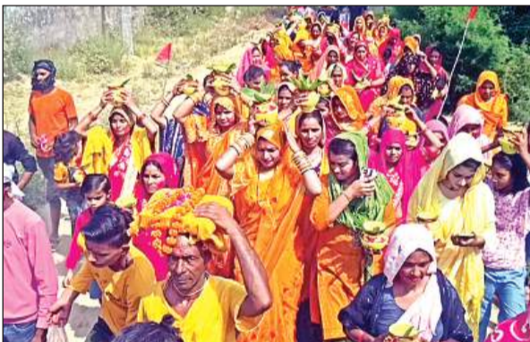
श्रीमद्भागवत कथा से पूर्व कलश यात्रा निकालती महिलाएं।