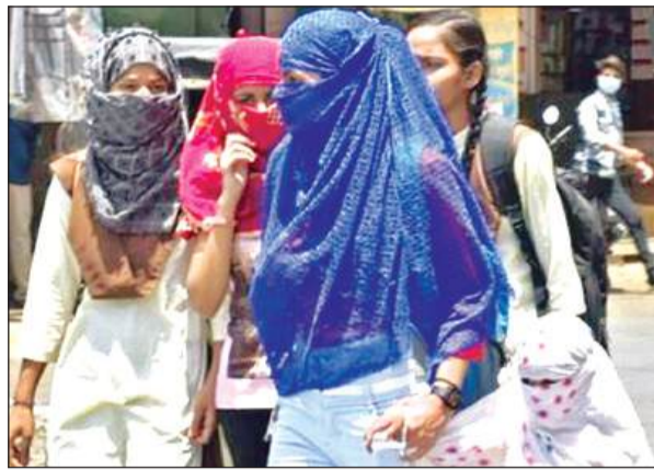
धूप से बचाव के लिए स्टॉल बांधकर जाती लड़कियां व बच्ची।

गौरतलब है कि नौतापा शुरू होते ही इस साल गर्मी पूरे शबाब पर पहुंच गई है, लोगों का गर्मी और लू के थपेड़ों से जीना दुश्वार हो गया है। भीषण गर्मी के चलते कोचिंग सेंटर भी बंद हो गए हैं। वहीं दूसरी तरफ दिन प्रतिदिन लू, भीषण गर्मी और उल्टी दस्त से हो रही मौके के बाद लोग सहमे हुए हैं, जिससे