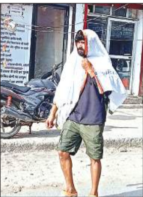
सड़कों पर निकलते लोग।

अमृत विचार। नौतपा के आठवें दिन भी गर्मी का कहर जारी रहा। लोग गर्मी से बचने को तरह तरह के जतन कर रहे हैं लेकिन शहर मानो आग की भट्टी की तरह तप रहा है। भीषण गर्मी और बढ़ती धूप की तपिश से लोग झुलस रहे हैं। एक दिन पहले की तुलना में तापमान में दो डिग्री की गिरावट दर्ज की गई। शनिवार को 44 डिग्री तापमान रहा। शनिवार के दिन शुक्रवार के मुताबिक अधिकतम तापमान में दो डिग्री सेल्सियस की गिरावट देखी गई बावजूद गर्मी और तपन से पीछा नहीं छूट सका। बताया जा रहा है कि गर्मी का लगभग पिछले चार दिन में करीब 20 साल का रिकार्ड टूटा है। फिलहाल लोगों को धूप की तपिश और गर्मी से राहत मिलती नहीं दिख रही है। चिलचिलाती धूप और भीषण गर्मी से बचने को लोग घरों में केद होने को मजबूर हो रहे हैं। सूर्यदेव मानो आग उगल रहे हैं उससे दिन व दिन हालात बद से बदतर होते जा रहे हैं। अब तो लोग कहने लगे कि उफ यह गर्मी क्या मार ही डालेगी। गर्मी से बचाव के संसाधन भी अब फेल होते नजर आ रहे हैं। छतों पर लगे पंखे गर्म हवा फैक रहे हैं। ऐसे ने पंखा न चलाया जाए तो पसीने से लोग तरबतर हो रहे हैं। भीषण गर्मी ने इस समय इंसानों के साथ पशु पक्षियों को आगोश में ले लिया है। लोग अब घरों से निकलने से डर रहे