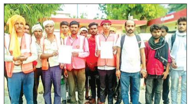
मारपीट से आक्रोशित कंपनी के श्रमिक।

जानकारी के मुताबिक, रायपुर बांगर में लागू डेढ़ वर्षों से नमामि गंगे योजना के तहत घर घर टेंटी से जल उपलब्ध कराने के लिए एमएचएल के लिए अग्रिम पुरा न होने से ग्रामीणों में आक्रोश व्याप्त है। शनिवार को इनका गुस्सा