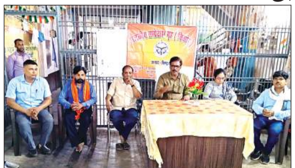
संवासियों को जानकारी देते अधिकारी।