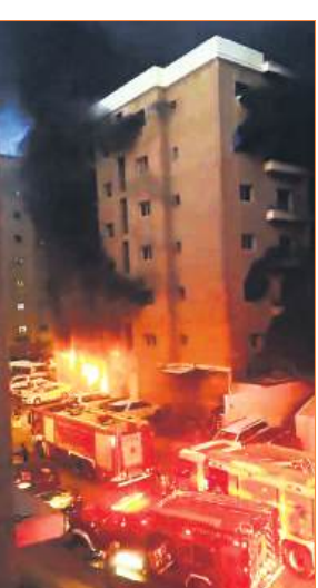
कुवैत के मंगाफ क्षेत्र स्थित छह मंजिला इमारत में आग लगने के बाद मौके पर आग बुझाने में लगी फायर ब्रिगेड की गाड़ियां।

कुवैत में श्रमिकों के आवास वाली एक इमारत में बुधवार को लगी भीषण आग में 41 लोगों के मारे जाने की आशंका है। खाड़ी देश से मिल रही खबरों के अनुसार, मरने वालों में कुछ भारतीय भी शामिल हैं। अधिकारियों ने बताया कि आग बुधवार तड़के कुवैत के दक्षिणी अहमदी गवर्नरेट के मंगाफ क्षेत्र में स्थित छह मंजिला इमारत के रसोईघर से लगी। बताया जा रहा है कि इमारत में करीब 160 लोग रहते थे, जो एक ही कंपनी के कर्मचारी हैं। कुवैत अपराध-विज्ञान विभाग के महानिदेशक मेजर जनरल ईद अल-ओवैहान के मुताबिक मृतकों की संख्या 35 से अधिक हो गई है। 15 घायलों को अस्पतालों में भर्ती कराया गया जिनमें से चार की बाद में मौत हो गई। मृतकों में अधिकतर भारतीय हैं, जिनकी उम्र 20 से 50 वर्ष के बीच है। बचाव अभियान