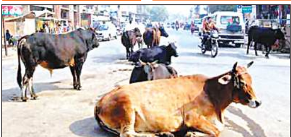
सड़क पर बैठे गोवंश।