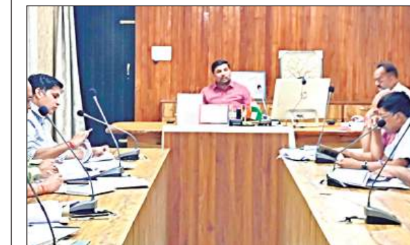
राजस्व संबंधी कार्यों की समीक्षा बैठक करते जिलाधिकारी।