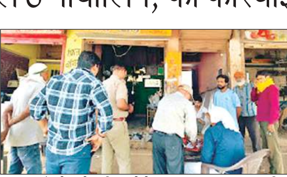
दुकान पर छापेमारी करती श्रम विभाग की टीम।