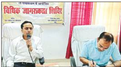
बैठक को संबोधित करते विधिक सेवा प्राधिकरण के सचिव। बुजुर्गों को फल वितरित करते चिकित्सक दंपति।

बुजुर्गों ने बताया कि कुलरों में वह खुद ही पानी भरते हैं। कर्मचारियों द्वारा पानी नहीं भरा जाता। वृद्धाश्रम में अत्यवस्थाओं की भरमार मिलने पर न्यायिक अधिकारियों का पारा चढ़ गया।