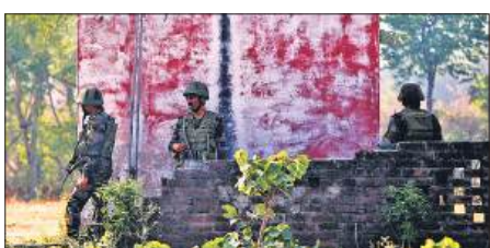
कठुआ के सैदा सुखल गांव में मोर्चा सभाले जवान।

जम्मू, एजेंसी जम्मू-कश्मीर के कठुआ जिले के एक सीमावर्ती गांव में छिपे एक आतंकवादी को सुरक्षा बलों ने 15 घंटे से अधिक समय तक चले अभियान में बुधवार को मार गिराया। इस दौरान एक अन्य आतंकवादी को भी मार गिराया गया।