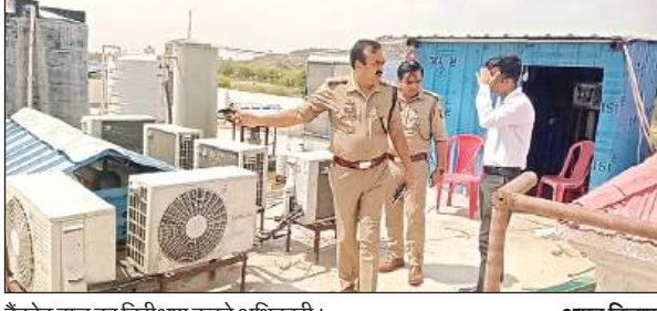
बैंकवेट हाल का निरीक्षण करते अधिकारी।

अमृत विचार। जिले में भीषण गर्मी को देखते हुए जिलाधिकारी के निर्देश पर विद्युत विभाग और अग्निशमन अधिकारी ने जिले में स्थापित बैंकवेट हाल का सुरक्षा की दृष्टि से फायर आडिट और विद्युत लोड चेक किया गया, जिससे ओवर लोड के चलते किसी भी तरह की घटना न घट सके। इतना ही नहीं मैरिज हाल, रेस्टोरेट, होटल, रिसेशन हाल में लगे एसी और विद्युत लोड का संयुक्त रूप से चेकिंग की गई। कई होटलों में बिजली स्वीकृत लोड से अधिक पाया गया। बिजली विभाग ने उन्हें चेतावनी जारी की है। जिले के अधिकारियों को संयुक्त चेकिंग से होटल संचालक और मैरिज हाल संचालकों में हड़कंप मच गया। गौरतलब है कि जिले में दिन