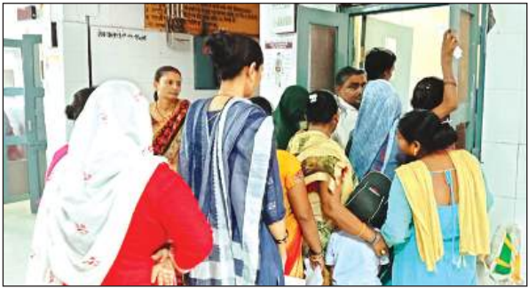
ओपीडी के बाहर लगी मरीजों की भीड़।

मशक्कत यहीं तक सीमित नहीं है। डॉक्टर के पास पहुंचने के बाद यदि कोई जांच लिख दी तो उसके लिए भी लाइन से जूझना पड़ता है। बरौं लाइन के दबाव पाना भी संभव नहीं है। जिला अस्पताल में मौसमी बीमारी के चक्कर में मरीजों का खासा दबाव है। बुधवार को ही अस्पताल में एक हजार से अधिक बच्चे बने। अस्पताल का सिस्टम जिस तरह से पहले था वही सिस्टम