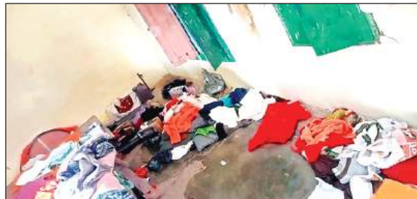
चोरी के बाद बिखरा पड़ा सामान।

कदौरा थाना क्षेत्र का मामला, पुजारियों को बंधक बनाकर घटना को दिया अंजाम