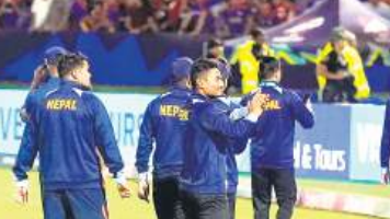
मैच रद्द होने के बाद दर्शकों का अश्रुवादान करती नेपाल की टीम।

श्रीलंका और नेपाल के बीच होने वाला टी-20 विश्वकप का 23वां मैच बारिश के कारण रद्द कर दिया गया। बारिश के कारण मैच का टॉस भी नहीं हो सका। अंपायरों ने भारी बारिश को देखते हुए मैच रद्द करने का निर्णय लेते हुए दोनों टीमों के बीच एक-एक अंक बांट दिए। रद्द हुए मैच के