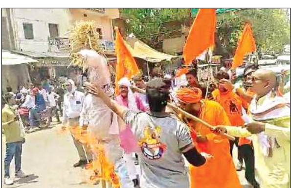
इस्लामिक आतंकवाद का पुतला फूकते बजरंग दल के कार्यकर्ता।

जम्मू कश्मीर के रियासी जिले में रविवार को जिस बस पर आतंकीयों ने हमला किया, उसमें उत्तर प्रदेश और दिल्ली के तीर्थयात्री सवार थे। बस शिव खोड़ी मंदिर से कटरा स्थित माता वैष्णो देवी मंदिर जा रही थी। इसी दौरान पौनी इलाके के तेरयाथ गांव के पास आतंकीयों ने घात लगाकर हमला किया। इसकी वजह से बस गहरी खाई में जा गिरी। आतंकी करीब 20 मिनट तक गोलियां बरसाते रहे। इस हमले में नौ लोगों की