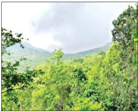
रानीपुर टाइगर रिजर्व की छटा।

गौरतलब है कि मानिकपुर से लगभग 15 किमी की दूरी पर स्थित 230 वर्ग किलोमीटर क्षेत्र में फैला यह टाइगर रिजर्व पहले रानीपुर वन्य जीव अभयारण्य (कैमूर प्रभाग) के रूप में जाना जाता था। इस केंद्र सरकार ने रानीपुर टाइगर रिजर्व का दर्जा दिया। यह प्रदेश का चौथा तथा