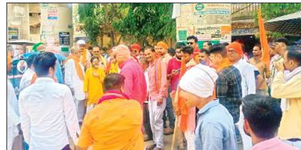
पुतला फूंकते हिंदू संगठन के कार्यकर्ता।

बुधवार को बजरंग दल और विश्व हिंदू परिषद के कार्यकर्ताओं ने प्रदर्शन कर राष्ट्रपति को संबोधित ज्ञापन जिलाधिकारी को सौंपा। ज्ञापन में कहा गया कि यह घटना संपूर्ण देशवासियों को स्तब्ध करने वाली है। इस क्रूरतम दुष्कृत्य से पूरा देश आहत है और आक्रोश में है। जम्मू कश्मीर लंबे समय से पाकिस्तान पोषित आतंकवाद का दंश झेल रहा