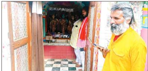
फोन से जानकारी देते मंदिर के महंत।