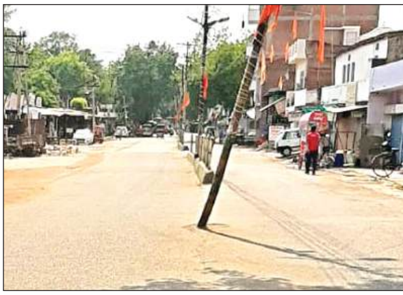
सड़क पर पसरा सन्नाटा।

मालूम हो कि एक सप्ताह तक आसमान में बादल छाए रहने और ठंडी हवाएं चलने से लोगों ने गर्मी से राहत की सांस ली, लेकिन बुधवार को सुबह से ही तेज धूप निकलने और नौ बजे से गर्म हवाओं के चलने से लोगों का बुरा हाल रहा। धूप और लू के थपड़ों से बचने के लिए लोग घरों में कैद हो गए, जिसके चलते बाजार में सन्नाटा छाया रहा। ग्रामीण