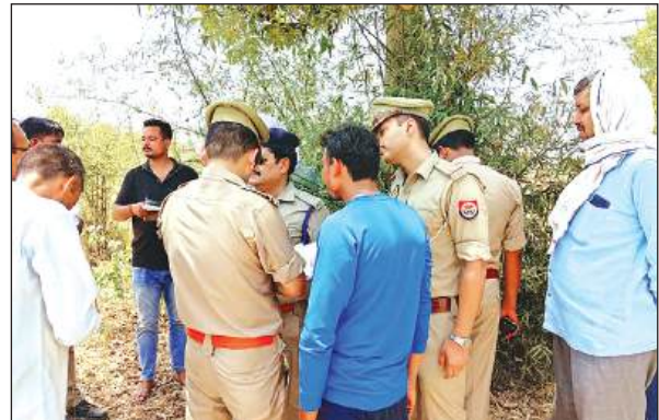
घटनास्थल पर जानकारी जुटाती पुलिस।

● पुलिस जांच-पड़ताल में जुटी पोस्टमार्टम रिपोर्ट का इंतजार