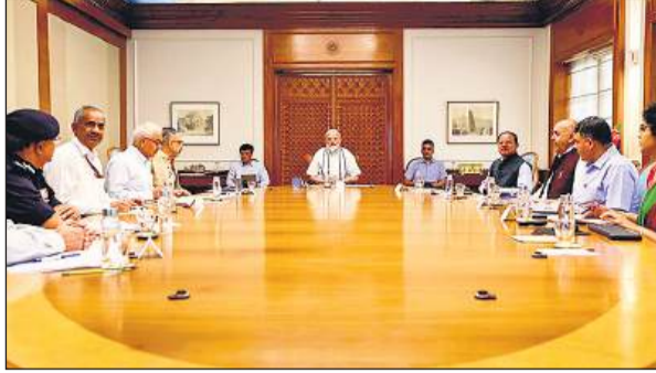
प्रधानमंत्री मोदी ने नई दिल्ली में विशेष रूप से उत्तर-पूर्व क्षेत्र में चक्रवात रमेल के बाद की स्थिति की अधिकारियों के साथ की समीक्षा।

देश में आग लगने की विभिन्न घटनाओं के बीच प्रधानमंत्री नरेन्द्र मोदी ने रविवार को भीषण गर्मी और लू के कारण पैदा हुई स्थिति की समीक्षा की और अस्पतालों व अन्य सार्वजनिक स्थानों पर सुरक्षा को दुरुस्त करने की जरूरत पर बल दिया। लोकसभा चुनाव के आखिरी चरण का मतदान संपन्न होने के अगले ही दिन प्रधानमंत्री ने कई बैठकों की अध्यक्षता की।