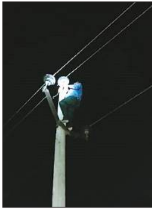
पोल पर चढ़कर फाल्ट चेक करता विद्युतकर्मी।