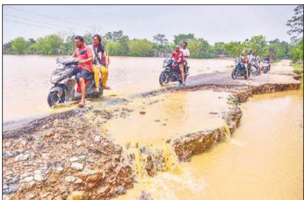
असम के नागांव जिले में चक्रवात रमेल के बाद हुई बारिश के बाद आई बाढ़ से क्षतिग्रस्त सड़क पर दोपहिया वाहन जाते लोग।

असम में बाढ़ की स्थिति में कोई सुधार नहीं हुआ है और 10 जिलों में छह लाख से अधिक लोग अब भी प्रभावित हैं। अधिकारियों ने रविवार को यह जानकारी दी।