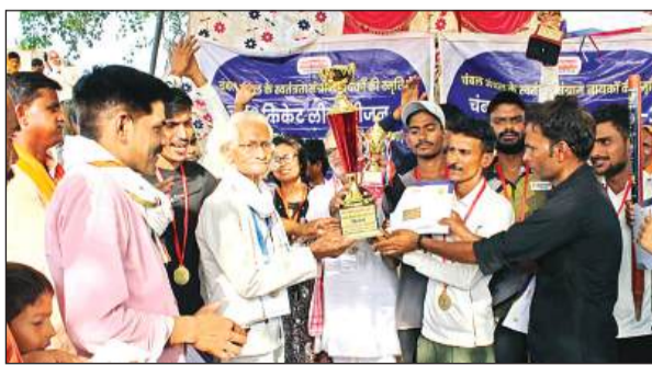
विजेता टीम को ट्राफी देते मुख्य अतिथि।