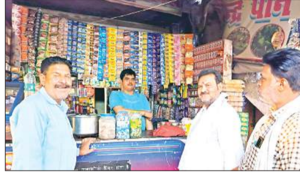
पान की दुकान पर चर्चा करते लोग।