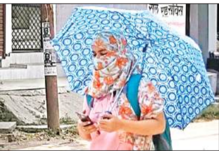
छाता लगाकर जाती युवती।

आसमान से ऐसी आग बरस रही है कि धरती भट्टी बन गई है। घर से निकलना भी मुश्किल हो गया है। जिंदगियां भी खतरों में आ गई हैं। उच्चतम स्थिति की ओर चढ़ रहे पारे में एसी, कूलर और पंखे भी काम नहीं कर रहे हैं। पीने के पानी की किल्लत है तो वहीं नदियों और पोखरों में पानी भी सूख रहा है। भीषण गर्मी ने इस बार लोगों को झुलसाकर रख दिया है। कहर डा रही गर्मी में पूरा जनजीवन अस्त-