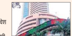
सिंगापुर से सबसे अधिक प्रत्यक्ष विदेशी निवेश (एफडीआई) मिला है। हालांकि, वैश्विक आर्थिक अनिश्चितताओं के बीच देश में विदेशी निवेश के प्रवाह में 3.5 प्रतिशत की गिरावट आई है। सरकारी आंकड़ों से यह जानकारी मिली है। हालांकि, 2023-24 में सिंगापुर से एफडीआई प्रवाह 31.55 प्रतिशत घटकर 11.77 अरब डॉलर पर आ गया है, लेकिन आंकड़ों से पता चलता है कि भारत ने उस देश (सिंगापुर) से सबसे अधिक निवेश आकर्षित किया है। पिछले वित्त वर्ष के दौरान मॉरीशस, सिंगापुर, अमेरिका, ब्रिटेन, संयुक्त अरब अमीरात (यूएई), कैमन आइलैंड, जर्मनी और साइप्रस सहित प्रमुख देशों से एफडीआई इक्विटी प्रवाह में कमी आई। हालांकि, नीदरलैंड और जापान से निवेश बढ़ा है।

रुपये और फरवरी में 1,539 करोड़ रुपये का शुद्ध निवेश किया था। वहीं जनवरी में उन्होंने शेयरों से 25,743 करोड़ रुपये की निकासी की थी। आम चुनाव के नतीजे चार जून को आने हैं। इससे निकट भविष्य