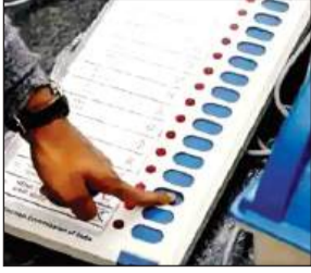
● मीडिया कर्मियों को मोबाइल सेंटर तक ले जाने की अनुमति

बताया कि चार जून को सुबह आठ बजे मतों की गणना मंडी समिति में होगी। मतगणना के समय मोबाइल फोन, माचिस, बीड़ी, तंबाकू, हथियार, कैल्कुलेटर, इलेक्ट्रॉनिक डिवाइस आदि पर रोक रहेगी। सभी वाहन केंद्र से 100 मीटर दूर पार्क किए जाएंगे। मीडिया कर्मियों को फोन सेंटर तक ले जाने की अनुमति होगी। बताया कि मतगणना केंद्र की संपूर्ण प्रक्रिया सीसीटीवी-वीडियोग्राफी की निगरानी में रहेगी। प्रत्येक केंद्र के टैबल संख्या-एक पर वीवीपैट कार्डिंग बूथ बनाया गया है, जिस