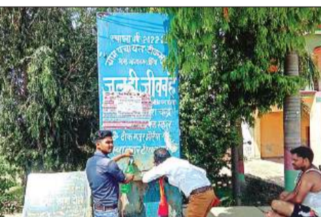
गर्मी से राहत पाने को पेड़ के नीचे बैठा व्यक्ति व प्यास बुझाते राहगीर।