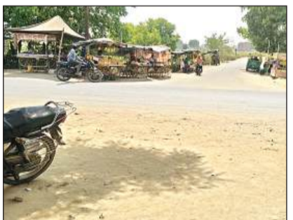
गर्मी के चलते सड़क पर पसरा सन्नाटा।

सुबह 9:00 के बाद घर से निकलना दुश्वार हो रहा है घर के अंदर पंखे कूलर सब बेकार साबित हो रहे हैं। दिन भर पसीना आने के कारण शरीर में अन्य बीमारियां हो रही हैं। लोग घर से निकलते ही छांव की तलाश में रहते हैं। बढ़ती तपिश के कारण गला भी सूख रहा है। इस समय सूर्य देव की किरणें शरीर में बाण की तरह चुभ रही हैं। वातावरण में नमी कम होने के कारण प्रचंड गर्मी का एहसास हो रहा है हवाओं को तापमान भी बढ़ा हुआ है। अब लोगों ने सुबह टहलना कम कर दिया है। सुबह 7:00 बजते ही सूर्य देव की किरणें पृथ्वी पर तेजी से