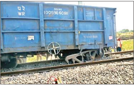
ट्रैक से उतरी मालगाड़ी।

मालगाड़ी के ट्रैक से उतरने की घटना काटोघन रेलवे स्टेशन के पास का है। डीएफसीसी के काटोघन रेलवे स्टेशन पर डाउन लाइन से जा रही मालगाड़ी का एक वैगन रविवार सुबह 05:17 बजे पटरी से उतर गया। ब्रेकवान (गाईं वाला कोच) से 34वें