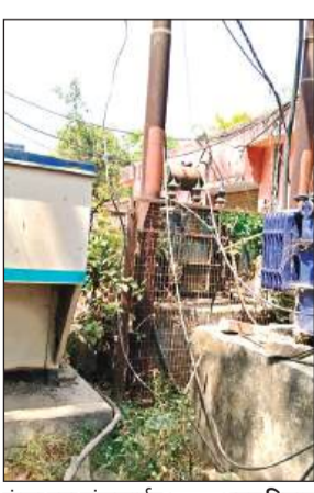
फुका पड़ा ट्रांसफार्मर।

अमृत विचार। भीषण गर्मी में मुख्यालय में फाल्टों ने नींद उड़ा रखी है। शुक्रवार रात और शनिवार की रात शहर के मुराइन टोला फीडर में बिजली का बड़ा संकट रहा। इस फीडर के लोग रात भर परेशान रहे। यहां का ट्रांसफार्मर 24 घंटे में दो बार फुंक गया। बिजली कर्मी एक फाल्ट दुरुस्त करते तब तक दूसरा ठीक जा रहा है। यह सिलसिला शुक्रवार से रविवार तक चला। यहां पानी का भी संकट रहा।