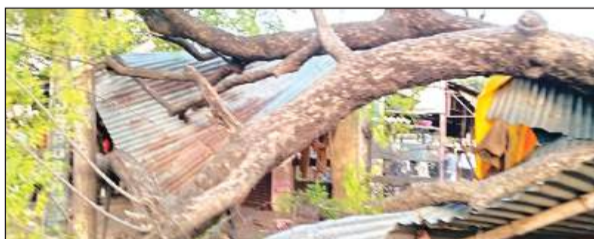
गिरा पड़ा नीम का पेड़।

अमृत विचार। रविवार को प्राइमरी स्कूल अटसू में सब्जी मंडी के बगल में एक पुराना नीम का पेड़ अचानक 11000 वोल्टेज की लाइन पर गिर गया। पेड़ गिरने अफरारफरी मच गई। लेकिन कोई बड़ा हादसा न होने से लोगों ने ईश्वर को धन्यवाद दिया कि सबकी जान बच गई।