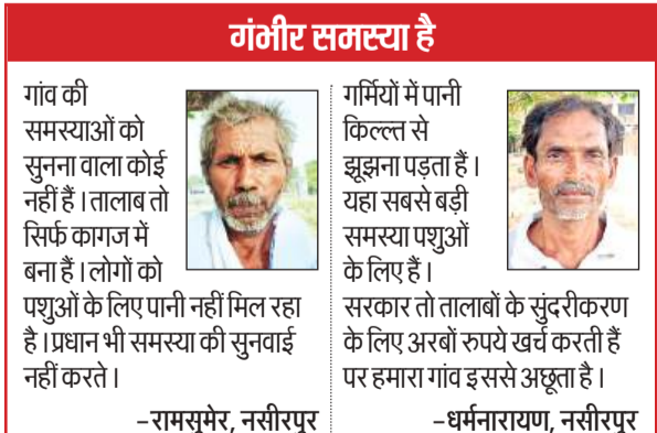
गंभीर समस्या है गांव की समस्याओं को सुनना वाला कोई नहीं है। तालाब तो सिर्फ कागज में बना है। लोगों को पशुओं के लिए पानी नहीं मिल रहा है। प्रधान भी समस्या की सुनवाई नहीं करते।

एक ही ग्राम सभा में आते हैं। इन तीनों गांवों को मिला कर एक भी