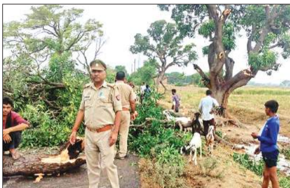
आंधी-बारिश से टूटकर सड़क पर गिरे पेड़ हटवाते पुलिस कर्मी। अमृत विचार

आंधी के साथ पिछले तीन दिनों से हो रही बूढ़ाबादी के चलते जिले की बिजली व्यवस्था बेदरती हो गई है। कई जगहों पर विद्युत तारों पर पेड़ टूटकर गिरने से आपूर्ति बाधित हो जाती है। वहीं कई जगहों पर जर्जर तारों के कारण ट्रिपिंग होती रहती है। रविवार को अकबरपुर में बिजली की आंध-मिचौली पूरा दिन चलती रही। जिससे लोगों को दिक्कत उठानी पड़ी।