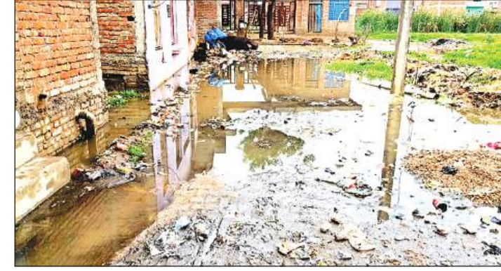
अमृत विचार राजपुर के कन्हैया नगर की गली में भरा बारिश का पानी।