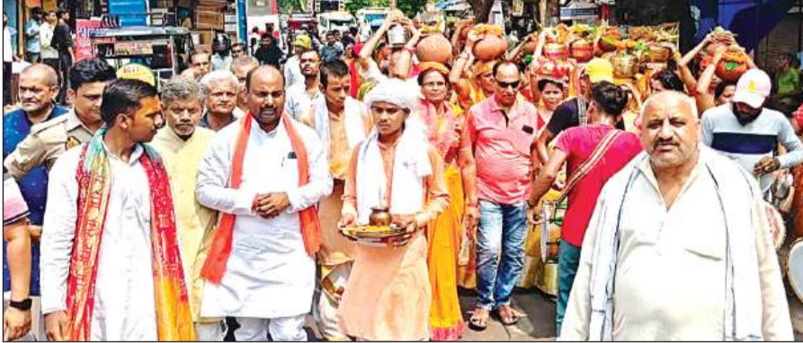
कलश यात्रा में शामिल श्रद्धालु।