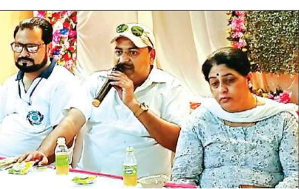
कार्यक्रम को संबोधित करते रोटी बैंक के पदाधिकारी।