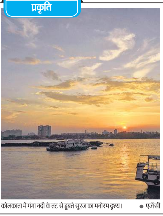
कोलकाता में गंगा नदी के तट से डूबते सूरज का मनोरम दृश्य।