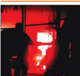
कारखाने में जलता सामान।