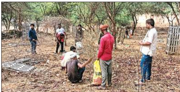
परिक्रमा पथ पर सफाई करते युवा।

को आरक्षण मिल रहा है। भीड़ से उत्साहित विधायक ने कहा कि