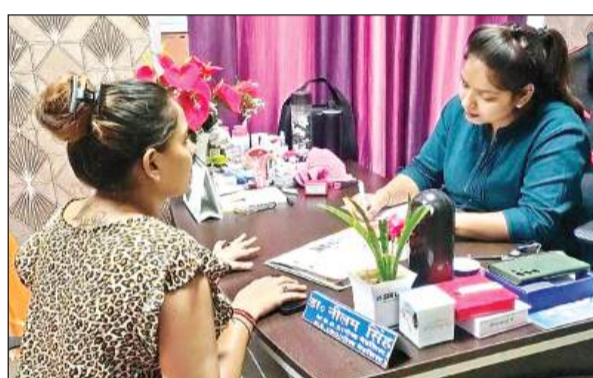
मरीज का परीक्षण करती चिकित्सक।