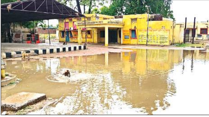
अमृत विचार बारिश से राजपुर ब्लाक परिसर में भरा पानी।