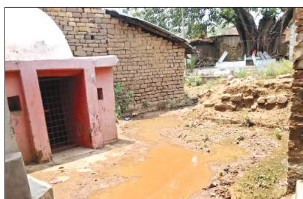
प्राचीन हनुमान मंदिर जाने वाले रास्ते पर भरा गंदा पानी। अमृत विचार

यहां के लोगों का कहना है कि इस संबंध में कई बार प्रधान का ध्यान आकृष्ट कराया गया पर उसने अनसुनी कर दी। आरोप यह भी है कि प्रधान ग्राम पंचायत के कामों में