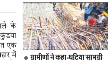
● ग्रामीणों ने कहा-घटिया सामग्री के इस्तेमाल से ढहा पुल

प्रधानमंत्री ग्राम सड़क योजना के तहत अमवां कुंडवा चांदपुर मार्ग पर बन रहा 18 मीटर लंबा पुल शनिवार रात अपने दो स्तंभों में से एक को ढलाई के तुरंत बाद ढह गया। यह घटना एक स्तंभ की ढलाई के कुछ ही घंटों बाद हुई, लेकिन किसी के हातहत होने की