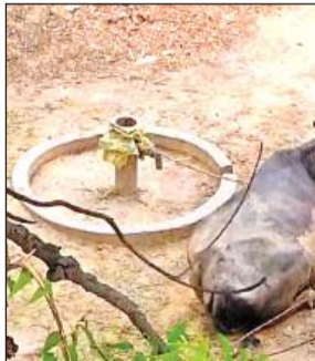
धाता ब्लाक के शाह नगर में खूटा बना हैंडपंप।

अमृत विचार। भौषण गर्मी में शहर से लेकर गांवों तक पेयजल संकट से लोग जूझ रहे हैं। ग्रामीण अंचलों में भूगर्भ जलस्तर नीचे खिसकने से हैंडपंपों ने जवाब दे दिया है। ग्राम पंचायतें मरम्मत के साथ ही हैंडपंपों का रीबोर भी अपेक्षाकृत नहीं करा पा रही हैं।