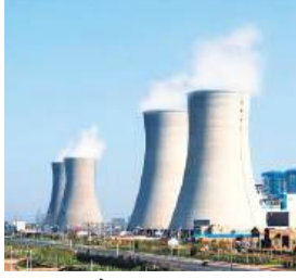
● 2027 तक 10 पावर प्लांट होंगे पूरे, बनेगी 5255 मेगावॉट बिजली

● 2030 तक और तीन बड़े बिजली घरों की क्षमता में भी होगी बढ़ोतरी