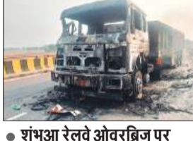
● शंभुआ रेलवे ओवरब्रिज पर रविवार तड़के हुआ हादसा

अमृत विचार : बिधनू थाना क्षेत्र के शंभुआ रेलवे ओवरब्रिज पर रविवार सुबह चार बजे ट्राला और पिकअप में आमने-सामने हुईं भिड़ंत के बाद दोनों वाहनों में आग लग गई। हादसे में पिकअप के चालक और परिचालक केबिन में फंसने से जिंदा जल गए। ट्राला का चालक फरार हो गया।