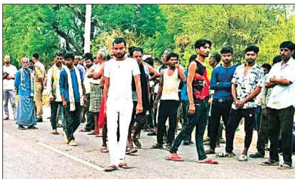
घटनास्थल पर लगी ग्रामीणों की भीड़।

अमृत विचार। गिरवां थाना क्षेत्र अंतर्गत ग्राम बड़ोखर बुजुर्ग में मोहाल की महिलाओं के साथ शौच के लिए बाहर गई महिला को तेज रफतार बेलगाम ट्रक ने कुचल दिया और चालक ट्रक लेकर मौके से भाग जाने में सफल रहा। इस बीच घटना के विरोध में ग्रामीणों ने पांच सूत्रीय मांगों के साथ सड़क पर शव रखकर जाम लगा दिया। मौके पर पहुंची पुलिस ने ग्रामीणों की मांगें पूरी करने का भरोसा देते हुए शव को पोस्टमार्टम के लिए भेज दिया है।