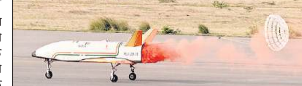
कर्नाटक के चित्रदुर्ग में टेस्ट रेंज पर लैंड करता पुष्पक।

भारतीय अंतरिक्ष अनुसंधान संगठन (इसरो) ने पुनः काम आने वाले प्रक्षेपण यान (आरएलवी) के लैंडिंग प्रयोग (एलईएक्स) को लगातार तीसरी बार सफलतापूर्वक पूरा कर नया मील का पत्थर स्थापित किया है। कर्नाटक के चित्रदुर्ग में एयरोनॉटिकल टेस्ट रेंज (एटीआर) पर एलईएक्स श्रृंखला के एलईएक्स-03 का अंतिम परीक्षण रविवार सुबह 07:10 बजे हुआ। पिछले आरएलवी एलईएक्स-01 और एलईएक्स-02 मिशनों