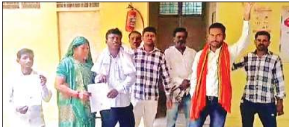
उपजिलाधिकारी को ज्ञापन देने जाते सभासद।