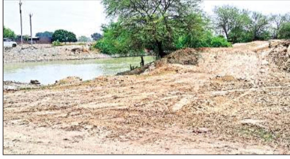
रामगंगा नहर की पटरी से किया गया खनन।

अमृत विचार। लेखपाल, साँचपाल और गश्त करती पुलिस शनिवार की रात सोती रह गई और सरकारी जमीन से माफियाओं ने शनिवार की रात खनन कर लिया। सुबह हुई जानकारी पर लोगों ने सभी की मिलीभगत का आरोप लगाया है।