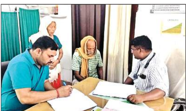
राजपुर पीएचसी में मुख्यमंत्री आरोग्य मेले में मरीजों का उपचार करते चिकित्सक।