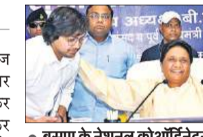
● बसपा के नेशनल कोऑर्डिनेटर का पद भी सौंपा