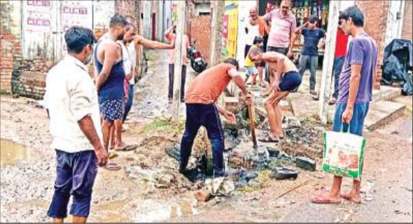
बारिश के बाद शिवपुरी कृषारवल में नाले की सफाई करते ग्रामीण। अमृत विचार

पिछले सप्ताह से मौसम में बदलाव का क्रम जारी है। आसमान में बादलों और सूरज के बीच लुकाछिपी का खेल चल रहा है। शनिवार को बारिश हुई थी। रविवार को बदली छाई रही। कभी धूप निकल आती तो कभी बादल में सूरज छिप जाता। दोपहर 12 बजे सूर्यदेव की तपिश इतनी तेज थी कि बाहर निकलना मुश्किल हो रहा था। करीब एक बजे के आसपास आसमान में बादल छा गए और फिर अकबरपुर समेत कई जगहों पर बूढ़ाबादी के बाद हल्की बारिश हुई जबकि सुबह से ही राजपुर क्षेत्र में आसमान में बादल छाए रहे। साथ ही बूढ़ाबादी होती रही, लेकिन दोपहर के बाद करीब एक बजे अचानक तेज बारिश हुई। लगभग दो घंटे तक हुई जोरदार बारिश से राजपुर पीएचसी, ब्लॉक कार्यालय समेत कई जगहों पर जलभराव हो गया। इसके अलावा मुखर्जी नगर, अशोक नगर व कन्हैया नगर की गलियों में पानी भर गया। इसके चलते लोगों को आवगमन में परेशानी उठानी पड़ी। नगर पंचायत के पटेल नगर में नालियों की सफाई नहीं होने से बारिश में नालियों का गंदा पानी सड़क पर भर गया।