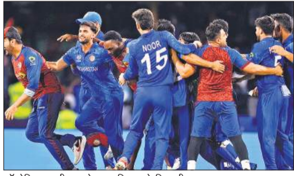
ऑस्ट्रेलिया पर जीत मनाते अफगानिस्तान के खिलाड़ी।