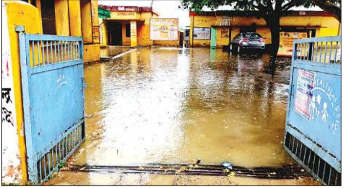
जोरदार बारिश से राजपुर पीएचसी में जलभराव।