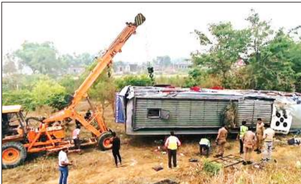
दुर्घटना के बाद बस को उठाती क्रैन।