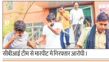
सीबीआई टीम से मारपीट में गिरफ्तार आरोपी।