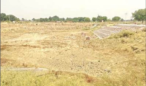
हिसावां गांव में सूखा पड़ा अमृत सरोवर।