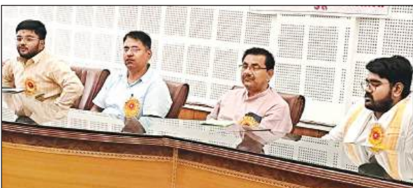
बैठक करते विद्यार्थी परिषद कार्यकर्ता।

हमीरपुर। प्रदेश स्तरीय फुटबॉल जूनियर बालक वर्ग की प्रतियोगिता मऊ में 19 से 26 जून तक तथा जूनियर बालिका वर्ग की फुटबॉल प्रतियोगिता सहारनपुर में 19 से 26 जून तक आयोजित की जा रही है। इन प्रतियोगिताओं में भाग लेने के लिए जिला स्तरीय व मंडल स्तरीय चयन ट्रायल का आयोजन किया जा रहा है। चयन ट्रायल में वही बालक/बालिका भाग ले सकते हैं, जिनका जन्म तिथि एक जनवरी 2009 से 31 दिसंबर 2010 के मध्य हो। जिला स्तरीय चयन ट्रायल में भाग ले सके। मंडल स्तरीय फुटबॉल ट्रायल जूनियर बालिका वर्ग व बालक वर्ग की ट्रायल 13 जून को राजकीय स्पोर्ट्स स्टेडियम चित्रकूट में आयोजित होगी। जबकि जिला स्तरीय ट्रायल 11 जून को राजकीय स्पोर्ट्स स्टेडियम हमीरपुर में आयोजित होगा।