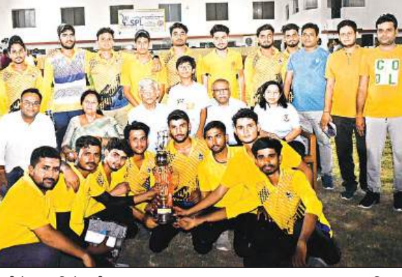
ट्राफी के साथ विजेता टीम।