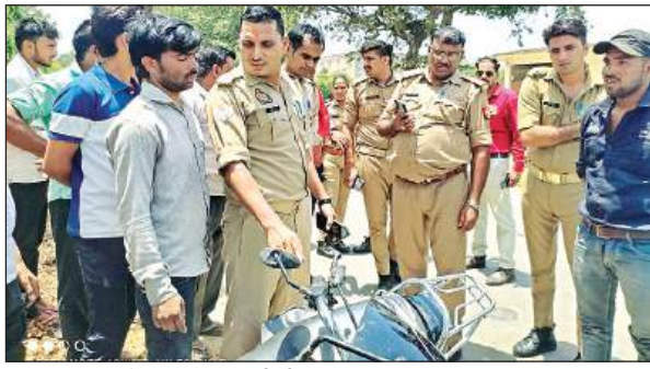
घटनास्थल पर मौजूद पुलिस व लगी भीड़।