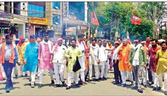
जश्न मनाते भाजपाइयों।

● मुख्यालय स्थित महाराणा प्रताप चौक पर पटाखे फोड़े