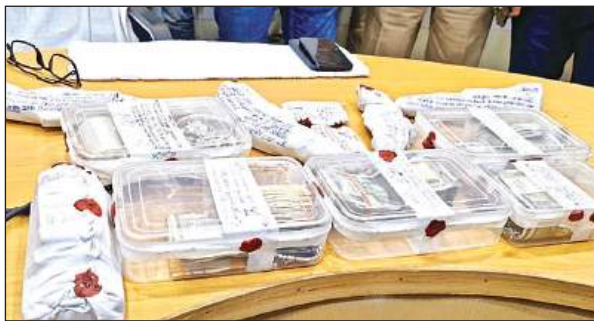
आरोपियों से बरामद किए गए रुपये और जेवर।