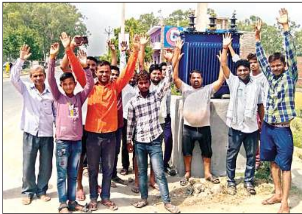
ट्रांसफार्मर के पास प्रदर्शन करते उपभोक्ता।

क्षेत्र के खड़िनी कस्बा में 400 एमवीए का ट्रांसफार्मर लगा है जिससे उपभोक्ताओं को लाइट दी जा रही है। गर्मी में कम वोल्टेज की समस्या रहती है जिससे परेशानी का सामना करना पड़ता है। विभाग ने 100 एमवीए का अतिरिक्त ट्रांसफार्मर कस्बा भेज दिया है जो सरैया मोड़ के पास रखा है। करीब 10 दिन बाद भी विभाग द्वारा ट्रांसफार्मर को चालू नहीं किया गया। इससे लोग लो वोल्टेज की