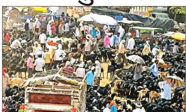
बकरों से खचाखच भरा पशु बाजार।

अमृत विचार। इंद-उल-अजहा (बकरीद) का त्योंहार करीब होने के कारण शहर में शुक्रवार को लगने वाले पशु बाजार में बकरे बेचने वालों के साथ खरीदने वालों का सैलाब उमड़ पड़ा। बकरों की खरीद का सिलसिला सुबह से शाम तक चलता रहा। लोगों ने भीषण गर्मी और धूप की परवाह किए बगैर बकरों को जांचा परखा और इंद उल अजहा में होने वाली कुर्बानी के लिए बकरों की खरीदारी भी की। त्योंहार को देखते हुए बकरों की कीमतों में इजाफा कर दिया। ज्यादातर लोगों को मनपसंद बकरा न मिलने से त्योंहार से पहले आने वाले आखिरी शुक्रवार को एक बार फिर पशु बाजार आकर बकरों की भीड़ भाड़ से गुलजार रहेगा।