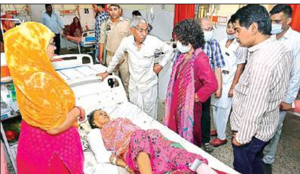
जिला अस्पताल का निरीक्षण करती डीएम दुर्गाशक्ति नागपाल।

● बेहतर स्वास्थ्य सुविधाएं उपलब्ध कराने के निर्देश