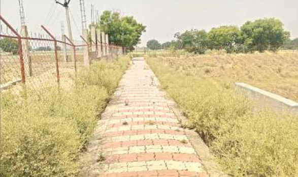
अमृत सरोवर के आसपास इंटरलाकिंग किनारे उगी घासफूस।

पर अमृत सरोवर बनाने का काम शुरू किया गया था। अलग-अलग अंतराल में जिले भर के हिस्सों में तालाबों को अमृत सरोवर के लिए चिह्नित किया गया। अफसरों के मुताबिक इनमें से कई तालाबों का काम पूरा हो चुका है। शेष तालाबों में काम होना है। यह तालाब मनरेंगा के तहत बनवाए गए हैं। इसमें ग्राम पंचायत व क्षेत्र पंचायत का योगदान है।