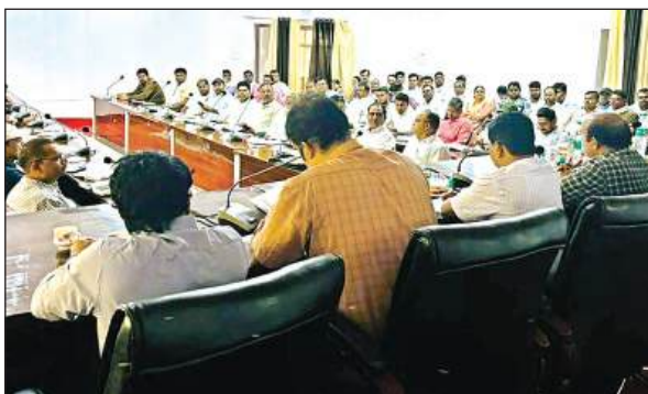
प्रशिक्षण कार्यक्रम में मौजूद अधिकारी व सचिव।

विकास भवन सभागार में शुक्रवार को आयोजित प्रशिक्षण में सभी सचिवों को पोर्टल पर परिवार रजिस्टर ऑनलाइन विवरण फीड करने तथा संशोधन का प्रशिक्षण दिया गया। राज्य स्तर से आए प्रशिक्षकों द्वारा समस्त सचिवों को प्रशिक्षण देते हुए उनकी शंकाओं का समाधान किया। पीपीटी के माध्यम से ऑनलाइन फीडिंग संशोधन और रिपोर्ट संबंध में व्यापक जानकारी दी। मौसम में बढ़ती हुई गर्मी को देखते हुए ग्रामीण क्षेत्र में पेयजल