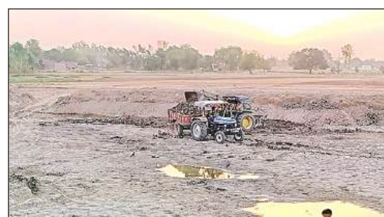
तालाब में होता अवैध खनन।