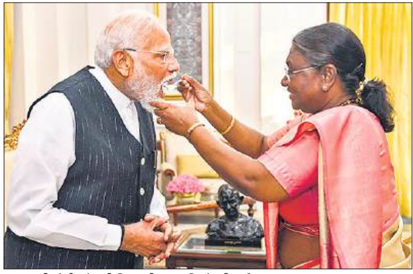
प्रधानमंत्री मोदी को दही खिलाती राष्ट्रपति द्रौपदी मुर्मू।

राष्ट्रपति द्रौपदी मुर्मू ने शुकवार को राष्ट्रीय जनतांत्रिक गठबंधन (राजग) संसदीय दल के नेता नरेंद्र मोदी को प्रधानमंत्री पद के लिए मनोनीत करते हुए उन्हें नई सरकार के गठन के लिए आमंत्रित किया। नई सरकार का शपथग्रहण समारोह रविवार की शाम को होगा। मोदी ने शुकवार शाम राष्ट्रपति भवन में मुर्मू से मुलाकात की। राष्ट्रपति मुर्मू ने मोदी को मनोनयन पत्र सौंपा। इससे पहले, भाजपा नेतृत्व वाली राष्ट्रीय जनतांत्रिक गठबंधन (राजग) के नेताओं ने राष्ट्रपति द्रौपदी मुर्मू से मुलाकात की और मोदी के लिए समर्थन पत्र सौंपा। मोदी को राजग संसदीय दल का नेता चुना गया है। राष्ट्रपति भवन के प्रांगण में मीडिया को संबोधित करते हुए मोदी ने कहा कि राष्ट्रपति ने उन्हें प्रधानमंत्री पद के लिए मनोनीत किया है। मोदी ने कहा कि राष्ट्रपति ने मुझे मनोनीत प्रधानमंत्री के रूप में काम करने के लिए कहा है और उन्होंने मुझे शपथ समारोह के लिए आमंत्रित किया है।