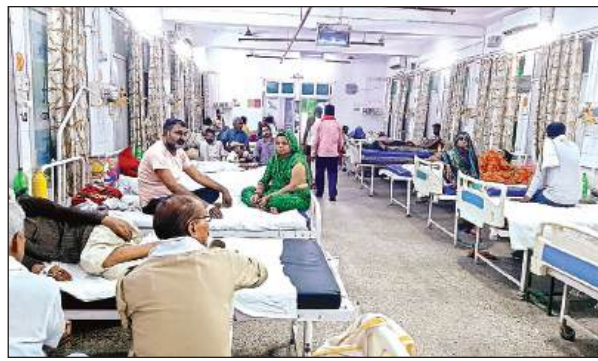
अस्पताल में भर्ती मरीज।