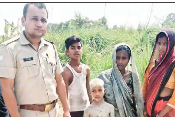
नहर में डूबे बालक को बचाकर परिजनों के सुपुर्द करता पुलिस कर्मी।