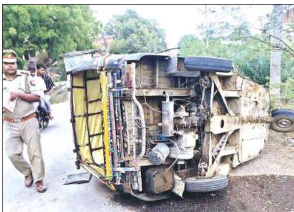
सरीला खेड़ा शिलाजीत मार्ग पर पलटा पड़ा ऑटो।

बताया कि थाना क्षेत्र के गांव इटाहा कालपी पर एक सड़क दुर्घटना में