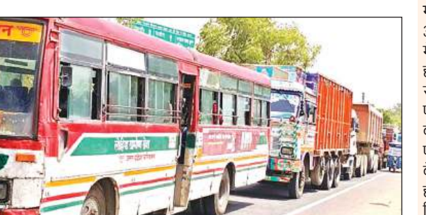
दुर्घटना के बाद राष्ट्रीय राजमार्ग पर लगा जाम। अमृत विचार

अमृत विचार। राष्ट्रीय राजमार्ग में बेतवा पुल पर दो ट्रकों की भिड़ंत में एक ट्रक का चालक गंभीर रूप से घायल हो गया। जबकि इस हादसे में एक ओमनी वैन भी क्षतिग्रस्त ट्रक के पीछे बुरी तरह भिड़ने से क्षतिग्रस्त हो गई। इस दुर्घटना से हाईवे पर जाम लग गया। सूचना पर पहुंची पुलिस ने हादसे में घायल ट्रक चालक को जिला अस्पताल पहुंचाया। दोनों ट्रकों को सड़क से हटवाकर यातायात सुचारू किया गया। शुक्रवार की सुबह करीब साढ़े चार बजे सदर थाना क्षेत्र के बेतवा पुल पर दो ट्रक आपस में भीड़ गए हादसे के बाद एक ओमनी वैन क्षतिग्रस्त ट्रक में पीछे से टकरा