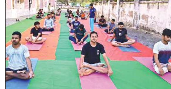
योगाभ्यास करते शिक्षक व छात्र।