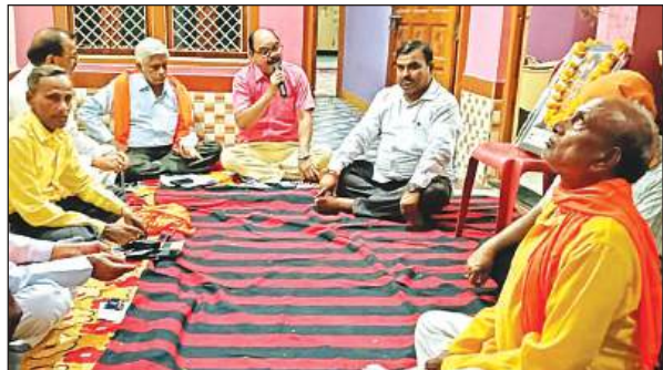
गोष्ठी में मौजूद साहित्यकार व कवि।