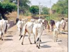
क्योटोरा बांगर गांव में घूमता छुट्टा गोवंशों का झुंड।

● अमरौधा ब्लाक के क्योटोरा बांगर गांव में किसान दिन-रात करते फसलों की रखवाली