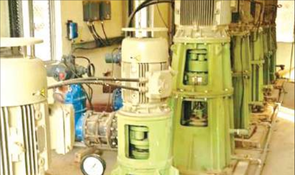
नमामि गंगे योजना के तहत लगाई गई मशीनें। अमृत विचार

सुमेरपुर एवं मौदहा ब्लॉक के गांवों को स्वच्छ जल मुहैया कराने के लिए पत्थोरा गांव के समीप यमुना नदी में इंटकवेल बनाया गया है। इसका कार्य लगभग पूर्ण हो गया है। ब्लॉक की 41 पंचायतों को पानी देने के लिए इंटेकवेल से पाइपलाइन लाकर पचखुरा बुजुर्ग में वितरण