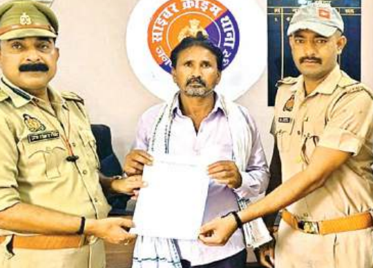
पीड़ितों को धनराशि वापस संबंधी प्रारंभ देते पुलिस अधिकारी। अमृत विचार