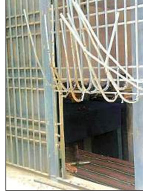
छिबरामऊ के स्कूल में ऐसे की चोरी।

ने बताया कि मंडी चौकी क्षेत्र के गोपाल नगर स्थित शिवनारायण सिंह इंटर कॉलेज के वह प्रधानाचार्य हैं। इस समय छुट्टियां होने के कारण विद्यालय बंद चल रहा है। इसके बावजूद वह रोज विद्यालय चेक करने जाते हैं। गुरुवार को किसी कारण विद्यालय नहीं पहुंच सके और शुक्रवार की सुबह जब गए तो जंगल की सरिया काटकर मोड़ी गई पाई। अंदर के ताले टूटे तथा सामान बिखरा पड़ा था। बताया कि रात में किन्हीं चोरों ने इनवर्टर, बैटरी, 3 एलईडी व प्रिंटर के अलावा सेफ