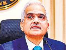
● मौद्रिक नीति समिति के दो सदस्य रेपो दर में 0.25% कटौती के पक्ष में

मौद्रिक नीति समीक्षा : आरबीआई ने जीडीपी वृद्धि दर अनुमान को बढ़ाकर 7.2 प्रतिशत किया