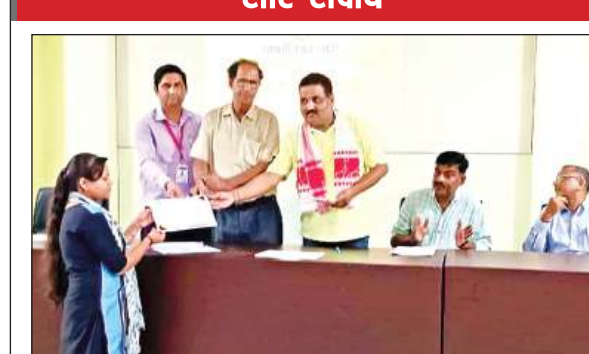
होनहार छात्र को पुरस्कृत करते शिक्षक।