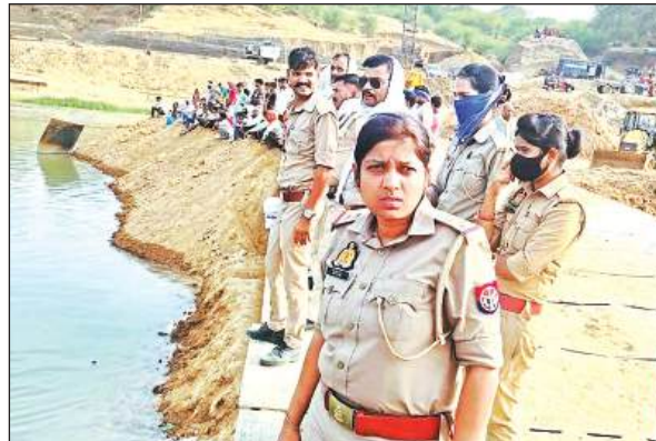
नदी में डूबे युवक की तलाश में जुटी पुलिस।

उरई कंट्रोल रूम में बात करने के बाद ही नवीन सब्जी मंडी की सप्लाई बंद हो सकी। सप्लाई बंद होने के बाद आग पर काबू पाया गया। उन्होंने कहा कि एक कर्मचारी की इ्यूटी फोन के जरिए समस्या के समाधान के लिए लगाई जाए।