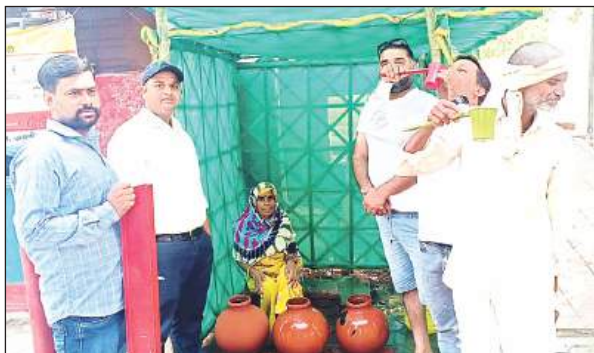
सामुदायिक स्वास्थ्य केंद्र कालपी में शुरू की गई पौशाला।

चिकित्सालय के परिसर में उपस्थित कर्मचारियों तथा नागरिकों के साथ विचार व्यक्त करते हुए चिकित्सा अधीक्षक ने बताया कि गर्मी के मौसम में अधिक से अधिक शुद्ध पानी को पीते रहना चाहिये। इससे उल्टी, दस्त एवं डायरिया आदि की बीमारी से बचाव हो जाता है। उन्होंने बताया कि बढ़ते तापमान