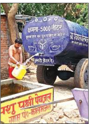
टैंकर से हो रही जलापूर्ति।

भीषण गर्मी में सबसे ज्यादा शुद्ध पानी की आवश्यकता होती है और गांव-मजरा में वह भी उपलब्ध नहीं। जिम्मेदार पेयजल उपलब्धता का दावा तो करते हैं पर नमाम गांव-मजरा में यह दावा खोखला ही नजर आता है। बरगढ़ क्षेत्र के कई गांव-मजरे ऐसे हैं, जहां शुद्ध पानी दूर की कौड़ी है। यहां के लोग शुद्ध पानी