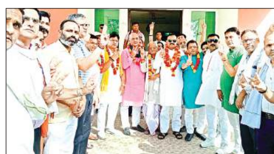
तीसरी बार सरकार बनने पर माती पार्टी कार्यालय में जश्न मनाते भाजपाई।