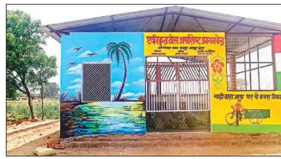
रमऊ गांव में बना आरसीसी सेंटर।