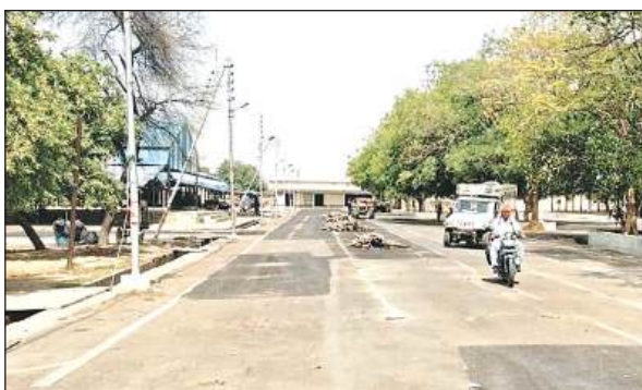
सुमेरपुर मंडी में पसरा सन्नाटा।

लोकसभा चुनाव को संपन्न कराने के लिए प्रशासन ने इस बार गल्ला मंडी को पूरी तरह से अधिग्रहित करके आदृतियों को बाहर का रास्ता दिखा दिया था। करीब दो माह तक गल्ला मंडी से