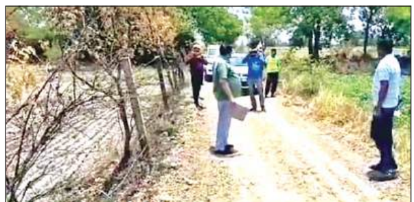
जांच करते माधोगढ़ खंड विकास अधिकारी व अन्य।