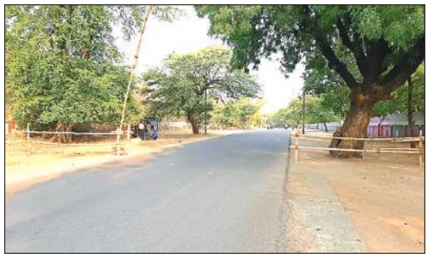
भीषण गर्मी के चलते रेलवे स्टेशन रोड पर पसरा सन्नाटा।