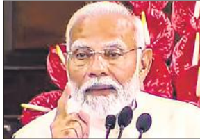
● आतंकी घटनाओं के बावत गृहमंत्री शाह, एनएसए डोभाल से की वार्ता

प्रधानमंत्री नरेंद्र मोदी ने तीर्थयात्रियों को लेकर जा रही एक बस पर हमले सहित जम्मू एवं कश्मीर में हाल के दिनों में हुई कई आतंकवादी घटनाओं के बाद गुरुवार को वहां की सुरक्षा स्थिति की समीक्षा की और अधिकारियों को 'आतंकवाद रोधी क्षमताओं का पूर्ण इस्तेमाल' करने का निर्देश दिया। सरकारी सूत्रों ने बताया कि राष्ट्रीय सुरक्षा सलाहकार अजीत डोभाल और अन्य अधिकारी मोदी की अध्यक्षता में हुई बैठक में शामिल हुए। इस दौरान केन्द्रीय गृह मंत्री अमित शाह