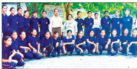
रामनगर महाविद्यालय में प्राचार्य के साथ एनसीसी कैडेट्स। • अमृत विचार