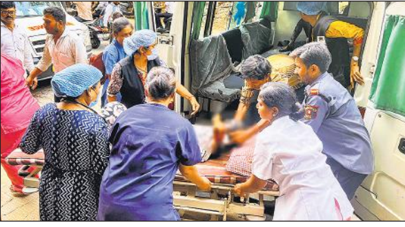
नागपुर के पास एक विस्फोटक-निर्माण फेक्ट्री में विस्फोट के बाद एक घायल को एंबुलेंस से अस्पताल ले जाते लोग।