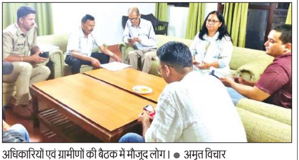
अधिकारियों एवं ग्रामीणों की बैठक में मौजूद लोग।

अमृत विचार : कांबेट टाइगर रिजर्व की सीमा से निकलकर कालागढ़ कॉलोनी में उल्हास मचाने वाले जंगली हाथियों को रोकने के लिए वन विभाग ने विशेष गश्ती दल का गठन किया है। कॉलोनीवासियों को कॉलोनी में पेड़ों पर लगे आम तल्काल तुड़वाने के निर्देश दिए हैं। कॉलोनी में जंगली हाथियों के उत्पात की शिकायत के बाद कांबेट टाइगर रिजर्व एवं उत्तराखण्ड जल विद्युत निगम के अधिकारियों के साथ हाथियों से सुरक्षा के लिए बैठक की। वन विभाग भवन कालागढ़ में हुई बैठक में सर्वसम्मति से निर्णय लिया गया कि कॉलोनी की सुरक्षा के लिए वन विभाग के कर्मचारियों की दो टीमों का गठन किया जाएगा। जिनमें प्रातःकालीन पारी में गनमैन सहित 6 एवं रात्रि पारी में गनमैन सहित 8 सदस्य होंगे। टीम निर्यात रूप से कॉलोनी क्षेत्र में गश्त कर जनमानस की हाथी से जानमाल की सुरक्षा हेतु निगरानी करेंगे। वनक्षेत्र में वाटर होल में पानी