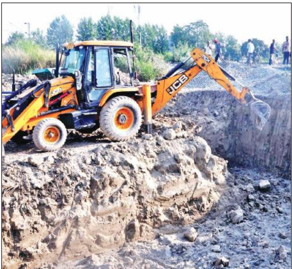
आदेश के बाद अंडरपास के लिए खुदाई करती जैसीबी।