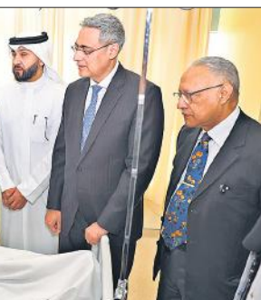
कुवैत के जाबेर अस्पताल में एक घायल का हाल लेते विदेश राज्यमंत्री कीर्ति वर्धन सिंह।