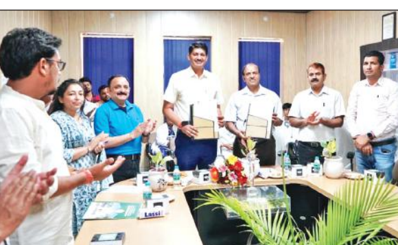
एमओयू के दौरान बायोटेक निदेशक और विवि के अधिकारी। ● अमृत विचार

अमृत विचार : बायोटेकनॉजी में गुणवत्तापूर्ण शिक्षा और शोध को बढ़ावा देने के लिए उत्तराखंड जैव प्रौद्योगिकी परिषद (बायोटेक) हल्दी और जीबी पंत कृषि विवि के बीच एक एमओयू पर हस्ताक्षर किए गए। इसके तहत बायोटेक विवि के स्नातकोत्तर और पीएचडी छात्रों को अपना शोध प्रबंध उनकी आधुनिक प्रयोगशालाओं में पूरा करने की अनुमति प्रदान करेगा और विवि यूसीबी के वैज्ञानिकों को शोध मार्गदर्शन के लिए मान्यता देगा। इससे प्रदेश में जैव प्रौद्योगिकी आधारित कृषिकरण