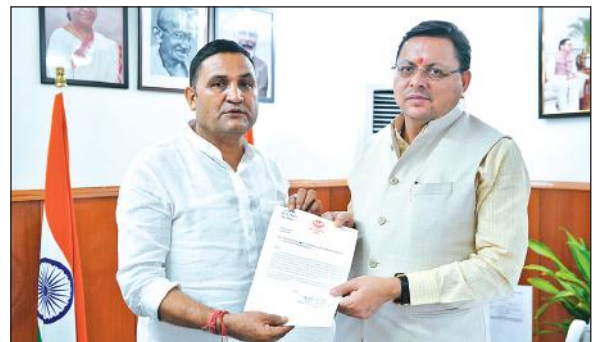
देहरादून में मुख्यमंत्री धामी को ज्ञापन देते विधायक कैड़ा।

हल्लानी : गौलापार क्षेत्र के उदयपुर गांव में सिंचाई विभाग का नलकूप खराब हो गया है। नलकूप की मोटर खराब होने से क्षेत्र में पानी की समस्या बढ़ गई है। नलकूप खराब होने के कारण ग्रामीणों को खेतों की सिंचाई के लिए भी परेशानी उठानी पड़ रही है। सिंचाई विभाग के अधिकारियों के अनुसार नलकूप की मरम्मत का कार्य चल रहा है। 14 से 5 दिनों में नलकूप ठीक हो जायेगा।