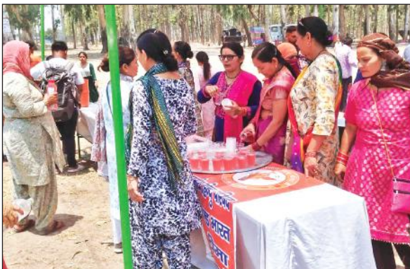
खटीमा के चकरपुर में मां पूर्णागिरि के श्रद्धालुओं को जलपान कराते संगठन के लोग।

बताया कि गर्मी से लोग घरों से नहीं निकल पा रहे हैं। जरूरी काम होने पर ही निकलते हैं। जिसका प्रभाव वाहन चालकों को पड़ रहा है। इधर गर्मी से सब्जी व गन्ना की फसल प्रभावित हो रही है।