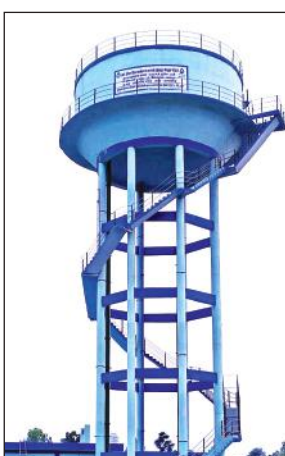
ग्राम महेशपुरा में पेयजल की उपलब्धता के लिए निर्मित वाटर टैंक।

अमृत विचार: लोगों को शुद्ध और स्वच्छ पेयजल मुहैया कराने के लिए सरकार ने जल जीवन मिशन योजना के तहत गांव-गांव में करोड़ों की लागत से पानी की टंकी (वाटर टैंक) का निर्माण कराया है, लेकिन केंद्र सरकार की महत्वाकांक्षी हर घर नल से जल देने की योजना बाजपुर के ग्राम महेशपुरा में दम तोड़ती नजर आ रही है। करोड़ों रुपये खर्च करने के बाद भी गांव में जल संकट की स्थिति बनी हुई है। गांव-गांव जल जीवन मिशन योजना के तहत पानी की टंकी बनाकर पाइपलाइन के माध्यम से पानी पहुंचाने की योजना का लाभ महेशपुरा के लोगों को समुचित तरीके से नहीं मिल रहा है। ग्रामीणों ने बताया कि बाई साल से टंकी का कार्य चल रहा