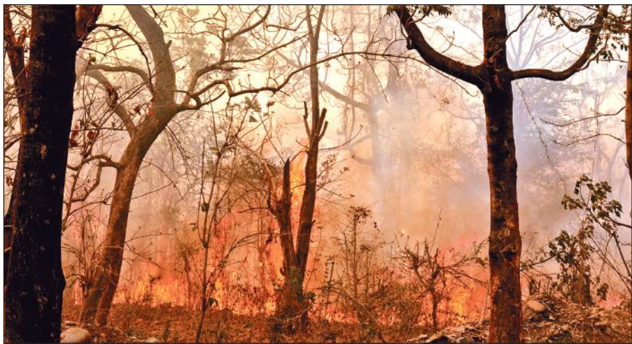
आग से धक्का भाखड़ा रेंज का जंगल। ● अमृत विचार