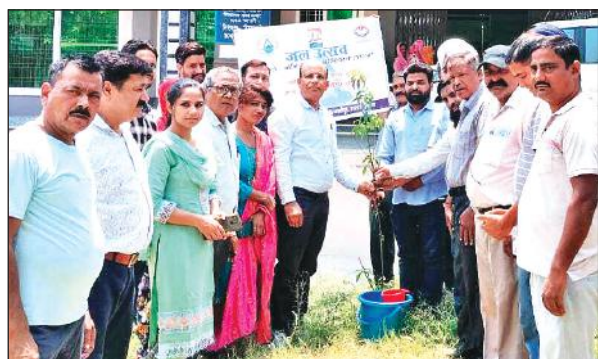
जल महोत्सव के अवसर पर पौधारोपण करते विकास खंड के पदाधिकारी।

नहीं किया गया है। पदाधिकारियों ने कहा कि पारदर्शिता एवं निष्पक्षता के साथ चुनाव संपन्न कराना उनकी प्राथमिकता रहेगी तथा 30 जून के बाद आपत्तियों का निस्तारण करते हुए मतदाता सूची जारी की जाएगी। बताया कि मीट मछली विक्रेता, शराब विक्रेता, स्कूल संचालक, एडवोकेट, प्रॉपर्टी डीलर, चिकित्सक, महिला एवं पुरुष हेयर सैलून से संबंधित व्यापारी व्यापार मंडल की सूची में शामिल नहीं होंगे।