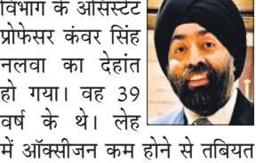
मुख्यमंत्री धामी ने कहा कि