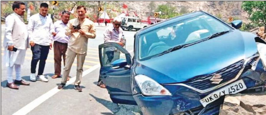
टनकपुर पिथौरागढ़ हाईवे पर ब्रेक फेल होने से पहाड़ से टकराई कार।