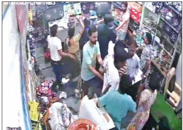
दुकान में घुसकर हमले की वायरल वीडियो। • अमृत विचार

अमृत विचार: कार पार्क करने को लेकर बुधवार की देर रात्रि दुकानदार पर कार मालिक ने साथियों को बुलाकर जानलेवा हमला कर दिया। बीच-बचाव को आया दूसरे दुकानदार को भी मारपीट कर घायल कर दिया गया। घटना का वीडियो वायरल होने के बाद पुलिस ने मामले की जांच शुरू कर दी है। सिब्ल सिनेमा गोल मार्केट स्थित शाहनवाज की दुकान है।