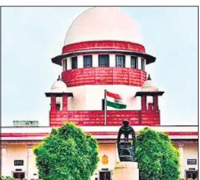
● 23 जून को आयोजित होगी परीक्षा 30 जून को घोषित होंगे परिणाम