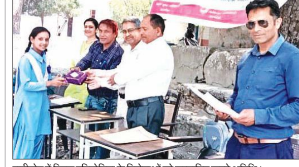
रानीखेत में विद्युत प्रतियोगिता के विजेताओं को सम्मानित करते अतिथि।

भीमताल: भीमताल नगर से मात्र चार किलोमीटर की दूरी पर स्थित कमल ताल का भी जलस्तर घटने लगा है, जिसके चलते कमल ताल में खिलने वाले कमल मुड़झाने लगे हैं। स्थानीय स्तर पर अब कमल ताल का जल स्तर बढ़ाने और उसके जल स्तर को स्थिर रखने की मांग जोर पकड़ने लगी है। पर्यटन कारोबार से जुड़े लोगों का कहना है कि विभाग की अनदेखी के कारण झील का जल स्तर कम हो रहा है, जिस कारण पिछले पांच सालों के बाद कमल झील में बड़े प्रयासों के बाद खिल पाए हैं।