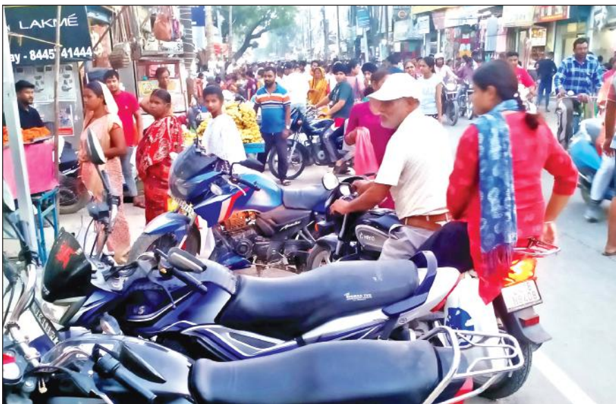
दिनेशपुर में दिन ढलते ही शाम को बाजार में बड़ी चहल-पहल।