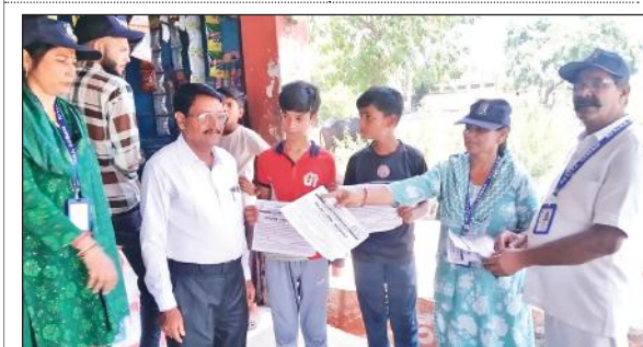
जनसंपर्क करती जिला विधिक सेवा प्राधिकरण की टीम।