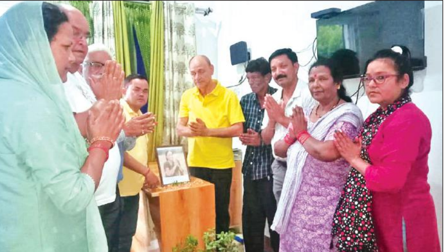
भीमताल में पूर्व कैबिनेट मंत्री को श्रद्धांजलि देते कांग्रेस कार्यकर्ता।

अमृत विचार : कांग्रेस कार्यकर्ताओं ने मिनी स्टेडियम मल्लीताल भीमताल के समीप एकत्र होकर पूर्व कैबिनेट मंत्री, पूर्व नेता प्रतिपक्ष स्वर्गीय डॉ. इंदिरा हृदयेश की पुण्यतिथि पर उन्हें भावपूर्ण श्रद्धांजलि अर्पित की। वक्ताओं ने कहा कि उन्होंने उत्तराखंड के विकास में अहम भूमिका निभाते हुए दलगत राजनीति से ऊपर उठकर हमेशा विकास कार्य को प्राथमिकता दी। इस दौरान नगर कांग्रेस अध्यक्ष