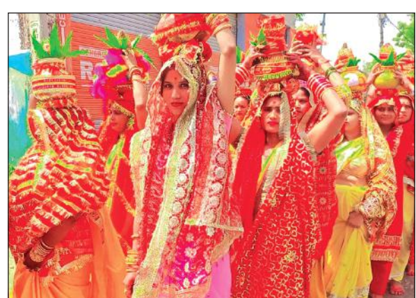
बाजपुर में मंगल कलश शोभायात्रा में शामिल महिलाएं। ● अमृत विचार

बताया गया कि श्रीमद्भागवत कथा का परायण 19 जून को हवन-यज्ञ में पूर्णाहित व प्रसाद वितरण के साथ किया जाएगा। कथा के दौरान 16 जून