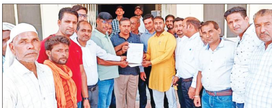
बाजपुर के एसडीएम कार्यालय में पेशकार को ज्ञान सौंपते ग्रामीण।