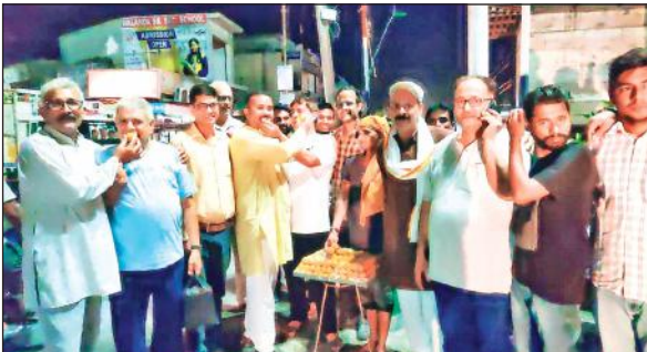
किच्छ में मिष्ठान वितरण करते समिति के सदस्य।