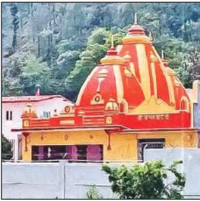
श्री कैंची धाम।

जोशीमठ की जनता लंबे समय से जोशीमठ को ज्योतिर्मठ नाम देने की मांग कर रही थी और मुख्यमंत्री के सामने भी यह मांग प्रमुखता से