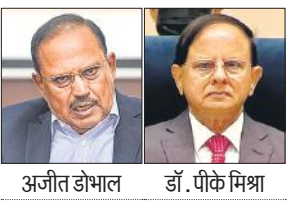
अजीत डोभाल डॉ. पीके मिश्रा

केन्द्रीय मंत्रिमंडल की नियुक्ति के मामलों की समिति ने इन दोनों अधिकारियों की नियुक्ति को गुरुवार को मंजूरी दे दी। समिति ने सेवानिवृत्त आईएसएस अधिकारियों अमित खरे और तरुण कपूर को भी प्रधानमंत्री कार्यालय में सलाहकार