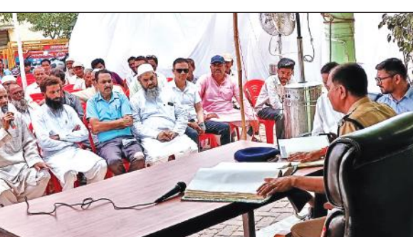
जसपुर कोतवाली में अमन कमेटी की बैठक में मौजूद अधिकारी व लोग।

नदी की गहराई का पता नहीं है और ना ही यह पता है कि नदी में किस क्षेत्र में नहाना चाहिए और कहाँ नहीं जाना चाहिए।