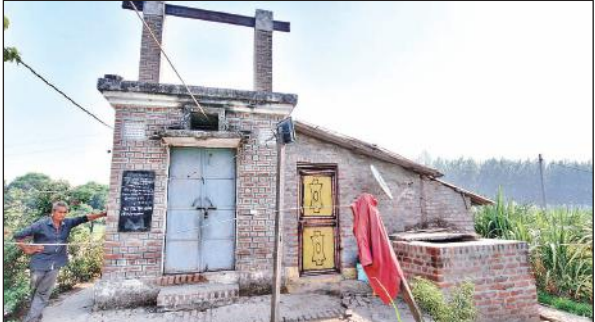
शांतिपुरी नंबर चार चंद्रपुरी में मोटर फुकने से बंद पड़ा सिंचाई नलकूप। • अमृत विचार

उन्होंने बताया कि मई-जून की भीषण गर्मी के कारण लोगों के नलों का पानी आना बंद हो गया है। गांव में जल संकट की स्थिति बनी हुई है और लोग पानी के लिए तस्स रहे हैं। नल सूखने के कारण लोग पानी के लिए परेशान हो रहे हैं और कर्मचारी रात्रि के समय टंकी का पानी फसलों में छोड़ रहे हैं। उन्होंने बताया कि कई बार ठेकेदार से शिकायत की है कि कार्य को तेजी से कराया जाए, क्योंकि इससे लोगों को काफी परेशानी हो रही है। इसलिए जल्द से जल्द पेयजल व्यवस्था ठीक करने की मांग की है।