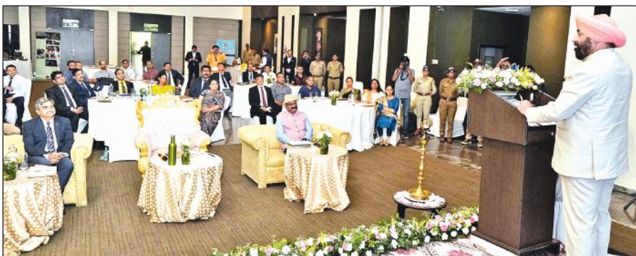
रामनगर में अधिकारियों को सम्बोधित करते राज्यपाल लेफ्टिनेंट जनरल (सेनि) गुरमीत सिंह।

उन्होंने कहा कि उत्तराखण्ड की महिलाएं वनाग्नि से जुड़ी चुनौतियों के समाधान में अहम भूमिका निभा सकती हैं। चिपको आंदोलन का जिक्र कर राज्यपाल ने कहा कि जिस प्रकार महिलाओं ने चिपको आंदोलन चलाकर पर्यावरण संरक्षण में महत्वपूर्ण भूमिका निभाई, इसी प्रकार वन्यजीव से जुड़ी चुनौतियों के समाधान हेतु वे क्रांति ला सकती हैं। राज्यपाल ने बदलते सामाजिक परिपेक्ष्य में मानव वन्यजीव संघर्ष निवारण, वनाग्नि प्रबंधन एवं इको