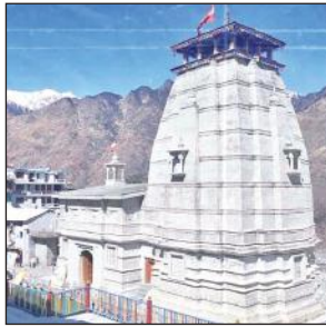
श्री ज्योतिर्मठ धाम।

अमृत विचार: उत्तराखंड के चमोली जिले की जोशीमठ तहसील को अब उसके प्राचीन नाम ज्योतिर्मठ के रूप में जाना जाएगा। जबकि नैनीताल जिले की कोश्याकुटोली तहसील का नया नाम अब श्री कैंचीधाम हो गया है। अधिकारियों ने बुधवार को यहां बताया कि मुख्यमंत्री पुष्कर सिंह धामी द्वारा की गई घोषणाओं के अनुरूप इस संबंध में प्रस्ताव बनाकर केंद्र सरकार को भेजे गए थे, जिन्हें अब मंजूरी मिल गयी है।