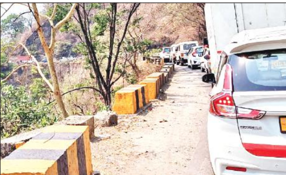
काठगोदाम से चित्रशिला घाट तक लगा लंबा जाम।

कांस्टेबल, 100 महिला कांस्टेबल और 26 यातायात पुलिस के लोग होंगे। वहीं कुमाऊं के बाहर से 2 एडिशनल एसपी, 2 सीओ और 2 कंपनी व एक प्लाटून पीएसो को मुस्तैद किया गया है। बताया कि शुक्रवार से भारी वाहनों के संचालन पर रोक लगा दी जायेगी। सिर्फ आवश्यक सेवाओं के वाहनों को आने-जाने की अनुमति होगी।