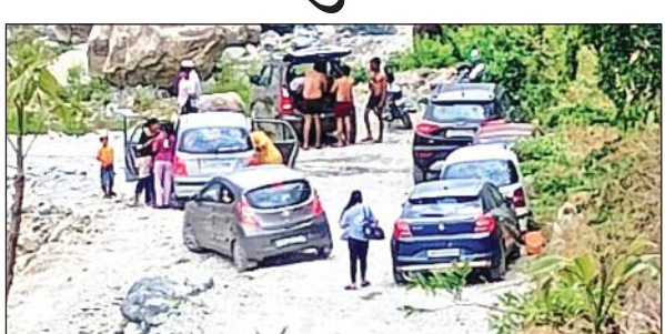
गौला नदी में नहाने पहुंचे लोग।