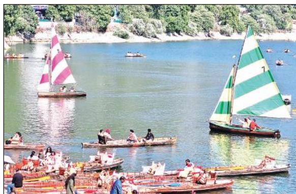
नैनी झील में नौकायन करते सैलानी।

अमृत विचार : पर्यटन सीजन अपनी चरम सीमा पर पहुंच चुका है। अब लगभग दो सप्ताह का ही सीजन बचा है, क्योंकि 25 जून के बाद मानसून सीजन शुरू हो जाता है जिसके बाद पर्यटन सीजन अपने अंतिम चरण में पहुंच जाता है, जिसके चलते 22 जून तक नैनीताल, पंगुट, मुक्तेश्वर, भीमताल, सातताल में लगभग सभी होटल, गेस्ट हाउस व होम स्टे पैक हो चुके हैं। गुरुवार को भी नैनीताल में सैलानियों की बड़ी आमद से