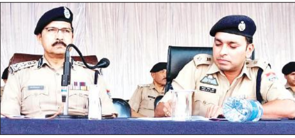
नैनीताल पुलिस लाइन में बैठक के दौरान डीआईजी व एसएसपी।