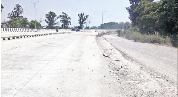
पंतनगर मोड़ के पास बने अंडरपास ब्रिज से गुजरते वाहन।

अमृत विचार: आखिरकार पंतनगर मोड़ के पास अंडरपास ब्रिज का काम लगभग पूरा हो गया है। वहीं पंतनगर को जाने वाले मार्ग पर पड़ने वाली सर्विस लेनों का निर्माण कार्य शुरू होने से फिलहाल अंडरपास ब्रिज से वाहनों की आवाजाही शुरू कर दी गई है। एनएचआई अधिकारियों के अनुसार रुद्रपुर से हल्द्वानी तक का फोरलेन का निर्माण लगभग पूर्ण हो चुका है। हल्द्वानी में आरओबी का निर्माण अक्टूबर तक बनने की उम्मीद है। गुजरात की कंस्ट्रक्शन कंपनी