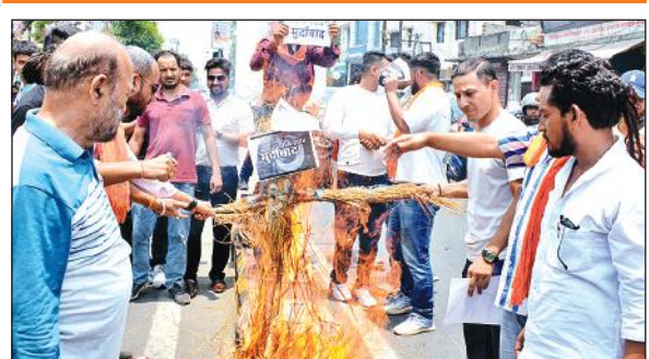
एसडीएम कोर्ट के बाहर आतंकवाद का पुतला फूंकते गोरक्षक।