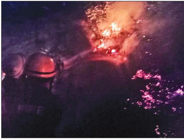
पीडब्लूडी गेस्ट हाउस के स्टोर रूम में धधकी आग पर काबू पाते फायर कर्मी।