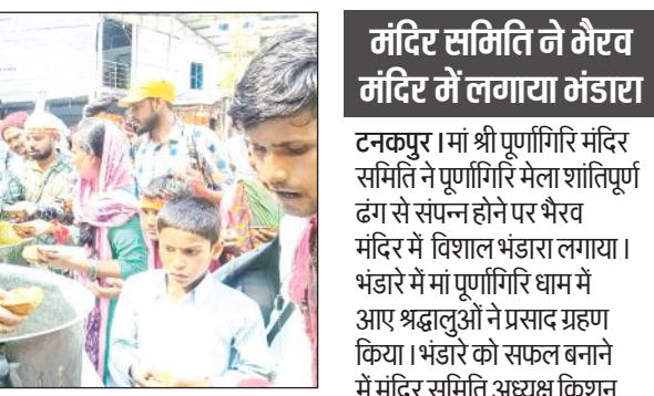
भैरव मंदिर में लगाए गए भंडारे में प्रसाद ग्रहण करते श्रद्धालु। ● अमृत विचार

अमृत विचार : सरकारी तौर पर 15 जून को सुप्रसिद्ध मां पूर्णांगिरि धाम मेला समाप्त हो गया है लेकिन अभी भी भारी संख्या में श्रद्धालु मां के दरबार में दर्शन के लिए पहुंच रहे हैं। मेला समाप्त के बाद मेले से कई व्यवस्थाएं हटा देने से श्रद्धालुओं को अब भारी दिक्कतों का सामना करना पड़ रहा है। श्रद्धालु दिन की अपेक्षा रात्रि के समय अधिक पहुंच रहे हैं। मेला समाप्त होने के बाद ककरालीगेट से टुलीगाड़ तक अस्थाई बिजली व्यवस्था को हटा दिया गया है। जिसके कारण रात्रि के समय पैदल आ रहे श्रद्धालुओं को इस मार्ग में