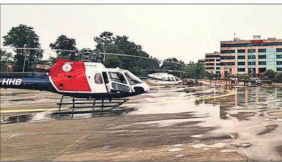
ऋषिकेश एम्स में इमरजेंसी लैंडिंग के बाद खड़े हेलीकॉप्टर। ● अमृत विचार