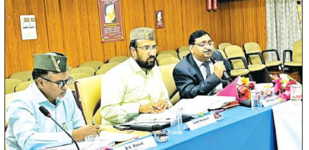
गोविन्द बल्लभ पन्त पर्यावरण संस्थान में बैठक में उपस्थित अतिथि।

की। इसके लिए उन्होंने संस्थान के वैज्ञानिकों तथा शोधार्थियों को बधाई दी। उन्होंने हिमालयी क्षेत्र के विकास और उन्नति के लिए भविष्य के लक्ष्य निर्धारित करने पर बल दिया। उन्होंने कहा कि