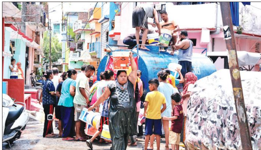
बुधवार को राजपुरा क्षेत्र में जैसे ही टैकर पहुंचा तो पानी भरने के लिए लोगों की भीड़ लग गई, दूसरी ओर गर्मी से राहत पाने के लिए बचे टैकर के पानी से नहाने लगे।

शहर से सटे राजपुरा क्षेत्र में पिछले तीन दिनों से पानी के लिए हाहाकार मचा हुआ है। नलकूप खराब होने के कारण क्षेत्र की लगभग 15 हजार की आबादी पानी के लिए तरस रही है। कहने को जल संस्थान टैकर से जलापूर्ति कर रहा है, मगर लोगों को 1 या 2 बाल्टी से ज्यादा पानी नहीं मिल रहा है। क्षेत्र के राजेंद्रनगर, जवाहर नगर, टनकपुर रोड में पानी की समस्या से लोग परेशान हैं। वहीं, ब्लॉक क्षेत्र में भी नलकूप खराब होने से लोगों को पानी की समस्या से जूझना पड़ रहा है। नलकूप खराब होने से कालादुंगी रोड, कठघरिया, कालिका कॉलोनी और मेहरागांव के लोग भीषण गर्मी जलसंकट का सामना कर रहे हैं। राजपुरा क्षेत्र में जल संस्थान 6 से 7 टैकर प्रतिदिन भेज रहा है, मगर