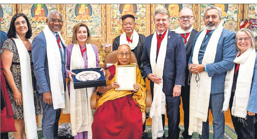
धर्मशाला में बुधवार को अपने आवास पर अमेरिकी प्रतिनिधिमंडल के साथ तिब्बती आध्यात्मिक नेता दलाई लामा।

पेलोसी ने हिमाचल प्रदेश पहुंचने के बाद कहा, मैं यहां आकर रोमांच महसूस कर रही हूँ। कांगड़ा एयरपोर्ट से लेकर मकलोडॉंग तक दलाईलामा के अनुयायियों ने पेलोसी और अमेरिकी प्रतिनिधिमंडल का पारंपरिक वाद्य यंत्रों-नृत्य और पुष्प वर्षा के साथ भव्य स्वागत किया। यह बैठक चीन की बौद्ध भिक्षु (दलाई लामा) के साथ संपर्क से बचने की चेतावनी के बावजूद आयोजित की गई। चीन के लोग उन्हें अलगाववादी भी कहते हैं। अधिकारियों ने कहा कि सात लोगों के द्विदलीय समूह ने दलाई लामा से धर्मशाला के इस पहाड़ी शहर में बौद्ध मठ के सामने उनके महल में मुलाकात की। यह बैठक उनके प्रतिनिधिमंडल के पहुंचने के एक दिन