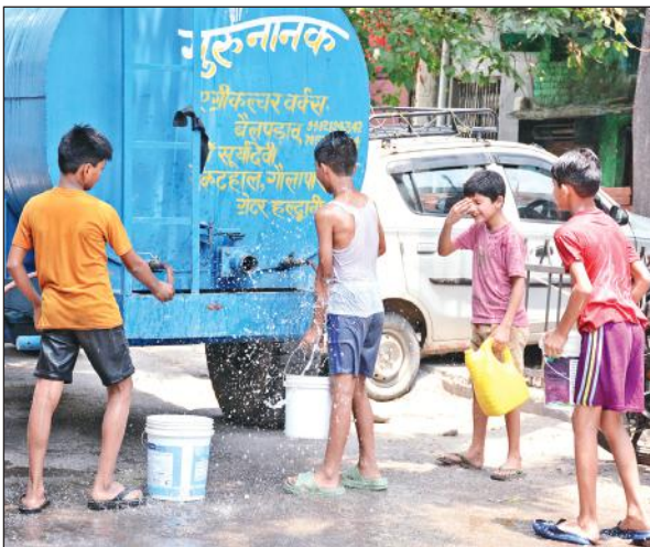
टैकर से पानी भरकर ले जाती किशोरियां।