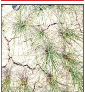
बेमौसमी धान के खेत में पड़ी दरारें।

► किसानों के माथे पर चिंता की लकीरें खिंचीं