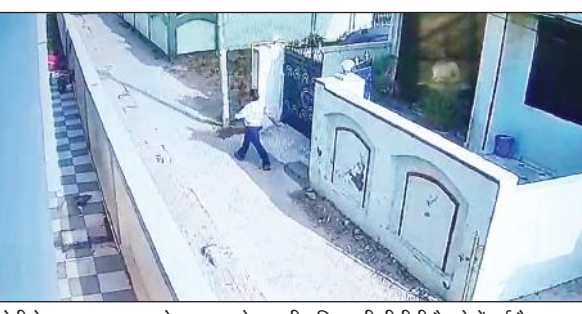
चोरी के असफल प्रयास के बाद घर से भागी महिला सीसीटीवी कैमरे में हुई कैद।

अमृत विचार : मुखानी थाना क्षेत्र में दिनदहाड़े स्कूटी सवार महिला एक घर में घुस गई और लॉकर तोड़ दिया। उसने जेवर भी समेट लिए, लेकिन तभी मकान मालकिन की नजर पड़ गई। महिला ने जेवर से भरा थैला वहीं फेंका और अपनी स्कूटी छोड़कर भाग खड़ी हुई। उसे पकड़ा, लेकिन शातिर धक्का देकर भाग गई।