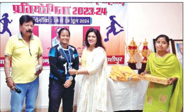
महिला खिलाड़ी को सम्मानित करती मुख्य अतिथि। ● अमृत विचार