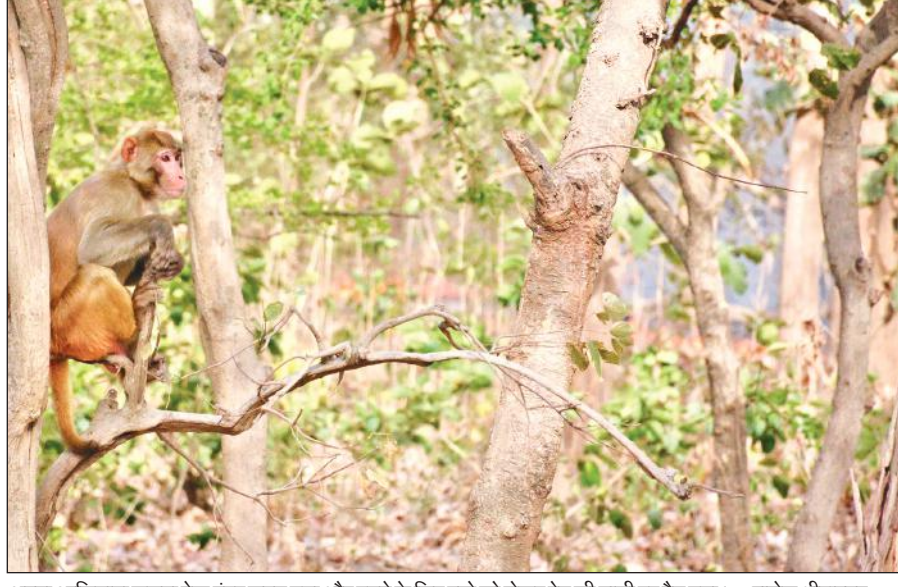
अपना आशियाना जलता देख बंदर सहम गया और बचने के लिए बच्चे को लेकर पेड़ की डाली पर बैठ गया। • राजेश श्रीवास्तव