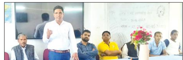
इंटर कॉलेज नाई में बैठक में बोलेते वक्ता। ● अमृत विचार