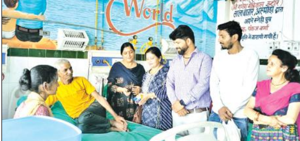
मरीजों को फल वितरित करते कांग्रेस कार्यकर्ता। ● अमृत विचार

अमृत विचार : कांग्रेस कार्यालय में महिला कांग्रेस द्वारा सांसद राहुल गांधी का जन्म दिन मनाया गया महिला कांग्रेस कार्यकर्ताओं ने राहुल गांधी की लंबी उम्र की मंगल कामना की गई। सभी कांग्रेस कार्यकर्ता महिलाओं ने मिलकर केक काटा तथा जिला अस्पताल में जाकर मरीजों को फल, जूस, बिस्किट आदि वितरित किया गया। वहीं एनएस यू आई कार्यकर्ताओं ने भी राहुल गांधी के जन्मदिन पर अमित बिष्ट के नेतृत्व में लेप्रोसी मिशन करबला में फल वितरण किए। इस