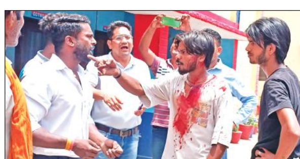
बाजपुर कोतवाली में हंगामा करते घायल लोग।

अमृत विचार: आपसी बात को लेकर चली आ रही रंजिश में दो पक्षों के बीच मारपीट हो गई। जमकर चले लाठी-डंडे में दोनों पक्षों के 6 लोगों के चोटें आई हैं।