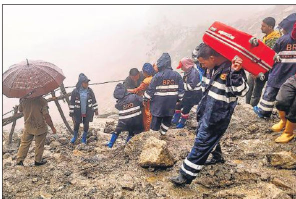
उत्तरी सिक्किम में भूस्खलन के बाद फंसे पर्यटकों को बचाते बीआरओ कर्मी। ● एजेंसी

सिक्किम के लांचुंग में फंसे 1,225 यात्रियों को अब तक निकाल लिया गया है। अभियान के तीसरे दिन बुधवार को अधिकारियों ने यह जानकारी दी। उन्होंने बताया कि देश के विभिन्न हिस्सों से लांचुंग पहुंचे कुल 1,225 पर्यटकों को मंगलवार देररात तक निकाल लिया गया है। वे 12 जून से बारिश और भूस्खलन के बाद ऊपरी क्षेत्र में फंस गए थे। यह अभियान भारतीय सेना, सीमा सड़क संगठन, सिक्किम पुलिस, राष्ट्रीय आपदा प्रबंधन मोचन (एनडीआरएफ), डीएमजी, स्थानीय लोगों और पर्यटन उद्योग के अलावा अधिकारियों द्वारा संयुक्त रूप से चलाया गया।