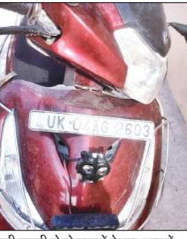
इसी स्कूटी से दो युवकों के साथ घर में चोरी करने आई थी महिला।

गई तो एक महिला लॉकर से जेवर चोरी करती दिखी। उन्होंने शोर मचाते हुए महिला को पकड़ने की कोशिश, लेकिन महिला उन्हें धक्का देकर भाग गई। उसके हाथ में जेवर से भरी थैली थी, जो वहीं गिर गई। महिला के साथ दो युवक बाहर से खड़े थे। पकड़े जाने के डर से वह अपनी स्कूटी भी छोड़ गई। मुखानी पुलिस ने स्कूटी को कब्जे में ले लिया है और फुटेज के आधार पर महिला चोर की तलाश शुरू कर दी है।