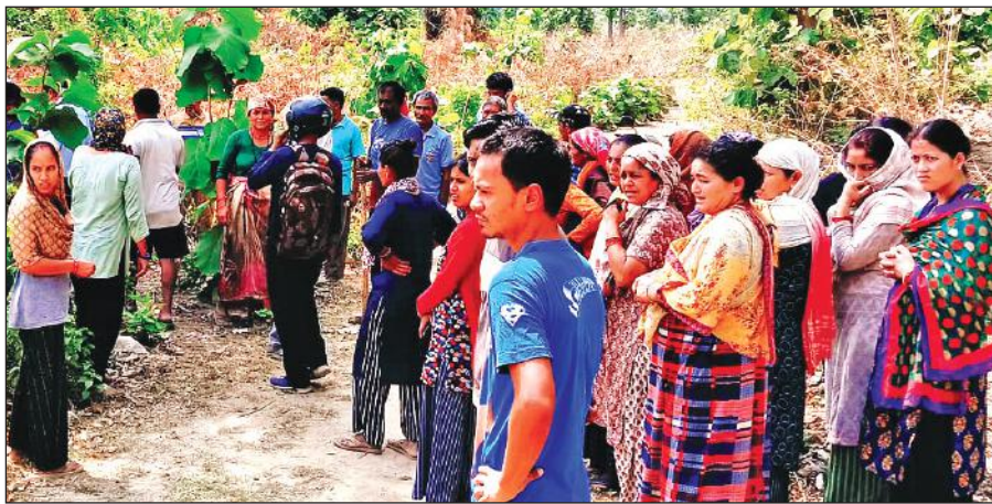
खटीमा के चकरपुर स्थित वनखंडी महादेव मंदिर के पास मौके पर एकत्र हुए ग्रामीण।

अमृत विचार : चकरपुर क्षेत्र में एक महीने के अंतराल में बाघ ने हमला कर एक और वृद्ध को अपना शिकार बना लिया है। दोनों हमलों में मांस को खाए जाने को लेकर बाघ के नरभक्षी होने की आशंका जताई जाने लगी है। वन विभाग बाघ को पकड़ने के लिए पिंजरा लगाने की तैयारी में है।