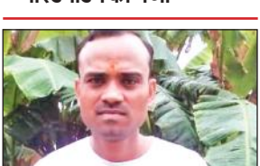
सिडकुल कर्मियों के लिए भेज दिया है। वहीं युवक की मौत से परिवार में कोहराम मच गया।

ड्यूटी पर जा रहा था युवक, शव पोस्टमार्टम को भेजा