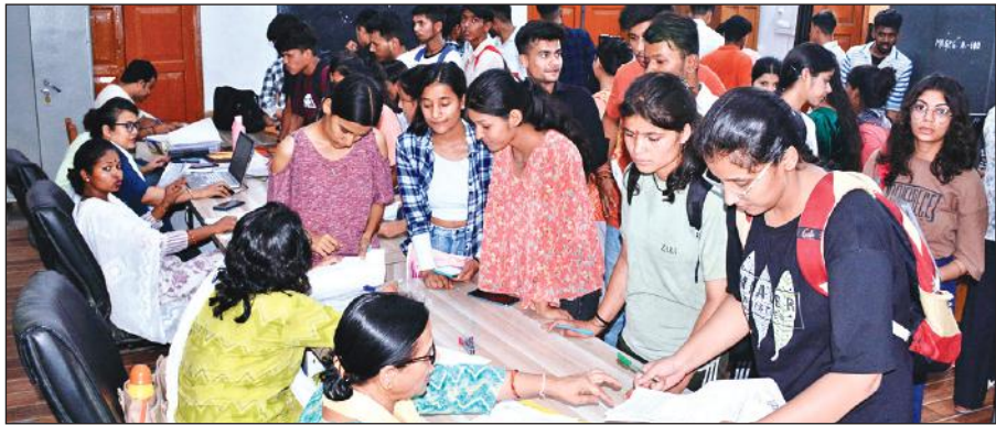
एमबीपीजी कॉलेज में प्रवेश लेने के लिए पहुंचे छात्र-छात्राओं के आवेदन पत्रों की जांच करते शिक्षिकाएं। ● अमृत विचार

एमबीपीजी कॉलेज की प्रवेश समिति के अनुसार बैंक परीक्षार्थियों का परीक्षा परिणाम देरी से जारी होने के कारण छात्र प्रवेश से वंचित रह सकते हैं। कई छात्र-छात्राओं ने अपीयरिंग के तौर पर पंजीकरण तो किया है, लेकिन अंकपत्र नहीं मिलने के कारण वह प्रवेश नहीं ले पाएंगे। सीबीएसई के छात्रों का परीक्षा परिणाम कई बार