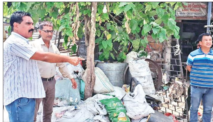
बाजपुर में टीम के साथ ग्राम मुड़िया कला में स्थलीय निरीक्षण करते खंड विकास अधिकारी।