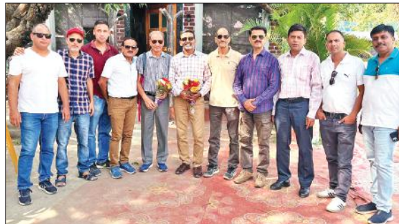
जिला टेनिस एसोसिएशन के नवनिर्वाचित पदाधिकारी। ● अमृत विचार