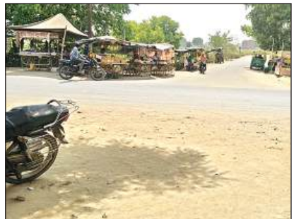
गर्मी के चलते सड़क पर पसरा सन्नाटा।

सुबह 9:00 के बाद घर से निकलना दुश्वार हो रहा है घर के अंदर पंखे कूलर सब बेकार साबित हो रहे हैं। दिन भर पसीना आने के कारण शरीर में अन्य बीमारियां हो रही हैं। लोग घर से निकलते ही छांव की तलाश में रहते हैं। बढ़ती तपिश के कारण गला भी सूख रहा है। इस समय सूर्य देव की किरणें शरीर में बाण की तरह चुभ रही हैं। वातावरण में नमी कम होने के कारण प्रचंड गर्मी का एहसास हो रहा है हवाओं को तापमान भी बढ़ा हुआ है। अब लोगों ने सुबह टहलना कम कर दिया है। सुबह 7:00 बजते ही सूर्य देव की किरणें पृथ्वी पर तेजी से