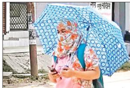
छाता लगाकर जाती युवती।

आसमान से ऐसी आग बरस रही है कि धरती भट्टी बन गई है। घर से निकलना भी मुश्किल हो गया है। जिंदगियां भी खतरों में आ गई हैं। उच्चतम स्थिति की ओर चढ़ रहे पारे में एसी, कूलर और पंखे भी काम नहीं कर रहे हैं। पीने के पानी की किल्लत है तो वहीं नदियां और पोखरों में पानी भी सूख रहा है। भीषण गर्मी ने इस बार लोगों को झुलसाकर रख दिया है। कहर ढा रही गर्मी में पूरा जनजीवन अस्त-