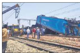
● सरहिंद रेलवे स्टेशन पर हुआ हादसा, दो लोको पायलट घायल

पंजाब के सरहिंद रेलवे स्टेशन पर रविवार सुबह एक खड़ी मालगाड़ी से एक अन्य मालगाड़ी के टकराने से दो लोको पायलट घायल हो गए। राजकीय रेलवे पुलिस के अधिकारी ने बताया कि टक्कर लगने से मालगाड़ियों में से एक का इंजन दूसरी पटरि पर चला गया और एक यात्री ट्रेन से टकरा गया।