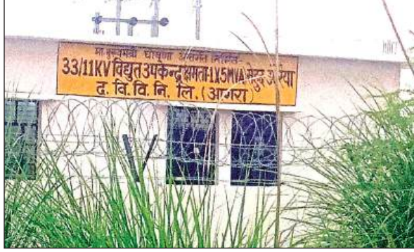
सेहुद स्थित विद्युत उपकेंद्र।

ऐसे समय में सैनिक नगर फीडर की आपूर्ति कई घंटे तक बाधित रहती है। जिससे बच्चे, बड़े और बुजुर्ग सभी लोग परेशान हो जाते हैं। बिजली लाइन लंबी होने के कारण लाइनमैन को फाल्ट सही करने में घंटों का समय गुजर जाता है। जबकि बिजली विभाग द्वारा सेहुद पावर हाउस को चालू हुए छह माह हो चुके हैं। उस पावर हाउस में एसएसओ तथा लाइनमैन की तैनाती भी हो चुकी है। उसके बावजूद भी आज तक सैनिक नगर फीडर से वाशिदों की समस्या का कोई निदान नहीं हो पाया है। माह जनवरी में ही बिजली विभाग के अधिकारी बड़े-बड़े दावे कर रहे थे कि अबकी बार गर्मियों में सैनिक नगर फीडर को गर्मी में समस्याएं नहीं होंगी। उसके बावजूद भी उस पावर हाउस में कोई भी कार्य नहीं हुआ। केवल कन्हई पुरवा, पचा पुरवा, धर्माई पुरवा, अंगु पुरवा, अजमतपुर, बरके पुरवा गांवों को जोड़कर अधिकारियों ने