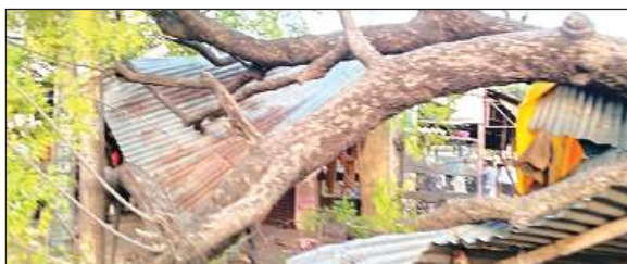
गिरा पड़ा नीम का पेड़।

सब्जी मंडी के बगल में प्राइमरी स्कूल की बाउंड्री के पास एक नीम का पेड़ कई वर्ष पुराना था। जो शाम को लगभग 5 बजे 11000 की विद्युत लाइन पर गिर पड़ा जिसके