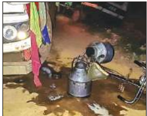
सही गांव में ट्रक की टक्कर से सड़क पर फैला कैस से दूध।

अमृत विचार। सही गांव में खरका घाट में बालू लादने जा रहे तेज रफ्तार ट्रक ने साइकिल सवार दूधिये को टक्कर मार दी और ट्रक लेकर भागने के चक्कर सड़क किनारे खड़े जेएसए से टकरा गया। जिससे एक मकान की दीवार टूट गई। घटना के बाद ग्रामीणों ने गांव के रास्ते में जाम लगा दिया। सूचना पर पहुंची पुलिस ने ग्रामीणों को समझाकर जाम खुलवाया।