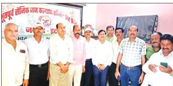
भूतपूर्व सैनिक संगठन की बैठक में भाग लेते पदाधिकारी।

बैठक में जनपद के भूतपूर्व सैनिकों की समस्याओं और चिंताओं की पेशान पर विशेष कार्य समिति ने सर्वसम्मत रूप से प्रदेश कार्यकारिणी का कार्यक्रम जिले में ही करवाने का प्रस्ताव पारित किया। इस कार्यक्रम में प्रदेश भर से पदाधिकारी आकर भूतपूर्व सैनिकों के हितों के संरक्षण और अन्य मुद्दों पर विचार विमर्श करेंगे। इस बारे