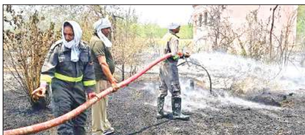
भमौरा गांव में जंगल में लगी आग बुझाते फायर ब्रिगेड के कर्मी।

भमौरा गांव के बाहर से जंगल लगा हुआ है। उसी के पास आंगनबाड़ी केंद्र बना हुआ है। रविवार को दोपहर में जंगल में अज्ञात कारणों के चलते आग लग गई। धीरे धीरे आग ने विकराल रूप धारण कर लिया। जब आग आंगनबाड़ी केंद्र के पास तक पहुंच गई धुंआ व आग की लपटों को