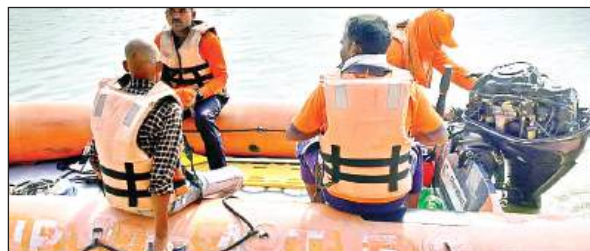
गंगा में डूबे युवक की तलाश करती एसडीआरएफ की टीम।

अमृत विचार। तीसरे दिन भी गंगा में डूबे युवक का सुराग नहीं लग सका। एसडीआरएफ की टीम ने दिन भर कड़ी मशकत कर युवक की गंगा में तलाश की। परिजनों में चोख पुकार मची हुई है।