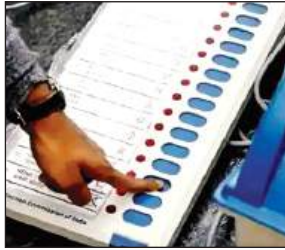
● मीडिया कर्मियों को मोबाइल सेंटर तक ले जाने की अनुमति

बताया कि चार जून को सुबह आठ बजे मतों की गणना मंडी समिति में होगी। मतगणना के समय मोबाइल फोन, माचिस, बीड़ी, तंबाकू, हथियार, कैल्कुलेटर, इलेक्ट्रॉनिक डिवाइस आदि पर रोक रहेगी। सभी वाहन केंद्र से 100 मीटर दूर पार्क किए जाएंगे। मीडिया कर्मियों को फोन सेंटर तक ले जाने की अनुमति होगी। बताया कि मतगणना केंद्र की संपूर्ण प्रक्रिया सीसीटीवी-वीडियोग्राफी की निगरानी में रहेगी। प्रत्येक केंद्र के टैबल संख्या-एक पर वीवीपैट कार्डिंग बूथ बनाया गया है, जिस