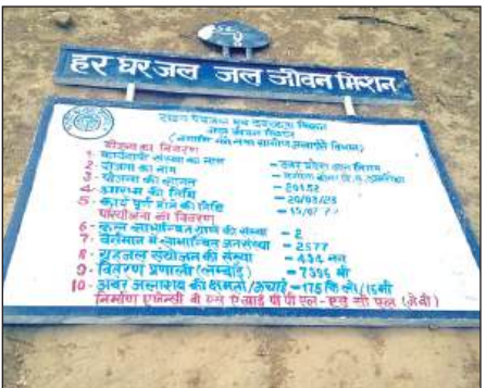
अमृत विचार टंकी निर्माण स्थल पर उखड़ा पड़ा कार्य का बोर्ड।

पूरा नहीं हो सका है। केवल नलकूप का बोर ही किया गया और वह भी खराब हो गया है। जबकि निर्माण की अवधि पूरी हो चुकी है। जिससे भीषण गर्मी में ग्रामीणों को टोंटी से जलापूर्ति की आस टूट रही है। टंकी निर्माण के लिए चिंहित जगह पर लगे सांकेतिक बोर्ड के अनुसार टंकी का 201.52 लाख रुपये की लागत से निर्माण कार्य होना है। निर्माण की