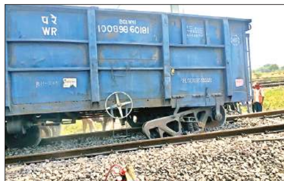
ट्रेक से उतरी मालगाड़ी।

मालगाड़ी के ट्रेक से उतरने की घटना काटोघन रेलवे स्टेशन के पास का है। डीएफसीसी के काटोघन रेलवे स्टेशन पर डाउन लाइन से जा रही मालगाड़ी का एक वैगन रविवार सुबह 05:17 बजे पटरी से उतर गया। ब्रेकवान (गाईं वाला कोच) से 34वें