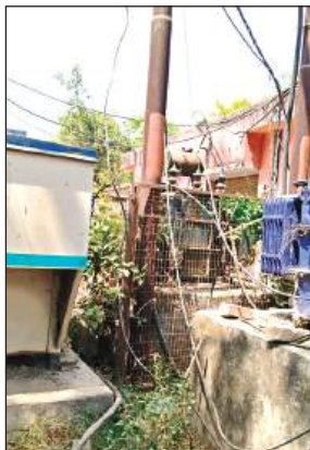
फुका पड़ा ट्रांसफार्मर।

शुक्रवार रात 12 बजे मुराइन टोला फीडर का एक ट्रांसफार्मर फुंक गया था। जैसे तैसे शनिवार को दूसरे ट्रांसफार्मर की ट्राली पहुंची और उसे कर्मियों ने लगाया। बताया जा रहा है कि कुछ ही देर बाद वह भी धुआं देने लगा। विभाग को शिकायत की गई। हालांकि वह ट्रांसफार्मर की ज्यादा देर तक नहीं टिक सका और फुंक गया। जिससे