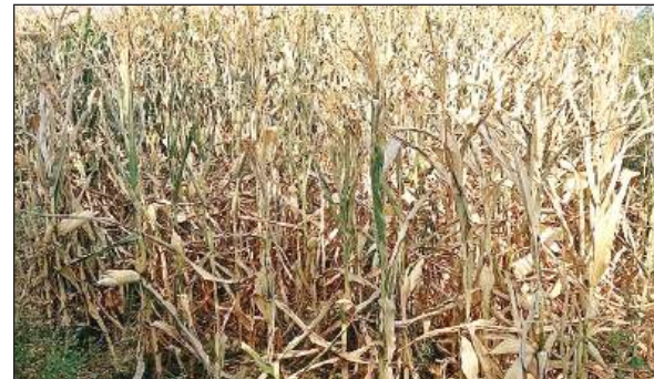
सिंचाई के अभाव में सूखी मक्का की फसल। अमृत विचार

गिर पड़ा। घटना होते ही मौके पर लोगों की भीड़ जुट गई और पुलिस को सूचना दी गई। मौके पर पहुंची पुलिस उसे मेडिकल कॉलेज लेकर पहुंची लेकिन डॉक्टर ने जांच के बाद ने मृत घोषित कर दिया। पुलिस