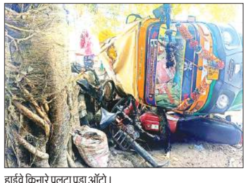
हाईवे किनारे पलटा पड़ा ऑटो।