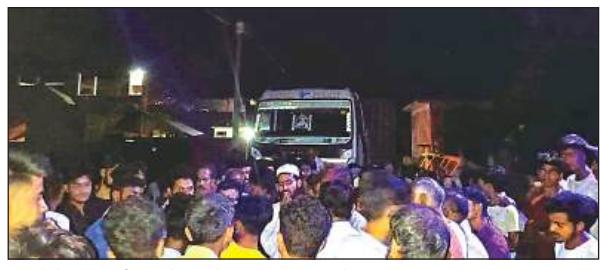
हादसे के बाद सही गांव के रास्ते पर जाम लगाए लोग।

उनके झुलसने की संभावना काफी अधिक होती है। धान की पौध डालने के लिए दिन में 30 से 35 डिग्री सेल्सियस और रात को 16 से 23 डिग्री सेल्सियस तापमान होना चाहिए। जिससे धान के बीजों के अंकुरण के लिए नमी और उचित तापमान मिल सके। उन्होंने बताया कि अभी तापमान अंकुरण के लिए अनुकूल नहीं है।