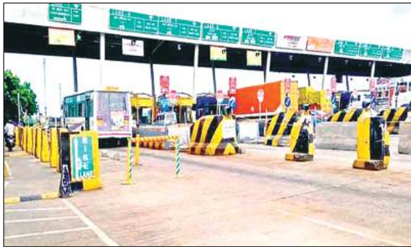
बारा टोल प्लाजा।

बता दें कि बीती एक अप्रैल से टोल टैक्स की नई दरें लागू की जानी थीं। लेकिन किन्हीं कारणों से नेशनल हाईवे अर्थोपेटी ऑफ इंडिया ने अप्रैल माह में बढ़ी हुई दरें लागू नहीं की थीं। जिससे वाहन चालकों को दो माह की राहत मिलती रही। लोगों ने सभावना जताई थी कि लोकसभा चुनाव होने के बाद नई दरें लागू की जाएंगी, जो सही साबित हुई और बढ़ी दरें 3 जून से लागू कर दी गई हैं। बारा टोल प्लाजा से गुजरने वाले वाहनों में पांच से 25 रुपये तक की बढ़ोतरी की गई है। इसमें कार से लेकर भारी वाहन शामिल हैं। वहीं टोल से 20 किलोमीटर के दायरे में आने वाले निजी वाहनों कार, जीप के मासिक पास में भी दस रुपये की बढ़ोतरी की