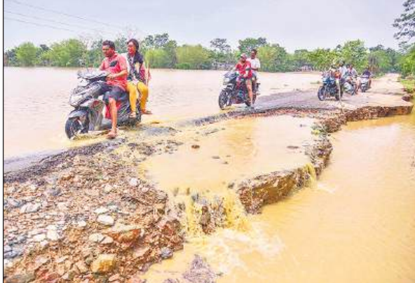
असम के नागांव जिले में चक्रवात रैमेल के बाद हुई बारिश के बाद आई बाढ़ से क्षतिग्रस्त सड़क पर दोपहिया वाहन से उतारो लोग।

असम में बाढ़ की स्थिति में कोई सुधार नहीं हुआ है और 10 जिलों में छह लाख से अधिक लोग अब भी प्रभावित हैं। अधिकारियों ने रविवार को यह जानकारी दी।