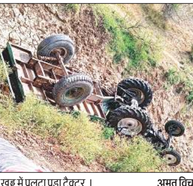
खड्ड में पलटा पड़ा ट्रैक्टर।