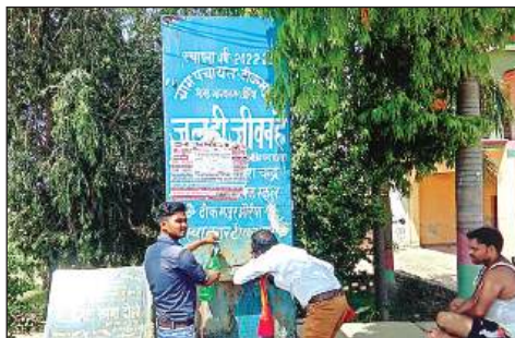
गर्मी से राहत पाने को पेड़ के नीचे बैठा व्यक्ति व प्यास बुझाते राहगीर।