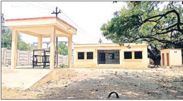
राजकीय पशु चिकित्सालय का नवीन भवन।

अमृत विचार। दशकों से जर्जर भवन में संचालित हो रहे राजकीय पशु चिकित्सालय को नवीन भवन में शिफ्ट किया जाना है लेकिन कछुआ गति से हो रहे निर्माण के कारण दो साल बाद भी कार्य पूर्ण नहीं हो सका। जो हुआ भी है वह घटिया सामग्री के कारण क्षतिग्रस्त होने लगा है। कई बार विभागीय उच्चाधिकारियों से लिखित शिकायत भी की जा चुकी है। काम अधूरा होने से भवन का हस्तांतरण लटका है।