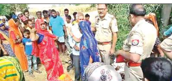
दुर्घटना के बाद एकत्र भीड़ व पुलिस।

● छात्रा भाई समेत दुर्घटना में घायल: फर्रुखाबाद। थाना नवावगंज क्षेत्र के गांव उखरा