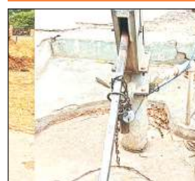
हैंडपंप पर लगा ताला।