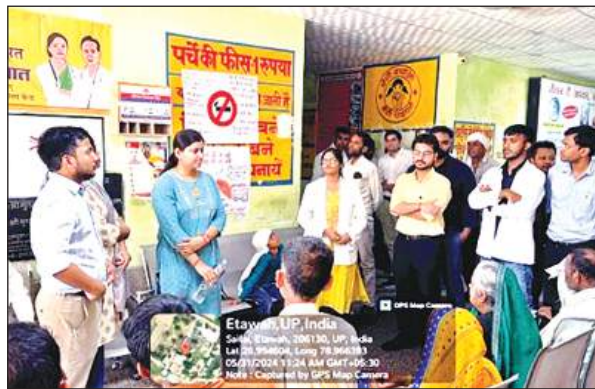
तंबाकू सेवन के खतरों से बचाव की जानकारी देते चिकित्सक।

शिक्षा पाने का अधिकार है। उन्होंने बच्चों को गुड टच और बेड टच भी समझाए। उन्होंने बच्चों को शिक्षा