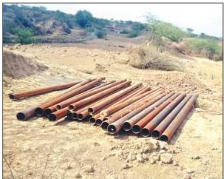
टंकी निर्माण स्थल पर पड़े पाइप।

अमृत विचार। हर घर जल जीवन मिशन के तहत गांव-गांव पानी की टंकी का निर्माण कर घर-घर पानी पहुंचाने के दावे तो किए जा रहे हैं, लेकिन हकीकत में ग्रामीण क्षेत्रों में पानी टंकियों का निर्माण समयावधि पूरा होने के बावजूद अधर में लटकता है। जिससे लोगों को घर की टोंटी से पानी नहीं मिल पा रहा है। इसी तरह का हाल नगीना बांगर में अधूरी पानी टंकी ब्यां कर रही है।