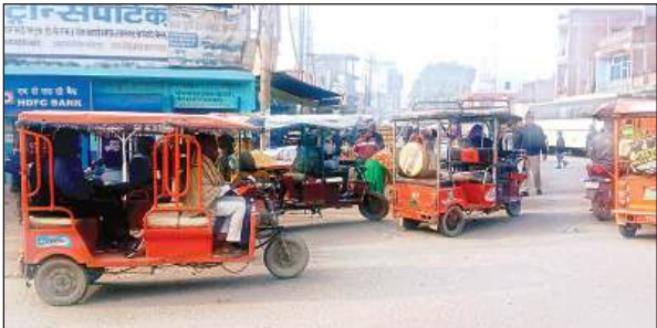
ट्रांसपोर्टर की गाड़ियां पटरियों पर खड़ी होने के कारण लाता है जाम।

सदर नगर पालिका क्षेत्र के नेशनल हाईवे पर सहायक संभागीय परिवहन कार्यालय के पास ट्रांसपोर्ट नगर के लिए जमीन एलाट की थी। जिस पर इस ठिकाने पर 48 दुकानें पूरी तरह से बनकर तैयार हो गई थीं। 10 दुकानें अधर्निर्मित थीं।