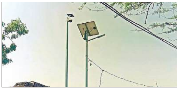
ग्रामपंचायत में लगाए गए वॉइसरिकॉर्डिंग कैमरे।