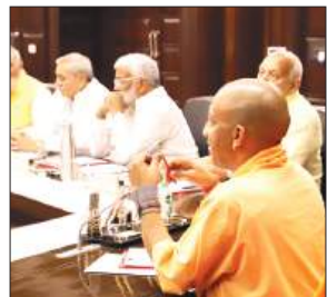
लखनऊ में बैठक लेते मुख्यमंत्री योगी।

अमृत विचार : लोकसभा चुनाव में उत्तर प्रदेश से आए निराशाजनक परिणामों के बाद मुख्यमंत्री योगी आदित्यनाथ ने शनिवार को अपने मंत्रियों के साथ बैठक की। लोकसभवन में हुई बैठक में मुख्यमंत्री ने जहां पार्टी के कमजोर प्रदर्शन के कारणों का फीडबैक लिया वहीं मंत्रियों को वीआईपी कल्चर छोड़कर फील्ड में उतरकर आमजन से संवाद रखने और उनकी समस्याएं निपटाने की सख्त हिदायत दी। मंत्रिपरिषद की इस बैठक में दोनों उपमुख्यमंत्री ब्रजेश पाठक