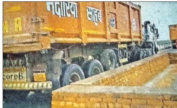
पैलानी स्थित केन नदी के पुल से गुजरते वाहन। फाइल फोटो

के टॉप लेवल में लगभग 60 एमएम का अंतर आ गया है। ऐसा प्रतीत होता है कि स्लैब के नीचे रॉक एंड रोलर विचारों में दरार आ गई है। जिसके कारण सतह में अन्तर में आ गया है। यह अन्तर दो मुख्य स्पान के मध्य 7.00 मी स्पान वाले भाग में एक कोने में अधिक देखा गया है जो कैरिज-वे के मध्य की ओर कम