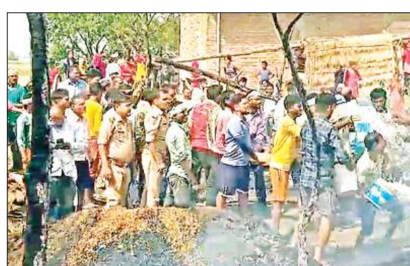
आग बुझाने का प्रयास करते ग्रामीण।