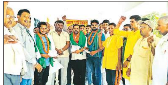
नई कार्यकारिणी में मौजूद पदाधिकारी।