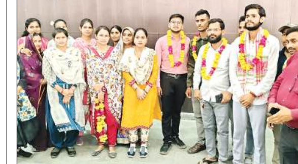
पंचायत सहायक संघ की ब्लाक इकाई के निर्वाचित पदाधिकारी।