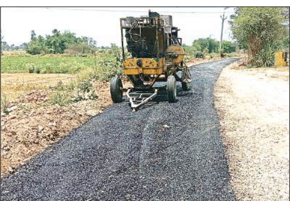
सड़क में मानकविहीन डाली जाती गिट्टी और डामर।

हसवां विकासखंड क्षेत्र की ग्राम पंचायत सातों जोगा के मजरे बरेड़ा की सड़क एक दशक पूर्व से टूटी थी जब सड़क निर्माण का कार्य शुरू हुआ तो ग्रामीणों में ललक जागी कि इस बार अच्छी सड़क बन जाएगी और आने जाने में सहूलियत होगी लेकिन जिम्मेदारों के द्वारा सड़क निर्माण में खानापूति