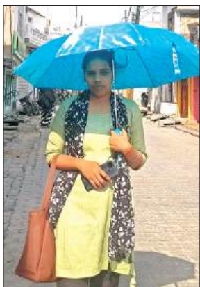
धूप से बचाव के लिए छाता लगाकर सड़क पर जाती युवती।

दो दिन पहले तेज हवा के साथ हल्की बूंदाबांदी से गर्मी से राहत मिलने की आस बंधी थी। लेकिन शनिवार को सूरज के तल्लख तेवरों से और अधिक कठिन स्थिति बनती दिख रही है। सड़क पर लोगों का निकलना कठिन हो गया। जो