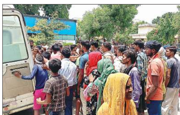
मौके पर मौजूद ग्रामीणों की भीड़।