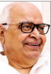
हृदय नारायण दीक्षित पूर्व विधानसभा अध्यक्ष उ.प्र.

दरसअल पिछले चुनाव में विपक्ष एकदम निचले स्तर पर था जिससे नीचे जाने की जगह नहीं थी और बीजेपी अपने शिखर पर थी जिससे ऊपर जाना संभव नहीं था। बीजेपी चार सौ पार का नारा देती रही और विपक्ष हर हाल में एकजुटता दिखाता रहा। बीजेपी को सबसे बड़ा झटका उत्तर प्रदेश में लगा। यहां राम मंदिर का जादू नहीं चला और न ही सांप्रदायिक विभाजन काम आया। लोग बेरोजगारी, महंगाई और भ्रष्टाचार को भूल नहीं पाए। नड्डा के बयानों ने रही सही कसर पूरी कर दी। उनका ये कहना कि पार्टी को आरएएसएस की जरूरत नहीं और बिहार में उन्होंने कहा कि छोटे और क्षेत्रीय दलों का कोई भविष्य नहीं है, एनडीए में शामिल छोटे दलों को बीजेपी से दूर करने में सहायक हुए। बहरहाल नतीजा हमारे सामने है एक लंगड़ी सरकार दो बैसाखियों पर चलकर सरकार कैसी चलाएगी इसका अनुमान लगाना बहुत आसान है।