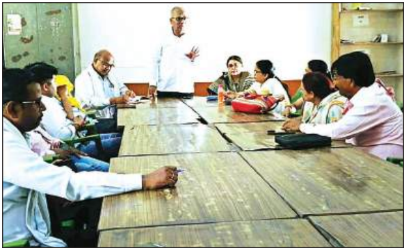
प्रवेश परीक्षा की तैयारी बैठक को संबोधित करते प्रधानाचार्य।