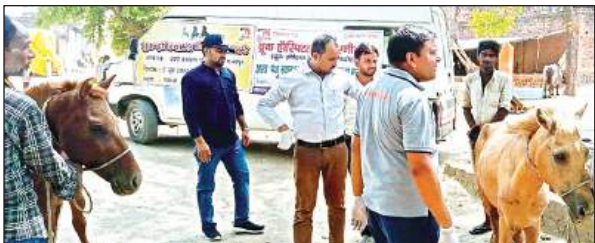
बुक इंडिया द्वारा मनाया जाता फाउंडेशन दिवस।