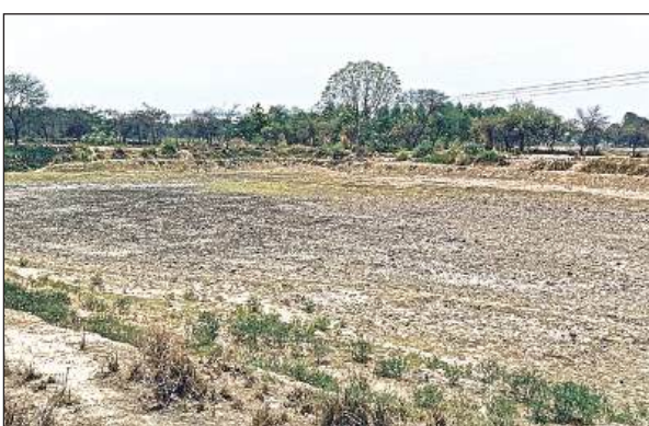
सूखा पड़ा अमृत सरोवर का तालाब।

करीब 25 से 30 साल पहले तालाब गांव की संपत्ति हुआ करते थे। गांव वाले बरसात के पहले तालाब से मिट्टी निकालते थे और उस मिट्टी का प्रयोग अपने घरों में करते थे जिससे तालाब की गहराई हो जाती थी और मनुष्य की जो आवश्यकता है मिट्टी की वह भी पूरी हो जाती थी फिर बरसात आने पर चारों तरफ से बरसात का पानी तालाब में आता था जिससे तालाब