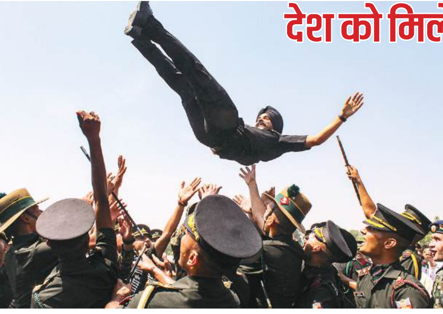
भारतीय सैन्य अकादमी के ऐतिहासिक चैटपुड भवन के टीक सामने जश्न मनाते कैडेट्स।

और केशव प्रसाद मोर्य मौजूद नहीं थे। दोनों ही दिल्ली दौरे पर हैं। बैठक में मुख्यमंत्री ने चुनाव