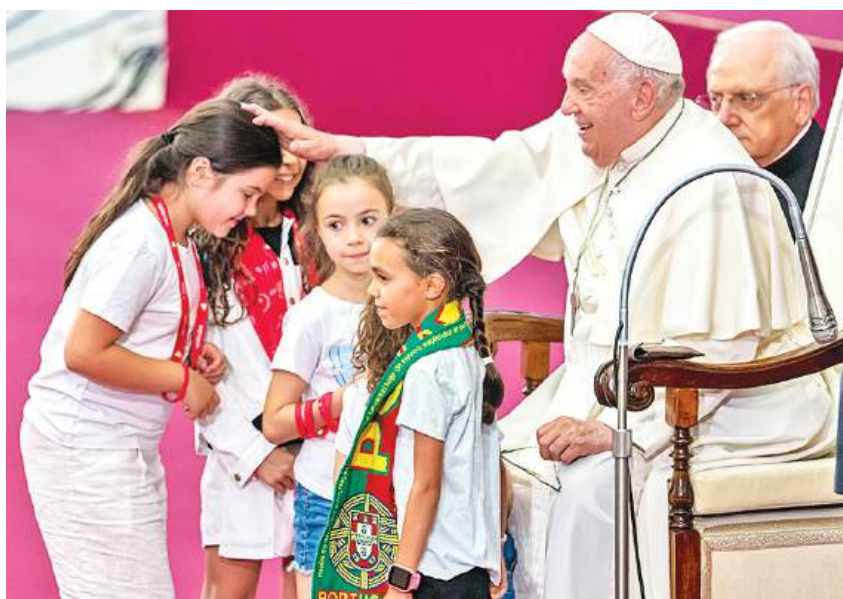
शनिवार को वेटिकन के पॉल VI हॉल में विभिन्न देशों के गायकों के सदस्यों के साथ दर्शकों के बीच पोप फ्रांसिस ने बच्चों का उत्साहवर्धन किया।