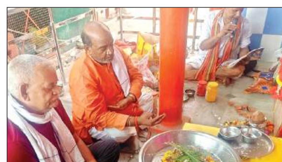
मनोकामना देवी मंदिर में रुद्राभिषेक में भाग लेते भक्त।