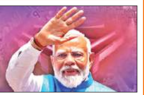
● अनुभव एवं नवीनता का मिश्रण होंगी मोदी की तीसरी मंत्रिपरिषद

नई दिल्ली। प्रधानमंत्री नरेंद्र मोदी की तीसरी मंत्रिपरिषद में करीब 40 सदस्यों को शामिल किया गया है। जिनमें गठबंधन के सहयोगी दलों के 20 लोग शामिल किए गए हैं। वहीं, महत्वपूर्ण मंत्रालयों में पुराने अनुभवी चेहरे सरकार के संचालन की रफ्तार को सुचारु रूप से बढ़ाएंगे। सूत्रों के अनुसार राजग के सबसे बड़े घटक तेलुगु देशम पार्टी को मंत्रिमंडल में तीन स्थान एवं जनता दल यूनाइटेड को दो स्थान मिल सकते हैं। बाकी दलों को एक-एक स्थान दिये जाने की चर्चा है। ऐसी स्थिति में अनुभव एवं नवीनता दोनों का सामंजस्य मोदी के मंत्रिमंडल में दिखायी देने की संभावना है। भाजपा के नये चेहरों में मध्य प्रदेश, केरल, ओडिशा, आंध्र प्रदेश, कर्नाटक के कुछ पुराने अनुभवी चेहरे भी होंगे। गृह, रक्षा, वित्त, विदेश, रेलवे, सड़क परिवहन, सूचना एवं प्रसारण, नागरिक उड्डयन जैसे मंत्रालय भारतीय जनता पार्टी के पुराने बड़े चेहरों के पास ही रहने की संभावना है, जबकि सूचना प्रौद्योगिकी, सामाजिक न्याय एवं अधिकारिता, कृषि, ग्रामीण विकास, भारी उद्योग, उद्योग एवं वाणिज्य आदि में भाजपा एवं सहयोगी दलों के नये चेहरे देखे जा सकते हैं। यह भी संभव है कि बड़े मंत्रालयों में पुराने कैबिनेट मंत्रियों के साथ सहयोगी दलों के राज्य मंत्री भी दिखायी दें।