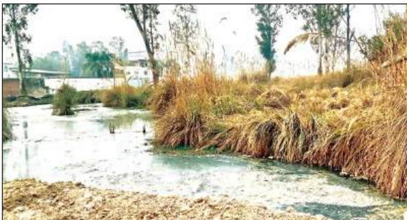
नाले में बहता गंदा पानी।

गोधरौली को इन दो औद्योगिक इकाइयों से पांडु नदी तक केमिकल युक्त गाढ़ा जहर चैंबर व खुले नाले पर नजर आ रहा है। इकाइयों के अन्दर काफी संख्या में बोरलेव बने हुए हैं। जिनमें अपशिष्ट का थोला छोड़ा जाता है। जिससे भूगर्भ जल प्रदूषित हो रहा है। केमिकलयुक्त जहरीला कचड़ा बहाने के लिए पीडब्ल्यूडी की सड़क के किनारे बनाया गया छह किलोमीटर लंबा कच्चा खुला नाला व चैंबर, किसके आदेश से बनाया गए। इसका किसी