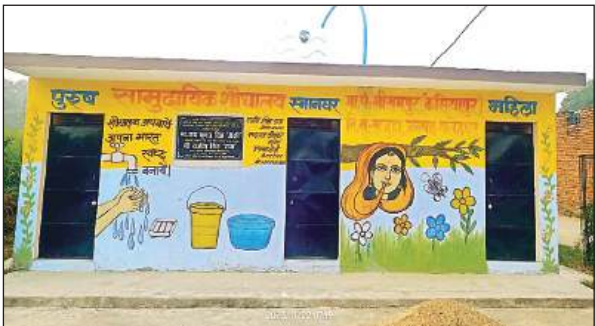
बंद पड़ा सार्वजनिक शौचालय।

पूर्व पीएम नरेंद्र मोदी ने स्वच्छ भारत मिशन के तहत घर घर इज्जतघर उपलब्ध कराने का जो प्रयास किया। बेशक, वह हरेक चौखट पर लगभग दिखाई दे रहा है। यह दीगर बात है कि जिस मकसद के लिए 12-12 हजार