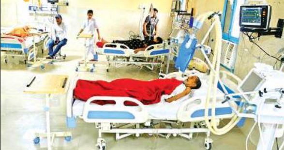
उर्सला अस्पताल की कार्डियक यूनिट में भर्ती मरीज।

कानपुर। नौबस्ता मौरंग मंडी में सौ बेड के संयुक्त जिला अस्पताल का निर्माण चल रहा है, जिसका 85 प्रतिशत काम पूरा हो चुका है। अगस्त तक अस्पताल का उद्घाटन होने की उम्मीद है। सीएमओ डॉ. आलोक रंजन ने शासन से अस्पताल के लिए 35 डॉक्टर, 150 पैरामेडिकल स्टाफ व कर्मचारियों की मांग की है। जांच व इलाज के सहायक उपकरण भी मांगे हैं। सीएमओ के मुताबिक डॉक्टर व स्टाफ की तैनाती के बाद अस्पताल का संचालन किया जाएगा।