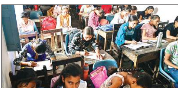
कार्यशाला में मौजूद बच्चे।

बच्चों को मेहंदी कला के साथ-साथ चित्रकला में भी निपुण बनाया जा रहा है। चित्रकला में साधारण डिजाइन करना दूसरे ज्योमेट्रिकल डिजाइन प्राकृतिक चित्र, मानवी चित्र, आधुनिक चित्रण के अंतर्गत