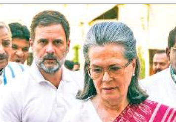
सीपीपी की बैठक के लिए जाते राहुल और सोनिया।

कांग्रेस कार्य समिति ने राहुल गांधी को सर्वसम्मति से लोकसभा में विपक्ष का नेता बनाने का प्रस्ताव पारित किया और कहा कि गांधी ही लोकसभा में पार्टी के प्रभावी तरीके से उठा सकते हैं। कांग्रेस महासचिव के.सी. वेणुगोपाल तथा जयराम रमेश ने समिति की बैठक के बाद यह जानकारी दी।