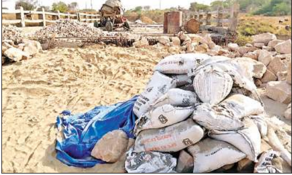
निर्माणधीन पुल का फैला पड़ा सामान।

अमृत विचार। क्षेत्र के खखरेरु दरियापुर गांव समीप ससुर खदेरी नदी- 2 में पुल का निर्माणकार्य काफी दिनों से ठप है। कार्यदायी संस्था पुल का निर्माण दो सालों से करवा रही है। जबकि निर्माण कार्य एक साल में पूरा कराया जाना था। पुल अधर में लटका होने से बारिश के दिनों में आवागमन करने वाले लोगों को काफी परेशानियों को सामना करना पड़ता है।