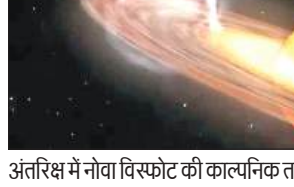
अंतरिक्ष में नोवा विस्फोट की काल्पनिक तस्वीर।

इस दुर्लभ खगोलीय घटना की खबर अमेरिकी अंतरिक्ष एजेंसी नासा ने जारी की है। कभी भी यह धमाका हो सकता है। इसकी निश्चित तिथि अभी तय नहीं है। मगर वैज्ञानिक दृष्टि से बेहद महत्वपूर्ण मानी जा रही है। जिस कारण वैश्विक खगोलविद इस दुर्लभ नोवा विस्फोट का इंतजार कर रहे हैं। साथ ही पेशेवर और