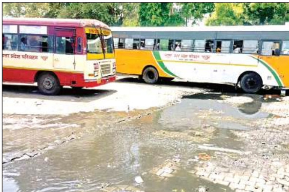
बस अड्डे पर भरा पानी।

रोडवेज बस अड्डे पर 2021 में जलभराव को खत्म करने के लिए राज्य सड़क परिवहन निगम के निर्माण खंड ने सर्वे कर 34 लाख का एस्टीमेट बनाकर भेजा था। इसमें बस अड्डे के सामने इंटर लॉकिंग, नाला निर्माण, पाइपलाइन