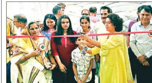
उद्घाटन करती डीएम दुर्गा शक्ति नागपाल।