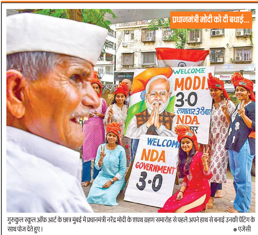
गुरुकुल स्कूल ऑफ आर्ट के छात्र मुंबई में प्रधानमंत्री नरेंद्र मोदी के शाय ग्रहण समारोह से पहले अपने हाथ से बनाई उनकी पेंटिंग के साथ पूजित होते हुए।