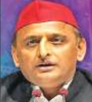
● दिल्ली में होगी औपचारिक घोषणा