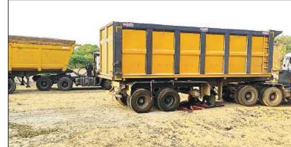
खड़नी चौकी पर खड़े डंपर।