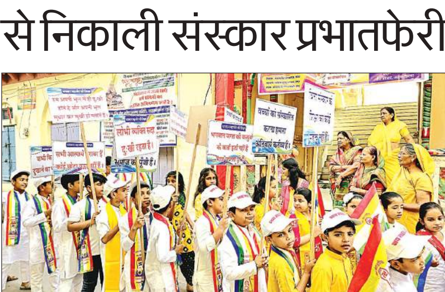
प्रभात फेरी में भ्रमण करते नौनिहाल।