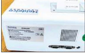
उर्सला आई एचआईए-11000 मशीन।

उपकरण के संबंध में उर्सला अस्पताल प्रशासन ने शासन को पत्र लिखा था। शासन से करीब एक सप्ताह पहले एचआईए-11000 मशीन उपलब्ध कराई गई है, जो उर्सला में आ गई है। उर्सला अस्पताल के निदेशक डॉ. एचडी