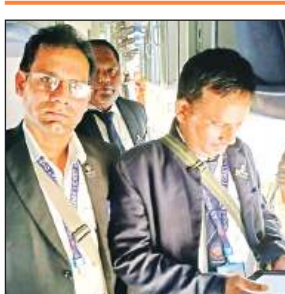
ट्रेन में सामान की जांच करता पूर्वोत्तर रेलवे का चेकिंग दल।