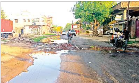
सड़क पर बहता गंदा पानी।

कहीं जलभराव की स्थिति न पैदा हो सके। लेकिन इस बार तक जून माह शुरू होने के बाद भी अभी तक सफाई का कार्य नहीं शुरू हो सका। बजट के आभाव में समय पर नहीं होता भुगतान नगर पालिका द्वारा नाला-नालियों की सफाई के लिए कुल 32 प्वाइंटों पर निविदा के आधार पर ठेका दिया जाता रहा है। जिसमें करीब 50 लाख रुपये का स्टीमेंट बनता है। अलग अलग स्थानों में ठेकेदार अपने सफाई श्रमिक एवं पोकलैंड मशीनों से नाला नालियों की सफाई कराई जाती है। मई माह से शुरू होकर मानसून आने के पूर्व सफाई का कार्य पूरा किया जाता है, लेकिन इस बार अभी तक सफाई के लिए स्टीमेंट बनाने तक ही कवायद की गई है। अभी स्टीमेंट पास होने का इंतजार है।