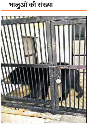
सफारी पार्क में चहलकदमी करती भालू।

इटावा सफारी पार्क के डायरेक्टर की ओर से भालू लाने के लिए 5-6