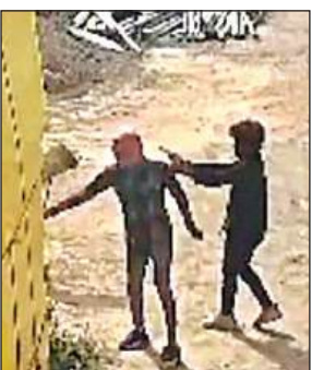
सीसीटीवी में कैद फायरिंग करने वाले नकाबपोश बदमाश।