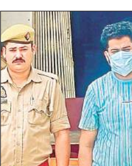
गिरफ्तार किया गया आरोपी।