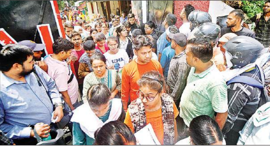
गोमती नगर के खरगापुर में वरदान इंटरनेशनल एकेडमी में यूजीसी नेट की परीक्षा देकर निकलते परीक्षार्थी। अमृत विचार

कार्यालय संवाददाता, लखनऊ अमृत विचार : यूजीसी नेट 2024 की परीक्षा देने आए कई परीक्षार्थी परीक्षा केंद्रों की अव्यवस्थाओं का शिकार हो गए। दो परीक्षा केंद्रों पर छात्रों ने जमकर हंगामा भी किया। लगभग 30 परीक्षार्थी देर से आने के कारण परीक्षा देने से वंचित रह गए। उनका आरोप था कि वह समय से परीक्षा केंद्र पर पहुंच गए थे लेकिन उसके बावजूद उन्हें परीक्षा देने नहीं दिया गया।