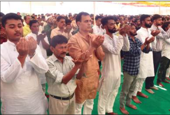
आसिफी इमामबाड़े में ईद-उल-अजहा की नमाज पढ़ते शिया समुदाय के लोग।

पेशबाग ईदगाह और आसिफी मस्जिद में सबसे ज्यादा लोगों ने नमाज अदा कर शुक का सजदा