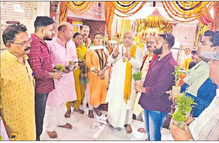
गोमती तट स्थित लेटे हुए हनुमान मंदिर में पर्यावरण संरक्षण की शायच दिखाते श्रद्धालु।