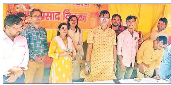
बैंक ऑफ बड़ोदा के नरही ब्रांच में भंडारे के आयोजन के दौरान मौजूद मुख्य प्रबंधक।