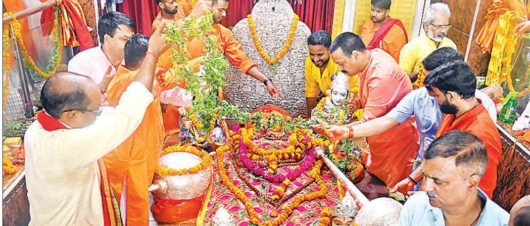
ज्येष्ठ के बड़े मंगलवार को पातालपुरी हनुमान मंदिर में मूर्ति का शृंगार करते भक्त।

मुख्य विकास अधिकारी ने बताया कि इसके लिए आयुष क्वच पेप गुगल प्ले स्टोर से डाउनलोड करना होगा। इसमें आईवाईडी 2024 पर क्लिक करने पर तीन विकल्प मिलेंगे। इसमें से इंटीविजुअल पर जाकर योग करते हुए अपनी फोटो डाल सकते हैं। इसी तरह सहभागिता प्रमाणपत्र भी डाउनलोड कर सकेंगे।