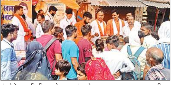
भंडारे में प्रसाद वितरित करते व्यापार मंडल के अध्यक्ष। अमृत विचार