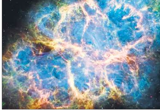
वेब टेलिस्कोप द्वारा ली गई क्रेब नेबुला की आकर्षक तस्वीर।

सुपरनोवा का अवशेष है। सुपरनोवा विस्फोट 1054 ईसवी में हुआ था। यह भयानक विस्फोट था। जिसका प्रकाश दिन के उजाले में भी पृथ्वी से देखा गया था। अब यह गैस और धूल का एक फैलता हुआ आवरण है, और एक पल्सर द्वारा संचालित बाहर की ओर बहने वाली हवा है। क्रेब नेबुला असामान्य निहारिका है। इसकी संरचना ने सुपरनोवा विस्फोट की ऊर्जा ने खगोलविदों को यह सोचने के लिए प्रेरित किया था कि यह एक इलेक्ट्रॉन-कैप्चर सुपरनोवा था, जो एक दुर्लभ प्रकार का विस्फोट होता है। इसमें ऑक्सीजन, निर्वाण और मैग्नीशियम से बना कम विकसित कोर होता है। वेब टेलीस्कोप अपनी संवेदनशील अवरक्त क्षमताओं के साथ इसके रहस्य उजागर कर रहा है। बहुत जल्द क्रेब के कुछ अन्य राज सामने आने की संभावना जताई गई है।