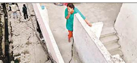
नूरबाड़ी में बिजली विभाग के अभियान के दौरान ड्रोन कैमरे में कैद हुई कटिया उतारती महिला की तस्वीरें। अमृत