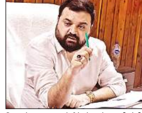
शिया सेन्ट्रल वक्फ बोर्ड के चेयरमैन अली जैदी

अमृत विचार : उत्तर प्रदेश शिया सेन्ट्रल वक्फ बोर्ड आगामी दिनों में शिक्षा और स्वास्थ्य के क्षेत्र में बड़े पैमाने पर काम करेगा। इस खांबा को हकीकत में बदलने के लिए बोर्ड अपनी आमदनी को बढ़ाने के हर संभव उपाय कर रहा है। यह बात शिया सेन्ट्रल वक्फ बोर्ड के चेयरमैन अली जैदी ने अमृत विचार से खास बातचीत में कही। अली जैदी ने बताया कि बेसहारा लोगों की मदद, हर बच्चे की शिक्षा का इंतजाम और सभी को तुरंत इलाज का व्यवस्था कराने के लिए छोटे स्तर पर काम शुरू किया गया। कई