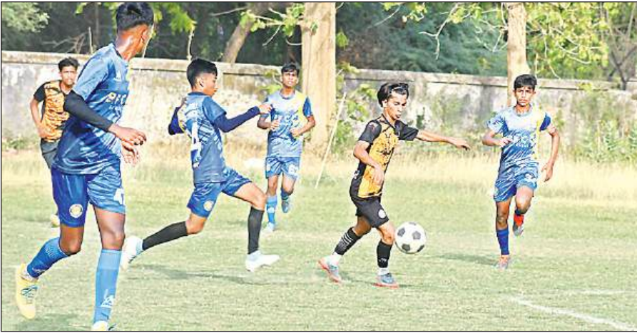
दिलकुशा मैदान में प्रतियोगिता के दौरान प्रतिभाग करती पश्चिमी बंगाल टीम के खिलाड़ी।

अमृत विचार : आकर्ष की हैट्रिक के साथ ही राम के शानदार प्रदर्शन को बंदौलत उत्तर प्रदेश ने राष्ट्रीय फुटबॉल प्रतियोगिता में जीत दर्ज की। कैंट के दिलकुशा मैदान पर शनिवार को खेले गए बालक अंडर-14 आयु वर्ग के मुकाबले में उत्तर प्रदेश ने मध्य प्रदेश को 5-0 से हरा दिया।