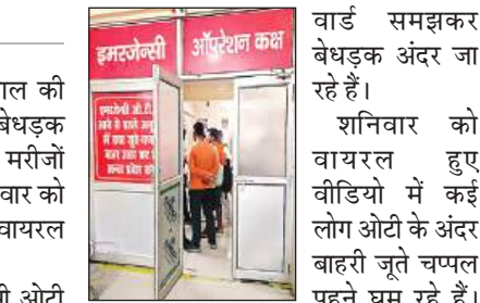
ओटी में बाहरी जूते-चप्पल पहनकर खड़े लोग।

अमृत विचार : बलरामपुर अस्पताल की इमरजेंसी में बिना शू कवर के लोग बेधड़क अंदर-बाहर आ जा रहे हैं। ऐसे में मरीजों को संक्रमण होने का खतरा है। शनिवार को किसी तीमारदार ने इसका वीडियो वायरल कर नाराजगी जताई है। बलरामपुर अस्पताल की इमरजेंसी ओटी में डॉक्टर माइनेर सर्जरी करते हैं। कभी कदार यहां पर इमरजेंसी सर्जरी भी होती है। इमरजेंसी ओटी में बिना रोकटोक लोग घुस जाते हैं। वह भी बाहरी जूते-चप्पल पहनकर। इमरजेंसी ओटी में प्रवेश के लिए कोई भी मानक तय नहीं है। नतीजा लोग ओटी को