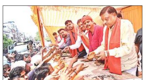
सदर बाजार में आयोजित भंडारे में प्रसाद लेते श्रद्धालु। अमृत विचार

उन्नाव, अमृत विचार। उन्नाव के एक विधायक का एक वीडियो सोशल मीडिया पर वायरल हो रहा है। इसमें वह एक युवक को गाली देने के साथ उसे थपड़ मारते दिख रहे हैं। वह पास में खड़ी महिलाओं को भी अभद्र भाषा बोलते नजर आ रहे हैं। अमृत विचार इस वीडियो की सत्यता की पुष्टि नहीं करता है। विधायक का सोशल मीडिया पर कथित रूप से 24 सेंकंड का एक वीडियो शनिवार को वायरल हुआ। इसमें वह एक आम के बाग में बाइक पर बैठे युवक को थपड़ों से पीटते व गालियां देते दिख रहे हैं। आरोप है कि विधायक अपने भाई की जमीन पर कब्जा करना चाहते हैं। कथित वीडियो के संबंध में विधायक से बात करने का प्रयास किया गया, लेकिन उनका फोन नहीं उठा। घटना के बारे में विधायक की तरफ से एक वीडियो जारी कर बताया गया है कि उनके भतीजे ने उनके बाग से अमिया तोड़ी थी। वह पहुंचे और भतीजे को डांट रहे थे। किसी ने चालाकी से घटना का वीडियो बनाकर वायरल कर दिया है।