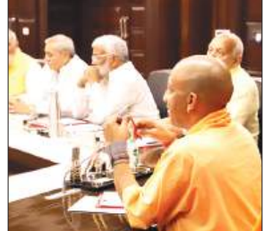
लखनऊ में बैठक लेते मुख्यमंत्री योगी।

जनता के लिए है सरकार, उनकी समस्याएं सख्ती से निपटाएं