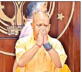
बैठक के दौरान मुख्यमंत्री योगी।

अमृत विचार: मुख्यमंत्री योगी आदित्यनाथ ने शनिवार को लोकभवन में मंत्रिमंडल की विशेष बैठक में सबसे पहले प्रधानमंत्री नरेंद्र मोदी के नेतृत्व में लगातार तीसरी बार केंद्र में सरकार बनने पर बधाई दी। साथ ही, सांसद निर्वाचित होने वाले मंत्रीगणों को बधाई दी। यहां जनसुनवाई को वरीयता देते हुए मुख्यमंत्री ने कहा कि मंत्रिगण हों, अन्य जनप्रतिनिधि हों अथवा अधिकारी, कर्मचारी, हर किसी की यह जिम्मेदारी है कि आईजीआरएस पर प्राप्त आवेदनों का प्राथमिकता के साथ त्वरित निस्तारण किया जाए। इसी क्रम में योगी ने कहा कि आईजीआरएस और सीएम हेल्पलाइन पर आने वाले आवेदनों को लेकर थाना, तहसील और जिला स्तर हो रही प्रगति की मंत्रिगण भी समीक्षा करें। उन्होंने मंत्रिपरिषद की बैठकों के लिए ई-कैबिनेट व्यवस्था और सभी