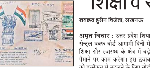
कार्यक्रम में प्रदर्शित ऐतिहासिक सिक्का व डाक टिकट।

अमृत विचार : शान-ए-अवध संस्था की ओर से शनिवार को आशियाना स्थित एक होटल में एंटीक मुद्रा उत्सव की प्रदर्शनी लगाई गई। इसमें सदियों पुराने नोट, सिक्के और डाक टिकट लोगों को दिखाए गए। देश की आजादी के पहले से अब तक की इन धरोहरों पर लोगों की निगाहे टिकी रह गई। प्रदर्शनी में लोगों ने इन ऐतिहासिक चीजों के बारे में जानकारी भी ली। शान-ए-अवध एंटीक मुद्रा उत्सव में विशेष तरह के सिक्के, डाक टिकट, नोट की प्रदर्शनी लगाई गई। शहर में डाक टिकट का संग्रह करने वाले लोगों को सम्मानित किया गया। देश की आजादी से लेकर