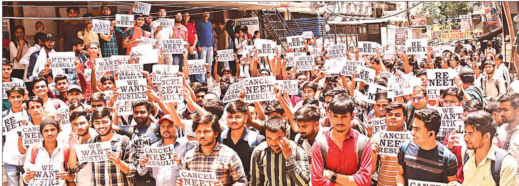
हजरतगंज में प्रताप भवन के बाहर नीट परिणाम के विरोध और दोबारा टेस्ट कराने की मांग को लेकर प्रदर्शन करते अभ्यर्थी।

साईंघाम मंदिर फाउंडेशन ट्रस्ट 4/4, टी.सी.जी., होटल हयात के पास, विभूति खंड, गोमती नगर, लखनऊ-10, 9839163047 / 9956384848