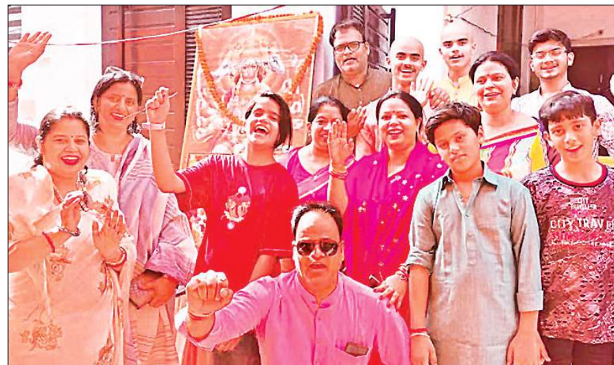
गोमती नगर विपुल खंड में भंडारे के सफल आयोजन के बाद प्रसन्न मुद्रा में आयोजक।