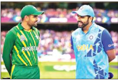
मैच का समय : रात आठ बजे ● नासाउ काउंटी इंटरनेशनल स्टेडियम की पिच की आलोचना के बाद आईसीसी ने इसे स्वीकारा

न्यूयॉर्क, एजेंसी आत्मविश्वास से ओतप्रोत और हालात के अनुकूल ढल चुकी भारतीय टीम नासाउ काउंटी की पंचोदा पिच पर टी-20 विश्व कप के बहुचर्चित मुकाबले में रविवार को चिर प्रतिद्वंद्वी पाकिस्तान से भिड़ेगी जिसका मनोबल पहले ही मैच में मिली अप्रत्याशित हार ने तोड़ दिया है। टूर्नामेंट में सबसे ज्यादा भीड़ खींचने वाला मुकाबला 34000 दर्शक क्षमता वाले नासाउ काउंटी इंटरनेशनल स्टेडियम पर खेला जाएगा। इस मैदान की पिच लगातार चर्चा में बनी हुई है। इसकी भारी आलोचना के बाद आईसीसी ने आधिकारिक रूप से इसे स्वीकार किया। अब तक इस स्टेडियम पर हुए तीन मैचों की छह पारियों में दो बार ही टीमें सौ रन के पार पहुंच सकी है। पूर्व क्रिकेटर्स को तो यह भी लगता है कि कम स्कोर वाले मैचों से कैसे अमेरिकी बाजार में क्रिकेट का प्रचार प्रसार किया जायेगा। एडीलेड ओवल के मैदानकर्मी डेमियन हाउज के मार्गदर्शन में अप्रैल में यहां चार 'ड्रॉप इन' पिचें बिछाई गईं जो अभी तक जम नहीं पाई हैं। पिच से मिल रहा असमान उछाल बल्लेबाजों की सुरक्षा पर सवालिया ऊंगली उठा रहा