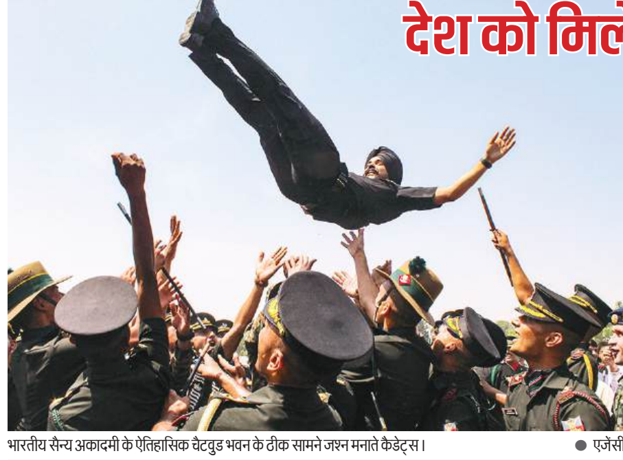
भारतीय सैन्य अकादमी के ऐतिहासिक चेटवुड भवन के टीक सामने जश्न मनाते कैडेट्स।

बाद नये सिरे से जनहित के काम में जुट जाने को उत्साहित करते हुए मंत्रियों को संवाद, समन्वय और संवेदनशीलता का मंत्र देकर जनता के बीच जाने को कहा। उन्होंने कहा है कि सरकार जनता के लिए है, हमारे लिए जनहित सर्वोपरि है, ऐसे में समाज के अंतिम पायदान पर खड़े व्यक्ति की समस्याओं, अपेक्षाओं और आवश्यकताओं का समाधान होना ही चाहिए। जहां भी समस्या हो, मुख्यमंत्री कार्यालय को अवगत कराएंगे।