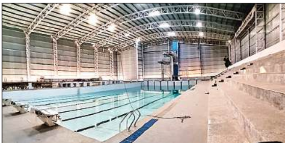
केडी सिंह बाबू स्टेडियम में सूखा पड़ा तरणताल।

विभागीय कर्मचारियों ने बताया कि वर्ष 2005 में इसमें आलवेदर बनाए जाने की घोषणा हुई। उस समय इस पर 2 करोड़ 60 लाख खर्च किया गया। लेकिन टंड के एक भी सीजन में यह तरणताल नहीं खुला।