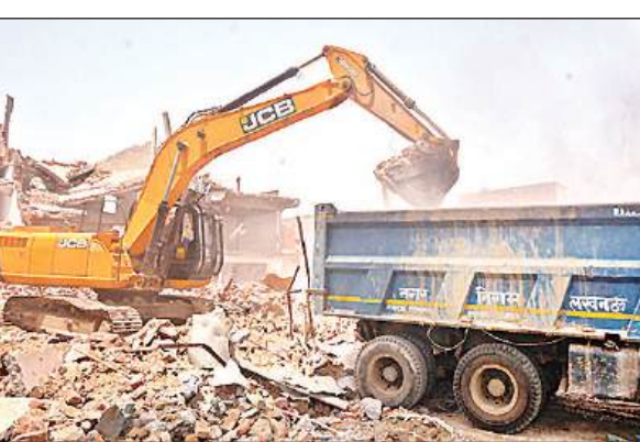
अकबरनगर में पहले ध्वस्त किए गए भवनों का मलबा उठाती पोकलौड। अमृत विचार

एलडीए ने अकबरनगर के 1679 विस्थापितों को बसंतकुंज योजना में आवास का आवंटन पत्र दे दिया है। इसमें से 150 विस्थापितों को मकान पर कब्जा भी मिल चुका है। आवंटनपत्र लेने वाले कई विस्थापित अकबरनगर के आवास खाली नहीं कर रहे हैं। इसके अलावा ज्यादातर विस्थापितों ने आवंटनपत्र नहीं ले रहे थे। एलडीए उपाध्यक्ष डॉ. इन्द्रमणि त्रिपाठी के निर्देश पर एलडीए की टीम ने शनिवार को अकबरनगर