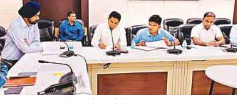
बैठक में नगर निगम अधिकारियों से शहर के नालों की सफाई की जानकारी लेती मंडलायुक्त डॉ. रोशन जैकब। अमृत विचार