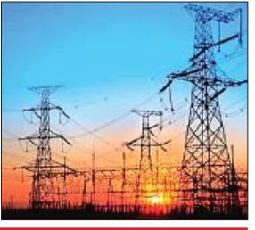
इस बात की चिंता है कि बिजली गुल हुई तो इस रोमांचक मुकाबले का मजा किरकिरा हो जाएगा। दरअसल गर्मी के इस मौसम में राजधानी में बिजली की आवाजाही बढ़ गई है। चटों बिजली गुल होने से लोग परेशान हैं। इसी के चलते कई लोगों ने अपने टेलिविजन का कनेक्शन इनवर्टर से करा दिया है।

केडी सिंह बाबू स्टेडियम के खिलाड़ियों के अनुसार, भारत-पाक मैच भले ही 12 हजार किलोमीटर दूर हो रहा है लेकिन इस मैच के हर पल को यादगार बनाने की तैयारी में शहर के लोग जुटे हैं। दोनों के बीच पिछले वर्ष 14 अक्टूबर को मैच खेला गया था। अहमदाबाद में विश्वकप के दौरान दोनों के बीच मुकाबला हुआ। अब टी-20 विश्वकप में दोनों टीमें एक बार फिर आमने-सामने होंगी। यह मुकाबला रात 8 बजे से खेला जाएगा। सभी को