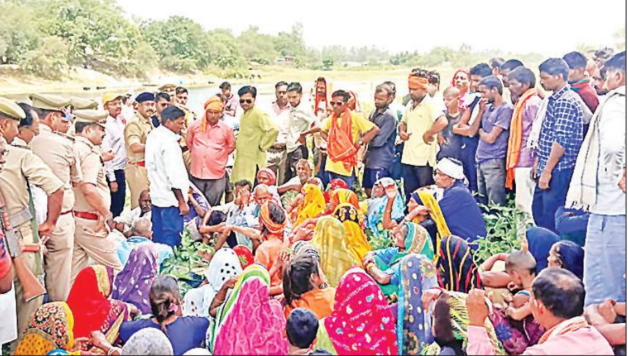
बख्शी का तालाब क्षेत्र में जलसमाधि करने जा रही महिलाओं को रोककर समझाते पुलिसकर्मी। अमृत विचार

अमृत विचार : 22 वर्ष पहले जारी पट्टे की जमीन पर कब्जा न मिलने और संबंधित पत्रावलियां गायब होने से नाराज किसान और महिलाएं शनिवार को गोमती नदी में जल समाधि लेने पर अड़ गए। कुछ महिलाएं नदी में कूद गईं। सूचना पर कई थानों की पुलिस फोर्स, पीएसी और एसडीएम पहुंचे। तत्कालीन अफसरों पर रिपोर्ट दर्ज कराने व पत्रावलियों को लेकर उचित कार्रवाई करने का आश्वासन देकर किसानों व महिलाओं को शांत कराया गया। छह घंटे के हंगामे के बाद किसान व महिलाएं घर जाने को तैयार हुए।