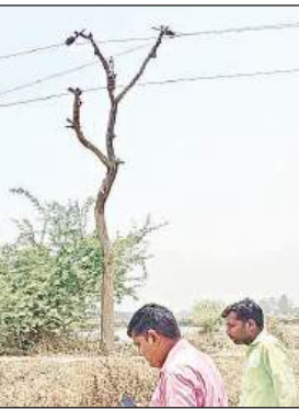
टहनियों पर बंधे इंसुलेटर और हाईटेंशन लाइन।

शनिवार को सोशल मीडिया पर सूखे पेड़ की टहनियों में बंधे तार की फोटो वायरल हुई तो बिजली विभाग की बड़ी लापरवाही सामने आ गई। वहीं, बिजली विभाग के अधिकारी संविदाकर्मीयों की लापरवाही बताकर पल्ला झाड़ रहे हैं। साथ ही पेड़ से तारों को हटा लिया है। यह भी कहा कि परिवार को शासन से मुआवजा दिया जाएगा। मामला मितौली बिजली