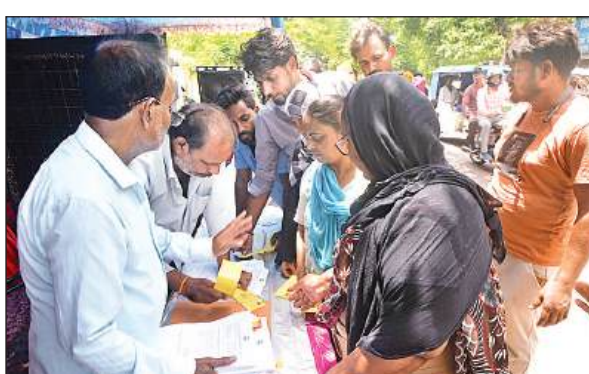
अकबरनगर में लगाए गए लखनऊ विकास प्राधिकरण के शिविर में आवास आवंटन प्रमाणपत्र लेने के लिए लगी भीड़।