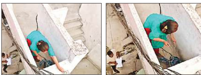
नूरबाड़ी में बिजली विभाग के अभियान के दौरान ड्रोन कैमरे में कैद हुई कटिया उतारती महिला की तस्वीरें। अमृत