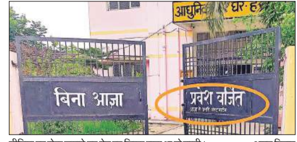
मीडिया पर रोक लगाते हुए गेट पर लिखा रखा था नो-इन्ट्री।