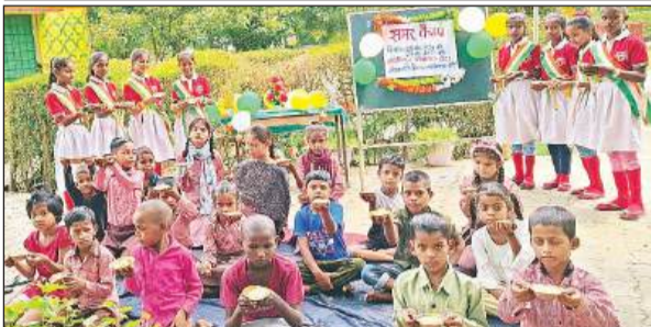
संविलियन विद्यालय बेदा में हलुआ खाकर समर कैप में शामिल हुए छात्र।