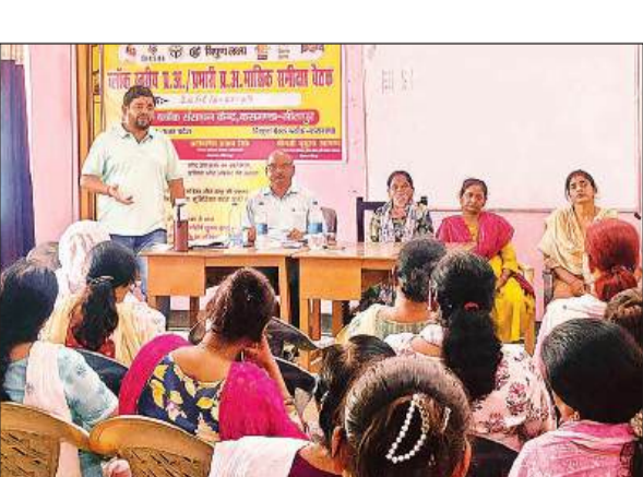
बीआरसी पर प्रधानाध्यापकों के साथ बैठक करते खंड शिक्षा अधिकारी।