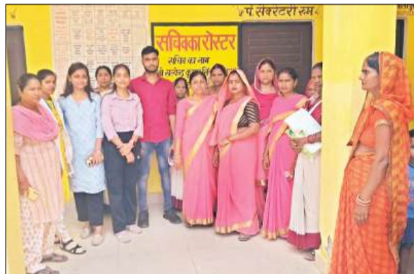
गुलरीपुरवा में सर्वेक्षण के शुरू होने पर मौजूद आशा बहुए व संस्था के पदाधिकारी।

इस मौके पर डेटा संग्रह कर्ताओं ने आंगनबाड़ी केंद्रों में पूर्व शिक्षा