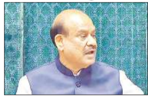
नई दिल्ली, एजेन्सी

लोकसभा में शुक्रवार को नीट-यूजी को लेकर विपक्ष के भारी हंगामे के कारण सदन की कार्यवाही सोमवार तक के लिए स्थगित कर दी गई। इससे पहले इसी मुद्दे पर विपक्षी सदस्यों के हंगामे के कारण सदन की कार्यवाही दोपहर 12 बजे तक स्थगित की गई थी। दोपहर 12 बजे सदन की