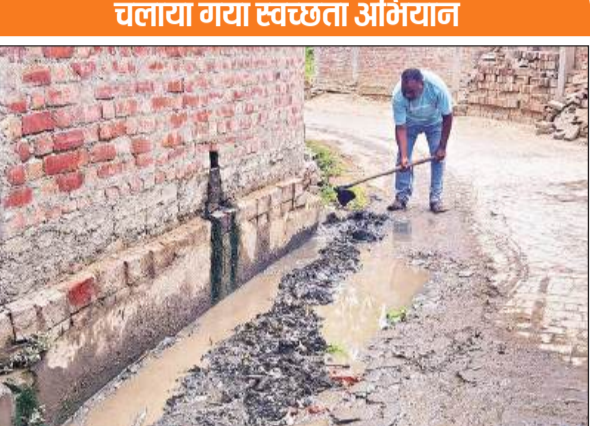
थाना नैमिषारण्य को जाने वाले मुख्य मार्ग पर सफाई करता सफाईकर्मी।