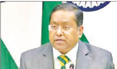
विदेश मंत्रालय के प्रवक्ता रणधीर जायसवाल।

यह प्रक्रिया अपने आप में आरोप-प्रत्यारोप, गलतबयानी, तथ्यों के चयनात्मक उपयोग, पक्षपातपूर्ण स्रोतों पर निर्भरता और मुद्दों को एकरतर्फा तरीके से पेश करने का मिश्रण है। विदेश मंत्रालय के प्रवक्ता ने कहा इसने पूर्वाग्रह आधारित विचार को आगे बढ़ाने के लिए चुनिंदा घटनाओं को चुना है। कुछ मामलों में, रिपोर्ट में कानूनों और नियमों की वैधता पर ही सवाल उठाए गए हैं। जायसवाल ने कहा कि ऐसा प्रतीत होता है कि रिपोर्ट में भारतीय अदालतों द्वारा दिए गए कुछ फैसलों की ईमानदारी को भी चुनौती दी गई है।