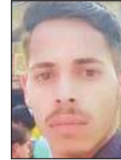
ललू (फाइल फोटो)