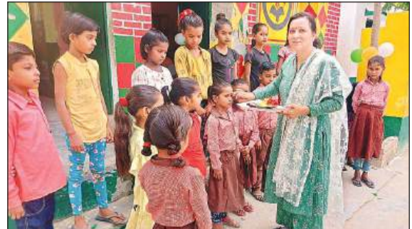
स्कूल आने वाले बच्चों का स्वागत करती शिक्षिका।