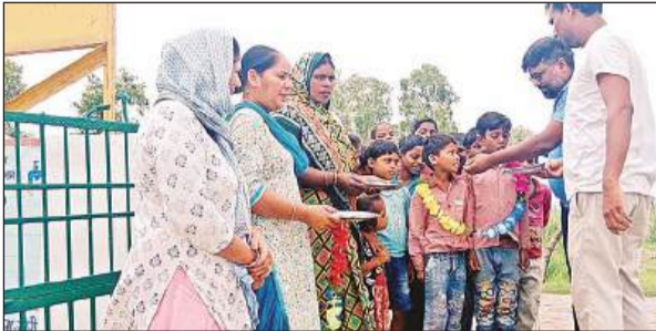
प्राथमिक विद्यालय पड़ुवा में गेट पर माला पहनाकर छात्र का स्वागत करते शिक्षक।

अमृत विचार: गर्मी की छुट्टी के 38 दिन बाद शुक्रवार को बेसिक स्कूल खुल गए। स्कूलों में पहले दिन का माहौल उत्सव सा रहा। शिक्षकों ने बच्चों को टीका कर स्वागत किया। इसके बाद शिक्षकों ने बच्चों को खीर और हलवा खिलाकर मुंह मीठा कराया। समर कैप आयोजित कर बच्चों को पेड़ पौधों की उपयोगिता बताकर पौधरोपण कराकर देखभाल करने का संकल्प दिलाया। उधर, मिश्राना के परिषदीय स्कूल की प्रधानाचार्य स्कूल ही नहीं पहुंची। विद्यालय में शिक्षामित्र के अलावा एक छात्र पहुंचा। शासन के निर्देश पर शुक्रवार को स्कूलों में उत्सव जैसा माहौल रहा। कुछ शिक्षकों ने विद्यालय को अच्छी तरह सजाया संवारा और बच्चों के पहुंचने पर उनका तिलक कर स्वागत किया।