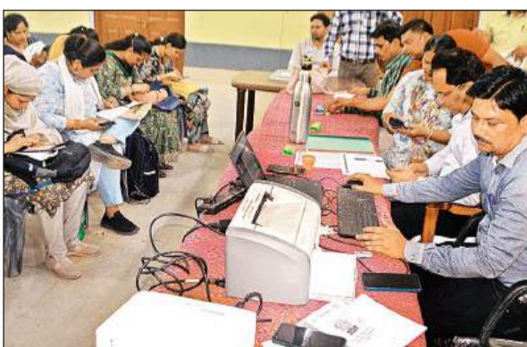
काउंसलिंग कराते अभ्यर्थी।

भेजा था और अब दोबारा की गई कार्रवाई में फिर उसे सण्डीला भेज दिया। इस तरह की कार्रवाई फिलहाल सरकारी विभागों के अधिकारियों व कर्मचारियों के भी गले नहीं उतर रही है। कार्रवाई के बाद अब और भी बातें खुल कर सामने आ रहें हैं। जैसा कि कहा जा रहा है कि पोस्टमार्टम हाउस