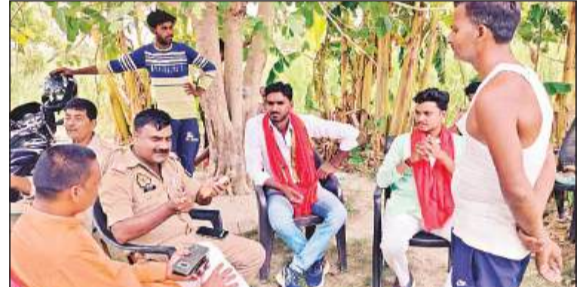
मूर्ति खंडित होने के बाद मौजूद पुलिस व ग्रामीण।