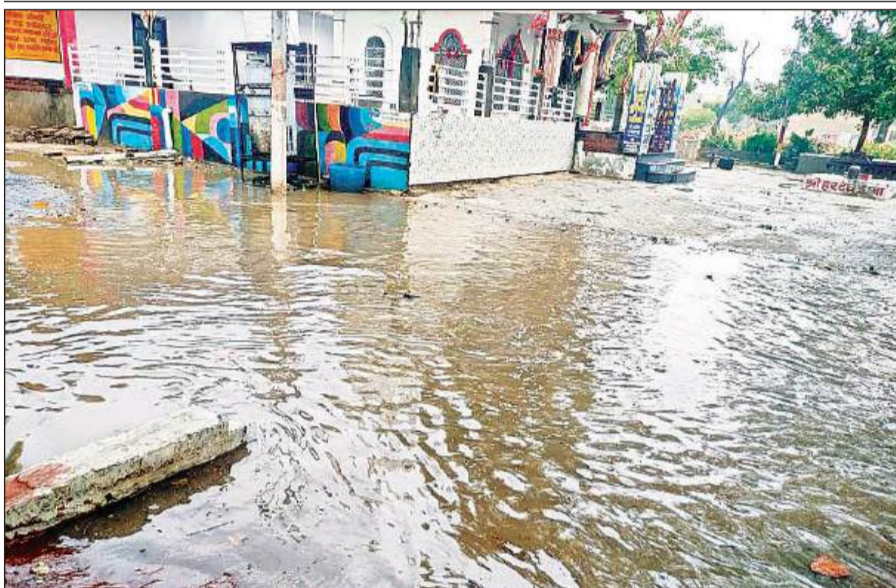
मल्लावां में झमाझम बारिश के बाद मकान के सामने सड़क पर भरा पानी।