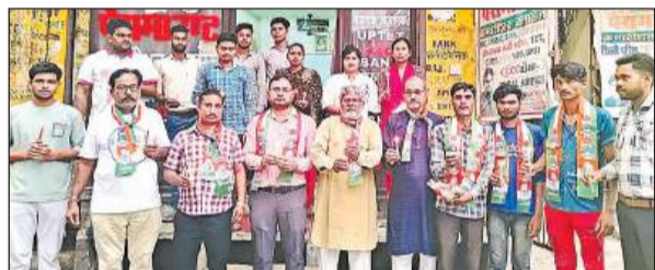
प्रतियोगी परीक्षाओं की तैयारी कर रहे छात्रों के साथ कांग्रेसी नेता।