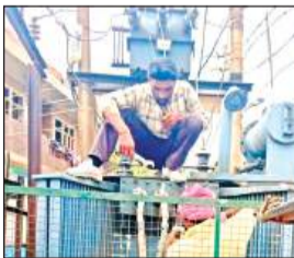
ट्रांसफार्मर की मरम्मत करता बिजलीकर्मि।

नगर के राधे नगर में 63 केवीए का ट्रांसफार्मर गुरुवार को फुंक गया था। जिसे विभाग ने बदला और क्षेत्र की आपूर्ति चालू की, कुछ देर आपूर्ति होने के बाद दोबारा ट्रांसफार्मर में खराबी आ गई। जिसकी जानकारी बिजली विभाग को दी गई। सूचना पर पहुंचे बिजली कर्मियों ने जांच की। जहां ट्रांसफार्मर फुंका होने पर शुक्रवार देर शाम