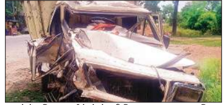
हादसे में क्षतिग्रस्त हुई केले से भरी पिकअप। अमृत विचार