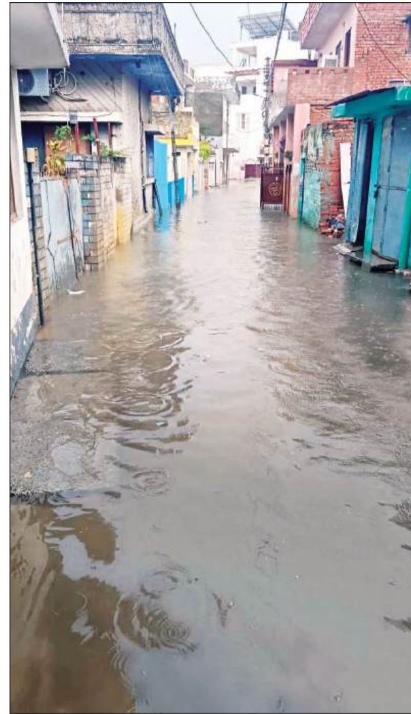
बारिश से सड़क हुई जलमग्न।

मल्लावां, हरदोई, अमृत विचार। तेज बारिश में जहां निम्बी तालाब के पास सड़क पर पानी भर जाने से घरों में पानी घुस गया, इसके अलावा राहगीरों को समस्याओं का सामना करना पड़ा। शुक्रवार को गर्मी से जहां लोग परेशान थे, ऐसे में करीब 15 मिनट की बारिश से गंगारामपुर निम्बी तालाब के पास घरों में पानी घुसने से मुसीबत का सामना करना पड़ा। स्मरण रहे कि अभी हाल ही में निम्बी तालाब पर मिट्टी डालकर पाटा जा रहा था लेकिन नगर पालिका प्रशासन की मुस्तेदी के चलते तालाब को पटने से बचाया गया। बारिश में सड़क पर पानी भरने से राहगीरों को भी दिक्कतें उठानी पड़ी।