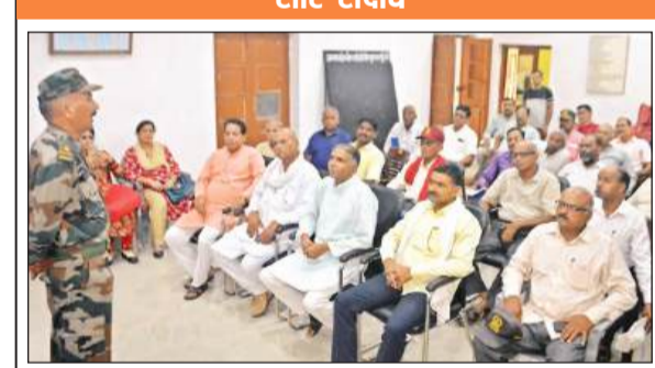
पूर्व सैनिकों को जानकारी देते अधिकारी।