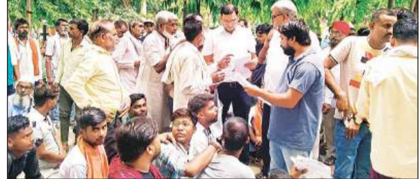
अधिकारियों को शपथ पत्र देते किसान।

पूर्व निर्धारित कार्यक्रम के तहत शुक्रवार को लखनऊ से आवास