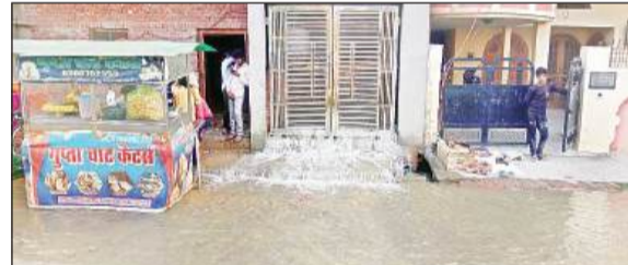
सड़क पर हुआ जलभराव।