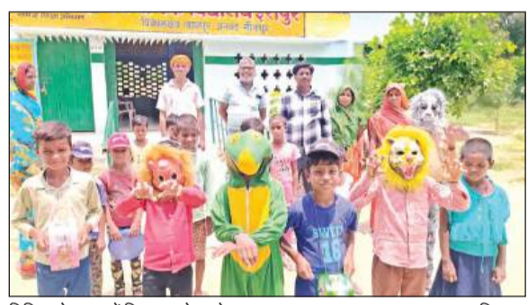
विभिन्न देशभूषा में विद्यालय के बच्चे।

लहरपुर सीतापुर, अमृत विचार। अवकाश के उपरांत शुरुवार को पहले दिन विद्यालय खुलने पर छात्रों में काफी उत्साह देखने को मिला। विद्यालयों को गुब्बारों और रंगीन झंडियों से सजाया गया था। शिक्षकों ने टीका लगा कर तथा माला पहनाकर बच्चों का स्वागत किया। विद्यालयों में समर कैप का भी आयोजन किया गया जिसमें बच्चों ने निकटतम दर्शनीय स्थल का भ्रमण किया व सांस्कृतिक कार्यक्रम की प्रस्तुति, नुककड नाटक, चित्र कला तथा अपनी पसंद के खेलों में प्रतिभाग किया। प्राथमिक विद्यालय ईरापुर में छात्रों ने गांव के धार्मिक स्थल जगदा बबा मंदिर का भ्रमण किया। जंगल में मंगल रोल प्ले के माध्यम से बच्चों को पर्यावरण के प्रति जागरूक किया गया। पहले दिन बच्चों को हलवा वितरित किया गया। नवाबनगर में छात्रों को टीका लगा कर स्वागत किया। जूनियर हाईस्कूल मरिजदया और डिंगुरापुर में छात्रों को पर्यावरण संरक्षण के प्रति संवेदनशील बनाने के लिए नुककड नाटक आयोजित किया गया। जूनियर हाईस्कूल मानपुर तथा प्राथमिक विद्यालय नौवापुर एवं शाहाबाद में भी समर कैप में विभिन्न गतिविधियों के माध्यम से छात्रों को पर्यावरण संरक्षण के प्रति जागरूक किया गया और छात्रों को खीर, हलवा व मिष्ठान का वितरण किया गया।