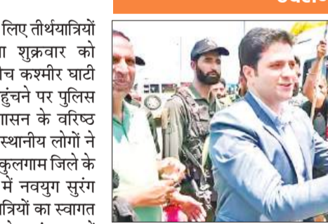
आधार शिविर में पहुंचे तीर्थयात्रियों का स्वागत करते अधिकारी।

महादेव के जयकारों के बीच जम्मू-कश्मीर के उपराज्यपाल मनोज सिन्हा ने शुक्रवार को अमरनाथ यात्रा के लिए भगवती नगर स्थित यात्री निवास आधार शिविर से 4,603 तीर्थयात्रियों के पहले जत्थे को रवाना किया। उपराज्यपाल मनोज सिन्हा ने तीर्थयात्रियों को सुरक्षित यात्रा की कामना की। उन्होंने कहा कि बाबा अमरनाथ यात्री निवास आधार शिविर से खुशी और समृद्धि लाए।