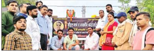
कैडल जलाकर श्रद्धांजलि देते शुक्लागंज के पत्रकार।