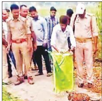
भगतपुर में शावक को पकड़ने का प्रयास करते वनकर्मी।