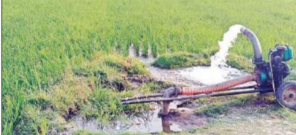
साठा धान की पॉपसेट चलाकर सिंचाई करते किसान।

अमृत विचार: एनजीटी ने जिले में साठा धान की बुआई पर प्रतिबंध लगा दिया है। मगर, जिले में करीब 32 हजार हेक्टेयर में साठा धान तैयार होने की कगार पर है। एनजीटी का आदेश जारी होने के बाद विभागीय अधिकारी भी असमंजस में हैं। विभागीय लोग बताते हैं कि साठा धान की बोआई न करने के लिए किसानों को पहले भी जागरूक किया जाता रहा है, जिससे वह इसकी जगह पर कम लागत और अधिक मुनाफा वाली दलहन-फसलों की बुआई करें। जिले में एक लाख 82 हजार 27