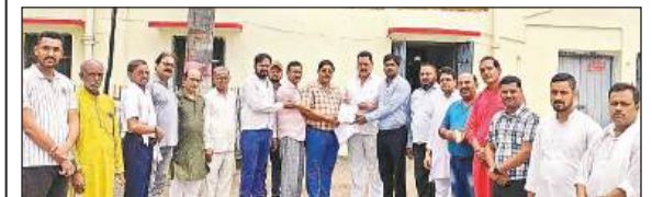
रेलवे स्टेशन अधीक्षक पलिया को ज्ञापन देते नगर व्यापार मंडल के पदाधिकारी।

व्यापार मंडल ने प्रधानमंत्री व रेल मंत्री को संबोधित ज्ञापन सौंपा