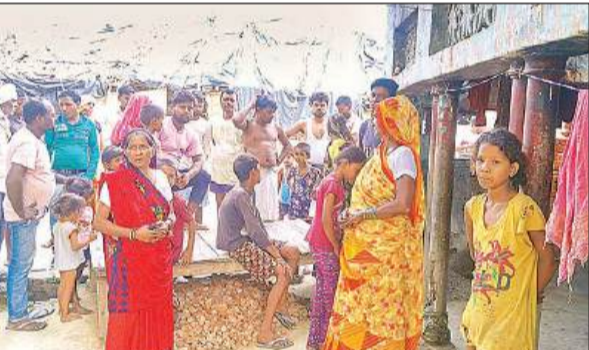
अधेड़ के घर के बाहर मौजूद लोग।

इमलिया सुल्तानपुर थाने की काजीकमालपुर चौकी क्षेत्र में बीती रात हरगांव-महोली रोड पर रामेश्वरपुर पुलिस के पास किसी अज्ञात वाहन ने एक 50 वर्षीय अधेड़ को टक्कर मार दी और उसे रौंदते हुए वहां से फरार हो गया।