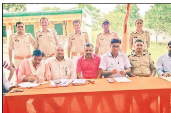
खुली बैठक के दौरान मौजूद अधिकारी व पुलिस बल।