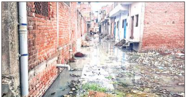
कृष्णा नगर गली में भरा गया पानी।

अमृत विचार। पालिका के वार्ड 11 कृष्णा नगर मोहल्ले में सालों से जलनिकासी का समस्या बनी हुई है। जिस कारण बिना बारिश के भी कृष्णा नगर में हमेशा जलभराव बना रहता है। क्षेत्रीय लोगों ने जिलाधिकारी से लेकर शासन-प्रशासन से जल निकासी से निजात दिलाने की मांग की है, इसके बावजूद किसी ने इस ओर ध्यान नहीं दिया। जिस पर शुक्रवार को क्षेत्रीय लोग पालिका पहुंचे और जमकर हंगामा काटते हुये नारेबाजी की। वहीं पालिका का दावा है कि गली ऊंची करके जल्द बनवाई जायेगी। फोरलेन का नाला ऊंचा बना होने के कारण कचन नगर, आदर्श नगर, कृष्णा नगर, सर्वोदय नगर आदि मोहल्लों का पानी नाले में नहीं पहुंच पाता है। जिस कारण इन