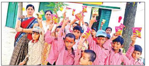
उपहार पाकर खुशी मनाते बच्चे।

शासन के निर्देश पर शुक्रवार को परिषदीय विद्यालय खुले। पहले दिन स्कूल खुलने पर सिकंदरपुर कर्ण और सरोसी ब्लॉक के प्राथमिक व उच्च प्राथमिक विद्यालयों को प्रधान शिक्षक-शिक्षिकाओं ने झारल और पन्नी से सजाया। सरोसी ब्लॉक के सरैयां प्राथमिक विद्यालय में सुबह जैसे ही स्कूल खुला। बच्चे स्कूल