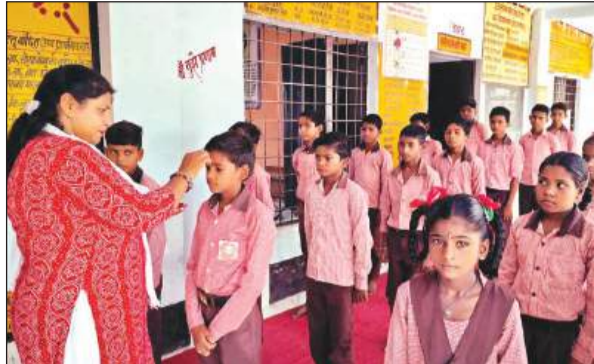
स्कूल में बच्चों का तिलक लगाकर स्वागत करती अध्यापिका व सजकर तैयार स्कूल में मौजूद छात्र व टीचर।

भीषण गर्मी के चलते शासन ने सभी विद्यालयों में अवकाश घोषित किया था। करीब एक माह तक सभी