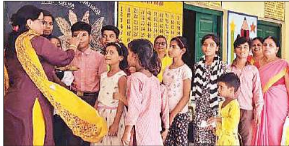
कंपोजिट विद्यालय महराजनगर में छात्रों को तिलक करती प्रधानाध्यापिका।