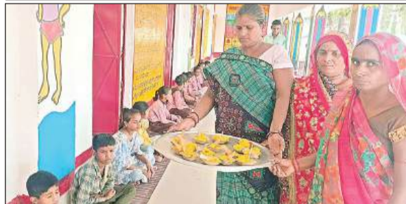
बच्चों को हलुआ वितरित करती रसोईयां।