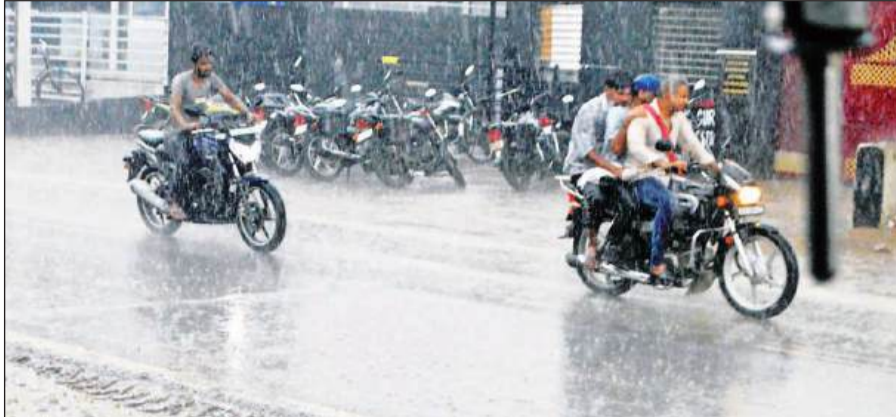
शुक्रवार को झमाझम बारिश में जाते लोग।

इस दौरान सड़कों पर खामोशी का मंजर पसर गया। दोपहिया वाहनों से लेकर चार पहिया वाहनों की रफ्तार थम गई। हालांकि इस बारिश के चलते शहर की गलियां तालाब के रूप में नजर आईं। वहीं शहर के विभिन्न चौराहों पर भी जलभराव के हालात बने। इस बारिश का लुप्त लोगों ने खुले भाग से लेकर छतों पर जाकर उठाया। झमाझम हुई बारिश से तापमान काफी नीचे आ गया और भीषण गर्मी और उमस से बिलबिलाए लोगों को राहत का एहसास हुआ।