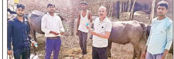
टीका लगाने पशु विभाग की टीम।