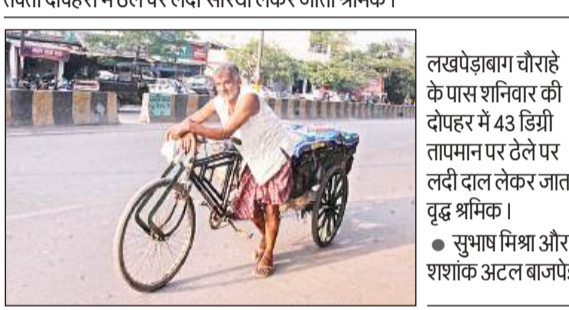
लखपेड़ाबाग चौराहे के पास शनिवार की दोपहर में 43 डिट्री तापमान पर टेले पर लदी दाल लेकर जाता वृद्ध श्रमिक।