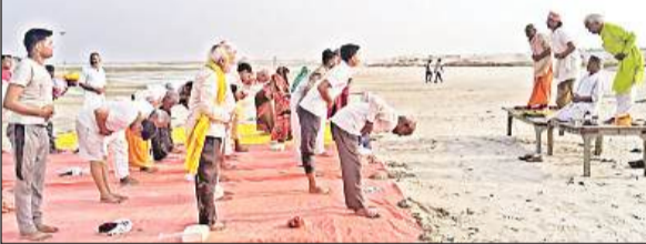
गंगा तट पर लगे योग और आयुर्वेद चिकित्सा परामर्श शिविर में मौजूद लोग।