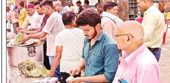
भंडारे में प्रसाद गृहण करते श्रद्धालु।