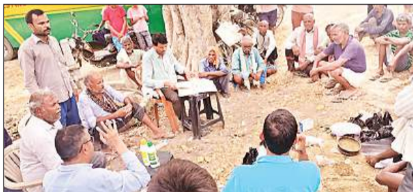
राही ब्लॉक के बसाढ़ में मिट्टी का नमूना लेते इफको के कर्मचारी।

इस दौरान किसान सभा के माध्यम से उसके परिणाम की जानकारी के हर पहलू पर किसानों को विस्तार से बताया गया। साथ ही नैनो यूरिया, नैनो डीएपी और