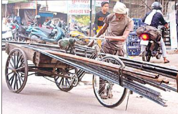
तापती दोपहरी में टेले पर लदी सरिया लेकर जाता श्रमिक।