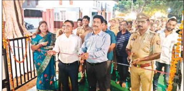
दिनेश वाटिका का उद्घाटन करते डीएम और एस्पपी।