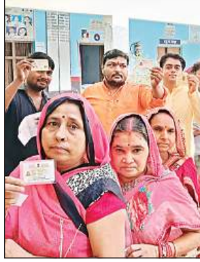
मतदाताओं की कतार। फाइल फोटो

लोकसभा चुनाव में मत प्रतिशत को लेकर बाराबंकी का अब तक का इतिहास अच्छा नहीं था। इसे जिलाधिकारी सत्येंद्र कुमार ने कार्ययोजनाएं तैयार कीं जिसमें