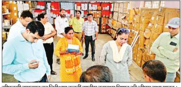
सीएचसी रामनगर का निरीक्षण करती राष्ट्रीय स्वास्थ्य मिशन की जीएम सुधा यादव।

टीम के साथ जीएम सुबह करीब साढ़े 10 बजे सीएचसी पहुंचीं। उन्होंने अस्पताल परिसर का भ्रमण कर इमरजेंसी वार्ड, ओपीडी, स्टॉक रूम, पब्लिक हेल्थ केयर सेंटर, प्रसव कक्ष आदि का निरीक्षण किया। अस्पताल में मौजूद मरीजों से मिलने