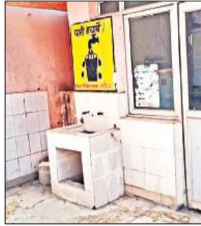
जिला अस्पताल परिसर में खराब पड़ा आरओ।

अयोध्या। जिला अस्पताल में पेयजल की बड़ी परेशानी है। अस्पताल परिसर में लगे आरओ कई दिन से खराब पड़े हुए हैं। लोगों को पानी भरने के लिए बाहर ही जाना पड़ता है। अस्पताल प्रशासन इसकी सुधि ही नहीं ले रहा है। नए भवन के पास लगा आरओ कई दिनों से नहीं चल रहा है। इमरजेंसी वार्ड के बगल दान में मिला आरओ भी पानी नहीं दे रहा है। एचआईवी टेस्ट कक्ष के सामने लगे आरओ में पांच टोटियां लगी हुई हैं, जिसमें तीन खराब हैं। दो में कभी-कभी ही पानी आता है। वह भी गर्म। इसके अलावा परिसर में ऑक्सिजन प्लांट के निकट व ओपीडी परिसर में लगा हैंडपंप भी कई दिनों से खराब है।