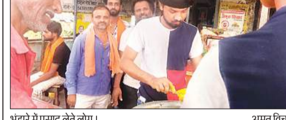
भंडारे में प्रसाद लेते लोग।