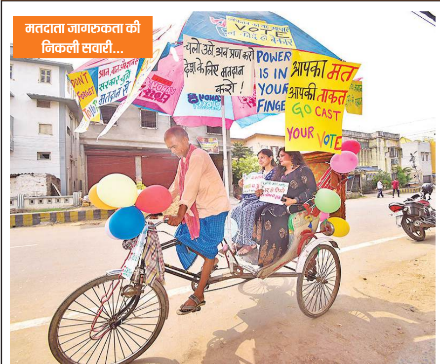
लोकसभा चुनाव के सातवें और आखिरी चरण के मतदान के दौरान शनिवार को पटना में मतदाता जागरूकता संबंधी नारे लिखे रिशे पर सवार होकर जाती युवतियां।