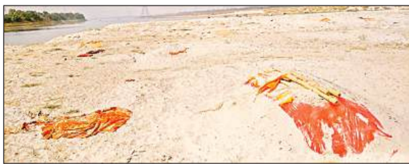
ऊंचाहार के गोकना में गंगा की रेत में दफनाए गए शव।

हालांकि प्रशासन इसे स्वीकार नहीं कर रहा है। विगत दस दिनों से भीषण गर्मी से ऊंचाहार का जनजीवन बेहाल है। दो दिन पहले 47 डिग्री तापमान रिकार्ड किया गया था। अब भी तापमान 45 के आसपास बना हुआ है। गोकना गंगा घाट पर इस समय प्रतिदिन औसतन 30 शव अंतिम संस्कार