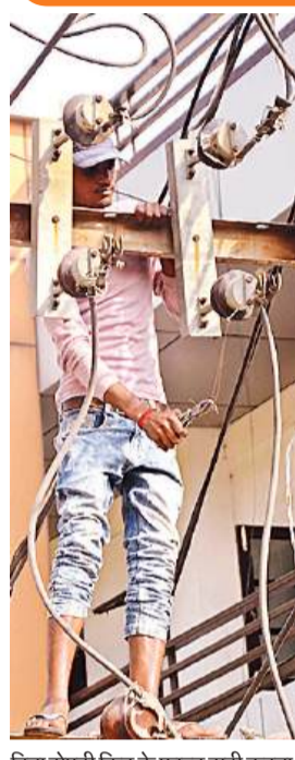
बिना सेप्टी किट के फाल्ट सही करता बिजलीकर्म।