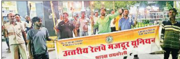
मशाल लेकर जुलूस प्रदर्शन करते यूआरएमयू के अधिकारी।