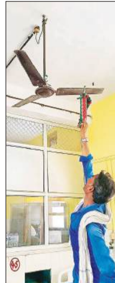
डेगू वार्ड में जाम पड़े पंखे को धुमाने की कोशिश करता तीमारदार।

श्रीराम अस्पताल में 24 घंटे में डायरिया के 24 मरीज भर्ती