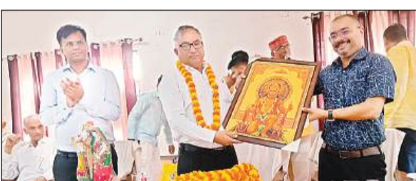
सेवानिवृत्त नायब तहसीलदार को सम्मानित करते एसडीएम।