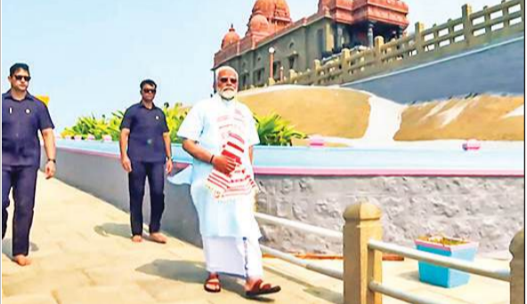
प्रधानमंत्री नरेन्द्र मोदी शनिवार को कन्याकुमारी में तिरुवल्लुवर प्रतिमा पर श्रद्धांजलि देने पहुंचे।

ध्यान सत्र के समापन पर, सफेद वस्त्र पहने मोदी ने स्मारक के बगल में स्थित उस परिसर का दौरा किया, जहां तिरुवल्लुवर की 133 फुट ऊंची प्रतिमा स्थित है और वहां एक विशाल माला चढ़ाई। वह नौका द्वारा प्रतिमा परिसर गए और बाद में वह तट पर पहुंचे। प्रधानमंत्री हेलीकॉप्टर से तिरुवनंतपुरम पहुंचे और वहां से दिल्ली के लिए रवाना हुए। मोदी ने 30 मई को यहां पहुंचने पर भगवती अम्मन मंदिर में पूजा-