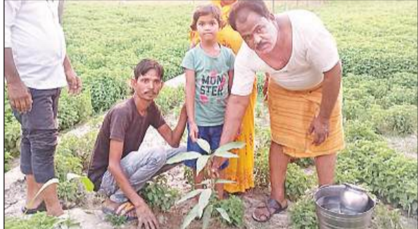
जन्मदिन पर पौधा रोपित करती बालिका।