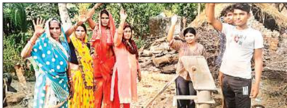
गांव में हैंडपंप खराब होने से प्रदर्शन करते ग्रामीण।