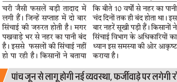
ई-ग्राम स्वराज पोर्टल।

प्रधान और सचिव डोंगल के जरिए सामग्री उपलब्ध कराने वाली फर्म को भुगतान करते हैं। इस भुगतान राशि का जिक्र पोर्टल पर तो किया जाता है लेकिन बिल व वाउचर अपलोड करने की अनिवार्यता नहीं है। इसके चलते इस धनराशि से ग्राम पंचायतों में करार जाने वाले