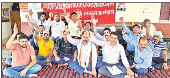
रेलवे स्टेशन पर धरना-प्रदर्शन करते लोको पायलट व रेलकर्मों। अमृत विचार

प्रशासन के द्वारा सुलतानपुर में कार्यरत समस्त लोको पायलट का मुख्यालय बंद करने की बात प्रशासन के द्वारा की जा रही है। जो लोको पायलट के हित में नहीं है