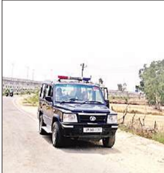
हलियापुर में शव मिलने की सूचना पर घटनास्थल पर पहुंची पुलिस।