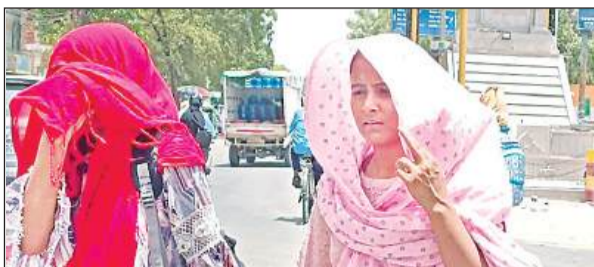
घूप से बचाव करती युवतियां।

अमृत विचार। बीते समय से पड़ रही भीषण गर्मी से जहां आमजन परेशान है। वहीं बिजली विभाग की उदासीनता लोगों का चैन और सुकून छीन रही है। जिले में लगातार तापमान में बढ़ोत्तरी जारी है। फिलहाल लगातार बढ़ रही गर्मी से अभी कोई राहत मिलने की उम्मीद नजर नहीं आ रही है। ऐसे में जहां लोगों का बाहर निकलना दूबर है वहीं बिजली के गुल होने की समस्या और मुसीबत बनी रहती है। विभाग से लेकर प्रदेश के मुखिया तक बिजली व्यवस्था को दुरुस्त रखने के निर्देश जिम्मेदार अधिकारियों को दे रखा है। लेकिन अधिकारियों की सुस्ती और उदासीनता इस समय आम आदमी के लिए मुसीबत बनकर खड़ी है। आदमी दिन भर परेशानी झेलकर जब घर जाता है फिर भी उसे राहत नहीं मिल पा रही है। लालगंज उपकेंद्र के बेहटा फौंडर के सेमरपहा गांव में रखे ट्रांसफार्मर में आई तकनीकी समस्या