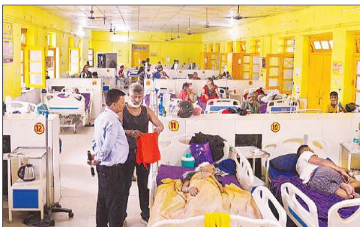
मेडिकल वॉर्ड के हर बेड पर भर्ती हैं मरीज।

▶▶ पंखे खराब, कूलर फेंक रहा गर्म हवा, मरीज परेशान