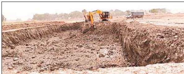
ऊंचाहार में किया जा रहा खनन।

गंगा एक्सप्रेस वे ऊंचाहार सलोन मार्ग को उमरन बाजार के पास क्रॉस करती है। इस समय उमरन बाजार के पास खनन का काम चल रहा है। खनन का काम कृष्णा कांस्ट्रक्शन नाम की कंपनी कर रही है। कंपनी ने जिला प्रशासन से थोड़ी जमीन में दो