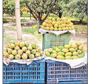
एक दुकान में सजे आम।

अमृत विचार : समय से पहले बाजारों में आम बिकने लगा है। इसे कैल्शियम कार्बाइड से पकाया गया है। इसे खाने से आपकी सेहत बिगड़ सकती है। विशेषज्ञों के मुताबिक सही वक्त आने पर प्राकृतिक रूप से पके आम खाना ही सेहत के लिए ठीक है। फलों के राजा आम के आने में अब भी तकरीबन 15 दिन का समय बाकी है। ऐसे में दुकानदारों को कमाई का लालच, जिले में कार्बाइड से आम पकाने के धंधे को रफ्तार दे रहा है। बाजारों में बिना मौसम पके आम लोगों को आकर्षित कर रहे हैं। बागवानों और फल व्यापारियों के