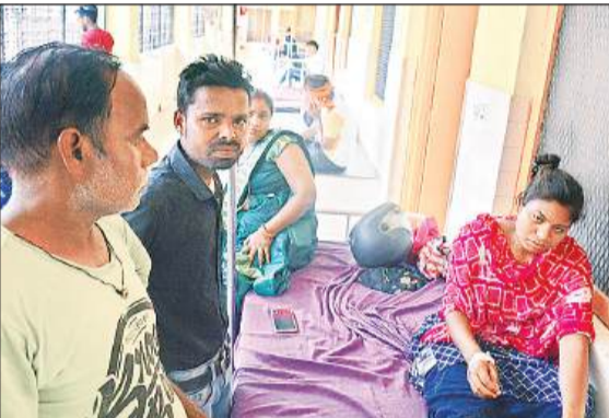
जिला अस्पताल के मेडिकल वार्ड के बाहर बरामदे में भर्ती मरीज।