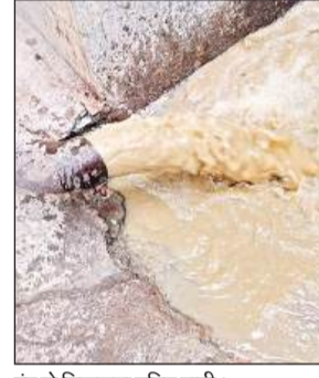
पंप से निकलता दूषित पानी।