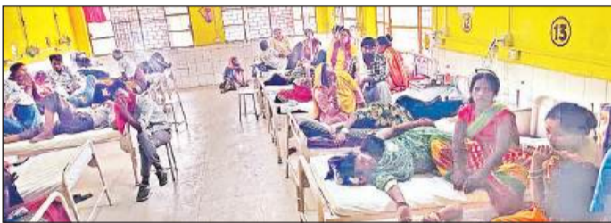
श्रीराम अस्पताल के मेडिकल वार्ड में भर्ती मरीज।