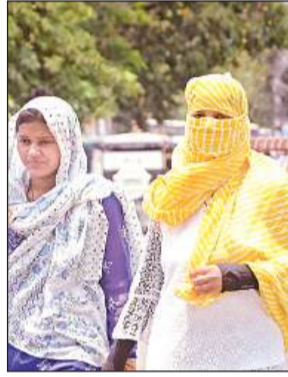
शुभ से बचने के लिए सिर व चेहरा ढककर निकलीं युवतियां। अमृत विचार

हिस्सों में हर आधे घंटे के बाद ट्रिपिंग होने से लोगों का जीवन अस्त-व्यस्त रहा। भीषण गर्मी और लू की वजह से चार मौतें पहले ही हो चुकी हैं। अब तक भीषण गर्मी की वजह से मौतों की संख्या बढ़कर पांच हो गई है।