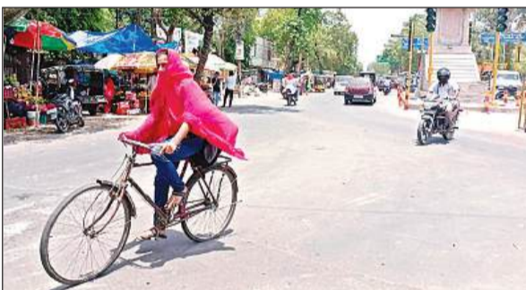
कुछ इस तरह घूप से बचाव करते नजर आ रहे लोग।

विगत वर्षों में सूर्य का पारा 40 से 48 के आसपास ही रहता था। जबकि इस बार ज्येष्ठ के शुरुआत से ही 45 से आगे निकल कर 50 के ऊपर हिचकोले खा रहा है। ऐसे में मनुष्य क्या पशु-पक्षी भी व्याकुल हैं। उस पर गर्मी से बचने का एक मात्र सहारा बिजली उपकरणों का उपयोग ही है, किन्तु बिजली की अधोषिक्त कटौती सूर्य की तपिस बढ़ाने में सहयोग कर रही है। जिसके कारण आम आदमी को राहत नहीं मिल रही है। सुबह जैसे ही 10 बजते हैं सूर्य की किरणें खुले में निकलने पर त्वचा का झूलसाने लगती हैं। ऐसे में घर से बाहर निकलना मुश्किल सा हो गया है। शहरों में कंक्रीट के बने जंगलों में