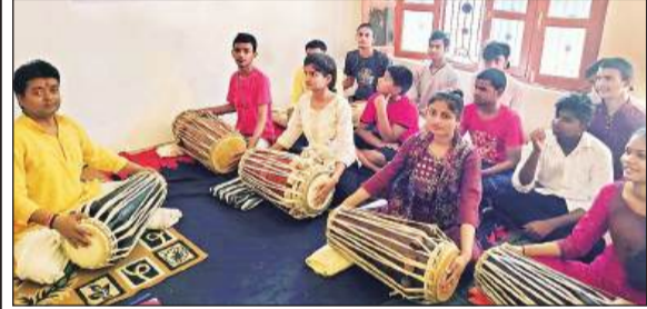
पखावज कार्यशाला में मौजूद छात्र-छात्राएं।