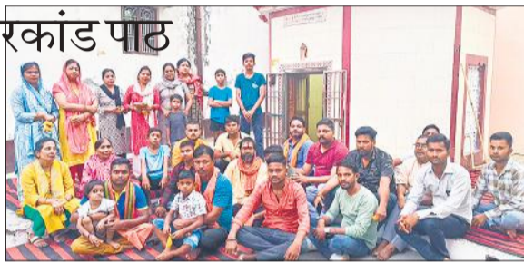
पकड़िया नाथ महादेव मंदिर पर सुंदरकांड पाठ करते भक्त।