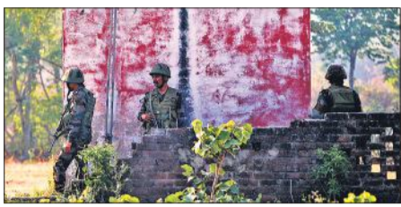
कटुआ के सैदा सुखल गांव में मोर्चा सभाले जवान।

जम्मू-कश्मीर के कटुआ जिले के एक सीमावर्ती गांव में छिपे दूसरे आतंकीवादी को भी सुरक्षा बलों ने 15 घंटे से अधिक समय तक चले अभियान में बुधवार को मार गिराया। इससे पहले मंगलवार रात एक आतंकीवादी मारा गया था।