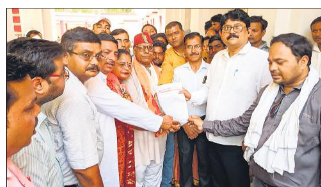
एडीएम को ज्ञापन सौंपते कार्यकर्ता।