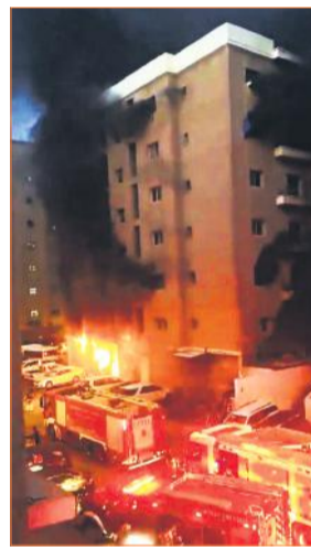
कुवैत के मंगफ क्षेत्र स्थित छह मंजिला इमारत में आग लगने के बाद मौके पर आग बुझाने में लगी फायर ब्रिगेड की गाड़ियां।

दक्षिणी कुवैत में विदेशी मजदूरों वाली एक बहुमंजिला इमारत में भीषण आग लगने से 49 लोगों की मौत हो गई और 50 से अधिक घायल हो गए। मरने वालों में 40 से अधिक भारतीय हैं। बाकि पाकिस्तान, फिलीपिन, मिश्र, नेपाल के नागरिक थे। लोगों की मौत धुएं से दम घुटने के कारण तब हुई जब वे सोए हुए थे। आग कुवैत के दक्षिणी अहमदी गवर्नट के मंगफ क्षेत्र में अल मंगफ नामक छह मंजिला इमारत की रसोई में लगी। इमारत में एक ही कंपनी के 195 मजदूर रहते थे। बचाव अभियान के दौरान पांच अग्निशमन कर्मी भी घायल हो गए। कुवैत के गृह मंत्रालय के सामान्य