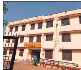
केजीएन कॉलोनी के पीछे की तरफ बना शेल्टर होम का भवन।

तहसील बीसलपुर क्षेत्र में बीते कई सालों से खनन के धंधेबाज यहां पनपते रहे हैं। करीब चार साल पहले बड़ी कारवाई भी हुई थी। शासन स्तर पर भी मामला पहुंचा लेकिन बाद में कारवाई मुकाम हासिल नहीं कर सकी थी। उस वक्त जिम्मेदारों पर साठगांठ के भी आरोप लगे थे। खैर, उसके बाद भी लगातार खनन से जुड़ी सूचनाएं पहुंचती रहती है। मगर कारवाई नाममात्र ही रहती है। इन