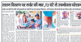
राशन वितरण पर सर्वे की गई 72 घंटे से उपभोक्ता परेशान

ऐसे राशन कार्ड धारकों को किन्हीं कारणों से आधार प्रमाणीकरण के माध्यम से आधार लेने से वंचित रहते हैं तो उन्हें