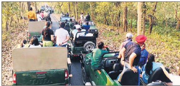
पीटीआर में जंगल सफारी का लुफ लेते पर्यटक।

तराई की तलहटी में बसे पीलीभीत टाइगर रिजर्व का पर्यटन सत्र हर साल 15 नवंबर से 15 जून तक छह माह के लिए संचालित किया जाता है। बाघों की बढ़ती संख्या और जैवविविधता के दम पर पीलीभीत टाइगर रिजर्व देश में ही नहीं बल्कि विदेशों में भी अपनी पहचान बनाता नजर आ रहा है। इको टूरिज्म स्पॉट चूका बीच, बाघों एवं अन्य वन्यजीवों का दीदार करने और प्रकृति को करीब से निहारने के लिए यहां देश के कोने-कोने से बड़ी संख्या सैलानी पहुंच रहे हैं। पीटीआर में पहुंचने वाले सैलानी जंगल की हरी-भरी वादियों के बीच बसे