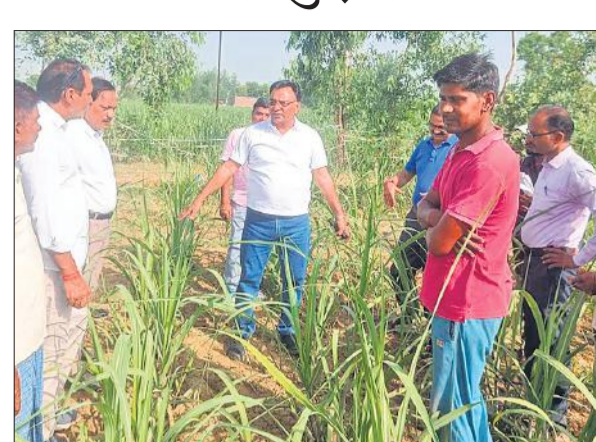
निरिक्षण के दौरान किसानों से वार्ता करते अधिकारी।