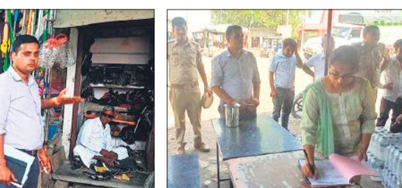
बाल श्रमिक मुक्त कराए जाने के बाद लिखापट्टी करती श्रम प्रवर्तन अधिकारी।