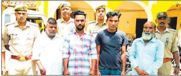
पुलिस हिरासत में पकड़े गए आरोपी।