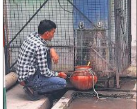
अमृत विचार टीम के फोटो खींचते ही कर्मचारियों से भरवाए मटके।