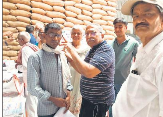
मरीज को नजर का चश्मा देती टीम।

● 25 मरीजों को मिली कान की मशीन, 35 का होगा निशुल्क ऑपरेशन