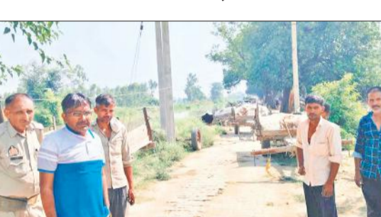
खनन की सूचना पर छापा मारने पहुंची टीम।

तहसील बीसलपुर क्षेत्र में बीते कई सालों से खनन के धंधेबाज यहां पनपते रहे हैं। करीब चार साल पहले बड़ी कारवाई भी हुई थी। शासन स्तर पर भी मामला पहुंचा लेकिन बाद में कार्रवाई मुकाम हासिल नहीं कर सकी थी। उस वक्त जिम्मेदारों पर साठगांठ के भी आरोप लगे थे। खैर, उसके बाद भी लगातार खनन से जुड़ी सूचनाएं पहुंचती रहती है। मगर कार्रवाई नाममात्र ही रहती है। इन