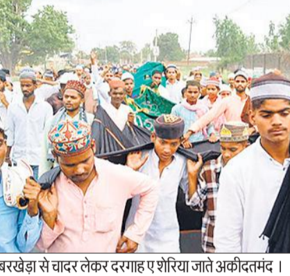
बरखेड़ा से चादर लेकर दरगाह ए शेरिया जाते अकीदतमंद।