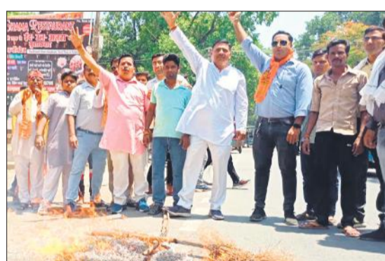
कलेक्ट्रेट तिराहे पर आतंकवाद का पुतला फूँकते विहिप व बजरंग दल कार्यकर्ता।