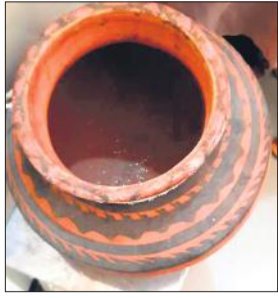
सीएचसी बरखेड़ा में रखा खाली मटका।