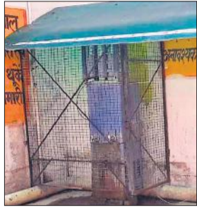
सीएचसी बरखेड़ा में लगा वाटर कूलर।

कस्बे में स्थित सीएचसी बरखेड़ा पर इलाज कराने लिए दर्जनों गांवों के लोग पहुंचते हैं। एक लाख से अधिक की आबादी सीएचसी पर निर्भर है। वर्तमान में गर्मी का सितम मरीजों की संख्या में इजाफा कर रहा है। प्रतिदिन की औपेक्षी 300 या फिर उसके पार पहुंच रही है। मगर व्यवस्थाओं की बात करें तो यहां पर मरीज और तीमारदारों के लिए प्यास बुझाने के भी पर्याप्त इंतजाम नहीं है।