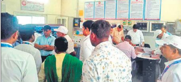
सेफ्टी ऑडिट करने पहुंची टीम।