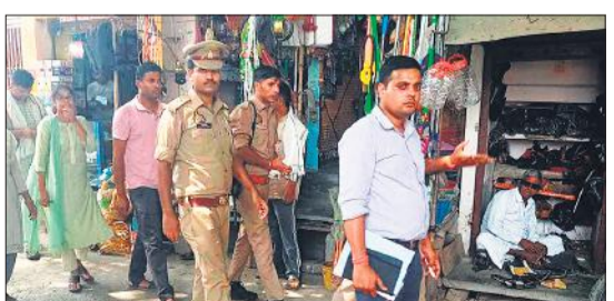
जहानाबाद में छापेमारी करती संयुक्त टीम।

अमृत विचार: अंतर्राष्ट्रीय बाल श्रम निषेध दिवस पर श्रम विभाग, चाइल्ड हेल्पलाइन एवं एचटीयू की संयुक्त टीम द्वारा जहानाबाद में बाल श्रम एवं बाल शिक्षावृत्ति के विरुद्ध अभियान चलाया गया। इस दौरान टीम ने कस्बे में दुकानों, ढाबों, रेस्टोरेंट समेत अन्य सार्वजनिक आदि स्थानों पर छापेमारी की। अभियान के दौरान तीन बाल श्रमिक को मुक्त कराया गया। इस दौरान इन सभी बाल श्रमिकों के नियोजकों को नोटिस जारी कर चेतावनी दी गई। इस दौरान टीम सदस्यों ने दुकानदारों को बालश्रम निषेध दिवस की