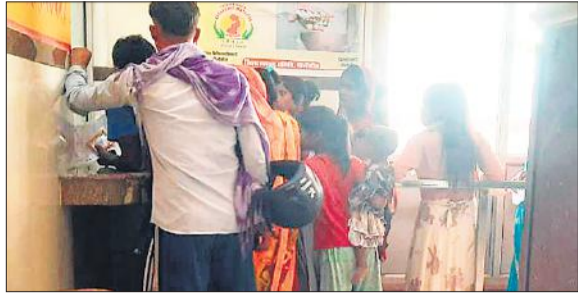
सीएचसी बरखेड़ा में पर्याप्त बनवाते मरीज व तीमारदार।