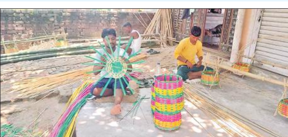
तीर्थ नगरी सोरों में कांवड़ की कंडिया तैयार करते कारीगर।