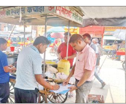
कचौड़ी की दुकान पर नमूने लेने के बाद लिखा पढ़ी करते छापामार टीम के अधिकारी।