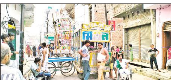
पटियाली तिराहे पर टैले लगाकर रोड जाम करते लोग।