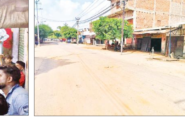
बवाल के दौरान एटा रोड के बाजार में पसरा सन्नाटा।