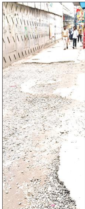
ओवरब्रिज के सर्विस मार्ग पर गड्ढे होने से होती है परेशानी।

बाद अब सड़कों की हालत और खराब हो गई है। इन टूटी सड़कों पर चलना मुश्किल हो गया है।