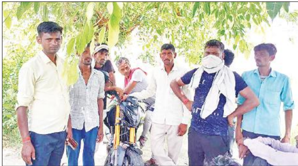
पोस्टमार्टम हाउस पर मौजूद ग्रामीण व मृतक के परिजन।