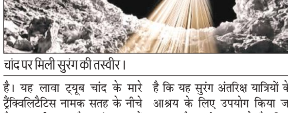
चांद पर मिली सुरंग की तस्वीर।

है। यह सुरंग ज्वालामुखी से निकले लावा के बाहर निकलने का मार्ग है। नासा के मून ऑर्बिटर द्वारा वैज्ञानिकों की अंतर्राष्ट्रीय टीम ने ये खोज की है। यह स्थान अंतरिक्ष यात्रियों के उठरने के लिए उपयुक्त स्थान हो सकता है। भले ही मानव समेत कई अंतरिक्ष मिशन चंद्रमा पर चलाए गए हों, लेकिन नई खोज बेहद महत्वपूर्ण है। इस खोज से संभावना व्यक्त की जा सकती है कि चांद की सतह हैरतअंगेज कई अन्य रहस्यों का पता चल सकता है। चंद्रमा की सतह पर मिली सुरंग को लेकर शोधकर्ताओं की अंतर्राष्ट्रीय टीम का कहना है कि चंद्रमा पर सुरंगनाम लावा ट्यूब की पहली बार पुष्टि हुई