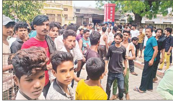
कोतवाली का घेराव कर प्रदर्शन करते ताजियादार।