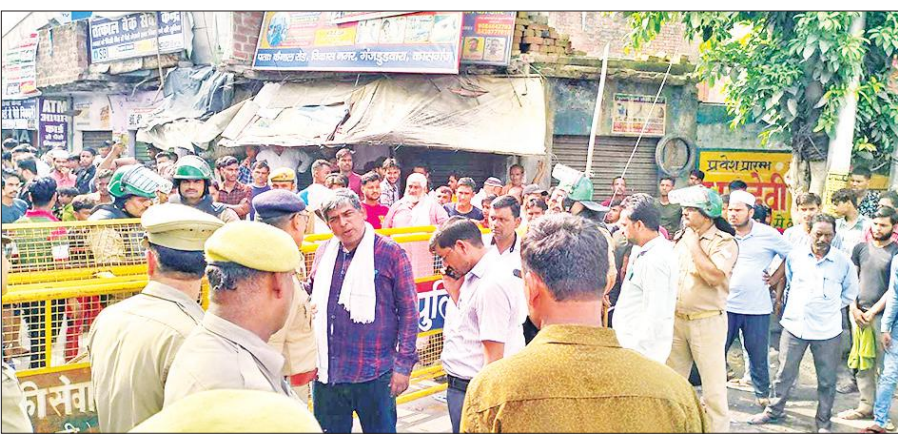
आक्रोशित लोगों को समझाते पुलिस व प्रशासन के अधिकारी।

बवाल की शुरुआत बुधवार रात करीब तीन बजे हुई। उस वक्त पटियाली तिराहे पर मस्जिद के पास ताजिया दफनाने की तैयारी चल रही थी। ताजिया एटा रोड स्थित करबला में दफनाया जाना था। कोतवाली पुलिस कार्यक्रम जल्द पूरा करने को कह रही थी। मगर भीड़ की वजह से कार्यक्रम में देरी हो रही थी। लोगों का कहना है कि इस बीच दो पुलिस कर्मियों ने बेवजह लाठी चार्ज शुरू कर दिया, जिससे माहौल बिगड़ गया। लाठीचार्ज से भीड़ के बीच भगदड़ मच गई, जिससे ताजिया टूट गया। ताजिया टूटा देखकर भड़के लोगों ने नारेबाजी शुरू कर दी। इसके बाद पटियाली तिराहे पर जाम लगाने के साथ धरना-प्रदर्शन शुरू कर दिया। इससे दोनों तरफ वाहनों की लाइनें लगने लगीं, जिससे पुलिस ने रूट डायवर्जन कराना पड़ा। बवाल बढ़ता देख आसपास के थानों की पुलिस बुला ली गई। वहां मौजूद पुलिस व प्रशासन के अधिकारी लोगों को समझाने की कोशिश में लगे थे। डीएम और एसपी ने हर पल मामले की जानकारी ले रहे थे। मगर भीड़ के सामने पुलिस बेवस नजर आ रही थी।