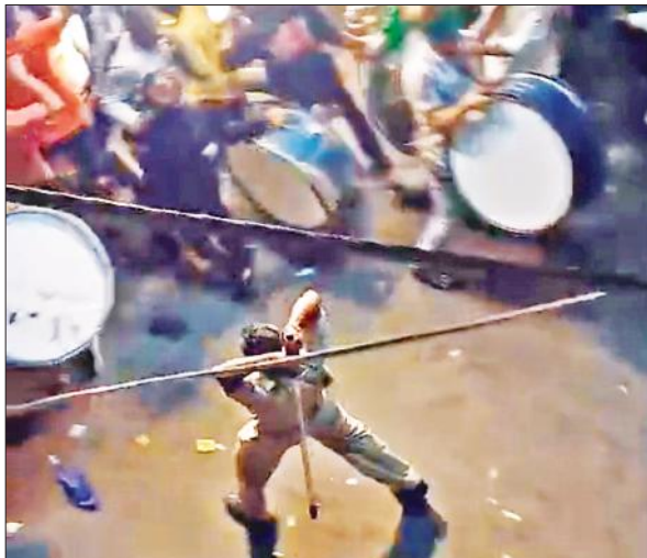
पटियाली तिराहे पर एकत्र भीड़ पर लाठी चलाता पुलिस कर्मों।