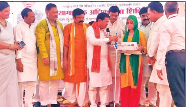
दिव्यांगों को सहायक उपकरण देते केन्द्रीय राज्यमंत्री बीएल वर्मा।

केन्द्रीय राज्यमंत्री ने कहा कि दिव्यांगजन किसी से कम नहीं हैं। वह सरकारी योजनाओं का लाभ लेकर अपना सामाजिक व आर्थिक उत्थान करें। सरकार हर कदम पर उनके साथ खड़ी है। सरकार ने दिव्यांगजनों की सात श्रेणी को बढ़ाकर 21 श्रेणी कर दी है। इससे अधिक से अधिक दिव्यांगजनों को लाभ मिलेगा। कहा कि देश में संचालित विभिन्न एम्स में दिव्यांग केंद्र बनाने पर कार्य किया