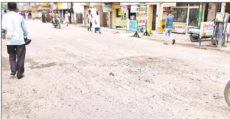
टूटा पड़ा पुलिस लाइन चौराहे से बदायूं कलेक्ट्रेट की ओर जाने वाला मार्ग।

मोहल्लों की गलियों में सड़कों की हालत खस्ता : शहर की प्रमुख सड़कों के