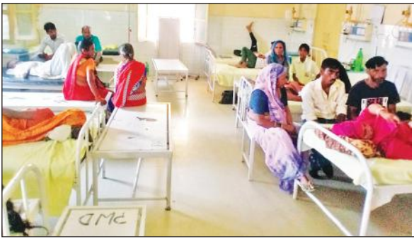
जिला अस्पताल में मरीजों से भरा वाई। ● अमृत विचार

● दवा भी नहीं कर रही असर, कई दिन से भर्ती हैं मरीज