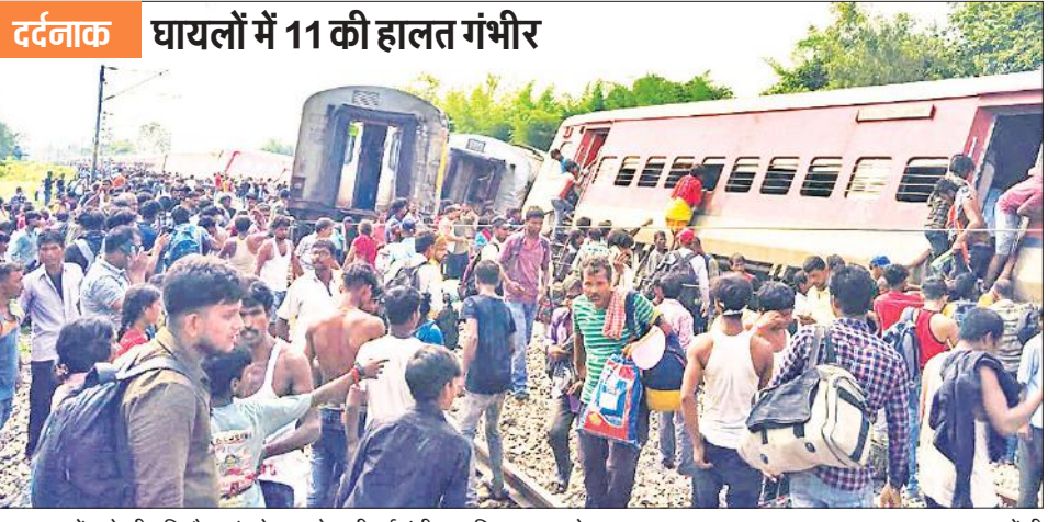
मनकापुर - गोंडा के बीच पिकोरा गांव के पास बेपटरी हुई चंडीगढ़-डिब्रूगढ़ एक्सप्रेस।

हादसे में तीन यात्रियों की मौके पर ही मौत हो गई, जबकि 34 यात्री घायल हो गए। घायलों में 11 यात्रियों की हालत गंभीर है। 9 घायल जिले के मेडिकल कॉलेज में भर्ती हैं, जबकि तीन घायलों को गंभीर हालत में लखनऊ रेफर किया गया है। रेलवे ने घटना की उच्च स्तरीय जांच के आदेश दिए हैं। वहीं मुख्यमंत्री योगी आदित्यनाथ ने हादसे का संज्ञान लेते हुए जिला प्रशासन के अधिकारियों को मौके पर पहुंचकर राहत कार्य में तेजी लाने के निर्देश दिए हैं। उन्होंने घायलों के शीघ्र स्वस्थ होने की कामना भी की है। रेलवे के अनुसार एक्सप्रेस ट्रेन बुधवार की शाम को चंडीगढ़ से डिब्रूगढ़ जाने के