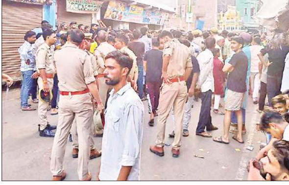
सुरक्षा की दृष्टि से तैनात पुलिस बल।