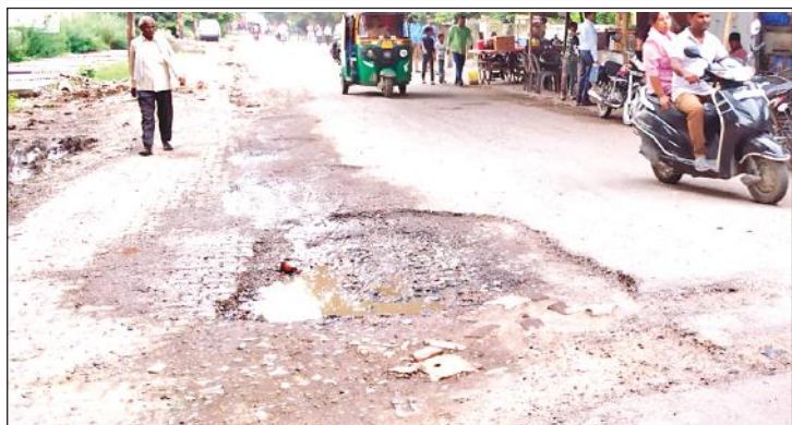
वन विभाग जाने वाले मोड़ पर सड़क टूटने से अक्सर होते हैं हादसे।