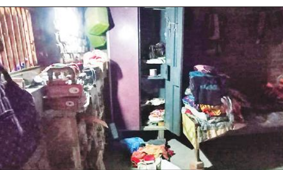
वजीरगंज के गांव भमोरी में चोरी के बाद घर में फैला सामान।

अमृत विचार : चोरों ने दो भाइयों के घर को निशाना बनाया। घर में रखी नगदी, सोने-चांदी के जेवर और अन्य सामान ले गए। घर में सो रहे एक बच्चे की नींद खुली तो चोरों के पीछे भागा। चोर छत से होकर भाग गए लेकिन एक चोर का मोबाइल छत पर गिर गया। पुलिस ने जल्द खुलासा करने का आश्वासन दिया है।