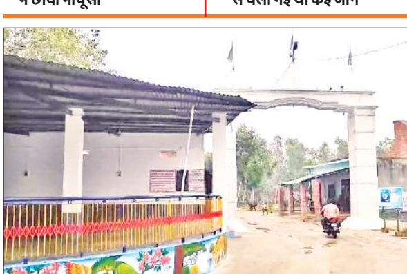
पटियाली के गांव बहादुर नगर स्थित भोले बाबा का आश्रम।

हाथरस के सत्संग में मची भगदड़ से चली गई थी कई जान