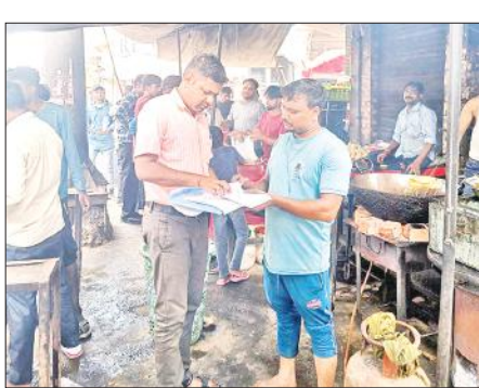
शहर के नदरई गेट स्थित कचौड़ी की दुकान पर जलजीरा का नमूना लेती खाद्य सुरक्षा एवं औषधि प्रशासन की टीम।

अमृत विचार: कावड़ियों के खान पान संबंधी सुरक्षा को लेकर खाद्य सुरक्षा एवं औषधि प्रशासन गंभीर है। गुरुवार को टीम ने कावड़ यात्रा में जगह-जगह लगने वाले कचौड़ी, पकौड़ी, भटूरे आदि के स्टॉलों की जांच की। इस दौरान पांच खाद्य पदार्थों के नमूने लिए गए। टीम ने विक्रेताओं से कहा कि खाद्य पदार्थों को ढककर रखें। धूल मिट्टी से कोई भी पदार्थ दूषित न हो।