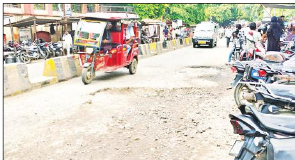
खस्ताहाल हुआ कलेक्ट्रेट तिराहे से जिला अस्पताल की ओर जाने वाला मार्ग।