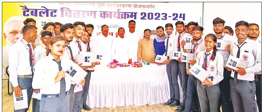
टैबलेट वितरण के दौरान अतिथियों के साथ मौजूद छात्र-छात्राएं।

इससे पुलिस प्रशासन अलर्ट मोड पर आ गया है। खुफिया एजेंसी ने भी शासन को रिपोर्ट भेजी है।