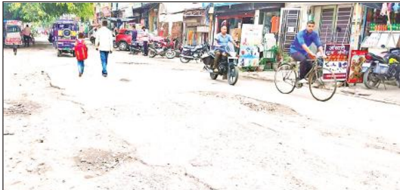
रेलवे स्टेशन जाने वाली सड़क पर गड्ढों में पानी भरने के दौरान बड़ जाती है परेशानी।

बरसात के दौरान सड़कों की हालत अधिक खराब हो जाती है। कई सड़कें जर्जर हो चुकी हैं। बरसात के बाद सड़कों को ठीक कराया जाएगा।