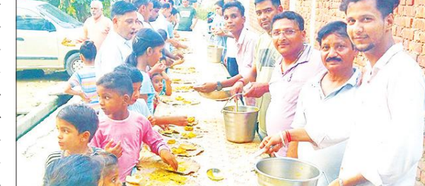
भंडारे के दौरान प्रसाद ग्रहण करते श्रद्धालु।