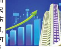
● सेंसेक्स 627 अंक ऊपर चढ़ा, निफ्टी 24,800 अंक के नये शिखर पर

मुंबई। शेयर बाजार में रिकॉर्ड तेजी का सिलसिला गुरुवार को लगातार चौथे कारोबारी सत्र में भी जारी रहा और बीएसई सेंसेक्स 627 अंक उछलकर पहली बार 81,343 अंक के ऊपर बढ़ हुआ। निफ्टी भी 24,800 अंक के नये शिखर पर पहुंच गया। आईटी, तेल एवं गैस तथा दैनिक उपयोग का सामान बनाने वाली कंपनियों के शेयरों में लिवाली से बाजार में तेजी रही। बाजार में शुरुआत कमजोर रही और एक समय यह 80,390.37 अंक के निचले स्तर तक आ गया था। हालांकि आईटी शेयरों तथा सूचकांक में मजबूत हिस्सेदारी रखने वाली कंपनी में लिवाली से सूचकांक नुकसान से उबर गया।