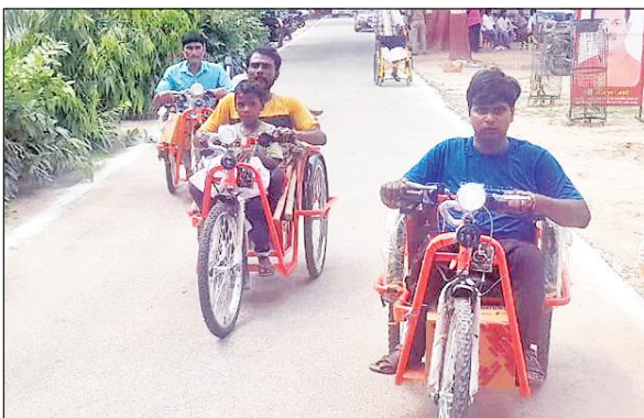
बेटी रिक्शा मिलने के बाद घर लौटते दिव्यांग।