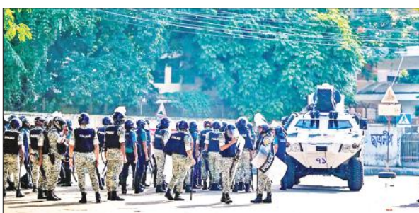
बांग्लादेश में अनिश्चितकाल बंद के दौरान तैनात सुरक्षाकर्मी।

प्रत्यक्षदर्शियों ने कहा कि प्रदर्शनकारियों ने ढाका के रामपुरा इलाके में सरकारी बांग्लादेश टेलीविजन भवन की घेराबंदी कर दी और इसके आगे हिस्से को क्षतिग्रस्त कर दिया और वहां खड़े अनेक वाहनों को आग लगा दी। इससे वहां पत्रकारों सहित कई कर्मचारी फंस गए। ढाका और अन्य शहरों में विश्वविद्यालय के छात्र 1971 में पाकिस्तान से देश की आजादी के लिए लड़ने वाले युद्ध नायकों के रिश्तेदारों के लिए सार्वजनिक क्षेत्र की कुछ नौकरियों को आरक्षित करने की प्रणाली के खिलाफ कई दिनों से रैलियां कर रहे हैं। समाचारपत्र द डेली स्टार ने कहा, "प्रदर्शनकारियों और कानून प्रवर्तन एजेंसियों तथा