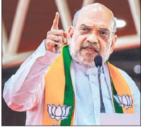
● कहा- डॉ. श्यामा प्रसाद मुखर्जी के कारण बंगाल और कश्मीर आज भारत का हिस्सा

केन्द्रीय गृह एवं सहकारिता मंत्री अमित शाह ने शनिवार को गुजरात के गांधीनगर में कहा कि प्रधानमंत्री नरेन्द्र मोदी के नेतृत्व में कश्मीर से दो विधान, दो प्रधान और दो निशान समाप्त हो गए हैं और वहां तिरंगा बड़ी शान से लहरा रहा है। शाह ने शनिवार को यहां 102वें अंतर्राष्ट्रीय सहकारिता दिवस के अवसर पर आयोजित सहकार से समृद्धि कार्यक्रम को संबोधित किया। इस अवसर पर गुजरात के मुख्यमंत्री भूपेन्द्र पटेल और सचिव, सहकारिता मंत्रालय सहित अनेक