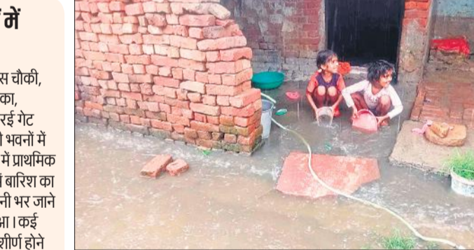
आवास विकास के सेक्टर एक में घर में घुसा पानी निकालते बच्चे। ● अमृत विचार

शहर के सोरो गेट स्थित पुलिस चौकी, पशु चिकित्सालय, नगर पालिका, विद्युत उपकेंद्र नदरई गेट, नदरई गेट पुलिस चौकी व अन्य सरकारी भवनों में जलभराव हुआ। ग्रामीण क्षेत्रों में प्राथमिक एवं उच्च प्राथमिक विद्यालयों में बारिश का पानी भर गया है। स्कूलों में पानी भर जाने से शैक्षणिक कार्य प्रभावित हुआ। कई विद्यालय भवनों की छतें जीर्णोद्धार होने से छतों से पानी टपक रहा है।