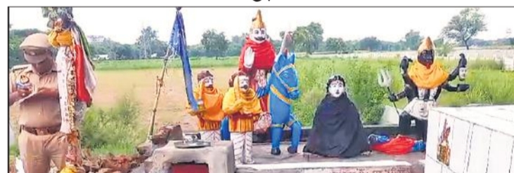
जाहरवीर बाबा मंदिर में घटना की जांच करती पुलिस।