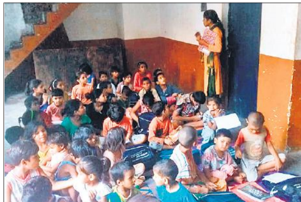
परिषदीय विद्यालय में बिना किताबों के पढ़ाई करते कक्षा दो के बच्चे।

अमृत विचार: बेसिक शिक्षा विभाग में नया सत्र एक अप्रैल से शुरू हो चुका है। गर्मी की छुट्टियां बीतने के बाद स्कूल दोबारा खुल गए। मगर तीन माह बीतने के बावजूद कक्षा एक और दो के बच्चों को किताबें अभी तक नहीं मिल पाई हैं। स्कूलों में बच्चे बिना किताबों के पढ़ाई कर रहे हैं।