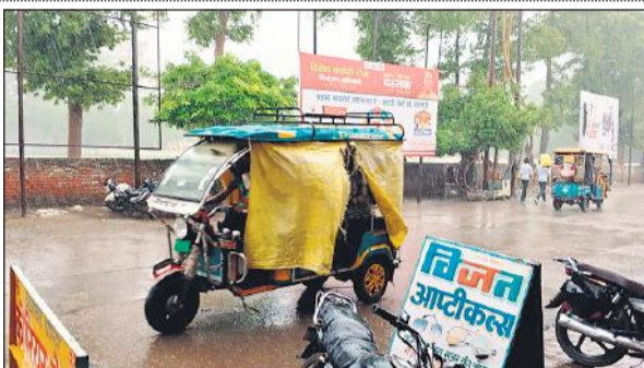
सवारियों को भीगने से बचाने के लिए ई-रिक्शा पर लगाया तिरपाल।