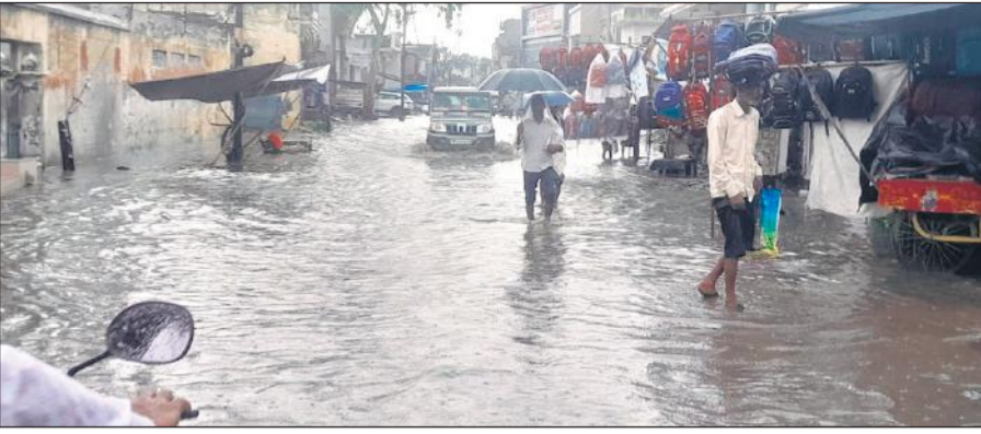
जोगीपुरा रोड पर जलभराव से गुजरते लोग।

अमृत विचार: शहर से लेकर देहात तक शनिवार को जमकर बारिश हुई। गर्मी से राहत मिलने तक तो ठीक लेकिन अब बारिश आफत लगने लगी है। जलभराव मुसीबत बन गया है। खेतों में खड़ी धान की नर्सरी खराब होने की नौबत आ गई है। सब्जियों को भारी नुकसान पहुंचा है। कृषि विभाग चार दिनों तक बारिश होने की संभावना जता रहा है। पिछले कई दिनों से बारिश हो रही है। शुक्रवार की शाम बारिश शुरू हुई जो शनिवार सुबह पांच बजे तक जारी रही। इसके बाद बारिश थम गई। 11 बजे फिर बारिश शुरू हो गई जो देर शाम तक जारी थी। लगातार बारिश होने की वजह से जनजीवन अस्त व्यस्त हो गया। शहर के कई प्रमुख मार्ग और मोहल्लों की गलियां तालाब नजर आ रही हैं। बाजार में जलभराव होने से ग्राहकों के न आने से दुकानदार खाली बैठे रहे। पट्टी पर सामान बेचने वाले लोगों ने जल्दी घरों की ओर रुख कर लिया। रोडवेज बस स्टैंड पर पानी भर जाने से यात्रियों को भारी असुविधा का सामना करना पड़ा। उन्हें कीचड़ में खड़ी बसों तक पहुंचने के लिए परेशानी उठानी पड़ी। बारिश के दौरान सबसे अधिक दिक्कत स्कूली बच्चों को हुई। बच्चे भीगते हुए घर पहुंचे। इधर खेतों में खड़ी मक्का और मूँगा की फसल को भारी नुकसान पहुंचा है। खेत में कटी पड़ी मक्का की बाली से अंकुर फूटने लगे हैं। खेतों में पानी भरने से धान की पौधे खराब होने लगे हैं। कई किसान ऐसे हैं जिन्होंने दो बार पौधे लगाईं।