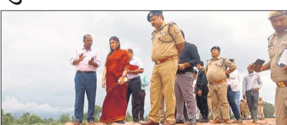
तटबंध का निरीक्षण करती मंडलायुक्त सौम्या अग्रवाल।