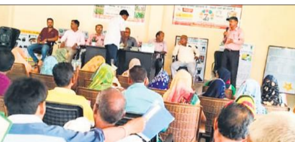
कृषि विभाग केंद्र में आयोजित गोष्ठी में मंचासीन अतिथि व कृषि विभाग के अधिकारी। ● अमृत विचार

अमृत विचार : जनपद के मोहनपुरा स्थित कृषि विज्ञान केंद्र में शुक्रवार को ब्लॉक स्तरीय खरीफ उत्पादकता गोष्ठी का आयोजन किया गया। कृषि विभाग के कर्मियों द्वारा गोष्ठी में किसानों को धान, मक्का, बाजरा आदि खरीफ की फसलों में कम लागत में अधिक उत्पादन पाने एवं संचारी रोग नियंत्रण की जासकरी दी गई।