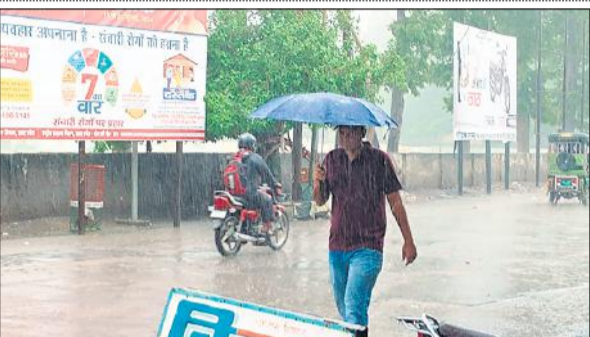
झमाझम बारिश में छलात लगाकर जाता युवक।