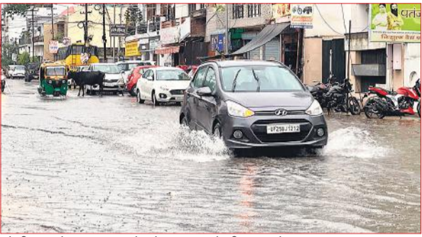
बरेली शहर के रामपुर बाग क्षेत्र में जलभराव के बीच गुजरते वाहन।

और मैनपुरी, कौशांबी, प्रतापगढ़ व रायबरेली के एक-एक लोग शामिल हैं, जबकि अतिवृष्टि से मारे गये लोगों में रायबरेली व मैनपुरी के एक-एक