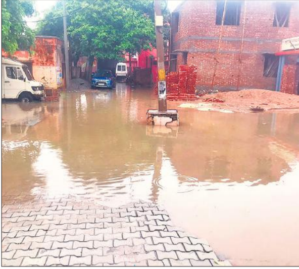
अशोक नगर स्थित सामुदायिक स्वास्थ्य केंद्र में भरा बारिश का पानी। ● अमृत विचार