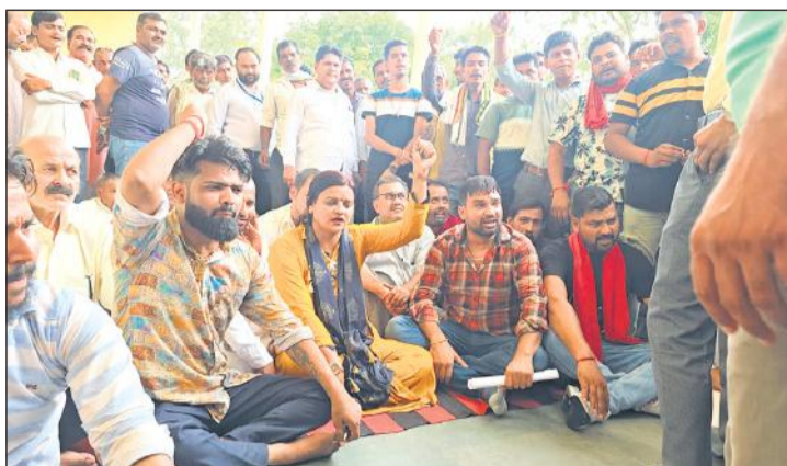
प्रदर्शन करते परशुराम युवा मंच और राष्ट्रीय करणी सेना के पदाधिकारी व कार्यकर्ता।