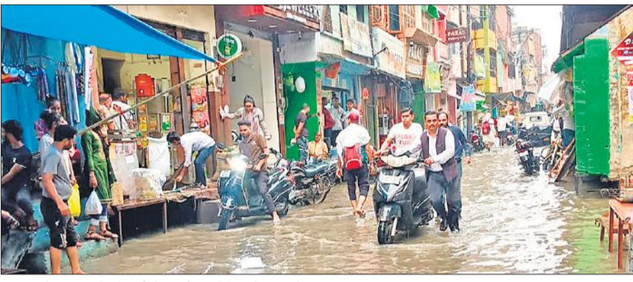
बिलराम गेट बाजार में भरे पानी में स्कूटी बंद होने पर पैदल जाते अधिवक्ता व अन्य।

मानसून आने के बाद से लगभग रोजाना बारिश हो रही है। शनिवार सुबह लगभग चार बजे बूंदबांदी रुक गई थी। मगर आसमान पर बादल छाए रहे। शनिवार दोपहर लगभग एक बजे पहले बूंदबांदी शुरू हुई। इसके बाद शुरू हुई मूसलाधार बारिश लगभग ढाई घंटे तक जारी रही। इससे जा जहां था वह वहीं उठर गया। झमाझम बारिश होने से कुछ ही देर में नाले नालियां उफना गए। देखते ही देखते सड़कें नदियां बन गईं। बस्तियों में पानी भरने से लोग परेशान हो गए। कई इलाकों में बारिश का पानी घरों में घुस गया। शहर के नदरई गेट, बिलराम गेट, सोरो गेट, सहावर गेट और मुख्य एवं उप बाजार में हर तरफ पानी ही पानी नजर आ रहा था। लगभग चार बजे बारिश थमी, लेकिन एक घंटे बाद ही फिर से बूंदबांदी के साथ मेघा बरसने लगे।