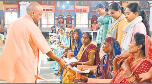
जनता दर्शन में लोगों की समस्याओं से रूबरू मुख्यमंत्री। ● अमृत विचार

मुख्यमंत्री ने अधिकारियों को सख्त निर्देश देते हुए कहा कि किसी की जमीन पर अवैध कब्जा करने