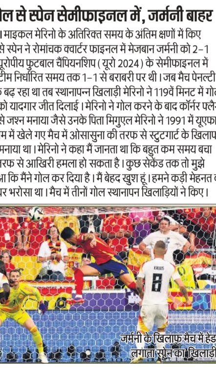
जर्मनी के खिलाफ मैच में हेडर लगाती स्पेन की खिलाड़ी।