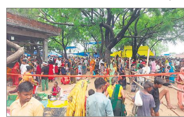
शनि जात में उमड़ी श्रद्धालुओं की भीड़ के बीच अपनी बारी का इंतजार करते लोग।

अमृत विचार: अषाढ़ मास के शनिवार को होने वाली बड़े मियां-छोटे मियां एवं शनि जात में दूसरे दिन शनिवार को लोगों की जबरदस्त भीड़ उमड़ी। इससे दिनभर लोग जाम से जूझते रहे। जात में आए लोगों से वाहन स्टैंड के नाम पर जमकर वसूली की गई। शनिवार को दिनभर रुक-रुककर बरसात होती रही। बावजूद इसके जात में लाखों की संख्या में श्रद्धालु पहुंचे और बड़े मियां-छोटे मियां के दरबार में माथा टेका व शनिदेव की पूजा कर मनौती मांगी। भीड़ की वजह से भारी पुलिस बल होने के बावजूद नगर में जाम की स्थिति बनी रही। यहां अषाढ़ में शनिवार को पूजा अर्चना का विशेष महत्व माना जाता है। इसलिए यहां तीन दिन पूर्व से ही श्रद्धालुओं का रेला उमड़ने लगा। बसों में सवार होकर हजारों श्रद्धालु ने नगर के चारों ओर पेड़ों की छांव में डेरा जमा लिया था। मगर बारिश होने