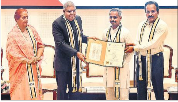
मेधावी छात्रों को उत्कृष्टता पदक प्रदान करते उप राष्ट्रपति जगदीप धनखड़।