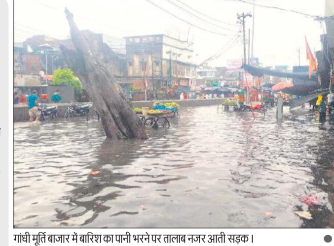
गांधी मूर्ति बाजार में बारिश का पानी भरने पर तालाब नजर आती सड़क। ● अमृत विचार

शहर के मुख्य बाजारों में शनिवार को हुई बारिश से जलभराव हो गया था। गांधी मूर्ति, बिलराम गेट, लक्ष्मीगंज, मालगोदाम चौराहा आदि इलाकों में बारिश का पानी दुकानों में घुस गया। फुटपाथों पर दुकान लगाए बैठे दुकानदारों का सामान बारिश में बह गया। दुकानों में पानी भर जाने से दुकानदारों को लाखों का नुकसान हुआ है।