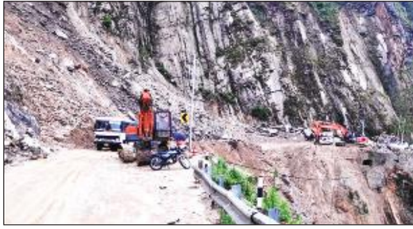
टनकपुर-चम्पावत राष्ट्रीय राजमार्ग पर मलबा हटाने में जुटी जेसीबी।