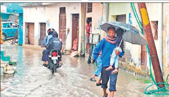
मधुवन कॉलोनी में जलभराव के चलते बच्चों को गोद में लेकर ले जाता व्यक्ति।