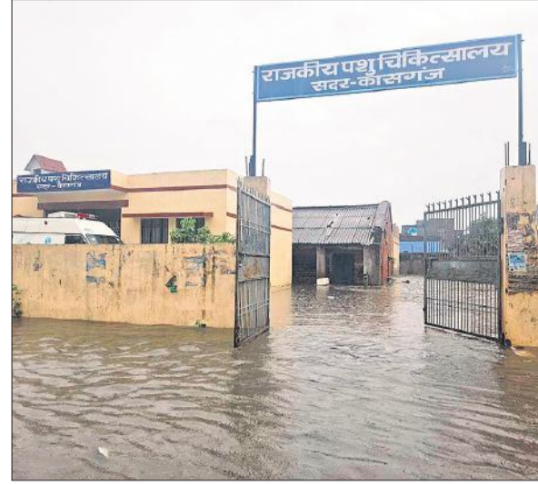
राजकीय पशु चिकित्सालय में भरा बारिश का पानी। ● अमृत विचार