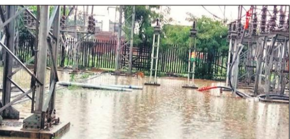
उझानी के बिजली घर में जलभराव।