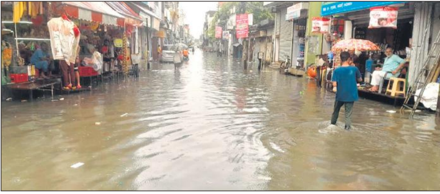
बारिश में नाले चोक हो गए तो छह सड़का रोड पर जमा हो गया पानी।