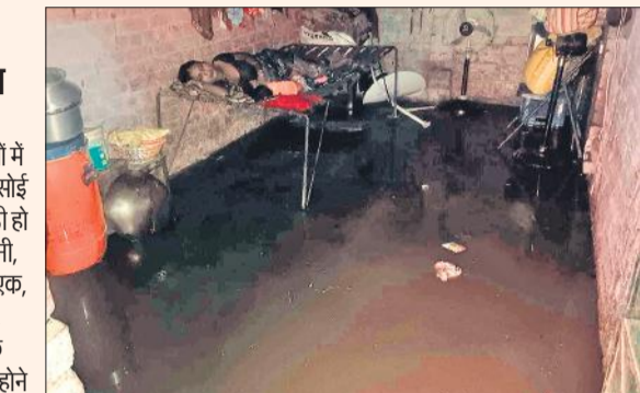
आवास विकास के एक घर में घुसे पानी में चारपाई डालकर सोती महिला। ● अमृत विचार

बारिश की वजह से निचली बस्तियों में हालत बंद से बदतर हो गए। शहर की तमाम बस्तियों में बारिश का पानी घरों में घुस गया। बेडरूम, रसोई में पानी भरने से लोगों के सामने समस्या खड़ी हो गई। शहर के लवकुश नगर, गंगेश्वर कॉलोनी, 16 बीघा, मोहल्ला भूतेश्वर, आवास सेक्टर एक, सिटी मोहल्ला, धान मिल रोड, अशोक नगर, किला रोड सहित शहर की दर्जनों बस्तियों के घरों में बारिश का पानी घुस गया। बारिश बंद होने के बाद भी बस्तियों से पानी नहीं निकला। घंटों लोग अपने घरों से पानी निकालते नजर आए।