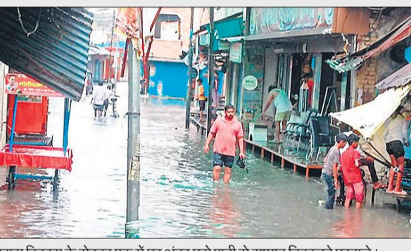
आवास विकास के सेक्टर एक में घर अंदर घुसे पानी से सामान निकालते घरवाले। ● अमृत विचार

झमाझम बारिश से विद्युत उपकेंद्रों में भी पानी भर गया। इस कारण फीडरों से बिजली आपूर्ति बाधित करनी पड़ी। दोपहर लगभग डेढ़ बजे शहर भर की विद्युत आपूर्ति टप हो गई, जो देर शाम तक सुचारु नहीं हो सकी। इससे लोगों को परेशानी का सामना करना पड़ा। इस दौरान कई स्थानों पर फॉल्ट भी हुए।