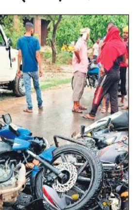
हादसे के बाद मौके पर पड़ी दोनों बाइकें।