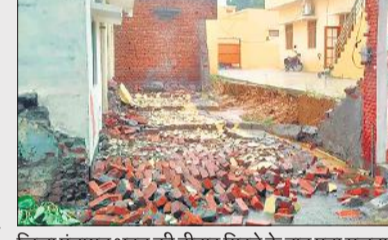
जिला पंचायत भवन की दीवार गिरने के बाद पड़ा मलबा। ● अमृत विचार

कासगंज, अमृत विचार : मूसलाधार बारिश के दौरान शनिवार दोपहर जिला पंचायत भवन की दीवार भरभराकर गिर गई। इसकी रिश्शा क्षतिग्रस्त हो गया। शहर के अशोकनगर में बीते वर्ष जिला पंचायत भवन का निर्माण कराया गया था। इस भवन की गुणवत्ता की पोल शनिवार को हुई मूसलाधार बारिश ने खोल दी। शनिवार को बारिश के दौरान बीते वर्ष बनाई गई दीवार अचानक गिर गई। चूंकि जिला पंचायत भवन के आसपास बस्ती है। इससे बड़ा हादसा हो सकता था। हालांकि दीवार के मलबा गिरने से एक ई-रिश्शा क्षतिग्रस्त हो गया। लोगों का कहना है कि दीवार के निर्माण में गुणवत्ता की कमी रही।