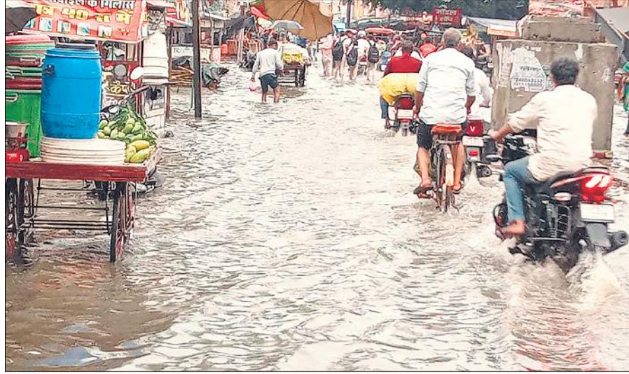
शहर में मूसलाधार बारिश होने पर नदरई गेट बाजार में सड़क पर बहते पानी में होकर निकलते वाहन। ● अमृत विचार