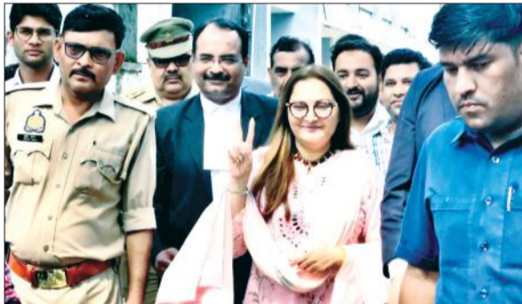
बरी होने के बाद विजय का चिह्न दिखातीं पूर्व सांसद जयाप्रदा।

यह मामला वर्ष 2019 के लोकसभा चुनाव का है। भाजपा ने अभिनेत्री जयाप्रदा को लोकसभा चुनाव में अपना प्रत्याशी बनाया था। उनके सामने समाजवादी पार्टी के टिकट पर मोहम्मद आजम खां ने चुनाव लड़ा था। आरोप है कि लोकसभा चुनाव के प्रचार के दौरान जयाप्रदा ने आचार संहिता का उल्लंघन किया था। चुनाव प्रचार के दौरान जयाप्रदा जब केमरी थाना क्षेत्र में पहुंचीं तो वहां पिपलिया मिश्र गांव में जनसभा को संबोधित किया और एक आपत्तिजनक