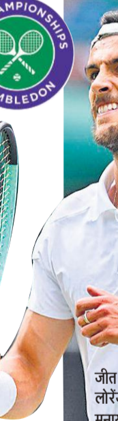
जीत दर्ज करने के बाद लोरेञो मुसेत्ती ने कुछ चुं मनाया जश्न।

इटली के लोरेञो मुसेत्ती ने अमेरिका के टेलर फ्रिट्ज को हराकर विंबलडन सेमीफाइनल में प्रवेश कर लिया और कैरियर में पहली बार वह किसी ग्रैंडस्लैम में अंतिम चार में पहुंचे हैं। उन्होंने साढ़े तीन घंटे तक चला यह मुकाबला 3-6, 7-6, 6-2, 3-6, 6-1 से जीता। वह पहली बार किसी ग्रैंडस्लैम में चौथे दौर से आगे पहुंचे हैं लेकिन अब उनके सामने नोवक जोकोविच के रूप में करियर की सबसे बड़ी चुनौती है। सात बार के चैंपियन जोकोविच 13वीं बार विंबलडन और 49वां बार ग्रैंडस्लैम सेमीफाइनल में पहुंचे हैं और उन्होंने रोजर फेडरर के रिकॉर्ड की बराबरी की है। महिला वर्ग में 2022 की चैंपियन एलेना रिबाकिना ने एलिना स्वितोलिना को 6-3, 6-2 से हराया। वहीं 31वीं रैंकिंग वाली बारबरा क्रेडिकोवा ने 13वां रैंकिंग वाली येलेना ओस्टापेंको को 6-4, 7-6 से मात दी।