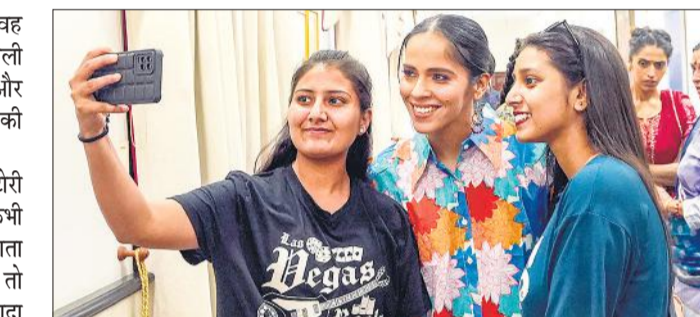
कार्यक्रम के दौरान साइना नेहवाल के साथ सेल्फी लेती प्रशंसक।

ने काफी प्रभावित किया है जिसमें वह दुनिया में शीर्ष रैंकिंग हासिल करने वाली पहली भारतीय महिला शटलर बनीं और वह ओलंपिक पदक जीतने वाली देश की पहली महिला एथलीट भी बनीं। राष्ट्रपति भवन में हर स्टोरी-माई स्टोरी बातचीत के दौरान साइना ने कहा कभी करभार मुझे लगता है कि अगर मेरे पिता तो मुझे टेनिस में डाला होता तो अच्छा होता। उन्होंने कहा इसमें ज्यादा पैसा है और मुझे लगता है कि मैं ज्यादा ताकतवर थी। मैं टेनिस में बैडमिंटन से बेहतर कर सकती थीं। साइना ने कड़ियों को बैडमिंटन में आने के लिए प्रेरित किया है लेकिन जब उन्होंने आठ साल की उम्र में खेलना शुरू किया था तो उनका लिए कोई आदर्श नहीं था। साइना ने कहा जब मैंने शुरूआत की थी तो मेरे लिए कोई आदर्श नहीं था। यह कहने के लिए कोई नहीं था, मैं दुनिया की नंबर एक खिलाड़ी बनना चाहती हूँ या ओलंपिक पदक विजेता बनना चाहती हूँ। मुझसे पहले मैंने किसी को