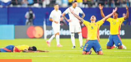
यूरो कप 2024

स्थानापन्न ओली वार्टकिस के शानदार गोल की बदौलत इंग्लैंड बुधवार को नीदरलैंड को 2-1 से हराकर यूरोकप 2024 चैंपियनशिप के फाइनल में लगातार दूसरी बार प्रवेश किया है। इससे पहले नीदरलैंड के लिए 21 वर्ष के जावी सिमंस ने इंग्लैंड की रक्षापंक्ति को भेदते हुए गोल दागकर अपनी टीम को बढ़त दिलाई, लेकिन वह इसे अधिक देर तक कायम नहीं रख सके। इंग्लैंड के हैरी केन ने 18वें मिनट में पेनल्टी के जरिए गोलकर स्कोर 1-1 कर दिया। ओली वार्टकिस ने अंतिम समय में निर्णायक गोलकर इंग्लैंड को विजय दिलाई। इस जीत के साथ ही रिविचर को फाइनल में इंग्लैंड और स्पेन खिताब के लिए भिड़ेंगे। इंग्लैंड के कोच जेरेथ साउथगेट ने कप्तान हैरी केन की जगह वार्टकिस को मैदान पर बुलाने का साहसिक फैसला लिया और 91वें मिनट में उसने गोल करके इसे सही साबित कर दिया।