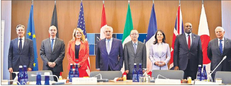
वाशिंगटन में आयोजित नाटो के शिखर सम्मेलन में उपस्थित सदस्य।

अमेरिकी राजदूत एरिक गार्सेटी ने कहा कि आपस में जुड़ी दुनिया में कोई भी युद्ध अब किसी से दूर नहीं है। इसलिए देशों को न सिर्फ शांति के लिए खड़ा होना चाहिए, बल्कि यह सुनिश्चित करने के लिए ठोस कदम भी उठाने चाहिए कि जो लोग शांतिपूर्ण तरीके से काम नहीं करते, उनकी युद्ध मशीनें बे रोकटोक जारी नहीं रहें। राजदूत ने यहां एक कार्यक्रम को संबोधित करते हुए कहा और यही बात अमेरिका और भारत दोनों को मिलकर जानने की ज़रूरत है। उन्होंने दिल्ली और वाशिंगटन के बीच एक मजबूत साझेदारी की भी वकालत की। उनकी यह टिप्पणी यूक्रेन-रूस और इजराइल-गाजा सहित विश्व में चल रहे अनेक संघर्षों की पृष्ठभूमि में आई है। यहां एक रक्षा समाचार सम्मेलन में अपने संबोधन में उन्होंने भारत-