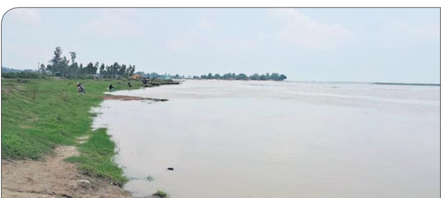
उसहैत के जटा गांव के पास बहती गंगा।