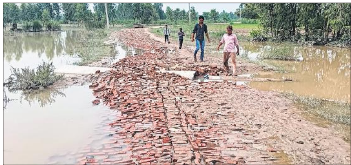
खागी नगला मार्ग कटा होने से ग्रामीणों को हो रही परेशानी।

तीन दिन पहले नरौरा बैराज से गंगा में एक लाख क्यूसेक से अधिक पानी छोड़ा गया था। इससे नदी में उफान आ गया और बाढ़ का पानी खेतिहर इलाके को जलमग्न करता हुआ गंगा महावा बांध की ओर बढ़