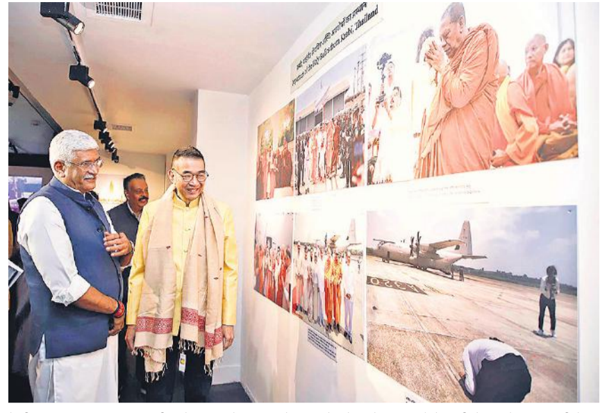
केंद्रीय संस्कृति एवं पर्यटन मंत्री गजेन्द्र सिंह शेखावत और थाईलैंड के विदेश मामलों के मंत्री मैरिस ने नई दिल्ली के राष्ट्रीय संग्रहालय में बौद्धिज्म नामक फोटो प्रदर्शनी का उद्घाटन किया।