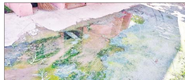
मलेरिया विभाग में हुए जलभराव में पनप रहे मछर के लार्वा।