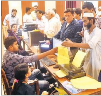
टैक्स जमा करने के लिए जुटी भीड़। • अमृत विचार

भवनस्वामियों को समय से हाउस टैक्स जमा करने के लिए कई दिनों तक चक्कर लगाना पड़ रहे हैं। करीब 50 फीसदी भवनस्वामी ऐसे हैं, जिनके बिलों में गलतियां हैं। कर विभाग के पास करीब एक सप्ताह के दौरान आई आपत्तियों पर गौर किया जाए तो इनकी संख्या 630 के पार पहुंच गई है। इस हिसाब से निराकरण की गति काफी धीमी है। एक दिन में 30 से 35 का ही निराकरण हो पा रहा है। कर विभाग से मिली जानकारी के अनुसार सबसे अधिक समस्या एरिया को लेकर आ रही है। छोटा मकान होने के बाद कर अधिक आ गया है। कई बिल ऐसे हैं, जिनमें वाई संख्या गलत है। मिश्रित भवनों को व्यवसायिक दिखाकर टैक्स लगा दिया गया है। इसके कारण लोगों को नगर निगम में बार-बार चक्कर लगाना पड़ रहे हैं।