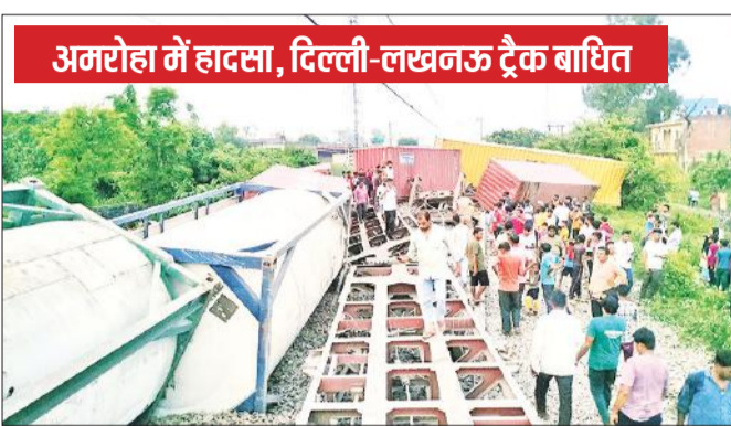
अमरोहा में हादसा, दिल्ली-लखनऊ ट्रेक बाधित