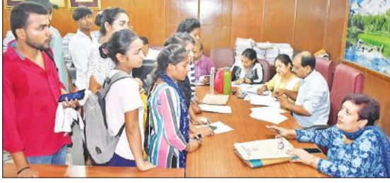
सेमिनार कक्ष में प्रवेश संबंधी जानकारी लेते छात्र।

अमृत विचार : बरेली कॉलेज में स्नातक प्रथम वर्ष बीए, बीएससी और बीकॉम की 66 फीसदी सीटों पर प्रवेश हो गए हैं और सिर्फ 34 फीसदी सीटें रह गई हैं। इनमें भी अधिकांश सीटें बीएससी गणित और बीकॉम की हैं, इनमें सीटों से कम ही आवेदन आए हैं। वहीं जीव विज्ञान और बीए की काफी कम सीटें ही बची हैं और अभी तृतीय मेरिट के प्रवेश हो रहे हैं।