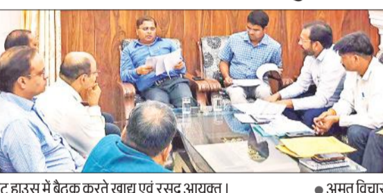
सर्किट हाउस में बैठक करते खाद्य एवं रसद आयुक्त। ● अमृत विचार

कोटेदारों के कमीशन का एक सप्ताह में कराया जाए भुगतान