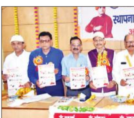
रोटीर भवन में आयोजित कार्यक्रम में उपस्थित पदाधिकारी।

अमृत विचार : मानव सेवा क्लब ने शनिवार को रोटीर भवन में 19 वें स्थापना दिवस पर नई कार्यकारिणी का शपथ ग्रहण समारोह आयोजित किया। इस मौके पर पदाधिकारियों ने पूरी निष्ठा, लगन और ईमानदारी के साथ सेवा करने की शपथ ली। मानव दर्पण के वार्षिक अंक का विमोचन किया गया।