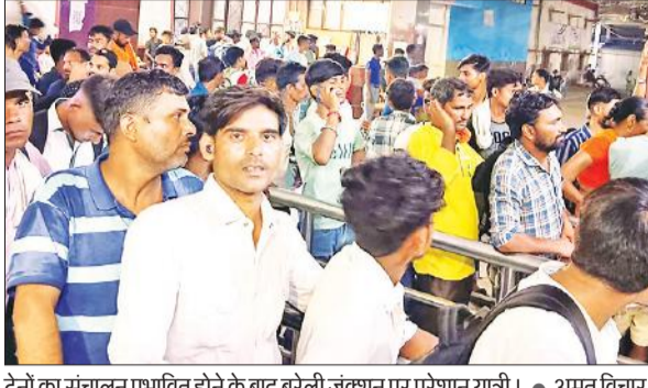
ट्रेनों का संचालन प्रभावित होने के बाद बरेली जंक्शन पर परेशान यात्री। • अमृत विचार

15274 सत्याग्रह एक्सप्रेस, 19601 उदयपुर सिटी न्यू जलपाई गुड्री एक्सप्रेस, इंटरसिटी एक्सप्रेस समेत कई ट्रेनें चार से पांच घंटा लेट चल रही थीं, वहीं, 14208 पचावत एक्सप्रेस, 12391 श्रमजीवी एक्सप्रेस, 13430 मालदा टाउन एक्सप्रेस को डायवर्ट किया गया था, लेकिन इन्हें बरेली जंक्शन से गुजारा गया। आगे जाकर डायवर्ट होने से यात्रियों को दिक्कत का सामना करना पड़ा। डिरेलमेंट के कारण 13 ट्रेनें निरस्त: सबसे ज्यादा दिक्कत उन यात्रियों को हुई, जो बरेली जंक्शन पर ट्रेनें के इंतजार में