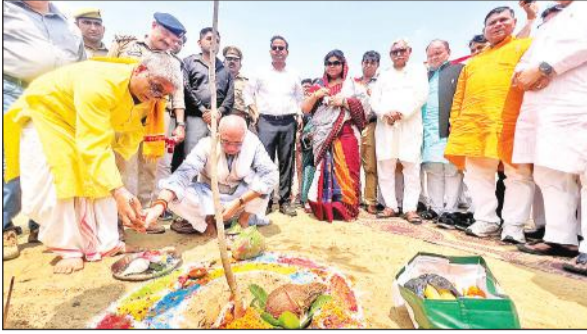
कार्यक्रम में पौधरोपण करते मंत्री धर्मपाल सिंह।

अमृत विचार : पौधरोपण जन अभियान के तहत जहां जिले को 44.72 लाख पौधे लगाने का लक्ष्य मिला था, वहीं शनिवार को इस लक्ष्य को हासिल करने को 27 विभाग पसीना बहाते नजर आए। 'एक पेड़ मां के नाम' थीम पर मुख्य आयोजन रामगंगा नगर के ब्रह्मपुत्र पार्क में किया गया। जहां मुख्य अतिथि पशुधन एवं दूध विकास मंत्री धर्मपाल सिंह ने कहा कि जिस तरह मां का सम्मान करते हैं, उसी तरह वृक्षों से प्रेम कर उनका संरक्षण करना होगा। जन विभाग में 84 स्थानों पर और अन्य विभागों में 20 हजार से ज्यादा स्थानों पर पौधरोपण किया।