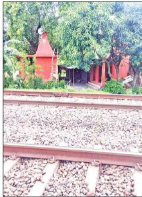
इसी मढ़ी पर आई थी महिला।