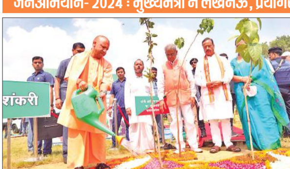
लखनऊ में कुकरेल नदी तट पर पौधरोपण महाअभियान की शुरुआत करते मुख्यमंत्री।

जनअभियान- 2024 : मुख्यमंत्री ने लखनऊ, प्रयागराज व गोरखपुर में रोपे पौधे