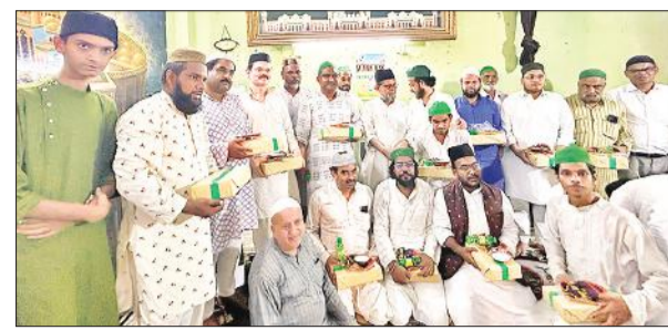
एवान-ए-नियोजिया में कार्यक्रम के दौरान मौजूद अकीदतमंद।