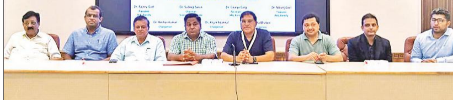
आईएमए की ओर से आयोजित विलनिकल बैठक में उपस्थित विशेषज्ञ।