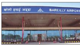
● शनिवार को एयरलाइंस टिकट बुकिंग में कुछ दिक्कतें आईं

यहां सप्ताह में चार दिन रविवार, मंगलवार, गुरुवार, शुक्रवार को मुम्बई और तीन दिन सोमवार, बुधवार और शनिवार को बरेली से बेंगलुरु की फ्लाइट है। शुक्रवार के दिन दोनों जगहों के लिए फ्लाइट है। दोपहर करीब 11.30 बजे सभी एयरलाइंस के बोर्डिंग पास काउंटर पर सर्वर डाउन हो गया था। इसके देखते हुए अधिकारी सजग हो गए। शेड्यूल टाइम इंडिगो की फ्लाइट 1.30 बजे आगमन और वापसी में बरेली एयरपोर्ट से 2.30 बजे उड़ान