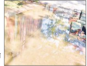
● अमृत विचार

बरेली, अमृत विचार : एक ओर जिले में मछर जनित रोग नियंत्रण अभियान चलाया जा रहा है तो दूसरी ओर मलेरिया विभाग की चौखट यानी कार्यालय के बाहर गंदे पानी में लार्वा पनप रहे हैं, लेकिन इस ओर अफसरों का ध्यान नहीं है, जबकि दवा घर घर जाकर लार्वा नष्ट करने का किया जा रहा है। जिला महिला अस्पताल परिसर में मलेरिया विभाग के कार्यालय में भीषण गंदगी पसरी हुई है। मुख्य द्वार पर गंदा पानी भरा है, जिसमें मछरों के लार्वा पनप रहे हैं। सुबह से लेकर शाम तक अधिकारी और कर्मचारियों का यहां आवागमन होता है, लेकिन किसी की नजर इस ओर नहीं जा रही है। एंटी लार्वा दवा के डिब्बों से उठ रही दुर्गंध : विभाग के कार्यालय में रखे एंटी लार्वा दवा से भरे डिब्बों से भीषण दुर्गंध उठ रही है। इससे वहां बैठने में कर्मचारियों को भी दिक्कत हो रही है, लेकिन अधिकारियों के डर से कर्मचारी खामोश हैं।