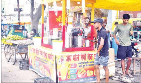
बरेली-बदायूं रोड पर दुकानों पर नहीं लिखे गए दुकानदारों के नाम।