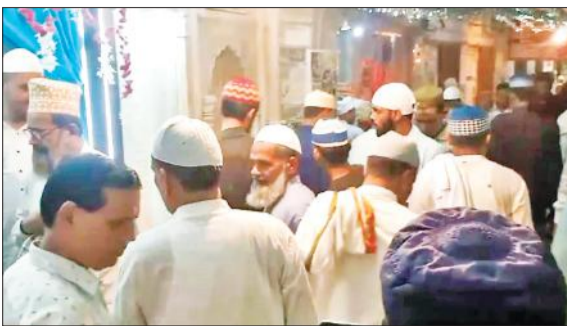
दरगाह आला हजरत पर उमड़ी जायरीन की भीड़।